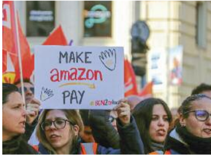
Treballadores d'Amazon durant la protesta.

Les organitzacions de treballadors, els quals estan en vaga des de l'1 de febrer, veuen el tancament de la planta vallesana com una voluntat de forçar els empleats a acollir-se a convenis de referència menys avançats fora de la província de Barcelona o a donar-se de baixa voluntàriament del lloc de feina, tenint en compte que la compa-