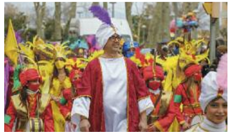
Hi haurà premis tant individuals com per a comparses.

En el cas de la categoria de comparses, tindrà dues subcategories: comparses petites, amb entre 3 i 15 membres, i comparses grans, amb entre 16 i 150 integrants. En totes dues subcategories hi haurà cinc grups premiats. Quant a les comparses petites, les tres primeres classificades rebran premis de 300, 150 i 120 euros. En canvi, per a les comparses grans, els tres primers premis seran de 450, 250 i 150 euros.