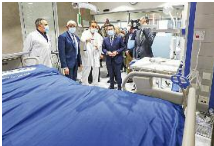
Balcells i Aragonès en la inauguració.