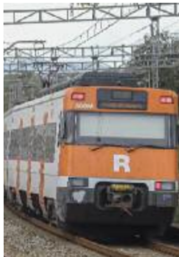
Un rodalies.

CALDES DE MONTBUI ▶ Ja està en marxa la 10a edició del Nervi Jove, el procés participatiu de Caldes de Montbui que permet als joves de la localitat decidir en què i com es gasta el pressupost municipal de Joventut. Enguany, es compta amb una quantitat de 6.000 euros i els joves que hi vulguin participar hauran de presentar les seves propostes al consistori per, posteriorment, votar-les.