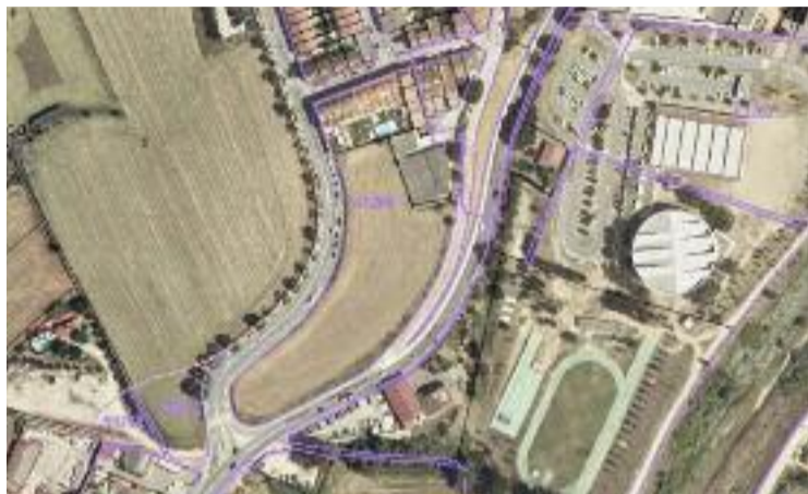
Aquest terreny es coneix com 'el plàtan' per la seva forma.