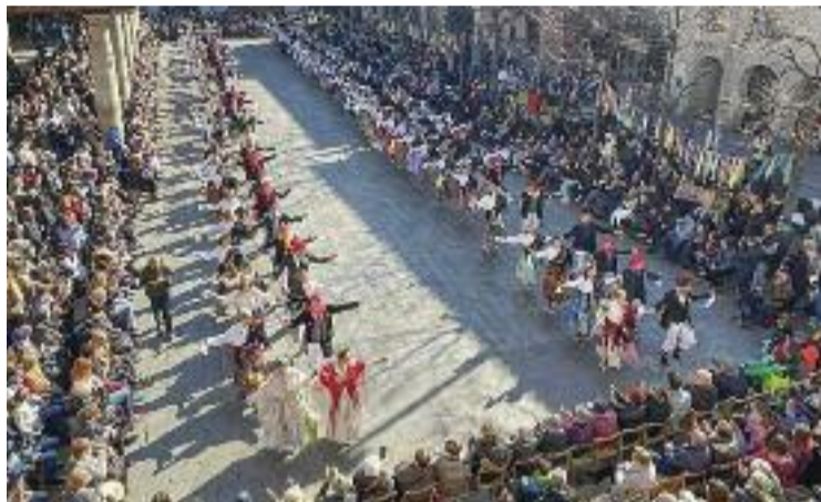
L'actuació va aplegar fins a 144 balladors i balladores.

En aquest sentit, Illa recorda que tot va començar el 2008 amb 12 parelles. "Aleshores, el que fèiem era un petit acte dins la festa de Carnestoltes", explica.