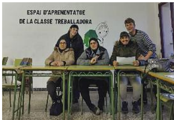
S'imparteixen classes de català i castellà.