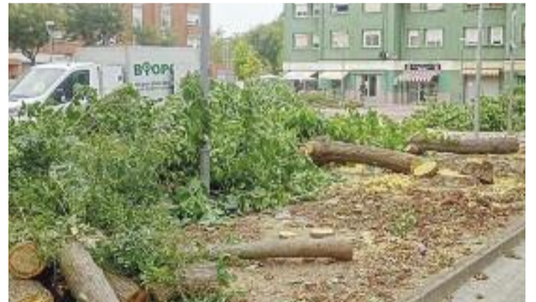
Imatge d'arxiu d'uns arbres talats.

"Ens vam adonar que passejar pel centre era un infern perquè no hi havia ni una ombra i ens vam posar en marxa per conscienciar de la falta de verd, de la necessitat de tenir més arbres i de la importància de no tallar els que estan sans, com s'ha estat fent darrerament", conclou Pagès.