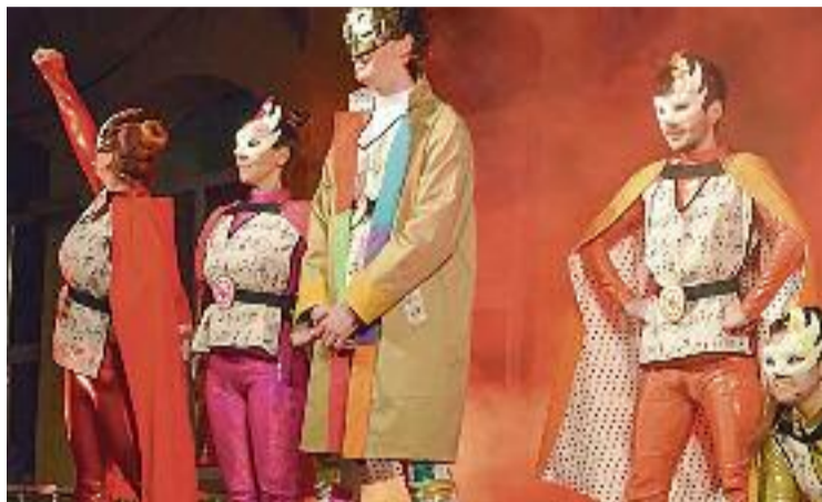
Carnestoltes apareix el 16 de febrer.

En aquest sentit, el carnaval de Montmeló, que va tenir el seu tret de sortida aquest dijous, i que s'allargarà fins dimarts que ve, ho té tot per convertir-se en una festa boja. Després d'anys, aquesta edició ha tornat sense restriccions. D'aquesta manera, demà dissabte se celebra la gran rua de Carnestoltes, durant la qual els carrers del municipi s'ompliran de disfresses. De forma individual, en parelles, en grups o en comparses, els mont-