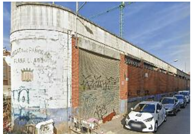
El mercat obria les portes l'any 1979.

Així ho ha decidit la Junta de Govern Local de l'Ajuntament, que ha concedit a la propietària de l'espai, la Corporació Alimentària Guissona, que a la vegada és propietària de la cadena de supermercats Bon Àrea, la llicència d'enderroc. Un pas que permetrà a l'empresa aixecar un nou establiment comercial que encara no s'ha concretat. De fet, des del consistori asseguren a Línia Vallès que en tractar-se d'un espai privat, no saben què s'hi farà.