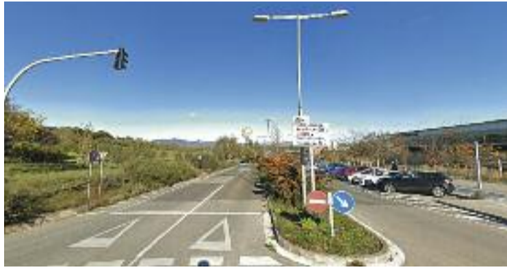
Els pisos es faran a davant l'Hospital.

“És una bona notícia per a la ciutat”, diuen des de l'Ajuntament a Línia Vallès . I és que, tal com expliquen, es tracta d'un “projecte històric que porta encallat massa temps i que sembla que per fi veurà la llum”. “A més, és una promoció que sempre s'ha volgut dirigir principalment a joves i gent gran”, afegeixen des del consistori. Per això, asseguren que “aquest projecte reforçarà la política d'ha-