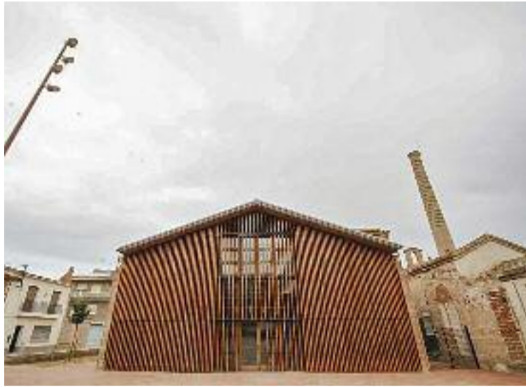
El nou museu, al complex del Vapor.

El projecte municipal que ha impulsat el nou museu ha in-