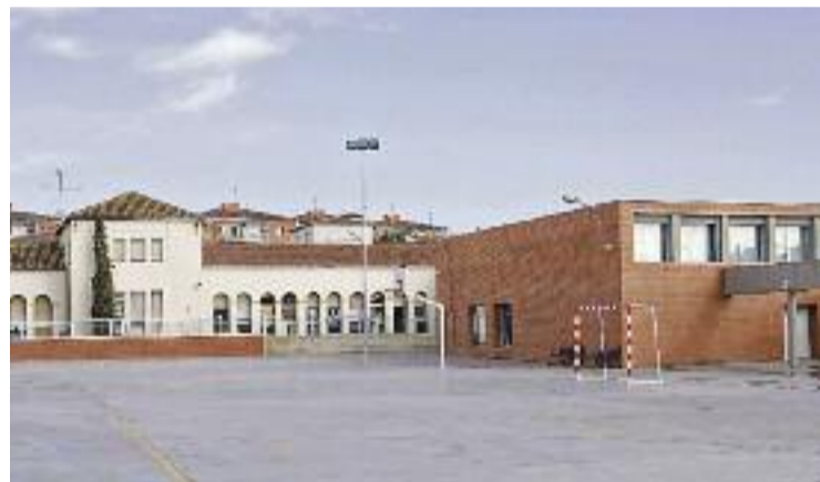
Imatge d'arxiu de l'Escola Pública Lluís Piquer.

fermar la seva voluntat de començar el curs que ve amb només un grup de P3 al Lluís Piquer per la previsió de baixada de la natalitat al municipi. De fet, la decisió ja estaria presa i enviada al Diari Oficial de la Generalitat de Catalunya (DOGC), segons informen des del consistori. Ara bé, durant la reunió, la Generalitat es va comprometre a garantir l'oferta pública al municipi i a reobrir la línia de P3 del Lluís Piquer en el cas que hi hagi una gran demanda a la resta d'escoles públiques de Parets.