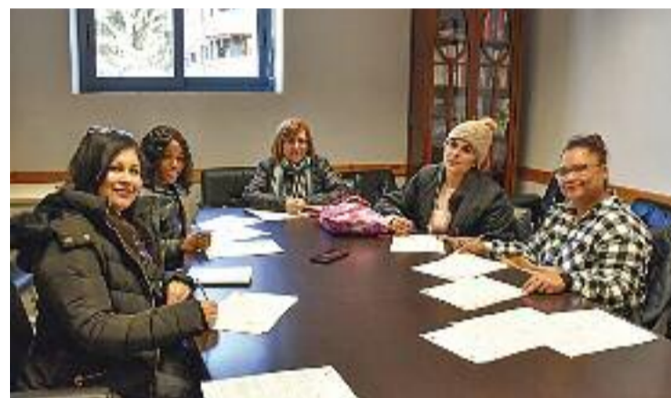
Participants del projecte de l'OPEC.

Dignifiquem les cures, donem valor a la vida. En la seva primera edició, aquesta iniciativa impulsada pel Departament d'Ocupació, Promoció Econòmica i Comerç (OPEC) de l'Ajuntament del municipi vallesà, donarà formació en atenció a persones en institucions sanitàries a aquestes 10 veïnes montornesenques. Serà un curs de 450 hores teòriques i pràctiques que els permetrà obtenir el Certificat de professionalitat de nivell 2 d'atenció a les persones en institucions sanitàries.