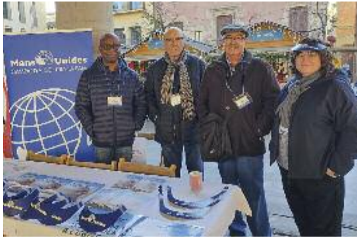
Imatge d'arxiu dels membres de l'organització comarcal.

Així doncs, per complir aquest objectiu, ajudaran unes 1.700 persones durant els pròxims dos anys, treballant en grans tres línies: la formació dels agricultors, als quals se'ls ensenyaran noves tècniques per millorar els resultats en collites i a aconseguir millors