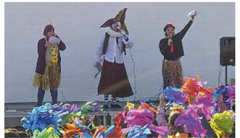
Visita del Rei Carnestoltes a les escoles del poble: Foto: Aj. de Sant Fost

Per acabar, a partir de dos quarts de dues de la nit, i fins a les quatre, tindrà lloc la festa jove, d'entrada lliure i aforament limitat, també al pavelló, on actuaran Adrian DJ i DJ Mantís. El servei de bar i del sopar anirà a càrrec de les colles de Sant Fost.