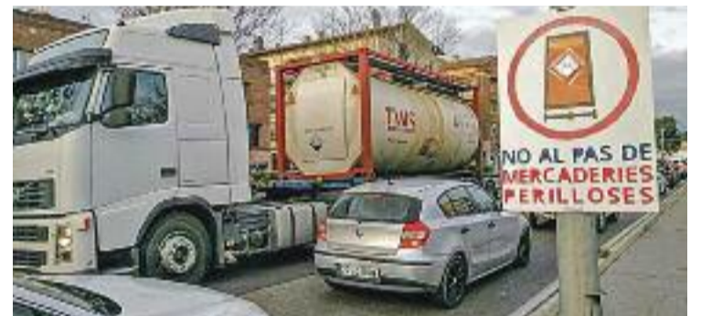
Imatge d'un camió pel tram urbà de la Ronda.

MOBILITAT ▶ Els camions pesants de més de 7,5 tones hauran de deixar de circular pel tram urbà de la Ronda Sud de Granollers. En concret, al tram que va del pont sobre el riu Congost, a l'entrada oest del municipi, fins a la rotonda del carrer Esteve Terrades, a l'entrada est.