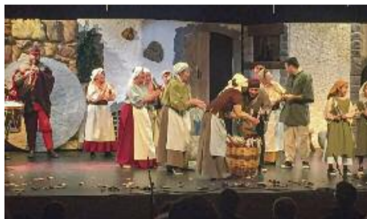
L'obra va tenir una presència destacada de dones.

Durant quatre mesos, l'entitat La Remença ha treballat de valent per pujar l'obra a l'escenari. El repte no era menor, ja que Les Pastoretes , a més d'augmentar la presència de dones, també ha volgut incloure el màxim d'actors i actrius infantils i joves per, d'aquesta manera, crear pedrera de cara al futur.