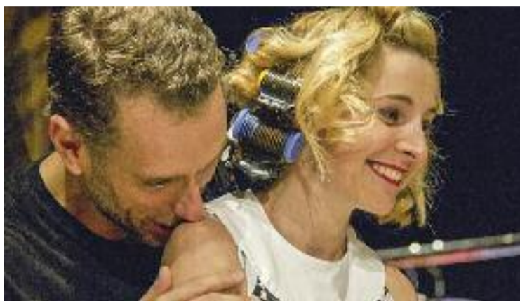
'You Say Tomato' donarà el tret de sortida a la mostra.

L'altra comèdia professional programada tindrà lloc el 5