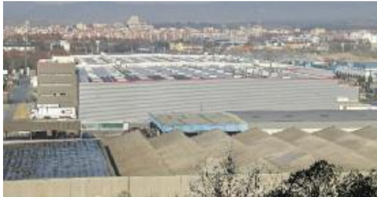
Vista de la nau que Amazon té a Martorelles.

Ara cal saber com ha plantejat l'empresa l'expedient de tancament i en quines condicions vol traslladar els treballadors a uns altres centres del gegant del comerç online . Uns empleats que es van reunir dimarts amb representants del departament d'Empresa i Treball de la Generalitat, el Servei d'Ocupació de