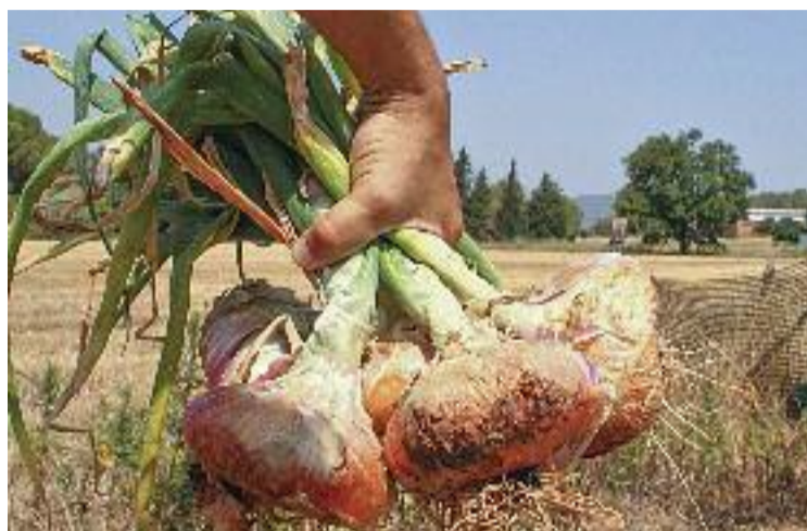
Varietat local de ceba agra.

Varietats de mongeta, tomàquet, carabassa, meló, pastanaga, ceba o encima són algunes de les moltes llavors que es poden trobar al Banc, que té la seva seu al mateix Museu. “De fet, en tenim més de 300”, detalla el coordinador, que a la vegada explica que una altra de les tasques que fan és oferir aquestes llavors i fer assessorament de com cultivar-les.