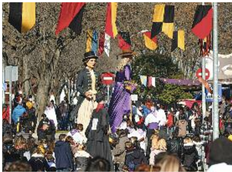
Imatge de la Festa Major d'Hivern de l'any passat.

A partir de demà començarà el gran gruix d'activitats. El matí comptarà amb el Ral-li Fotogràfic, la tronada d'inici de festa, el pilar dels Manyacs, la Trobada de Bestiari Diables i la gran novetat d'enguany: el concurs de cuina de la mongeta paretana, que es farà en el marc de la calçotada popular. Mentre que a la tarda se ce-