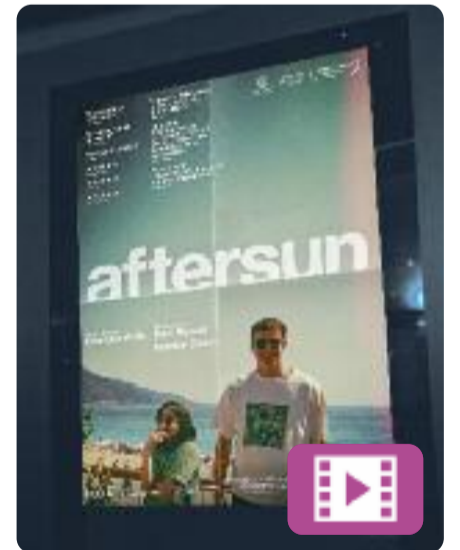
Aftersun Charlotte Wells

La Sophie reflexiona sobre l'alegria compartida i la melangia privada d'unes vacances que va fer amb el seu pare vint anys enrere. Els records reals i imaginaris omplen els espais entre les imatges mentre intenta reconciliar el pare que va conèixer amb l'home que no va conèixer. Aquesta pel·lícula de Charlotte Wells és considerada per alguns com la millor del 2022.