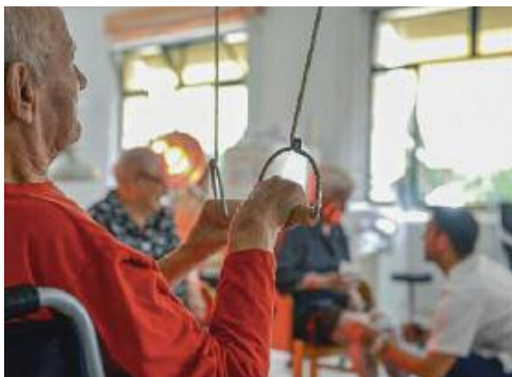
Només un 4% de les places de residències són públiques.

És per aquest motiu que hi ha moltes famílies i sobretot moltes dones que han d'encarregar-se d'aquesta tasca de cures. És aquí on s'emmarca el projecte gestionat i coordinat per l'Àrea d'Acció Social i Gent Gran de l'Ajuntament de Montmeló, amb el suport de la Diputació de Barcelona. Es tracta d'un Grup de Suport i Ajuda Mútua (GSAM) que s'encarrega de reunir cuidadors i cuidadores no professionals de persones que es troben en situació de dependència per donar-los eines per poder fer aquesta tasca amb el màxim de benestar emocional possible.