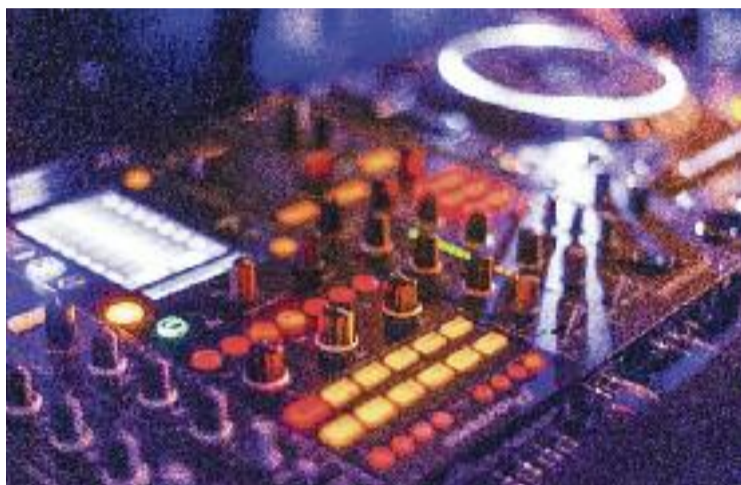
Serà un festival de música electrònica, techno i house.