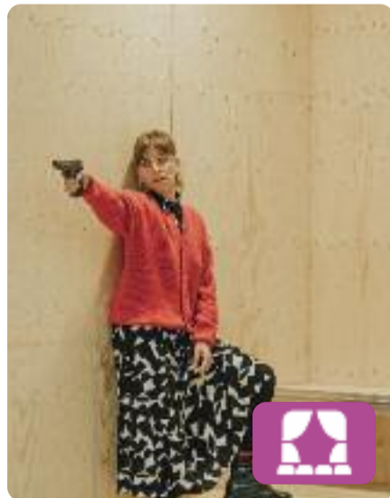
Hedda Gabler Hedda Gabler