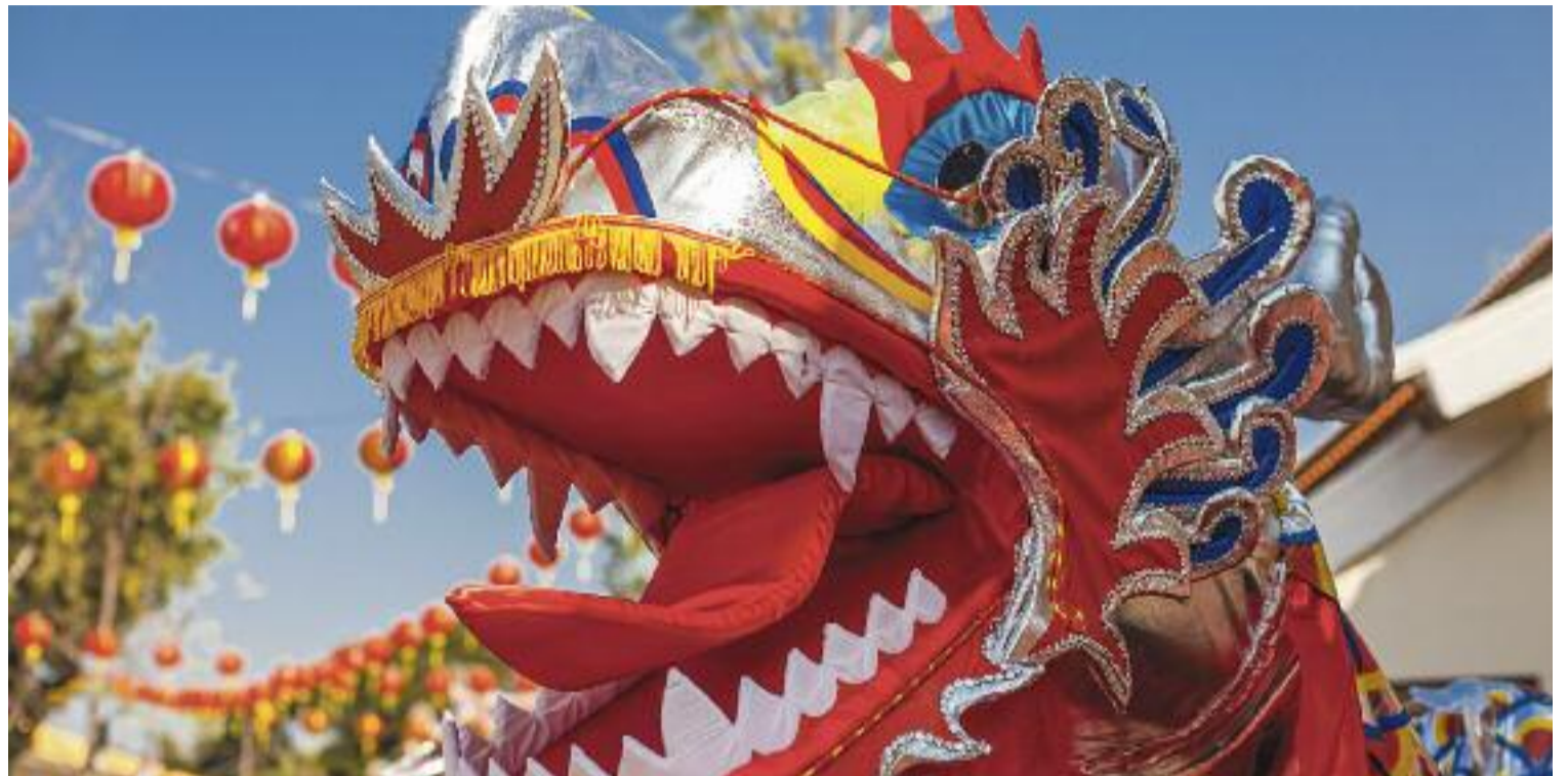
Els dracs són un dels elements més típics de l'Any Nou xinès, ja que es creu que els seus balls ajuden a espantar els mals esperits.

A la Xina, l'Any Nou és la festa més important del calendari, i per això la celebren durant quinze dies al llarg dels quals els carrers s'omplen de desfilades, focs