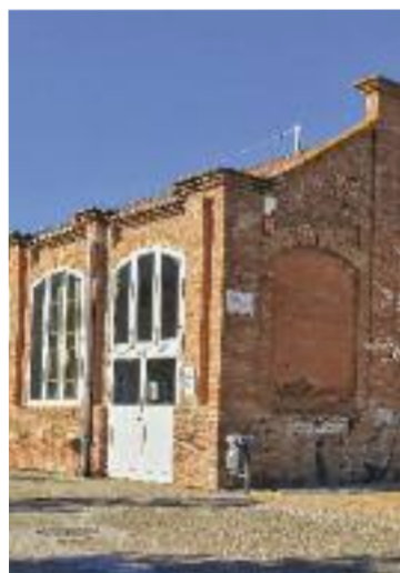
Tèxtil Rase.

LES FRANQUESES ▶ Una operació conjunta de la Policia Local de les Franqueses i dels Mossos d’Esquadra ha localitzat i desmantellat una plantació de marihuana en un habitatge de Llerona, amb 1.382 plantes. Segons informen des de l’Ajuntament, durant l’operació també s’han detingut dues persones que han estat acusades d’un delicte contra la salut pública i que han passat a disposició judicial.