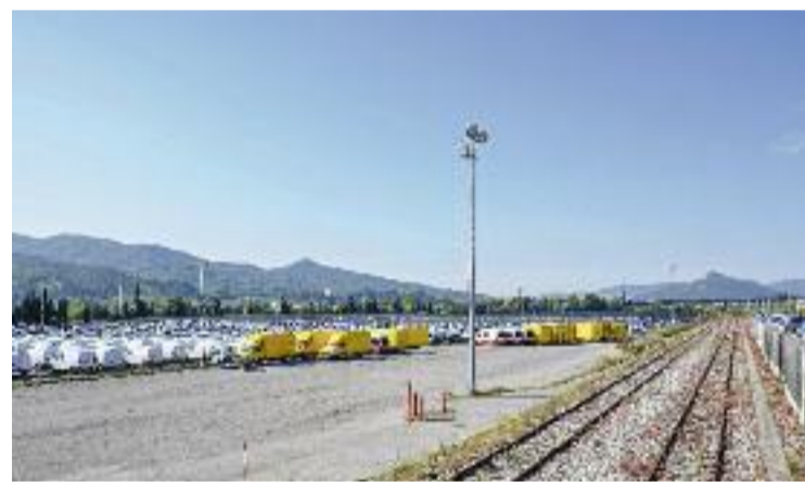
La nova terminal de transport de mercaderies fa un pas endavant.

Cal recordar que les obres de la futura estació intermodal de mercaderies de la Llagosta van començar el passat mes d'octubre. La durada prevista d'aquests treballs, que tenen un cost d'uns seixanta milions d'euros, és de més de dos anys. L'objectiu d'Adif és convertir aquesta infraestructura llagostenca en un "enclavament estratègic al nord de Barcelona".