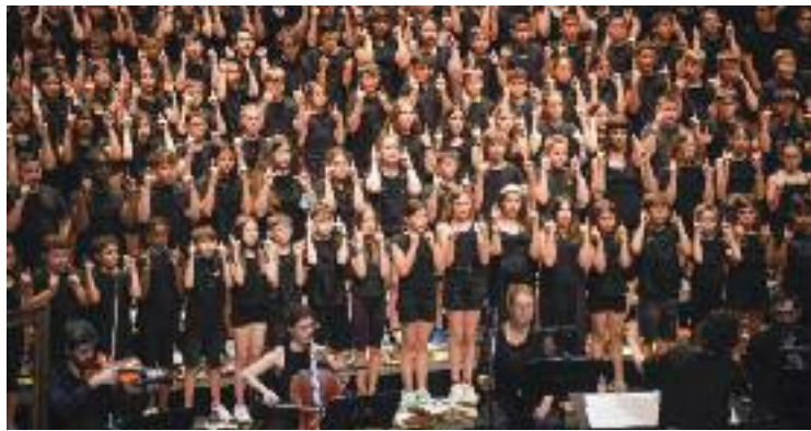
L'associació treballa per unir la cultura i l'educació.

Ara bé, en els darrers anys, l'associació, s'ha centrat, sobretot, a "vincular l'oferta cultural a l'e-