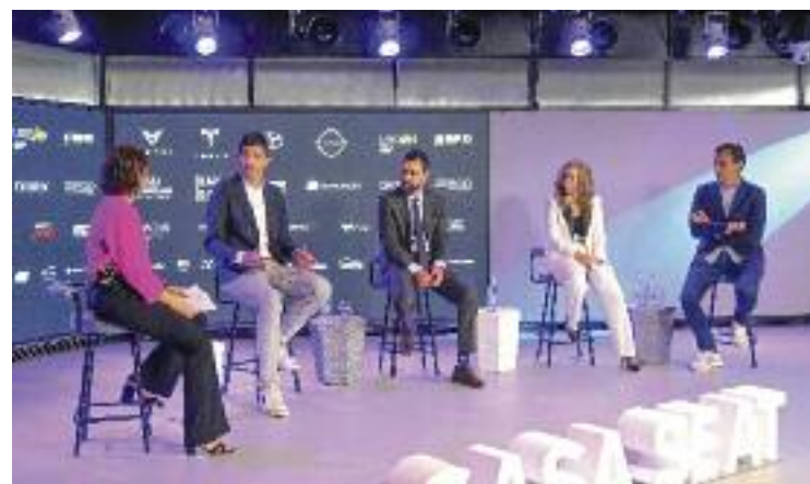
Presentació de l'e-Mobility Experience.

"La indústria de l'automoció ha estat clau al nostre país durant el segle XX i explica bona part del nostre PIB, de la generació de riquesa i de llocs de treball, i volem que això continuï", va sentenciar Torrent.