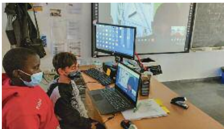
Dos nens de l'escola en una classe.