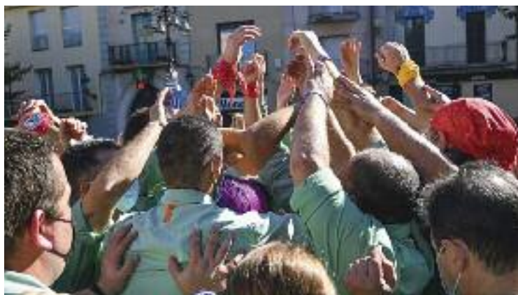
Imatge de la 29a Diada.

En aquest sentit, tan sols un mes després de fer història al Concurs de Castells de Tarragona, els de verd claret portaran castells "d'alta gamma" a la Diada, com el 3 de 7 i el 4 de 7 amb agulla i "potser el 5 de 7", avança la vicepresidenta. Tot plegat en una actuació que es farà diumenge a les 12 a la plaça Prat de la Riba i on els molletans estaran acompanyats de la Colla Castellera Jove de Barcelona i dels Castellers de Caldes.