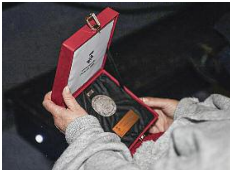
Les medalles s'entregaran al gener.

En aquest sentit, els guardons per a les trajectòries personals i professionals s'entregaran a títol pòstum i seran per a Mingote, per la seva "destacada tasca com a alpinista i com a exalcalde del municipi", i per a Mulà, per la seva "contribució a