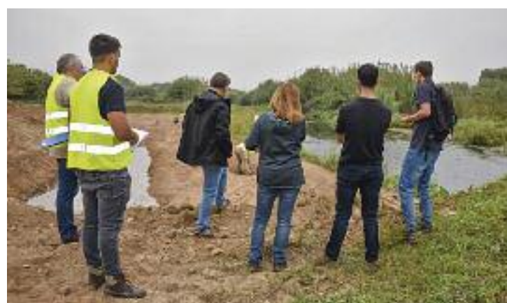
Les tasques de recuperació ja estan en marxa.

Amb tot, es busca recuperar la biodiversitat pròpia d'aquest entorn i, especialment, recuperar i preservar la presència de llúdrigues al riu Besòs.