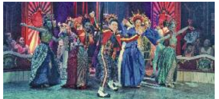
Aquesta tarda presentaran el nou espectacle.

CIRC ▶ Després de tres anys, el Circ Raluy Legacy torna a Granollers. En concret, al Parc Firal, on presentaran aquesta mateixa tarda el seu darrer espectacle titulat In Art we trust . Un show que descriuen com "la producció més sorprenent i arriscada que hem creat fins al dia d'avui" i que estarà a la capital vallesana fins diumenge que ve.