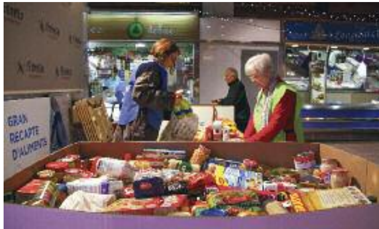
Imatge d'arxiu del Gran Recapte.

"En la darrera edició, per exemple, al Mercadona de Parets es van recollir 14 banyeres d'aliments de 500 quilos cada una", explica Hidalgo. "Però enguany