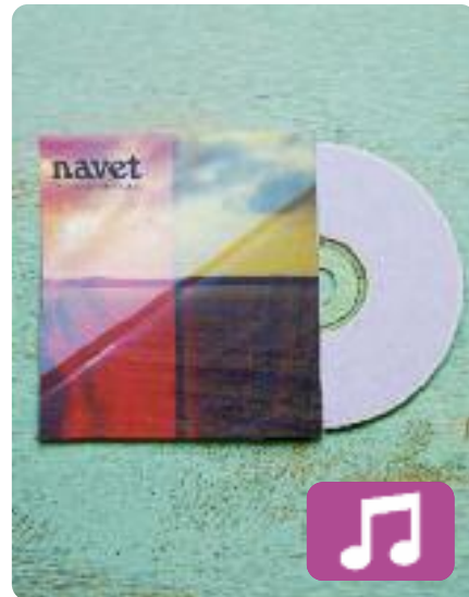
Tot el que no sé de nosaltres Navet

Tot el que no sé de nosaltres (Kasba Music, 2022) és el títol del primer disc de Navet, el nou grup format pels components de The Pinker Tones. L'àlbum inclou vuit cançons, totes elles en català, i barreja tres estils: pop, rock i folk. Segons la discogràfica, la nova formació "és delicadesa, dedicació, emoció i moltes coses més, però per sobre de tot Navet és música".