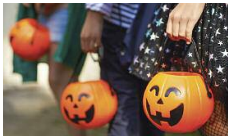
Els comerços donaran caramels als nens que es disfressin.

Un conjunt de propostes que se sumen a la iniciativa que diumenge tirarà endavant l'Ajuntament, anomenada 'Laminadura o Entremaliadura', en la qual una vintena de comerços, que estaran decorats amb ambientació relacionada amb Halloween o la Castanyada, donaran caramels i lliminadures a tots els nens i nenes del municipi que vagin disfressats.