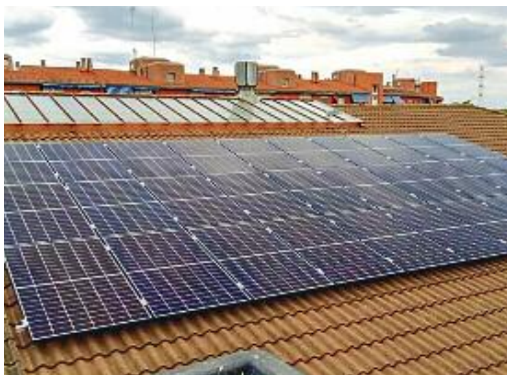
Instal·lació fotovoltaica de l'Escola Bernat de Mogoda.

També va estar present en aquesta trobada el director del