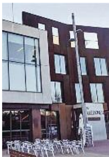
Bar del Lledoner.

Tot plegat, per fer d'aquesta 30a Diada una jornada històrica i "rodona" que comptarà "amb moltes mans i moltes camises, imprescindibles per tirar endavant els castells que estem fent, que per a nosaltres són un sostre", conclou la vicepresidenta.