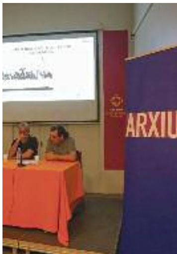
Presentació d'Espartacus.

En aquest sentit, l'Arxiu ha titulat aquesta col·lecció amb el nom Espartacus i inclou el testimoni de granollerins que havien estat vinculats a la CNT i al POUM, que havien integrat la Columna del Vallès per combatre el franquisme i que també havien format part de partits antifranquistes. Tots ells, enemics del règim que, des de la clandestinitat, van treballar per acabar amb la dictadura.