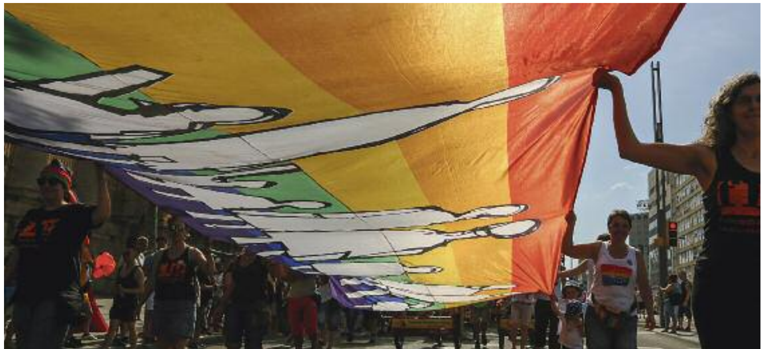
El col·lectiu LGTBI no és ben vist, en línies generals, per les institucions religioses.

Malgrat els aires d'obertura, l'actitud de les institucions religioses no deixa gaires dubtes. “Hi ha casos de monitors que han estat