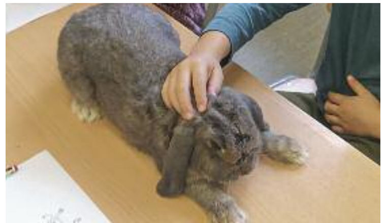
Als tallers s'han pogut tocar animals.

El mes vinent, a més, aquests tallers se celebraran a l'escola Joaquim Abril, també adreçats a infants de Primària.