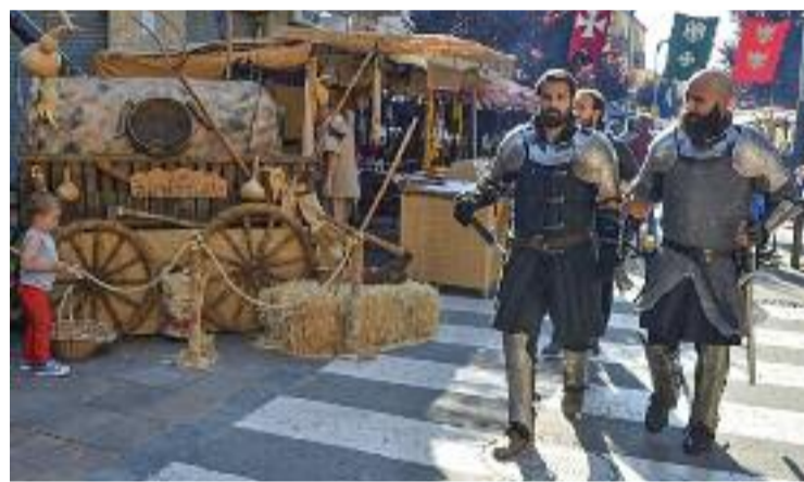
El mercat medieval, organitzat per la Unió de Botiguers.

tre del mercat medieval organitzat per la Unió de Botiguers del municipi. Així, a més de la decoració ambientada en l'època feudal, els montornesencs podran gaudir de parades amb productes artesanals i activitats per a tots els públics. Els infants podran passar-ho d'allò més bé amb els espectacles d'animació de carrer, dansa i foc, a càrrec de Tribal & Flames. Alhora, el grup Trobar de Morte farà un concert de música folk medieval el dissabte a les deu de la nit a la plaça Pau Picasso.