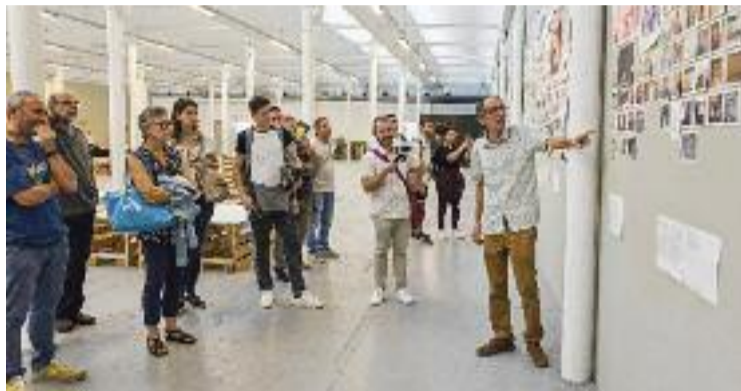
Imatge d'arxiu d'una edició anterior.

En aquest sentit, el festival oferirà 19 exposicions entre les dues ciutats. Ara bé, enguany ampliant espais a ambdós municipis, ja que, tot i que a Gra-