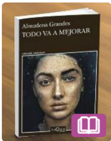
Todo va a mejorar Almudena Grandes

Almudena Grandes va morir el novembre de 202 sense haver pogut acabar la seva última novel·la, Todo va a mejorar , però va deixar unes indicacions al seu marit, el poeta Luis García Montero, perquè l'acabés. I així ha estat: aquest octubre ha vist la llum la darrera obra de Grandes, un llibre escrit durant la pandèmia que planteja un futur distòpic.