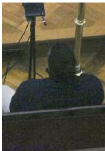
Parella de Roca.

Tot plegat, juntament amb el pagament d'una indemnització per al fill, menor d'edat, de 300.000 euros, una altra per a la mare de la víctima de 120.000 euros més 3.850 en concepte de despeses funeràries i una última de 50.000 euros per a cadascun dels dos germans.