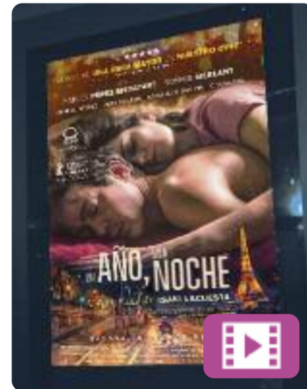
Un año, una noche Isaki Lacuesta

En Ramón i la Céline, una jove parella, es troben a la sala parisenca Bataclan la fatídica nit del 13 de novembre de 2015. Durant l'atemptat terrorista, tots dos aconsegueixen refugiar-se als camerinos, però en sortir d'allà mai tornaran a ser els mateixos. Es tracta d'una adaptació del llibre Paz, amor y Death metal de Ramón González, supervivent de l'atac a París.