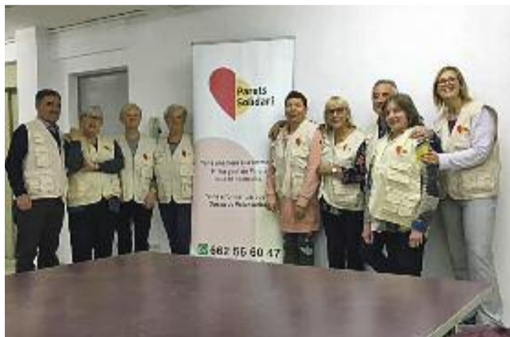
Membres de Parets Solidari.