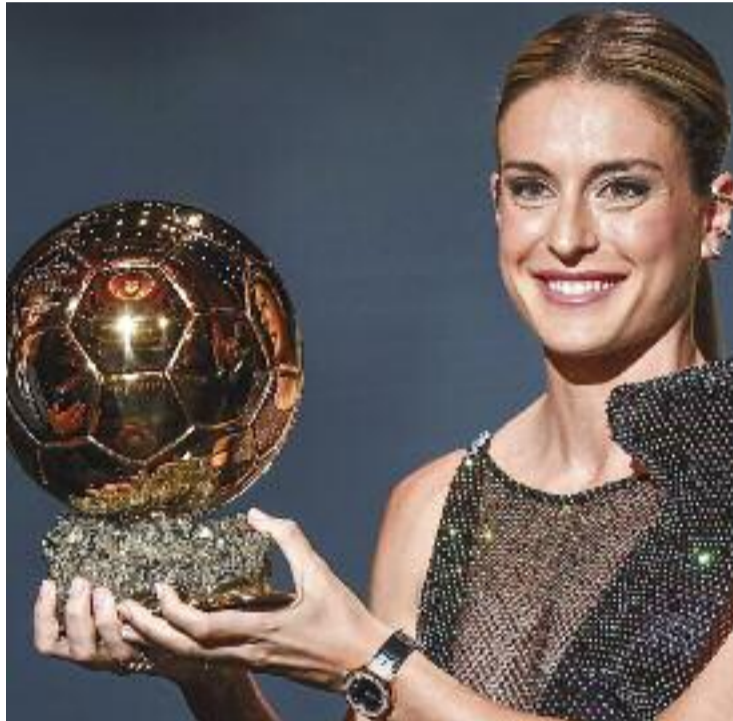
Alèxia Putellas amb la seva segona Pilota d'Or.

Fa més de tres mesos, des del 5 de juliol, el dia abans de l'inici de l'Eurocopa d'Anglaterra que tant havia somiat jugar, que la molletana es troba en dol. Va passar d'una il·lusió indescriptible a un buit dramàtic: ruptura del lligament encreuat anterior [del genoll esquerre]. "Són coses que succeeixen, però que crec que amb una segona Pilota d'Or es digereixen millor", contestava, ja més tranquil·la, una estona després al Twitch d'Ibai Llanos. Per molt que es mori per tornar, la capitana del Barça no es planteja complir cap termini concret per fer-ho. Escoltarà el seu genoll i només farà el pas quan pugui reparèixer "a un nivell al qual estava oferint abans". Així que la seva meta diària ha estat,