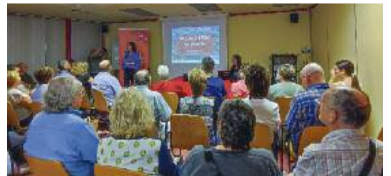
Moment de l'acte, a l'Ateneu Gran.

POLÍTICA ▶ L'Ajuntament ha tirat endavant un nou procés participatiu, sota el nom Tria les teves prioritats . Una iniciativa on els veïns hauran de votar tres dels dotze punts proposats que sorgeixen del procés participatiu 'Mollet, el teu barri', que justament ara ha acabat i que ha recollit més de 600 idees ciutadanes per millorar Mollet.