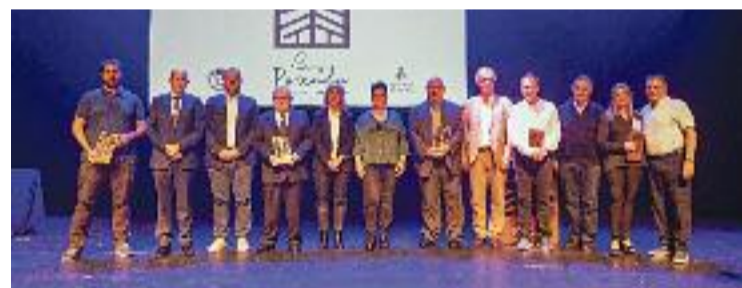
Imatge de la gala, amb els comerços centenaris.

COMERÇ ▶ Si alguna cosa caracteritza el comerç de Granollers és l'àmplia varietat d'establiments amb què compta: locals de més de cent anys d'història, negocis més recents, especialitzats en un sol producte... Però, sigui com sigui, tots ells van ser reconeguts a la gala dels Premis Porxada, que se celebrava divendres a l'Auditori.