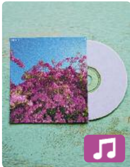
;) ' Pau Vallvé

21 d'octubre: aquesta és la data d'estrena del disc "més positiu, rítmic i de bon rotllo" que ha fet mai Pau Vallvé, segons ell mateix explica al seu web. Sota el curiós títol ;) , Vallvé assegura que el nou àlbum "posa les cures a davant de tot". El cantautor recorda que, com sempre, es tracta d'un disc "autogestionat, autoeditat i sense finançament de cap empresa".