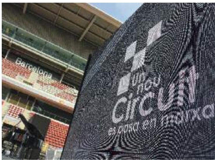
El Circuit busca renovar-se.

"Hem fet un Pla Estratègic que ens permeti ser líders en sostenibilitat, incrementar els ingressos, ajudar la indústria del país, que s'obri més a la ciutadania i que pugui connectar-se d'una manera nova i diferent del conjunt de Catalunya", va explicar Torrent. Així mateix, el conseller va assegurar que el circuit continuarà sent "escenari de competicions esportives" i va dir que això es garantirà amb "la renovació de la Fórmula 1 i el MotoGP fins al 2026 malgrat la competició amb moltes altres ciutats". "A més, volem