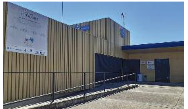
El centre ha atès més de 200 persones des del 2020.

Cal destacar que, pel que fa al Programa Atenea, hi ha prevista una ajuda inicial de 300 euros per a les dones que hi entrin. Per altra banda, la Serradora tornarà a acollir el programa Singulars, que ajuda a trobar feina a joves d'entre 16 i 29 anys.