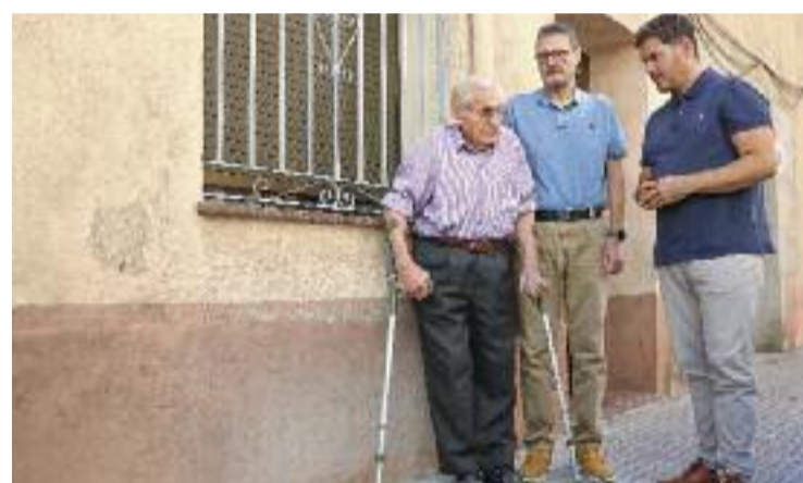
L'alcalde Sierra amb dos familiars dels veïns represaliats.

La col·locació de les plaques va estar emmarcada en la commemoració del Dia en memòria de les víctimes de la Guerra Civil i el franquisme, que és el 15 d'octubre. L'Ajuntament té previst homenatjar en els pròxims anys altres veïns que també van ser represaliats pel règim de Franco.