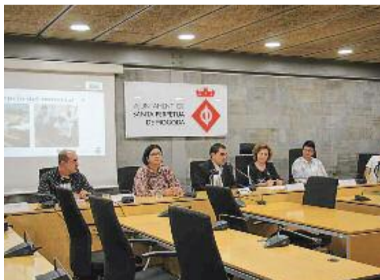
L'acte de presentació del projecte solidari amb Cuba.

El vicecònsol de Cuba es va mostrar agraït i satisfet pel desenvolupament del projecte, ja