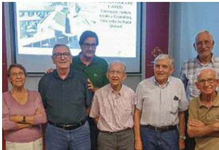
Participants de la tertúlia de l'Arxiu.