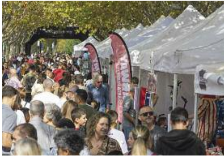
La Fira de Comerç Local, diumenge.

El teixit associatiu perpetuenc feia quatre anys que no celebrava la Mostra d'Entitats, una activitat biennal organitzada per la Regidoria de Participació i Acció Veïnal. Aquest any, com a novetat, hi van prendre part per primera vegada associacions esportives, que es van sumar a entitats locals de tots els àmbits, entre les quals n'hi havia algunes de nova creació. A més d'explicar què són i què fan, diverses entitats van aprofitar l'escenari instal·lat a la zona de la mostra per oferir exhibicions.