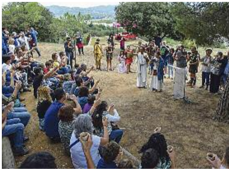
L'aniversari va congregar un centenar de persones.

MONTMELÓ/MONTORNÈS ▶ Una de les joies culturals de Montmeló i Montornès està d'enhorabona. El jaciment arqueològic Mons Observans ha complert 10 anys des de la seva posada en marxa i, per aquest motiu, diumenge passat alguns veïns, representants d'institucions i professionals de l'arqueologia es van aplegar a l'assentament romà per celebrar l'efemèride. La trobada va incloure visites teatralitzades, un espectacle sobre legionaris romans, parlaments i un brindis, va agrupar un centenar de persones.