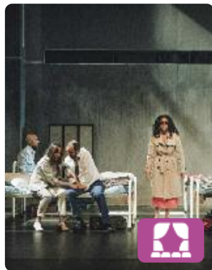
Assaig sobre la ceguesa José Saramago

En el centenari del naixement de José Saramago, Premi Nobel de Literatura del 1998, Nuno Cardoso dirigeix aquesta oportuna adaptació d'un dels seus llibres més coneguts; una crítica a una societat podrida i profundament egoista en què una plaga de ceguesa inexplicable i incurable s'estén per tot el món.