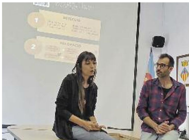
La Mancomunitat es va reunir a Vallromanes.

El document resultant ha estat fruit d'un any de reunions i propostes de diversos professionals per detectar i minimitzar possibles problemàtiques derivades de l'ús impulsiu de les noves tecnologies o de substàncies estupefaents. I és que hi ha factors de risc, tant personals com socials, que poden afavorir l'aparició d'addiccions en aquest sentit. Per aquesta raó, des dels municipis que formen part de la iniciativa destaquen la importància d'aquest protocol, que