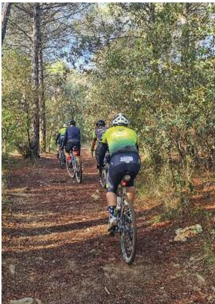
La Unió Ciclista les Franqueses és molt activa.

celebrar el primer Mundial a Veneto (Itàlia), amb la francesa Pauline Ferrand-Prevot i el belga Gianni Vermeersch com a primers campions. De fet, la Unió Ciclista Internacional (UCI) ja ha anunciat les seues dels cinc pròxims Mundials: el 2023 tornarà a Itàlia (resta saber a quina ciutat), el 2024 serà a Flemish Brabant (Bèlgica), el 2025 a Niça (França), el 2026 a Nannup (Austràlia) i el 2027 a Haute Savoie (França).