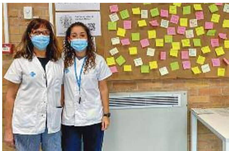
Els CAP de la comarca faran tallers de salut mental durant tot el mes.

Segons expliquen des de l'Atenció Primària Metropolitana Nord, "professionals en Salut Comunitària han detectat, segons resultats de Plans de Salut locals i els mateixos diagnòstics a consulta,