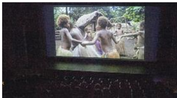
Imatge d'arxiu d'una edició anterior del cicle de cinema.

Dos films que es complementaran amb l'exposició fotogràfica 15 anys acollint i compartint , que es podrà veure a partir de demà i fins a l'1 de novembre i que mostrarà imatges de diferents activitats programades pel Servei d'Acollida al llarg dels darrers quinze anys.