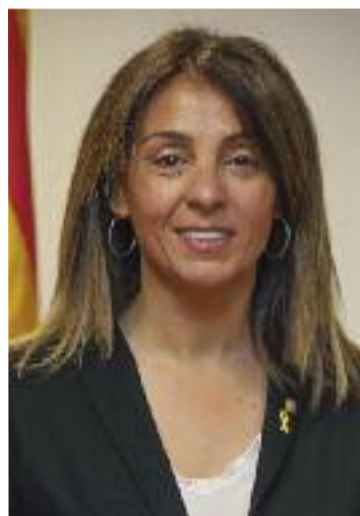
Meritxell Budó.

BIGUES I RIELLS ▶ Torna a ser temps de Corretapes a Bigues i Riells del Fai. I és que durant els dos pròxims caps de setmana es podran degustar tapes amb una beguda, per 3,50 euros. Tot plegat de la mà de nou establiments locals que participaran i lluitaran per emportar-se el premi a la millor tapa. Ara bé, també hi haurà premi per als participants, entre els quals se sortejarà un àpat.