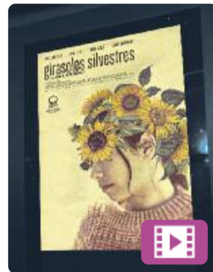
Girasoles silvestres Jaime Rosales

La Julia, una jove de 22 anys i mare de dos nens, s'enamora de l'Oscar, un noi conflictiu, i tots dos comencen una relació. A mesura que passen temps junts, ella començarà a plantejar-se si ell és la persona que realment necessita al seu costat, cosa que la portarà a emprendre un viatge personal a la recerca de la seva felicitat i la de la seva família.