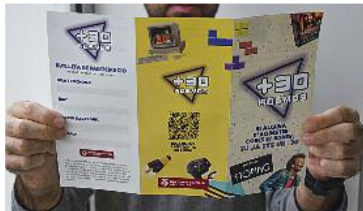
Els majors de 30 anys ja poden presentar propostes.

amb la qual vol dinamitzar la vida comunitària i fer que els majors de 30 anys se sentin participants del dia a dia municipal. Per això, l'Ajuntament destinarà 20.000 euros que aniran a parar a aquells projectes presentats per joves que superen la trentena i que, en una assemblea que se celebrarà el pròxim 12 de novembre a partir de les set de la tarda a la Sala Gran del Teatre Margarida Xirgu, rebin més suport. Fins aleshores, el consistori ha creat una bústia amb la informació i la papereta de participació.