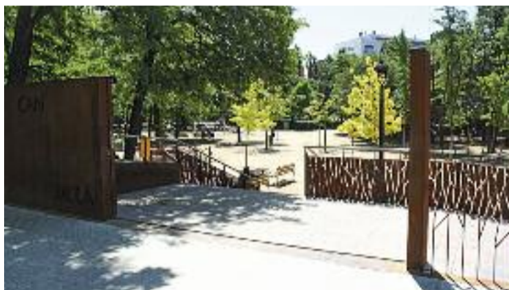
Can Mulà va ser el primer parc públic de Mollet.

Tot i que el parc, en aquest temps, ha anat evolucionant, millorant i adaptant-se a les necessitats dels molletans, incorporant més espais de joc, col·locant tanques i pavimentant diferents punts, el que realment caracteritza Can Mulà és la quantitat d'arbrat i espais verds que s'han conservat de l'antiga masia. Per exemple, l'alineació de til·lers que envoltaven el camí de la casa, que actualment és la biblioteca municipal, i que fan del parc "una autèntica illa de natura enmig de la ciutat", diuen des de l'Ajuntament.