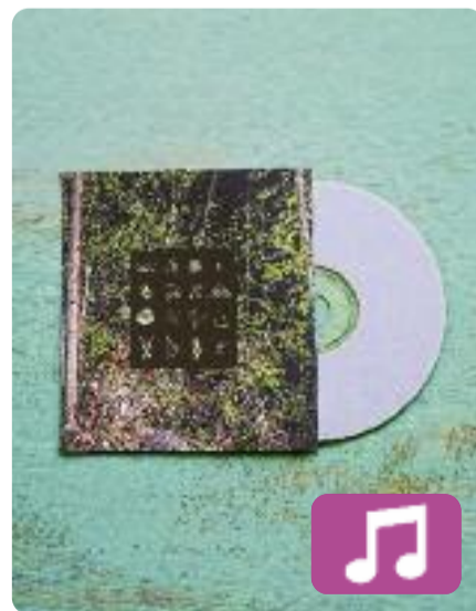
Mont Cau Arnau Obiols

El compositor Arnau Obiols acaba de presentar el seu quart disc, Mont Cau (Microscopi). L'àlbum està format per dotze cançons que tenen com a fil conductor "el respecte a l'entorn natural", tal com ha dit ell mateix en declaracions a l'ACN. Per ara només està disponible en vinil i en digital a Bandcamp, però el dia 27 arribarà a Spotify i a les altres plataformes digitals.