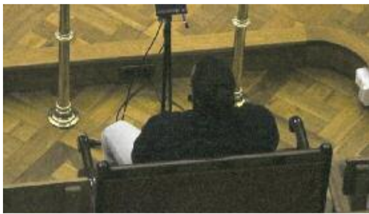
Joel R. P. A. al judici, a l'Audiència de Barcelona.

En aquest sentit, la fiscalia ha mantingut la petició de 26 anys de presó i els més de 500.000 euros d'indemnització que haurà de pagar als familiars de la víctima. Tot plegat, mentre l'home també ha acabat acusat de maltractament habitual, ja que, després de