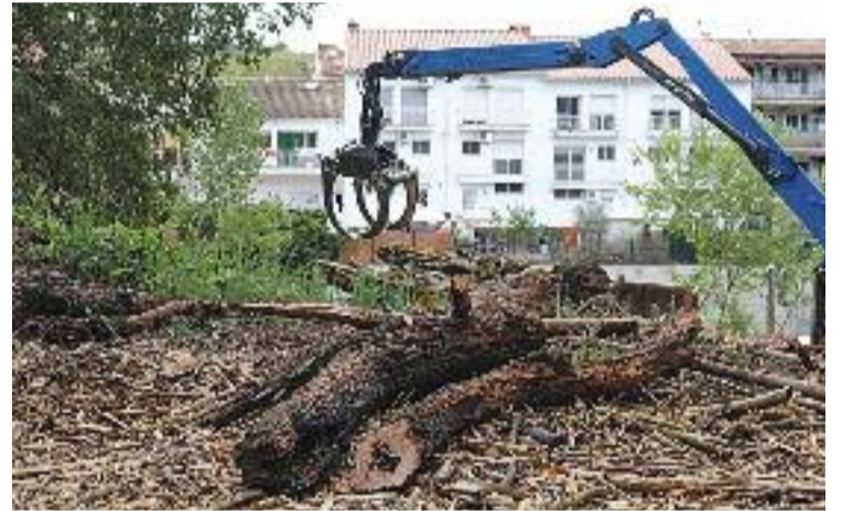
Una imatge de la neteja de l'espai.

Sigui com sigui, la voluntat municipal és que aquesta neteja s'allargui a tot el camí fins al safareig i la font de Can Camp. A més, està previst que en el futur es programin més accions per esbandir el terreny, emmarcades en el programa Let's clean up de l'Ajuntament.