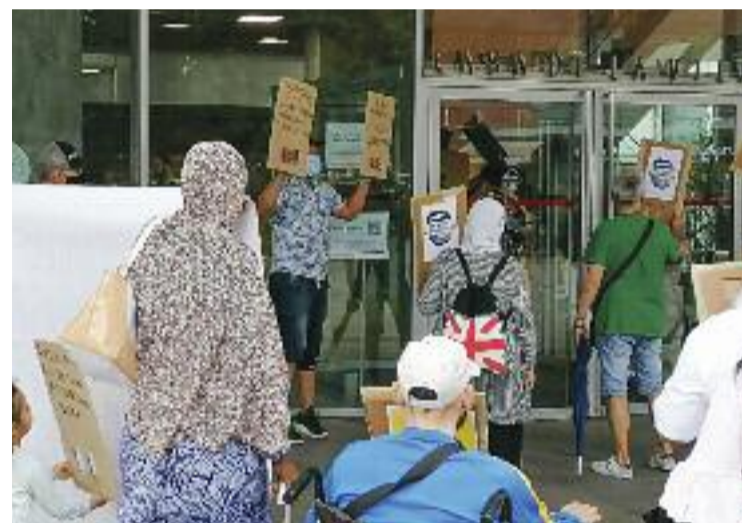
La PAH ha posat 30 denúncies a “fons voltors”.