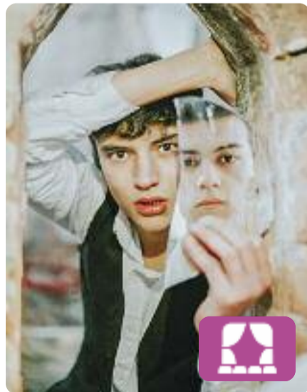
Quanta, quanta guerra... Farrés Brothers i cia