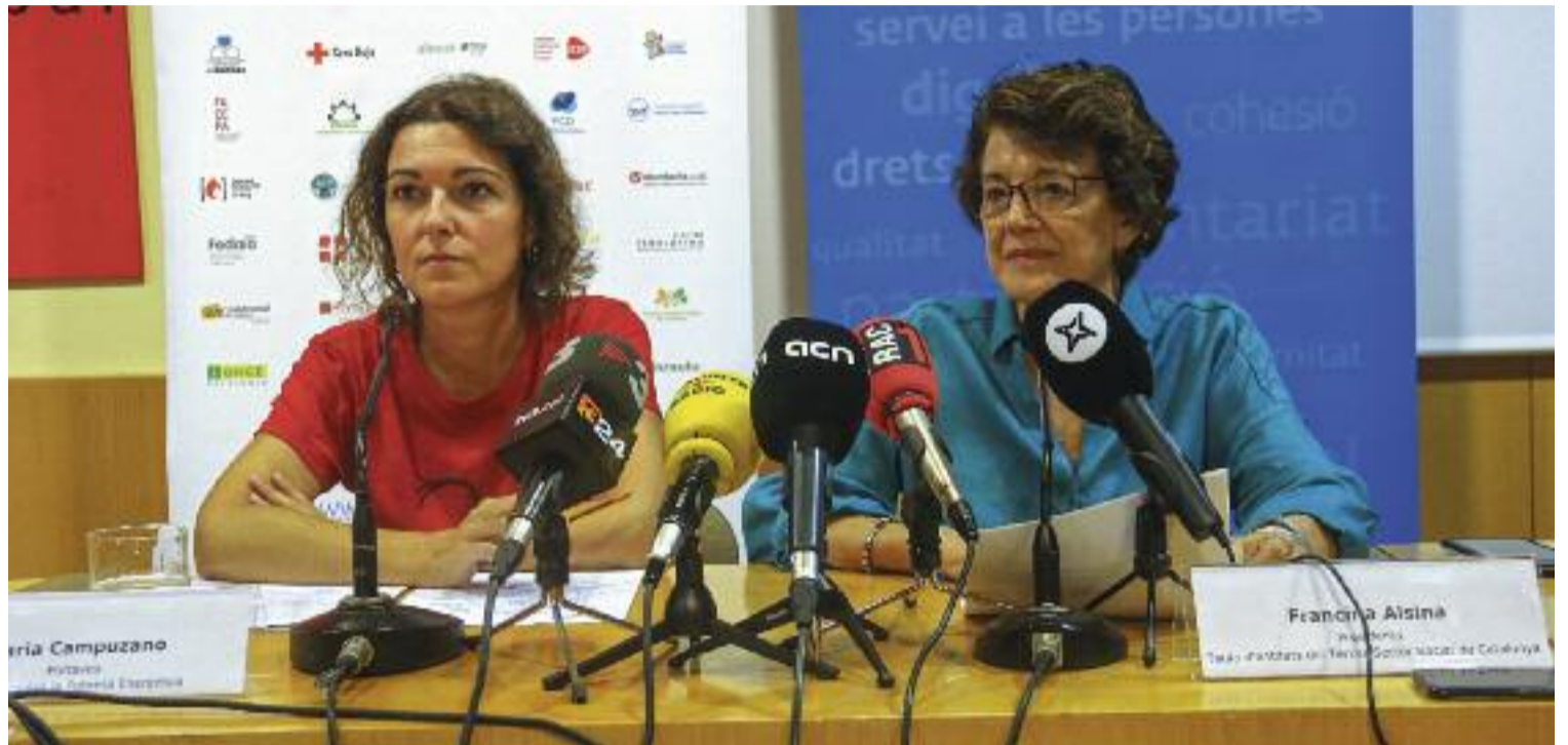
Les entitats socials acusen el Govern d'incomplir el conveni que regula la pobresa energètica a Catalunya.

Encara més quan les xifres de la darrera Enquesta de Condicions de Vida de l'IDESCAT apunten que el nombre de famílies que no poden mantenir