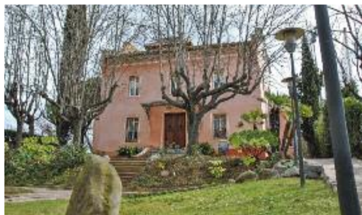
Les activitats es faran a La Torreta de Montmeló.

Entre aquests hi ha formacions per a tots els gustos com són el taller de dansa del ventre, el de ioga, el d'hipopilates, el d'hipopressius amb nadons, el de percussió, el de restauració, el de manualitats, el de pintura de roba, el de patchwork i el de fotografia digital. Els preus d'aquests tallers oscil·len entre els 18 i els 32 euros al mes, en funció del nombre de sessions que tinguin.