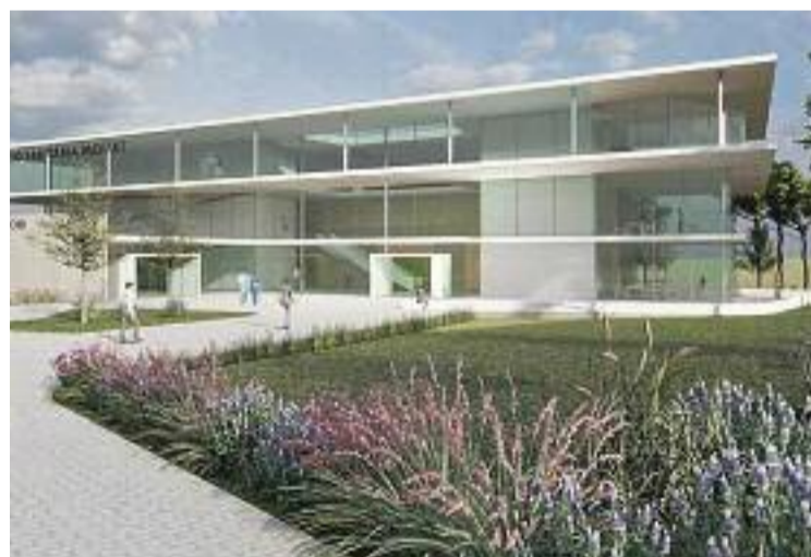
Així serà el nou edifici.