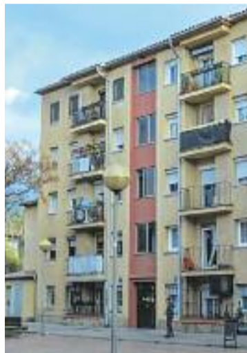
Sector Primer de Maig.

ha al sector Primer de Maig, que encara avui dia continua exactament igual que fa 60 anys, quan es va construir. Una reforma que se suma a la que el consistori vol tirar endavant a l'Avinguda Sant Esteve, amb una altra subvenció que encara està esperant. Tot plegat, per transformar aquest carrer i fer-lo més verd, més accessible i menys transitat, deixant espai a les bicicletes.