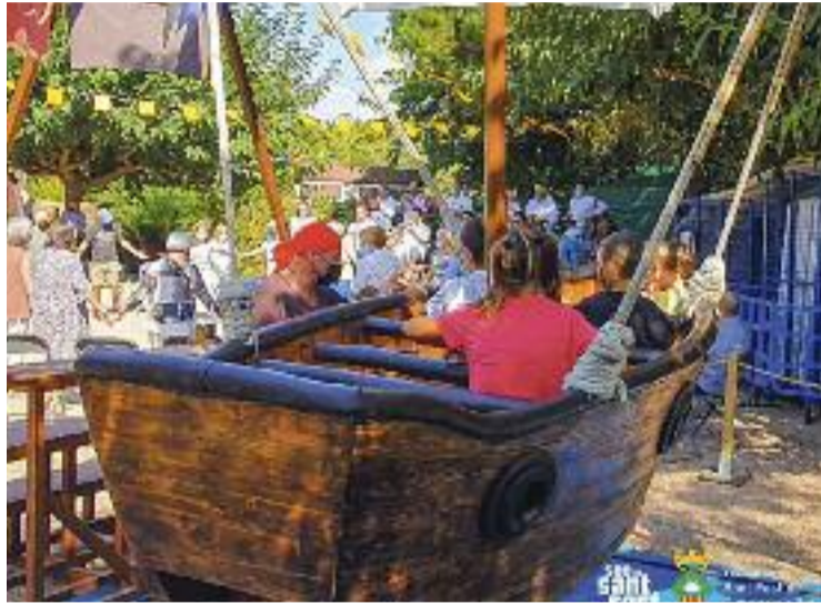
El municipi viurà un cap de setmana intens de festa.

Però la festa no s'aturarà aquí, ja que avui hi haurà un combinat d'activitats que han organitzat les colles de Sant Fost, amb la col·laboració de l'Ajuntament. A més, a partir de les vuit de la tarda, es podrà gaudir de música ambiental, monòlegs i un concert de rumba a càrrec de Con cuerdas y rumba , a la plaça de la Vila.