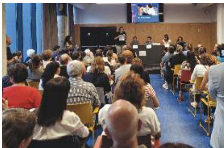
Acte de presentació de TEA Vallès.

Aquesta entitat comarcal, que es presentava divendres en un acte a les Franqueses, neix per donar suport a persones amb autisme i a les seves famílies. De fet, els seus objectius són tres: defensar la dignitat i els drets de les persones amb TEA per tal d'aconseguir la plena inclusió social,