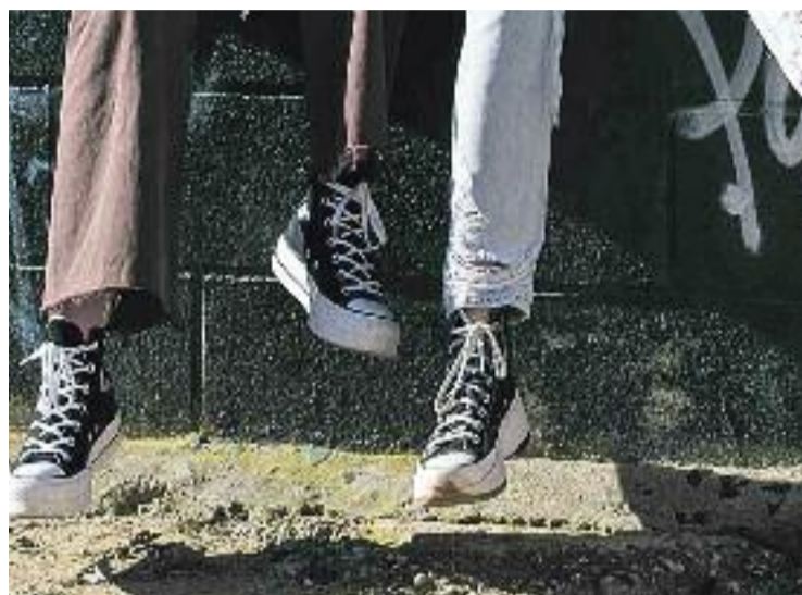
S'ofereix educació com a alternativa a les multes.

Aquesta activitat anirà a càrrec de tècnics municipals i, un cop acabada, l'equip valorarà si se n'han assolit els objectius o no. Només en cas afirmatiu s'anul·larà la sanció econòmica, que estarà "en suspensió" durant el temps que duri el procés alternatiu, tal com detalla l'Ajuntament. Aquest conveni té una durada de quatre anys.