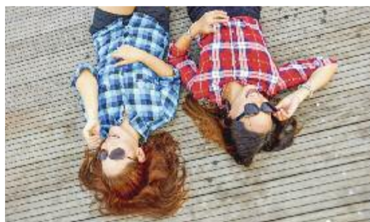
Es tracta d'un nou servei per a joves d'entre 12 i 18 anys.

Les activitats, que aniran a càrrec de dos educadors, seran molt diverses i inclouran des de tallers a excursions, passant per dinàmiques i jocs d'interior i d'exterior. Per gaudir-ne durant els nou mesos que dura el curs cal pagar un total de 45 euros per participant. Aquest preu inclou totes les activitats, així com els materials, les assegurances i el servei de monitoratge.