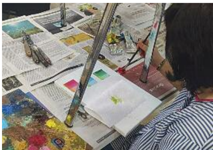
Els usuaris del Club faran una exposició de pintura.

Aquest primer punt del programa es complementarà amb l'exposició de llibres sobre salut