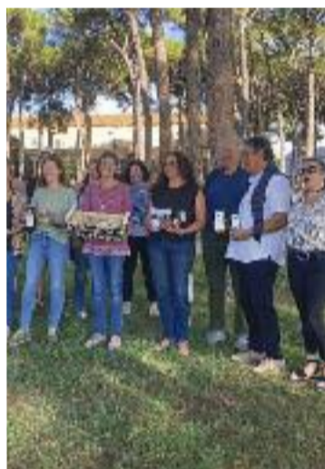
Diversos productors.

nals". Una tasca en la qual tot just ara comencen a treballar, amb el suport de la federació, del Centre de Recursos d'Espectre Autista de la Catalunya Central i de l'Ajuntament de les Franqueses. Tot plegat per "reivindicar que els nostres fills són ciutadans de ple dret" i que "cal una estructura pròpia a la comarca que detecti i atengui tant les seves necessitats com les de les famílies", conclouïa Moral.