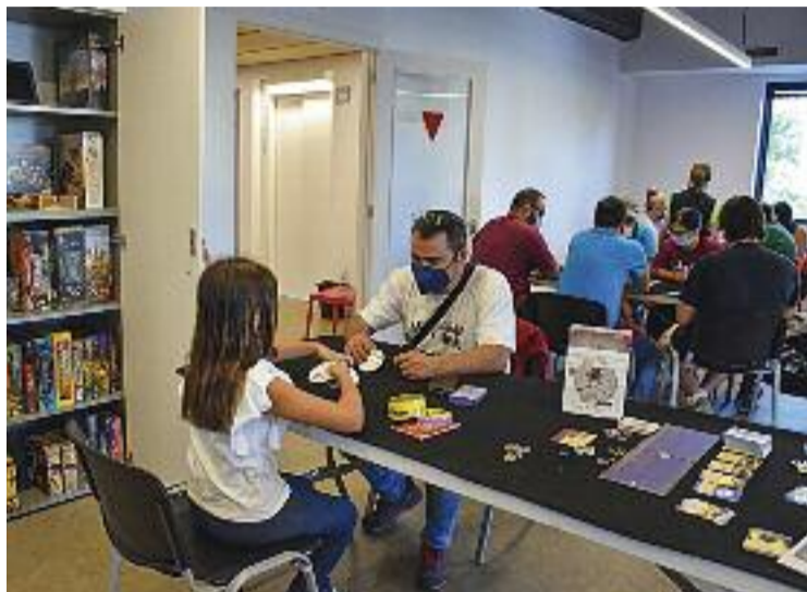
L'any passat es va celebrar la segona edició del FOAM.

Doncs bé, aquest dissabte, Montornès es convertirà en la capital del món friqui a la comarca. El dissabte 1 d'octubre, se celebra la tercera edició del Festival d'Oci Alternatiu de Montornès (FOAM) impulsat pel Departament de Joventut del municipi. En total, es duran a terme una vintena d'activitats al Centre Juvenil Sputnik, des de les 10 del matí fins a la una de la matinada. Segons informen des de l'A-