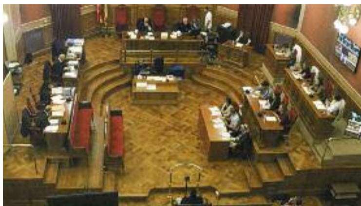
El judici s'allargarà fins al 5 d'octubre.

Segons la fiscalia, la nit del 16 de juliol la parella hauria discutit i ambdós haurien marxat del pis on vivien, primer ell i després ella. Un cop fora, haurien parlat