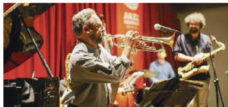
Imatge d'arxiu d'un concert de l'edició anterior.

MÚSICA ▶ Avui dona el tret de sortida el 50è Cicle de Jazz al Casino. Una cita anual que organitza Jazz Granollers i que apropa a la capital vallesana els millors artistes locals i nacionals.