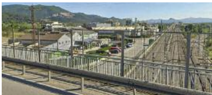
La KAO seria un focus de pudor, segons Mollet Respira.

D'una banda, el consistori molletà ha unit esforços amb altres municipis afectats per les males olors. En concret amb Montcada, Sant Fost, la Llagosta, Santa Perpètua i Ripollet. Aquests tres últims, especialment afectats per un episodi de males olors entre el 7 i el 14 d'agost. Una situació que els va portar a trobar-se ahir, per crear un grup de treball amb els tècnics de Medi Ambient dels diferents ajuntaments, posar en comú les dades recollides referents a les males olors i treballar plegats en el problema. Un