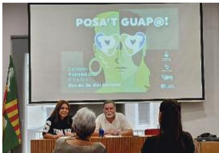
Acte de presentació del Posa't guap@ .

En aquesta línia, durant el dia 9 hi haurà estands on aquests comerços podran mostrar els seus productes i serveis, però també tota una programació plena d'actes. Entre ells, per exemple, espectacles, tallers, exhibicions