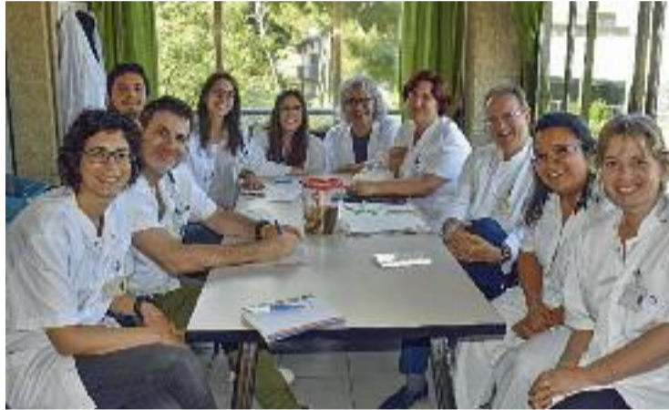
Part de l'equip de la UCP de fa uns anys.

Segons expliquen des de l'hospital, "al llarg dels anys la unitat s'ha reafirmat com un referent de la comarca". D'una banda, per la seva assistència a pacients i famílies, pel seu enfocament docent, ja que a la unitat es formen estudiants contínuament, i també per ser innovadora i incloure teràpies