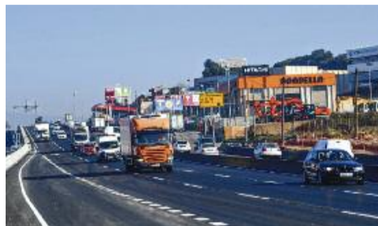
Es preveu que les obres acabin abans de finals d'any.

Tot plegat, a l'espera que acabin els últims treballs i que el tercer carril en sentit nord estigui enllestit abans de finals d'any.