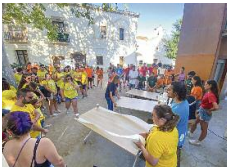
Una de les proves de la competició de colles.

Els que també van passar una bona estona van ser els espectadors del monòleg de Pep Plaza, el dia 10 a les vuit del vespre a l'Envelat. Gairebé en paral·lel, al pati del Carrencà va tenir lloc el concert de Rumba