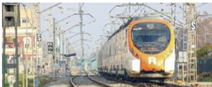
L'R2 i l'R11 començaran i acabaran a Sant Andreu.

En aquest darrer cas, des de l'estació de Granollers Centre es podrà agafar un bus que anirà directe a l'estació de Sagrera-Meridiana, entre les sis i dos quarts d'onze del matí, i després tornarà a la capital vallesana, de cinc de la tarda a dos quarts de nou del vespre. Mentre que qui necessiti viatjar fora d'aquest horari, haurà de baixar a Sant Andreu i agafar l'L1 de metro o el bus llançadora que Renfe posarà entre Sant Andreu i Sagrera-Meridiana, de sis a deu i de quatre a vuit.