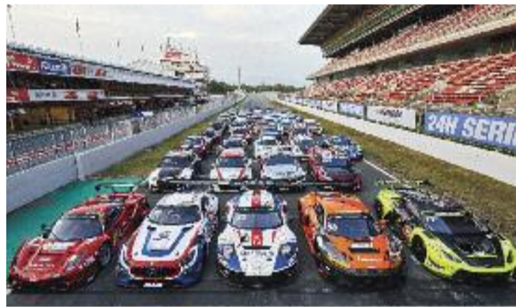
Les 24 Hores es van celebrar el cap de setmana.

No Ens Vendreu La Moto acusa directament les administracions d'aquestes molèsties i recorda que la contaminació acústica "mata 12.000 persones a Europa cada any".