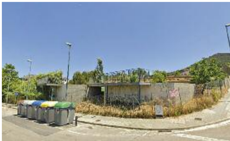
Solar on s'ubicarà la residència de gent gran.

Al juliol, ICV-EUiA va anunciar que el projecte de l'equipament que ha d'albergar quasi una cinquantena de persones d'edat avançada i que s'ubicarà en els terrenys on hi havia els mòduls de l'INS Marta Mata, estaria en marxa l'any que ve. L'alcalde va presentar un calendari al ple en el qual quedava establert que el 2023 es redactaria el projecte executiu i el 2024 es començarien a dur a terme les obres de la nova residència i centre de dia que finalitzarien el 2025. Ja aleshores, Montero va supeditar el projec-