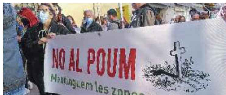
Imatge d'arxiu de la manifestació contra el POUM del novembre.

URBANISME ▶ La Federació d'Associacions Veïnals de Mollet (FAAVM) engegarà, a partir del 8 d'octubre, un procés participatiu per elaborar un POUM alternatiu a l'actual. Una iniciativa que portarà el nom de Quin Mollet volem? i que pretén crear un document que reculli les opinions de tots els molletans.