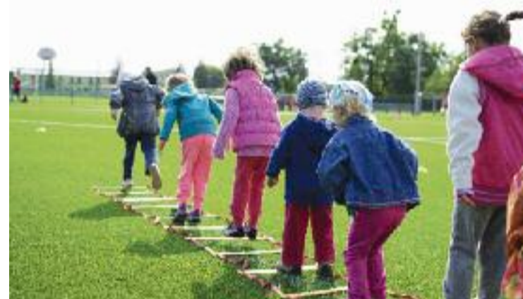
El festival s'adreça a nens i nenes i les seves famílies.

El festival compta amb la col·laboració d'entitats locals dedicades a l'assessorament familiar i el lleure, i amb comerços i restaurants sensibles amb la sostenibilitat i la proximitat.