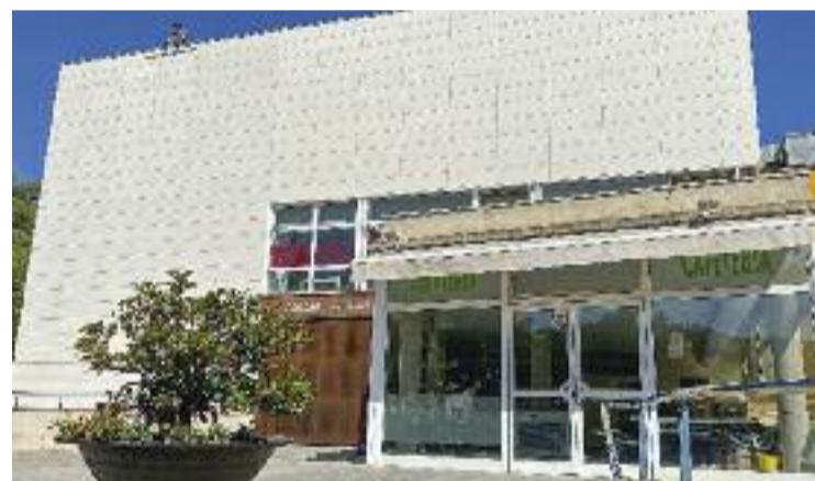
El bar de l'Ateneu fa nou mesos que és tancat.

De fet, l'Ajuntament considera aquest establiment com un "complement" dels diferents serveis de l'Ateneu, i que és per aquesta raó que "ha d'oferir una imatge singular, atractiva i respectuosa per a tots els sectors de la població".