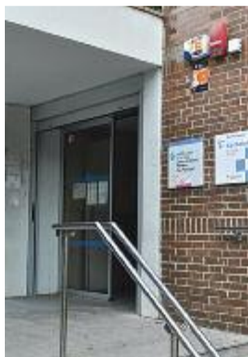
CAP Can Pantiquet.

En aquest sentit, la FAAVM organitzarà una dotzena de sessions que comptaran amb la participació dels veïns, però també d'experts en temes com l'habitatge o el medi ambient. Tot plegat, amb la intenció d'entregar el document que sorgeixi d'aquestes trobades a tots els regidors abans de les eleccions municipals de l'any que ve.