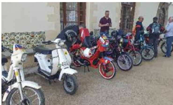
Les Derbi són tot un clàssic.

I un cop arribats a Montmeló, els motoristes van poder fer un parell de voltes al circuit. A la seva entrada, els participants en les 24 Hores van aclamar els