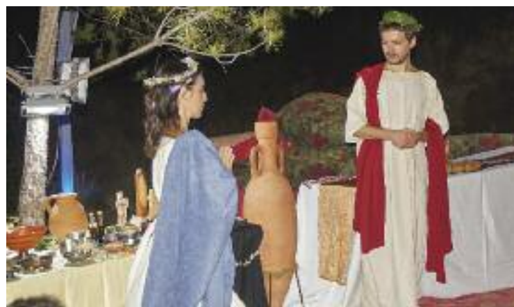
Enguany no faltará el sopar amb plats típics de Roma.

el món romà, posarà en marxa una programació d'allò més diversa. Així, aquest dissabte Mons Observans viurà el concert Amor a Roma , amb àries i duets d'òpera situats a l'antiguitat clàssica. El 16 de juliol es farà una ruta del vi DO Alella que farà parada al jaciment amb un tast amb maridatge, a càrrec del restaurant local La Gourmet-Teca. Finalment, el 23 de juliol se celebrarà el tradicional Convivium : la visita al jaciment amb posterior sopar amb plats típics de l'època romana.