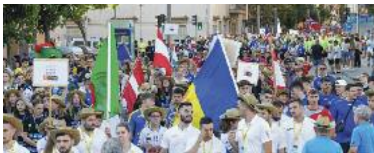
4.000 joves s'han allotjat a la ciutat durant cinc dies.