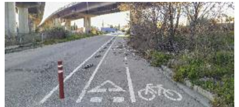
Imatge d'un carril bici de la ciutat.