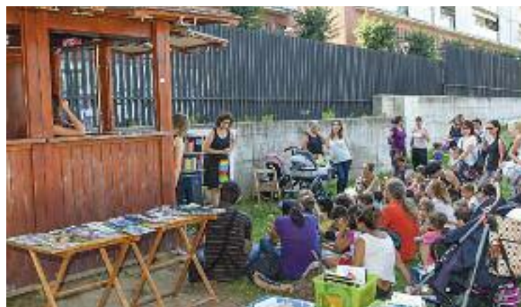
El Biblioparc omple La Linera cada tarda.

Un conjunt de propostes que organitza la Biblioteca Can Rajoler i que combinen l'oci, però també la lectura. I és que, a banda de tots aquests espectacles, hi ha espais per llegir. Una manera diferent de fomentar la lectura durant les tardes d'estiu.