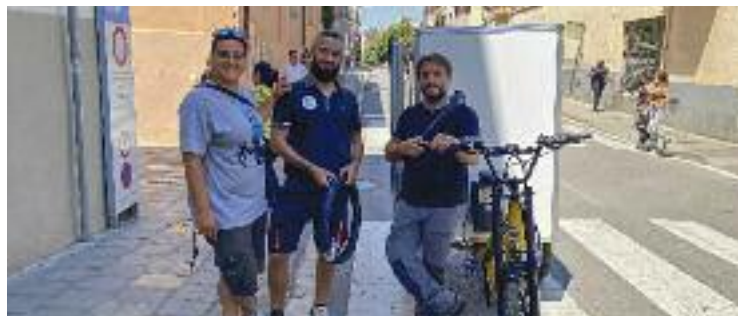
Amb tricicles com aquest es reparteixen els paquets.

MOBILITAT ▶ Quan demanem un paquet, estem acostumats al fet que el repartidor vingui fins a casa en moto, cotxe o furgoneta. Però si l'empresa de missatgeria que el reparteix és Nacex, l'entrega es farà en bici. Una iniciativa que començava l'any 2016, només al centre de la ciutat, i que ara arribarà a pràcticament tot el municipi. I és que Granollers Pedala, impulsora del projecte, ha ampliat el conveni amb l'operadora.