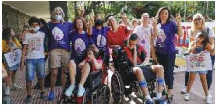
Concentració d'alumnes i famílies.

Segons informen des del consistori molletà, aquesta actuació es farà "de forma subsidiària i davant la inactivitat de la Generalitat". Per això, recorden que "ja està preparat un recurs contenciós administratiu" que enveran a la resta d'ajuntaments afectats perquè valorin si s'hi adhereixen o no,