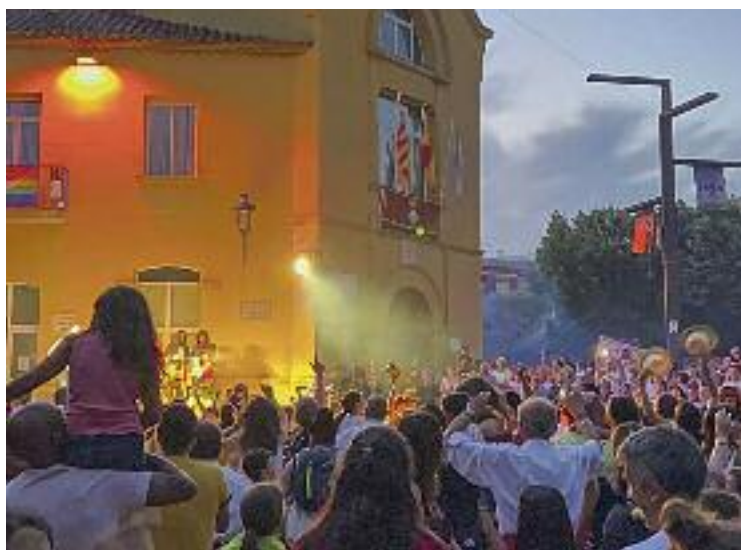
La festa va començar amb el Toc d'inici.

seguir amb una agenda ben plena. Animació infantil, cantada d'havaneres o un Escape Room al carrer van ser algunes de les activitats. Amb tot, el dissabte encara n'hi havia més. A les 11 de la nit va ser el torn per un dels moments més esperats: El Rapte. L'activitat organitzada per Diablers, una com-