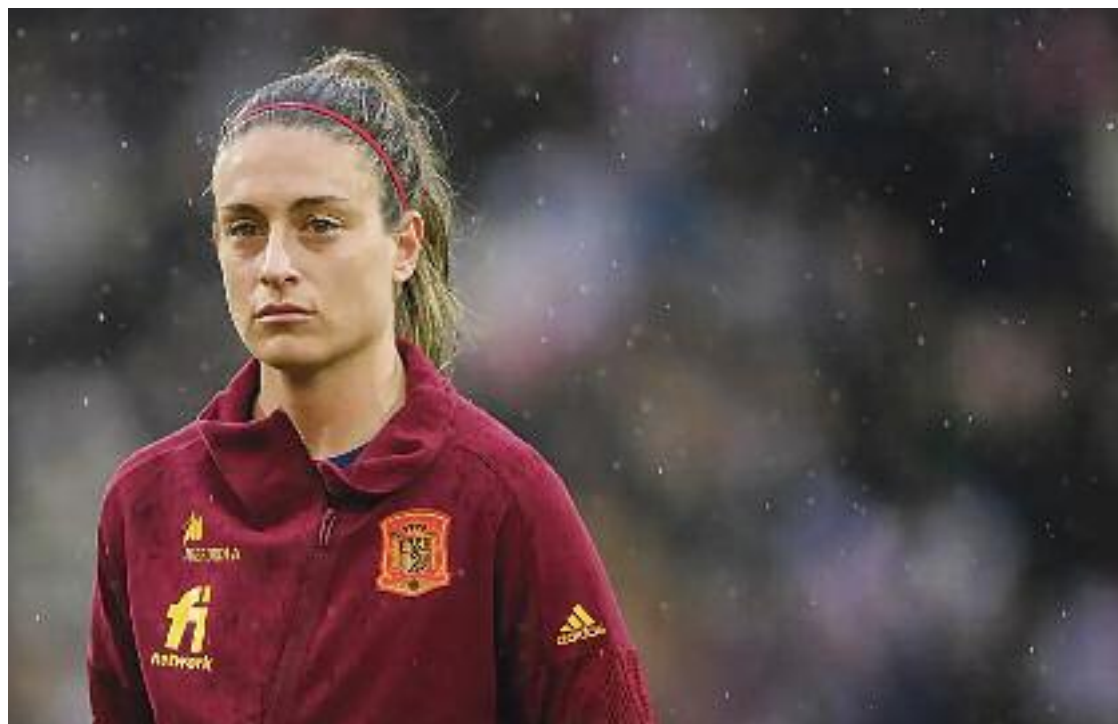
Alèxia Putellas, abans d'un partit amb la selecció espanyola.

La molletana té una ruptura del lligament encreuat anterior [del genoll esquerre], una de les lesions més comunes en-