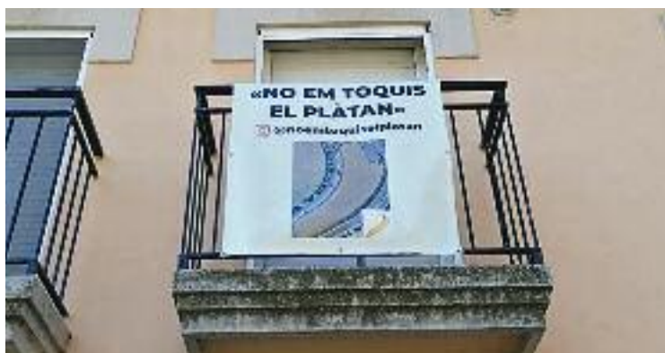
Els veïns estan penjant cartells com aquests.