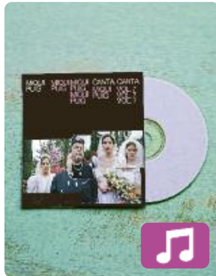
Miqui Puig canta vol. 7 Miqui Puig

"És un àlbum molt Miqui Puig, però també és molt contemporani per les eines que fem servir". Així va descriure el cantant Miqui Puig el seu setè disc en solitari, en una entrevista concedida a l'ACN. Sota el títol Miqui Puig canta vol. 7 (Primavera La-bels), l'artista aplega nou cançons de "pop de pista de ball" i col·labora amb Ferran Palau i Queralt Lahoz, entre d'altres.