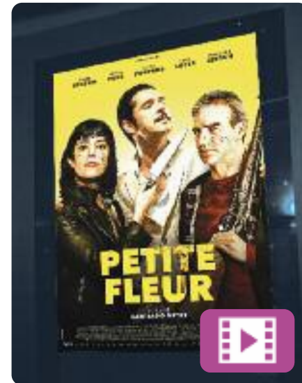
Petite fleur Santiago Mitre

El José, un ciutadà argentí que recentment s'ha mudat a França amb la parella i la filla, coneix un nou veí. En un impuls, mentre escolta la peça de jazz Petite fleur , el mata. L'endemà, però, se'l troba i veu que està més sa que mai. Decideix matar-lo de nou. A partir d'aquí, la rutina del José serà aquesta: cuidar del seu fill, tenir cura de la casa... i matar el veí.