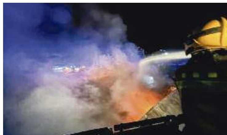
Fins a 33 dotacions es van desplaçar al lloc dels fets.

Quan es va declarar el foc, hi havia una desena de treballadors a la nau. Tot i que van cremar cent tones de químics, per sort no hi va haver cap ferit.