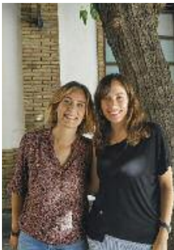
Albiach i Escribano.

POLÍTICA ▶ Dissabte, la coordinadora general de Catalunya en Comú, Jéssica Albiach, visitava Mollet. I és que la capital baix vallesana va acollir el Consell Nacional del partit. Un fet que des de l'organització local valoraven molt positivament perquè "demostra el suport a la bona tasca que està desenvolupant Mollet en Comú tant en clau institucional com social al seu nivell municipal", diuen.