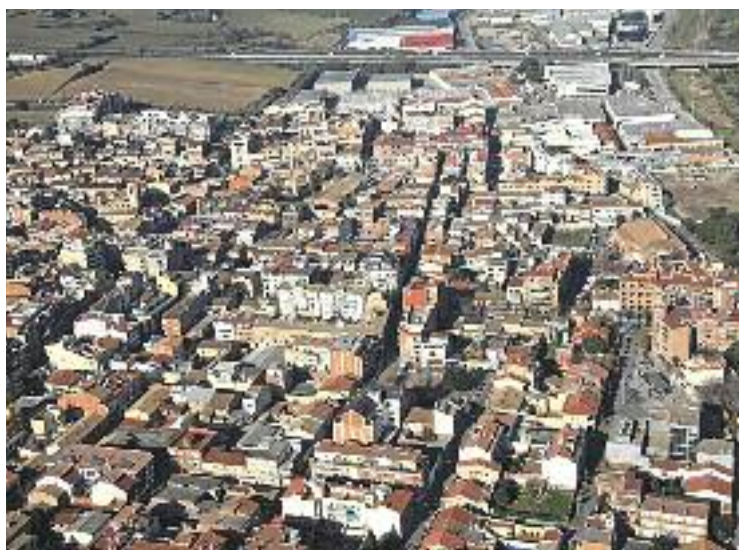
L'Ajuntament vol rehabilitar els edificis d'habitatges.