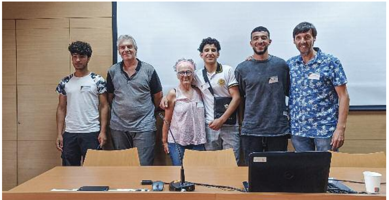
La setmana passada es trobaven alguns dels joves amb els empresaris, en una jornada organitzada pel Consell Comarcal.

Amb la voluntat de trencar aquestes barreres que el món laboral posa, d'entrada, al jovent nouvingut, el Consell Comarcal del Vallès Oriental ha tirat endavant el