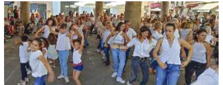
Actuació de l'AV de Can Gili dissabte a la Porxada.