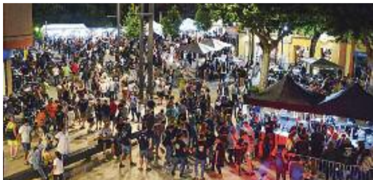
La Nit Motard ha tornat a generar queixes.