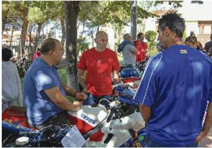
El 2 de juliol serà una data clau en la celebració del centenari.

tos Derbi en direcció al Circuit de Catalunya per fer-hi una volta de celebració i tornar a Martorelles. Una marxa de motos antigues que passarà, també, per l'antic circuit del polígon industrial i que coincidirà amb les 24 hores de