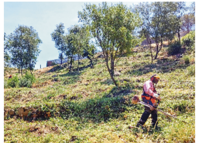
Un operari fent tasques de neteja.

Després d'un hivern que ha estat poc plujós, el consistori santfostenc remarca que és molt important "extremar les precaucions i conservar els boscos i mantenir-los nets".