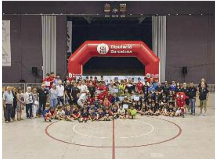
La Festa de l'Esport té esperit social.

Durant l'acte, el Club de Patinatge, el Club de Rítmica i el grup de hip hop de la Regidoria d'Esports van oferir actuacions relacionades amb el tema central de la Festa de l'Esport 2022, la salut mental. Més enllà de l'entrega de premis, hi va haver la mostra d'entitats esportives i