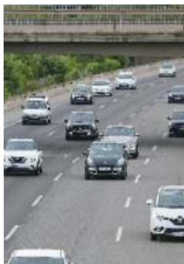
Imatge d'arxiu de l'AP-7.

CALDES DE MONTBUI ▶ Caldes de Montbui ha presentat, en el marc del programa Stride4Stride (una iniciativa europea que té per objectiu crear espais de trobada de referents en matèria d'educació a Europa), el cicle formatiu de grau superior de Termalisme i Benestar. Una proposta que inclou pràctiques en centres termals i spa per promoure el sector turístic i termal del municipi.