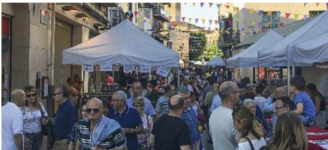
La darrera edició del Mollet és Fira es va celebrar l'any 2019.

Ahir mateix, el comerç local ja començava a agafar protagonisme amb la tradicional Gala del Comerç que organitza ADHEC al Mercat Vell. Enguany, en reconeixement de les dones empre-