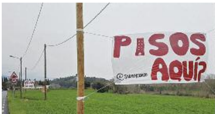
Una pancarta de rebuig al projecte urbanístic.

Aquesta construcció "significa que s'augmenta un 50% de població de cop i, per tant, més contaminació acústica, lumínica i ambiental", diuen des de Salvem Corró d'Amunt, l'entitat veïnal nascuda recentment. A més, "la urbanització també permet la instal·lació de comerços, hotels, serveis i indústria, fet que com-