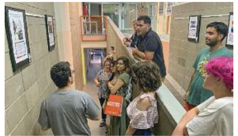
La mostra s'ha instal·lat a Can Pelegrí.