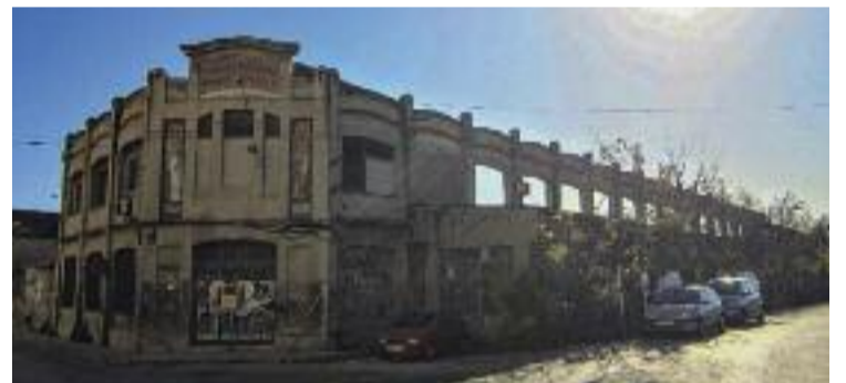
Només es conserva aquesta façana.

EMPRESA ▶ El solar on fa anys estava ubicada la històrica fàbrica Teneria Moderna Franco-Espanola de Mollet deixarà de ser un espai abandonat. I és que segons ha avançat el diari Expansión, la multinacional Goodman ha comprat els terrenys. Una parcel·la de 44.000 metres quadrats, amb 60.000 metres quadrats edificables, on aixecarà un centre logístic.