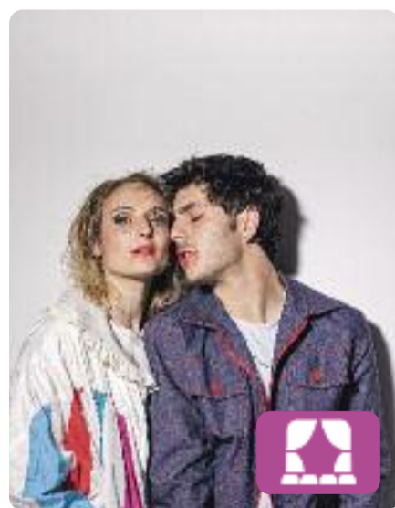
Romeu i Julieta La Brutal