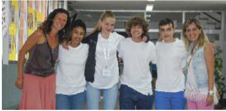
Els quatre alumnes i les dues tutores viatjaran a Silicon Valley.

"Quan ens vam posar a pensar en un col·lectiu que tingués alguna necessitat, tots vam estar d'acord en el fet que les persones invidents tenen la necessitat de