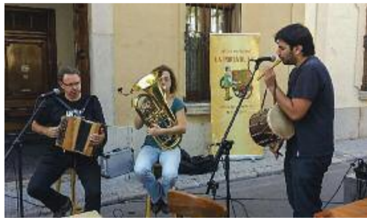
La Portàtil FM és un dels grups convidats.

Aquest dissabte, de nou, el folklore tornarà a Montornès a partir de les 21 hores amb la 28a edició del Balla Montornès que es durà a terme a la plaça de Picasso. Organitzada per Ball de Diables i Dracs de Montornès, l'esdeveniment comptarà amb les actuacions en viu dels grups La Viu Viu i La Portàtil FM, i una botifarrada i servei de barra a preus populars. L'entrada de tot el festival és gratuïta.