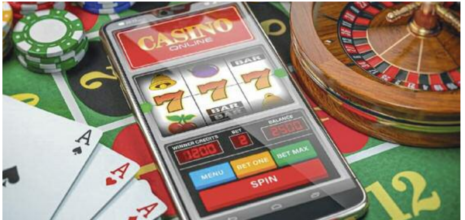
Cada vegada més joves entren en el món de les apostes esportives, el joc i les criptomonedes.

El d'en Josep, però, no és un cas aïllat. A la Parròquia de Santa Maria del Jaire, a la Torreta (la Roca del Vallès), cada dijous es reuneix el grup de suport Vida Limpia . “Allà, sense cap professional, ens expliquem les nostres experiències i com ens estem recuperant, i el fet de veure'ns reflectits en altres persones ens ajuda moltíssim”, explica en Jo-