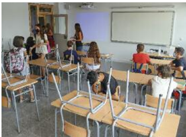
Una vintena d'alumnes participaran en aquesta prova pilot.

La proposta municipal per abordar aquesta problemàtica consisteix en una sèrie de beques que permeten que els estudiants accedeixin al servei de classes particulars que ofereixen les diferents acadèmies de reforç escolar locals. Des de la regidoria d'educació s'ha treballat en els darrers mesos conjuntament amb els centres educatius del municipi per tal de detectar quin percentatge dels alumnes podia estar en risc d'abandonament prematur dels