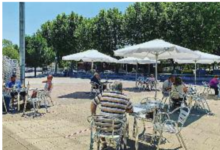
El restaurant ha tancat les portes per la pandèmia.