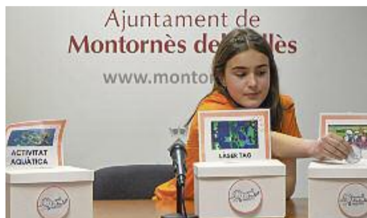
Cinc de les vuit propostes que es votin es duran a terme.

Les cinc propostes guanyadores comptaran amb un pressupost total de 5.000 euros, que ja es van assignar amb anterioritat al Departament d'Infància del consistori vallesà. Aquesta iniciativa pionera compta amb el precedent dels Pressupostos Joves Kosmos, que amb la seva quarta edició ja s'han consolidat com una eina participativa de primer nivell entre el jovent del municipi.