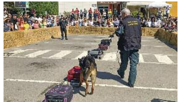
Una de les demostracions de les unitats canines de la policia

La festa va ser organitzada per Soc de Sant Fost i per la regidoria de Benestar Animal de l'Ajuntament de Sant Fost.