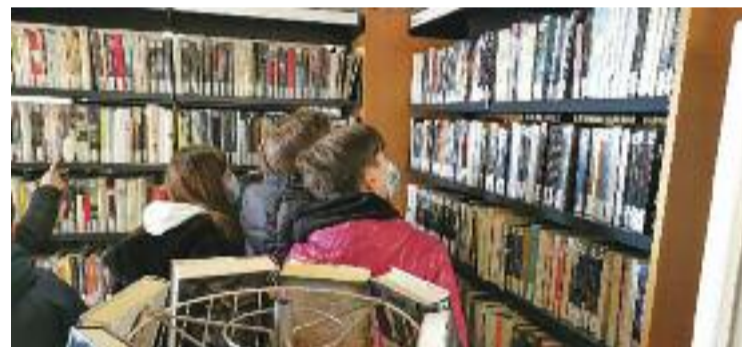
Imatge d'arxiu d'uns joves a la Biblioteca Can Rajoler.

Tot plegat en un web que ja es pot consultar i que també recull informació de les biblioteques, les activitats literàries, les col·leccions municipals i les llegendes del poble. I és que la voluntat del consistori amb tot això és, segons informen, “recollir, preservar i difondre tot allò que tingui a veure amb la lectura a nivell local”.