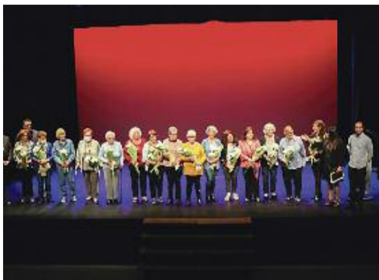
Un moment de la celebració de l'aniversari.

DE GENERACIÓ EN GENERACIÓ En la mateixa línia, l'acte de celebració del cinquantè aniversari de la biblioteca va servir per