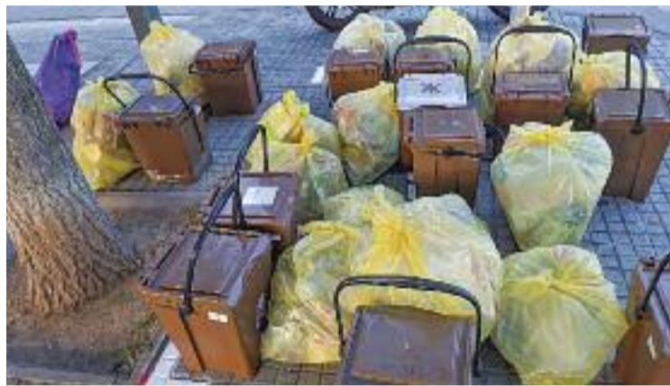
Ja fa una setmana que funciona el porta a porta.

"És un pas molt important i estem contents de poder-lo tirar endavant", deia l'alcalde en la presentació del porta a porta a finals de març. Un pas que es fa per millorar el reciclatge, amb l'objectiu posat en superar el 43% actual fins a un 65%, que és el que marca la Unió Europea per al