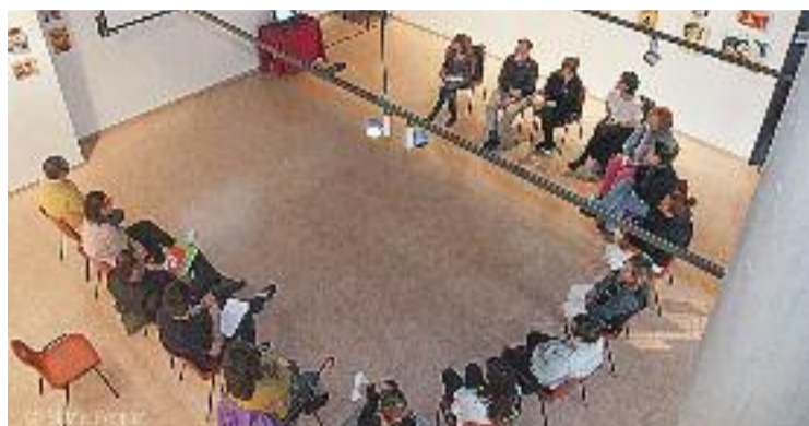
Trobada de dilluns a Can Rajoler.

“Encara que aquestes coses acaben servint de poc si només es parla i després no s'acaba fent res, com passa sempre”, diu el mateix comerciant, que ex-