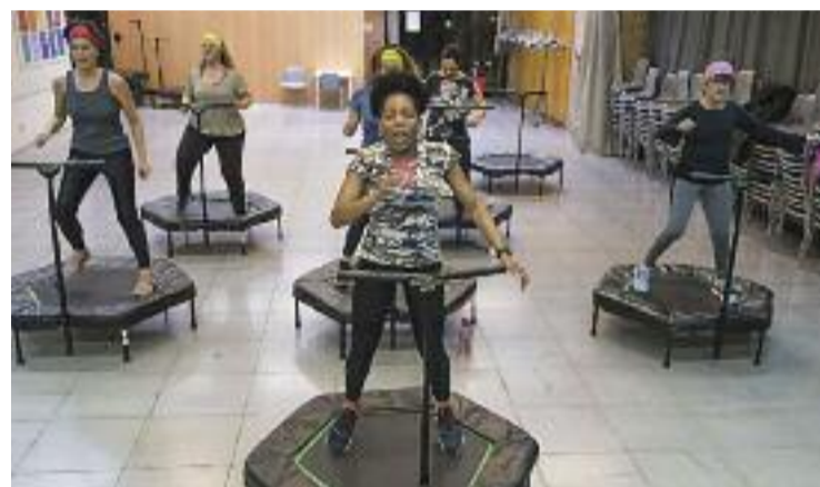
Una de les activitats del SocioculturalSPM.

Destaca també la creació del programa ComunitariaMENT, que abordarà "problemes lleus de salut mental", tal com ha avançat el consistori.