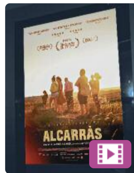
Alcarràs Carla Simón

Durant generacions, la família Solé ha cultivat una gran extensió de presseguers a Alcarràs, una petita localitat rural lleidatana. Però aquest estiu, després de vuitanta anys, pot ser que sigui l'última collita. Després de l'èxit d' Estiu 1993 , Carla Simón s'ha coronat amb Alcarràs , la pel·lícula que li ha valgut l'Os d'Or a la Berlinale i que ja omple els cinemes.