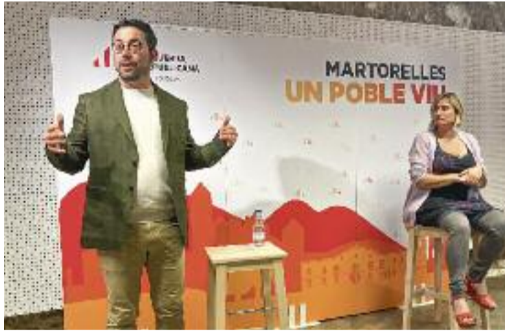
Acte de dissabte al Celler de Carrencà.

"Faig aquest pas amb molta il·lusió, content i confiant en el meu equip", deia. Un nou repte amb el qual podria afrontar la