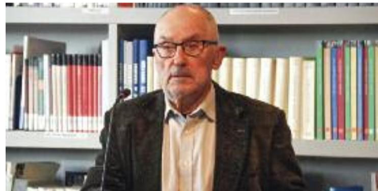
El Síndic de Greuges, Rafael Ribó.

És un supervisor i col·laborador de l'Administració catalana que vol ajudar a millorar-ne el funcionament i que també supervisa les empreses privades que presten serveis d'interès públic (la llum, la telefonia, l'aigua, el gas...).