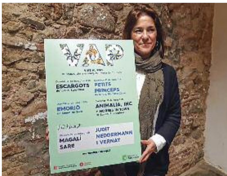
La regidora de Cultura, amb el cartell del VAP.

"Ampliem l'oferta respecte de l'any passat i hi afegim horari de migdia els diumenges perquè volem arribar al màxim de públics possible. Per això també avancem el festival dos mesos", explica la regidora de