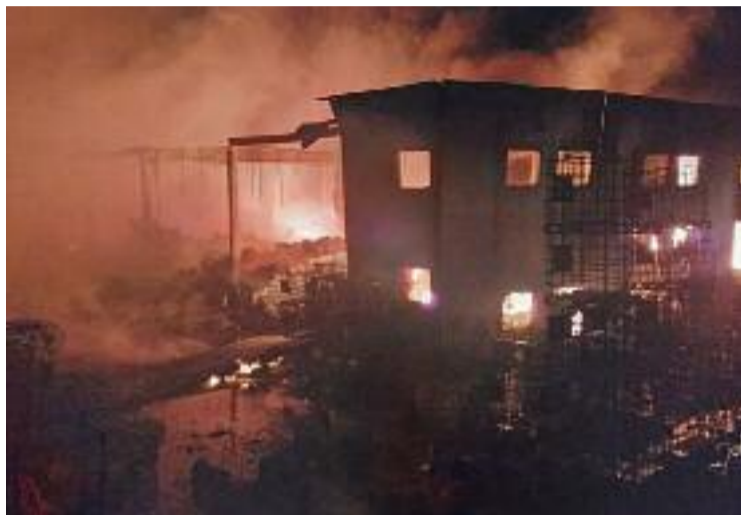
L'incendi de les naus del polígon de Can Parellada.

No va fins al passat 31 de març quan els Bombers de la Generalitat van donar per ex-