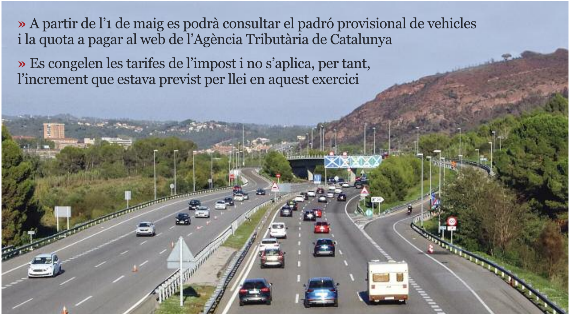
L'AP-7 a l'altura de Martorell, en una imatge d'arxiu.

» Es congelen les tarifes de l'impost i no s'aplica, per tant, l'increment que estava previst per llei en aquest exercici