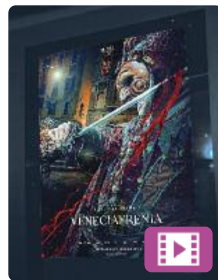
Veneciafrenia Álex de la Iglesia

Hi ha un vincle indissoluble entre la bellesa i la mort. Els turistes estan apagant la llum de la ciutat més bonica del planeta. L'agonia de les últimes dècades ha desfermat la ira entre els venecians, que s'han organitzat per frenar la invasió. Un grup de turistes espanyols viatja a Venècia amb intenció de divertir-se, però es veuran obligats a lluitar per sobreviure.