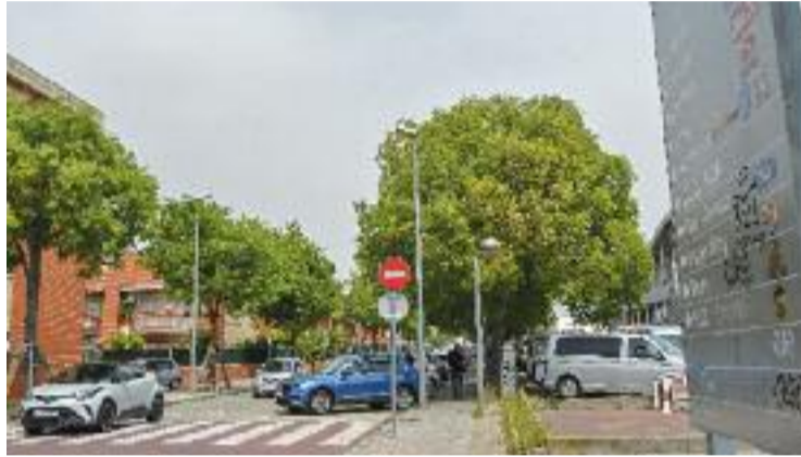
Les cases estan a tocar de la zona comercial.

Una situació que, segons Eva Llanos, una jove molletana, es