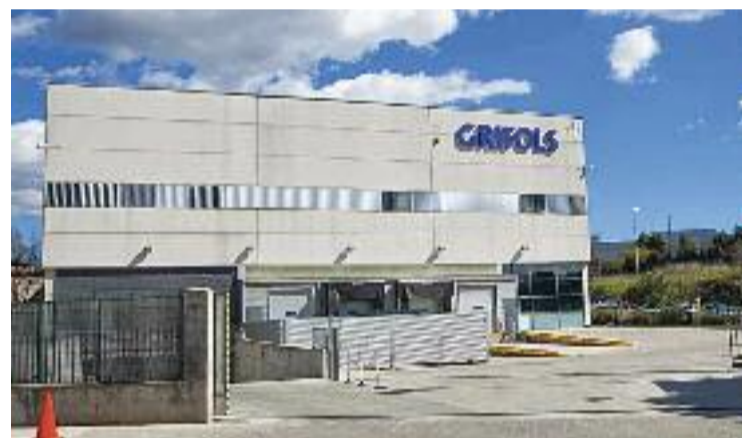
Fàbrica de Grifols a Parets.

Una adquisició que, segons el CEO de Grifols, Víctor Grífols, suposa una "fita fonamental dins del pla de transformació de l'empresa, plenament alineada amb la nostra estratègia de creixement", ja que Biotest té una cartera de 12 productes que es comercialitzen en més de 90 països del món.