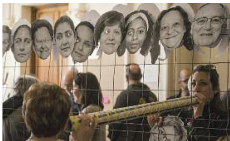
Imatge d'arxiu d'un taller d'art-teràpia a Santa Perpètua.