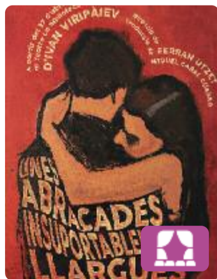
Abraçades insuportablement... Ivan Viripàiev

Entre Nova York i Berlín, el Charlie, la Mónica, l'Amy i el Krystof tenen entre 30 i 40 anys i se senten atrapats en una vida que no els satisfà. Desesperats, emprendran un viatge als inferns per fugir d'una buidor que no saben com superar. Les seves històries s'entrecreuran i intentaran aprendre què vol dir estar vius.