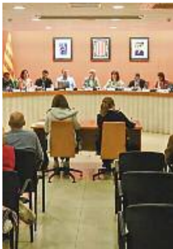
Ple de dimarts.

Nous càrrecs en un ple del qual cal destacar l'aprovació d'ampliar la depuradora i la planta de tractament de residus municipal amb la compra de dos terrenys a Palou, i l'aprovació de continuar amb l'empresa Talher com a gestora del servei de neteja i recollida de residus, a l'espera que s'aprovi, al ple de maig, l'adjudicació del servei a la Unió Temporal d'empreses formada per FCC i Arema, guanyadora del concurs.