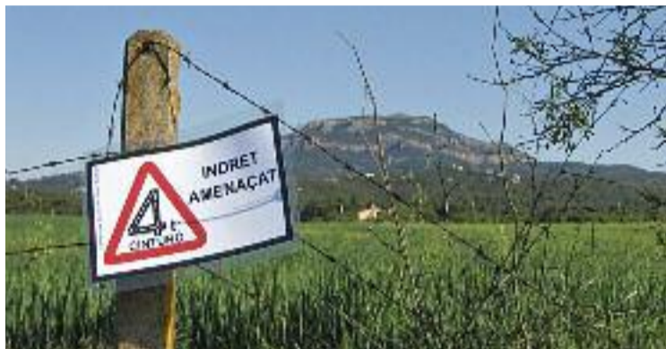
Una pancarta contrària al projecte.

"En tot aquest temps hem intentat consolidar el paper que tenen les zones no urbanitzades del Vallès, llançant propostes de protecció d'espais agrícoles, forestals i naturals, i també fent propostes per reordenar la mobilitat", explica Toni Altaió, portaveu de la Campanya Contra el Quart Cinturó. "Sobretot en la darrera etapa, aprofitant que arreu es començava a parlar de temes com la