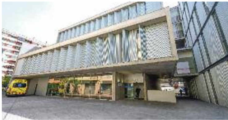
Exterior del nou CUAP del Granollers.

Des del novembre del 2020, el CUAP estava situat, de manera provisional, a l'avinguda del Parc. Però ara, amb unes instal·lacions més grans, de més de 760 metres quadrats, que compten amb tres consultes d'atenció ràpida, nou boxs, servei de radiologia i un laboratori, entre altres, l'atenció als pacients millorarà. Almenys això és el que s'espera. Tot i que, segons informa Salut, la plantilla seguirà sent, com fins ara, de 30 professionals.