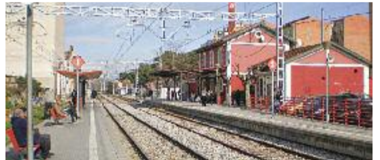
Estació de Mollet-Santa Rosa.

MOBILITAT ▶ Mollet necessita una estació de Mollet-Santa Rosa "nova, moderna i cèntrica". Així ho detallen des de l'Ajuntament després de la trobada entre l'alcalde, Josep Monràs, i el secretari general d'Infraestructures del Govern espanyol, Xavier Flores, per reimpulsar el desdoblament de l'R3 i la seva integració a la ciutat. Un projecte que està sobre la taula des del 2008, quan es començava a parlar del soterrament d'una part de la via i del trasllat de l'estació a la Rambla Nova.