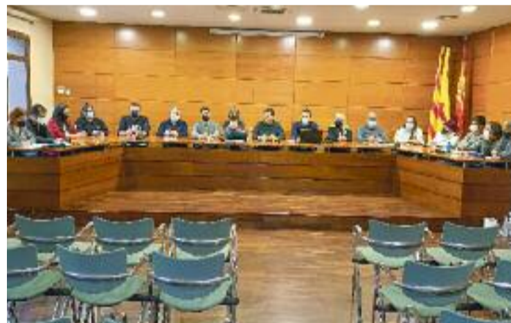
Una imatge del ple extraordinari.