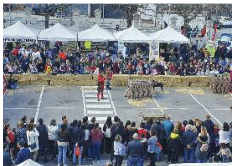
Escena de la primera edició de FostAnimal.

tres de la tarda hi haurà desfilades de gossos en adopció, concursos canins i d'agilitat, exhibicions de gossos de rescat, una exposició d'animals invertebrats... També hi haurà més de 30 paradetes, com per exemple de la Patrulla Canina i atraccions. Per últim, es farà un Gran recapte de pinso durant el cap de setmana. En definitiva, un menú molt ampli i variat de la festa animalista de Sant Fost.