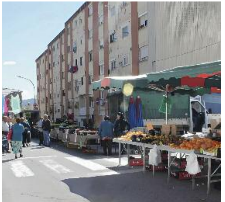
Can Millet, a l'Ametlla i Montornès Nord.

Per contra, Vilanova i la Roca són el segon i el tercer municipi més rics del Vallès Oriental. Localitats on, per exemple, el lloguer més baix que es pot trobar actualment està en 900 euros, mentre que a Canovelles està en 400. "Sobretot perquè hi ha pocs pisos, ja que predominen les cases unifamiliars i també les segones residències de gent de Barcelona", diu en Sergi Mora,