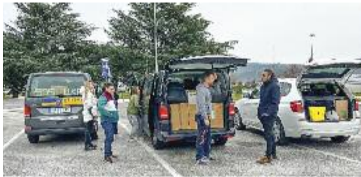
Ahir al matí, el comboi sortia cap a Medyka.

Ahir a primera hora del matí, Vera marxava amb un comboi format per dues furgonetes i un cotxe cap a la frontera amb Polònia. L'objectiu, portar-los material, humanitari i recollir entre 12 i 15 ucraïnesos que són familiars, amics o coneguts de persones que viuen a la ciutat o a la comarca, per reunir-los amb ells. Un viatge llarg i costós, de més de 1.200 euros per vehicle, que han