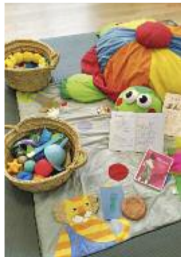
El Niu ha atès 52 dones.

Tot plegat, a l'espera d'arribar demà al camp de refugiats de Medyka, on recolliran principalment dones i nens, per arribar a Granollers a principis de la setmana que ve. Una manera d'aportar el seu granet de sorra perquè "al cap i a la fi, qualsevol podria estar a la seva pell i, en la seva situació, a tots ens agradaria que ens ajudessin", conclou Vera.