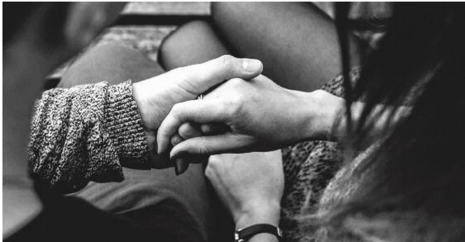
Cada vegada hi ha més problemes socials i per això la tasca de les treballadores socials és tan important.

De fet, de problemes socials sempre n'hi ha hagut i sempre n'hi haurà, i en especial en temps de crisi. Per això, darrerament són més les persones que acudeixen a demanar ajuda. Sobretot arran de la covid-19, que "va fer que, per exemple, ens trobéssim amb gent