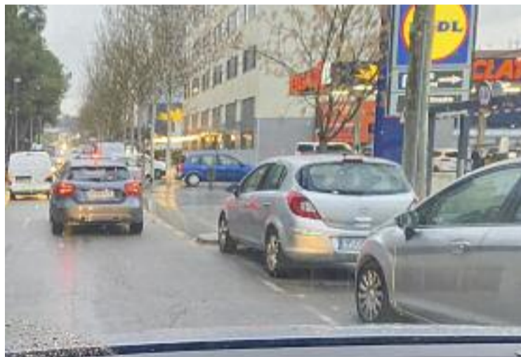
Les cues a la benzinera col·lapsen Can Borrell.