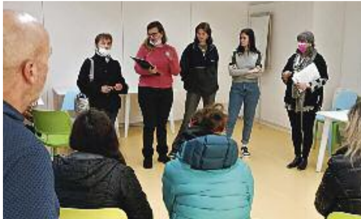
Les famílies de refugiades ucraïneses.

Dimarts a l'Ajuntament va arribar un comboi amb sis famílies de refugiades ucraïneses, que fugen de la invasió de Rússia al seu país. Van rebre una