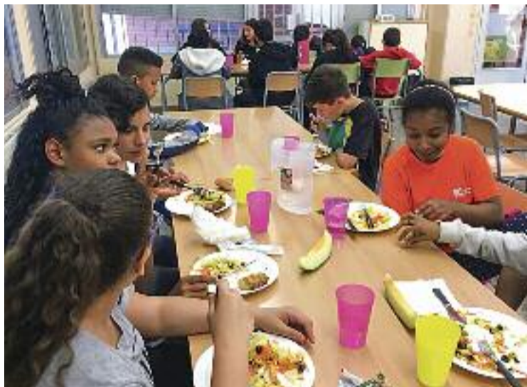
El programa ofereix plats saludables als joves.

Des de fa temps, l'Institut Vinyes Velles de Montornès es beneficia d'aquest pla. Primer, aportant als joves que hi participen un àpat sa i hàbits alimentaris saludables i, després, oferint-los reforç escolar i educatiu, tallers d'habilitats personals d'acord amb les necessitats de cadascú i activitats d'oci i esportives, entre altres. Unes tasques coordinades des del departament de Serveis Socials de l'Ajunta-