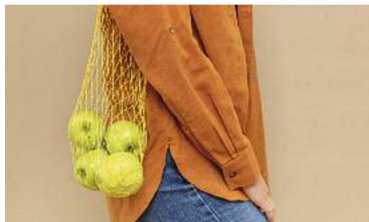
Consum responsable i sostenible.

manera responsable i sostenible per poder contribuir a una societat més justa i sostenible en l'àmbit social, ambiental i econòmic". Durant les xerrades es van exposar també els Objectius de Desenvolupament Sostenible (ODS) de l'Agenda 2030. Així, es va tractar l'ODS sobre consum i producció responsables "per reduir el nostre impacte sobre el planeta produint i consumint només allò que necessitem". El Dia Mundial de la Persona Consumidora va ser el 15 de març.