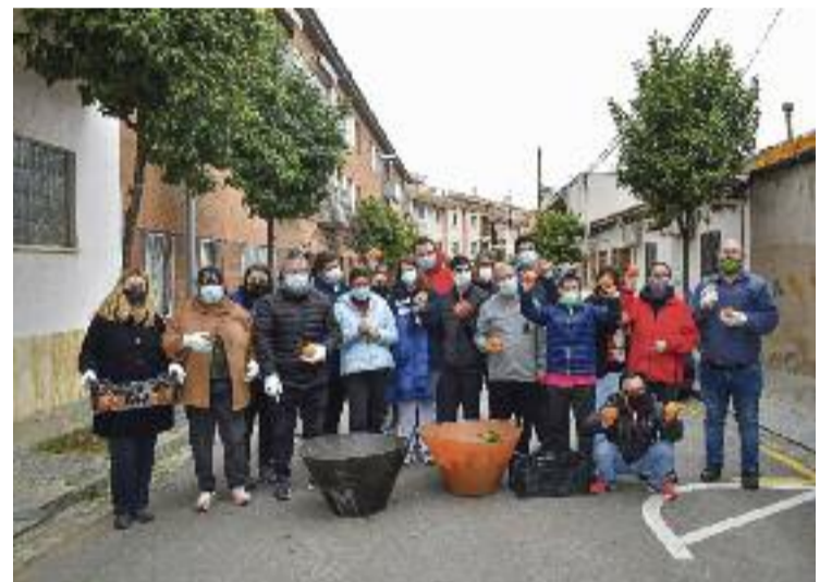
Recollida de taronges, dimecres.

L'objectiu de tot això és fer mermelada de taronja per fer-la arribar al Banc dels Aliments de Mollet. Així, les persones en situació de precarietat alimentària de la ciutat se'n podran beneficiar. Tot plegat amb una iniciativa que, a banda d'evitar el malbaratament, afavoreix "la prevenció de residus, l'economia circular, l'alimentació sostenible i lluitar contra la pobresa", diu el regidor de Justícia Ambiental i Ecologisme, Raül Broto.