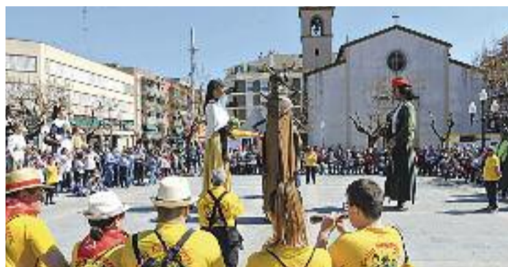
Tornen les Festes de Sant Josep.

Diumenge l'AMPA de l'Escola Les Planes organitzarà l'11è Torneig de Sant Josep de futbol sala i la 4a Trobada en família, de les 9 a les 18 h. Mentre que el pròxim dilluns 21 de març la Biblioteca de la Llagosta i Ràdio la Llagosta commemoraran el Dia Mundial de la Poesia amb una intervenció al programa 100