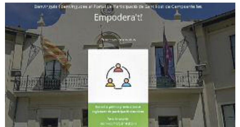
Una imatge del portal de participació.

cipar totes les persones amb 16 anys o més empadronades al municipi. Malgrat això, cada procés pot tenir les seves pròpies característiques que s'hauran de consultar en la normativa específica que el reguli", informa l'Ajuntament. En general, cal registrar-se aportant el nom, DNI, adreça de correu electrònic i contrasenya. En alguns processos, però, per a la presentació de propostes no serà necessari el registre previ. Per garantir l'anonimat, el nom públic que aparegui al portal pot ser inventat.