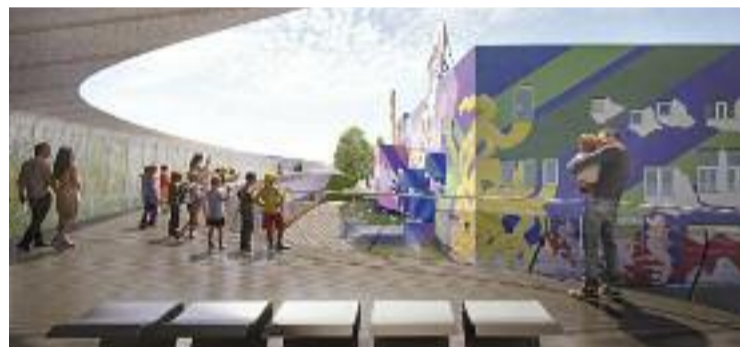
Avantprojecte de la passera de la Tipel.

Tot plegat per convertir la Tipel en una obra d'art en si mateixa i en un element més del patrimoni nacional.