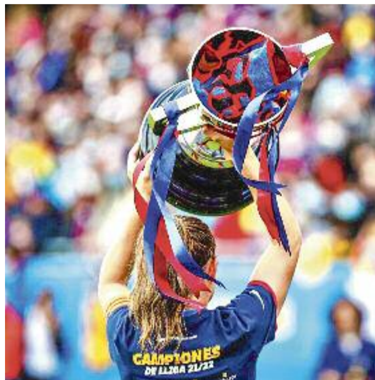
Alèxia Putellas aixeca el trofeu de Lliga a l'Estadi Johan Cruyff i al Camp Nou.

Johan Cruyff després de golejar el Real Madrid per 5-0 i, hores després, al Camp Nou, la seva sisena Lliga. La setena d'un equip coral a qui lidera des de