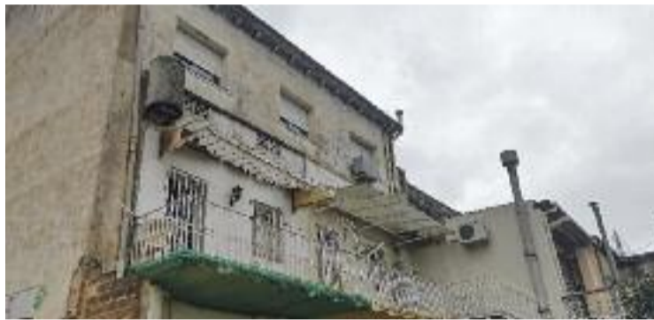
En alguns casos, l'amiant és a les cases.

"Principalment, es troba a les teulades d'edificis i a les canonades i els baixants de les cases, sobretot al barri de l'Estació Nord, tot i que també sabem que hi ha equipaments públics, com el pavelló de bàsquet, on hi ha amiant", explica. Per això demana dues coses: "Que l'Ajuntament faci un pressupost anual que contempli