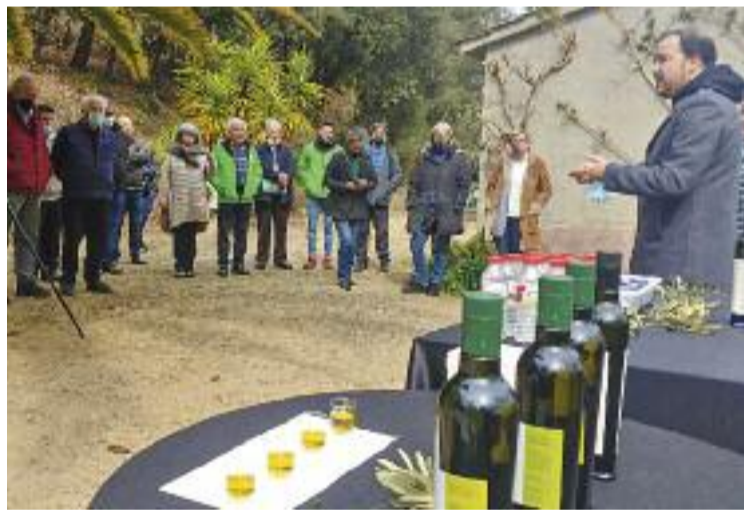
Trobada per explicar el projecte, divendres passat a Caldes.

LLIÇA DE VALL ▶ L'Ajuntament de Lliça de Vall ha presentat el Geoportal, una eina que es posa a l'abast de la ciutadania per tal que les consultes de la normativa urbanística municipal siguin més àgils i senzilles. I és que des d'ara una aplicació mòbil permet conèixer les classificacions i qualificacions del sòl, els sectors de planejament o les zones inundables, entre d'altres.