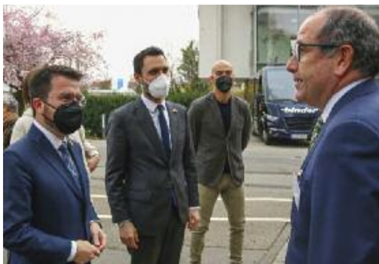
Aragonès i Torrent amb el CEO de l'empresa.

És per això que, tant el president Aragonès com el conseller d'Empresa, Roger Torrent, van viatjar dimecres fins a la seu de la companyia, a Stuttgart, per conèixer de primera mà l'empresa