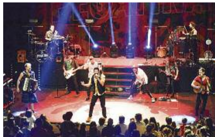
La Pegatina a la Polivalent.

Grup "adoptiu de Montmeló", La Pegatina desprèn energia, vitalitat, bon rotllo i talent. Estableix una química indescriptible amb el públic, a qui cuida i fa gaudir al màxim. La pandèmia va impedir a la banda completar la seva gira l'any 2020 i ara torna a l'escenari amb energies renovades. La primera estació, la Sala Polivalent. L'entrada costa tres euros i es pot comprar al Centre Cultural la Torreta.