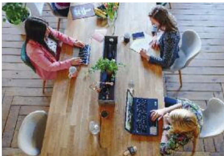
La taxa d'atur femení a la comarca és d'un 13,2%.

De fet, l'evolució mostra que anem a pitjor, perquè mentre que l'atur registrat el 2010 era gairebé igual per a ambdós sexes, amb un lleuger nombre major d'homes aturats, amb el pas dels anys i a partir del 2013 les dones han anat registrant un atur major fins a enguany, quan aquesta diferència s'intensifica més que mai. Una desigualtat que s'agreuja amb l'edat, especialment a partir dels 55 anys, on un