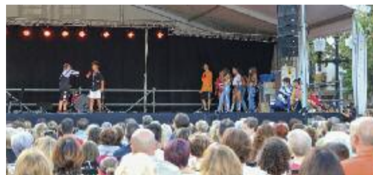
Una escena d'una Festa Major de la Llagosta.

El jurat seleccionarà les tres obres finalistes, i del 6 al 22 de maig, i a través de votació electrònica, votaran els veïns que vulguin –que tinguin més de 16 anys i que estiguin empadronats al municipi–. El lliurament de premis es farà el 24 de maig a les 19 hores. El primer premi rebrà 500 euros, el segon, 200 euros i el tercer, de 100.