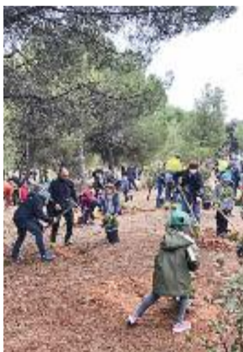
Els Pinetons, diumenge.

Tot plegat, en un judici que va quedar vist per a sentència, a l'espera de la segona cita amb els tribunals convocada per al 12 de maig. Serà aleshores quan es decidirà el futur de Bartés, que es va mostrar tranquil i content després del judici. "Això al final és un tràmit i ara hem d'esperar la sentència, que tardarà unes tres setmanes a sortir", deia. Fins aleshores, com afegia la seva advocada, "tocarà mantenir-nos fermes".