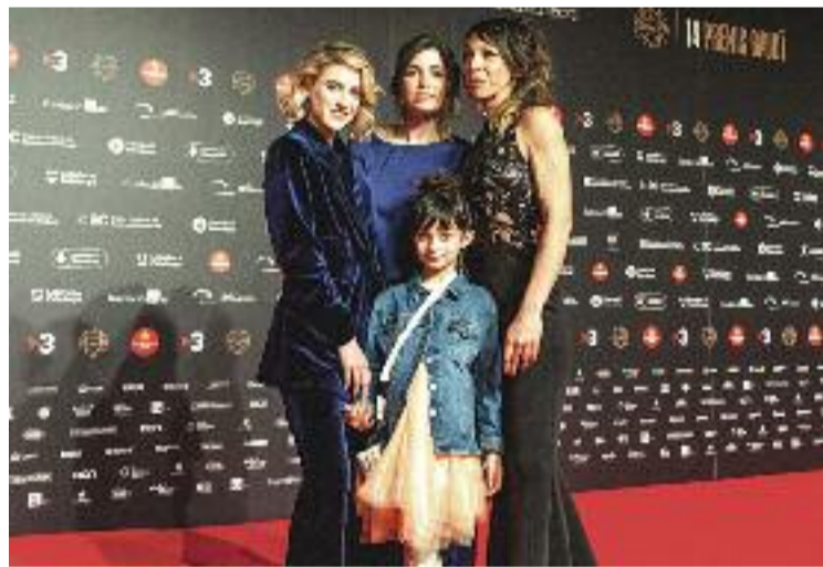
Besora (a l'esquerra) i part de l'equip d' Animal salvatge .

LLIÇA DE VALL ▶ L'Ajuntament inaugurarà divendres 18 de març el nou Casal de la Gent Gran del poble. Un nou espai ubicat a la planta de sota del Centre d'Atenció Primària de Lliça de Vall, que es presentarà en un acte obert a tota la ciutadania per tal que els futurs usuaris puguin conèixer les instal·lacions del que s'ha convertit en un equipament molt esperat al municipi.