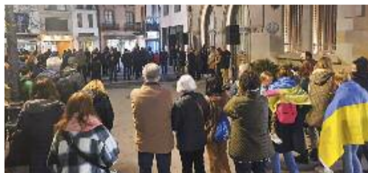
La ciutadania, concentrada per condemnar la guerra.

SOLIDARITAT ▶ Des de l'inici de l'ofensiva militar russa, són molts els granollerins que s'han bolcat amb la causa i han volgut ajudar els ucraïnesos, tant de dins com de fora de la ciutat. És per això que des de l'Ajuntament han habilitat un Punt d'Atenció a la Comunitat Ucraïnesa que ja ha atès, en només una setmana, 36 persones que fugien del país.