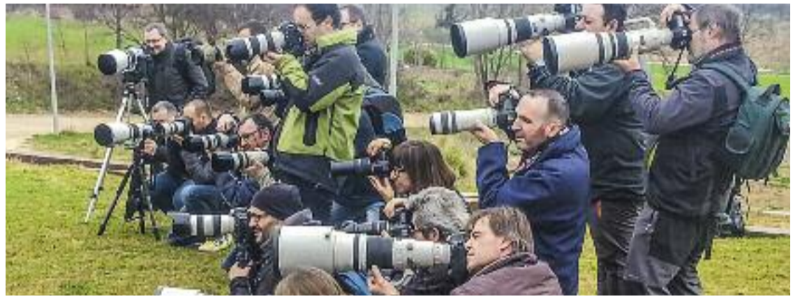
Membres de l'associació.

Amb tot, però, el futur de la fotografia tal com l'entén l'associació és incert. "Nosaltres som uns nostàlgics als qui ens encanta portar la càmera penjada al coll i no anar amb un mòbil a la butxaca", explica Portell. "Però sabem que el futur no és aquest i que tot evoluciona cap a un tipus de fotografia que nosaltres no promovem", afegeix.