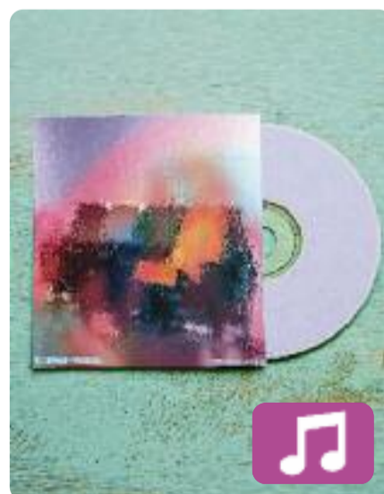
Cinema Ciudad Jara