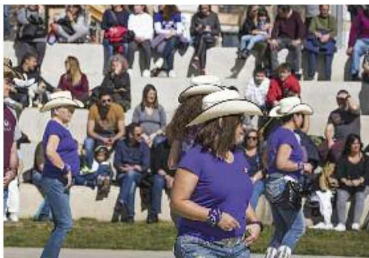
Ballada al parc Central.

Dissabte passat es van complir els pronòstics i va ser una gran jornada per als Joves diables de Santa Perpètua, amb la plantada de feres i l'aparició de