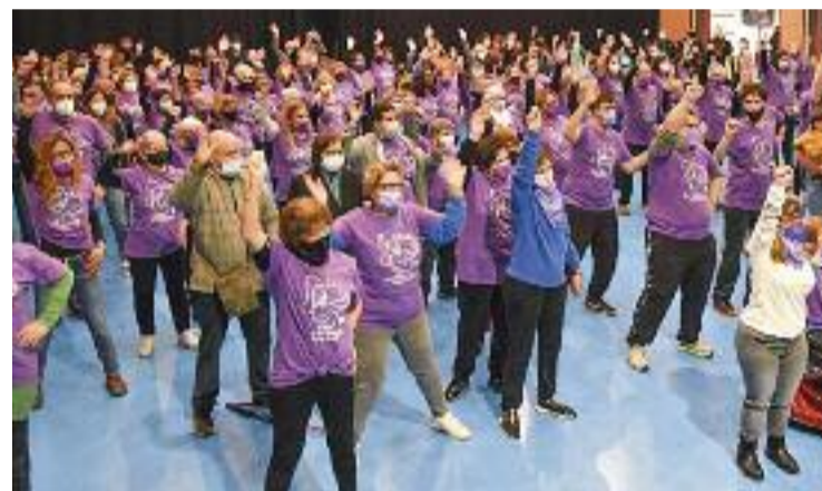
Montmeló va ballar per la igualtat.