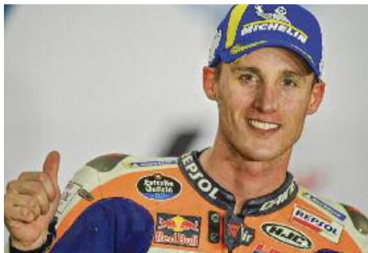
Pol Espargaró, tercer al GP de Qatar.