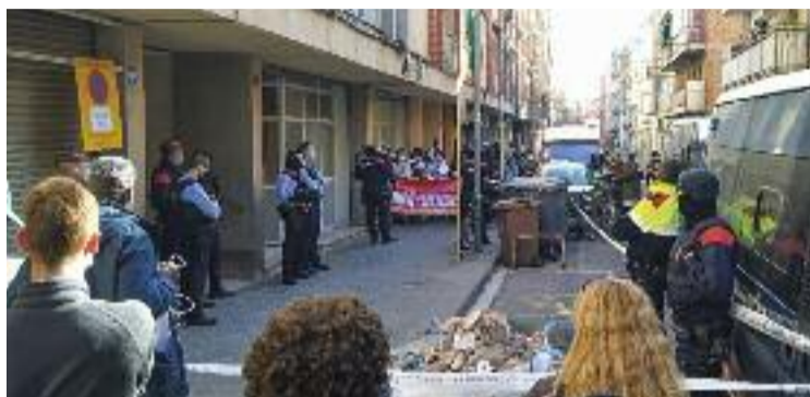
Un desnonament a Canovelles de fa tan sols un mes.

“Són xifres escandaloses que mostren el patiment de milers de persones per culpa de la crisi i la manca o caiguda d'ingressos, sumat als elevats preus de l'habitatge i la manca de polítiques valentes per revertir la situació”, diuen des de la PAH Mollet i Baix Vallès. I és que Catalunya és la comunitat autònoma on més desnonaments es fan de tot l'estat i el Vallès Oriental una de les comarques més afectades per aquesta problemàtica. Sobretot Granollers i els municipis que l'envolten, on l'any