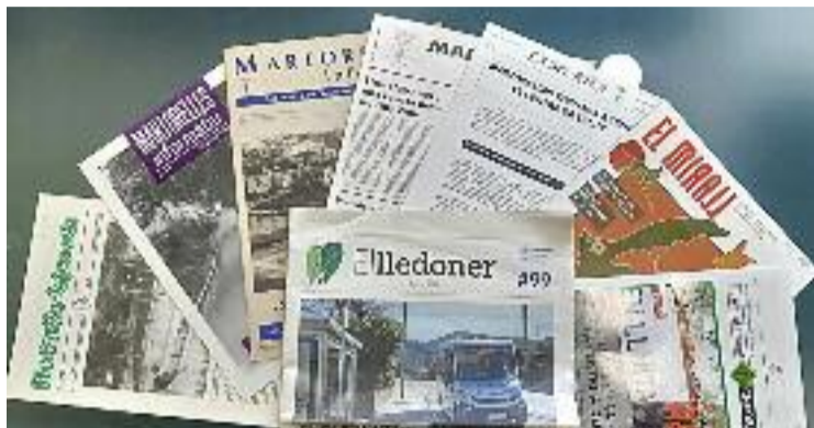
Els butlletins municipals que ha tingut Martorelles.

El desembre de 1995 va ser quan la nova publicació Martorelles avui prenia el relleu i, amb un format més gran i una maquetació més de diari que de revista, afegia versions en cas-