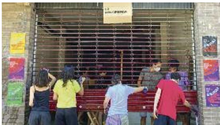
El local obrirà les portes oficialment, demà.

És per això que la PAH Granollers o la Coordinadora Feminista, per exemple, seran algunes de les entitats que faran ús del local, que ja compta amb més de 100 socis de totes les edats. “Persones que fan coses per mantenir