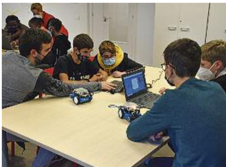
El catàleg d'extraescolars ofereix tallers de robòtica.

aconseguit que el nombre de nens inscrits a les extraescolars hagi crescut fins als 599 infants, 260 més que l'any passat. Tot plegat, amb un catàleg amb 137 propostes, dividides en set àmbits diferents: esport, activitats familiars, ciència i tecnologia, idiomes, reforç educatiu, arts, i lleure i participació.