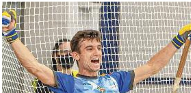
El CH Caldes competirà a la Golden Cup.

Els 12 clubs no havien arribat a cap acord amb la federació continental, la World Skating Europe Rink Hockey (WSE-RH), per a la reforma de l'Eurolliga. Volien crear una com-