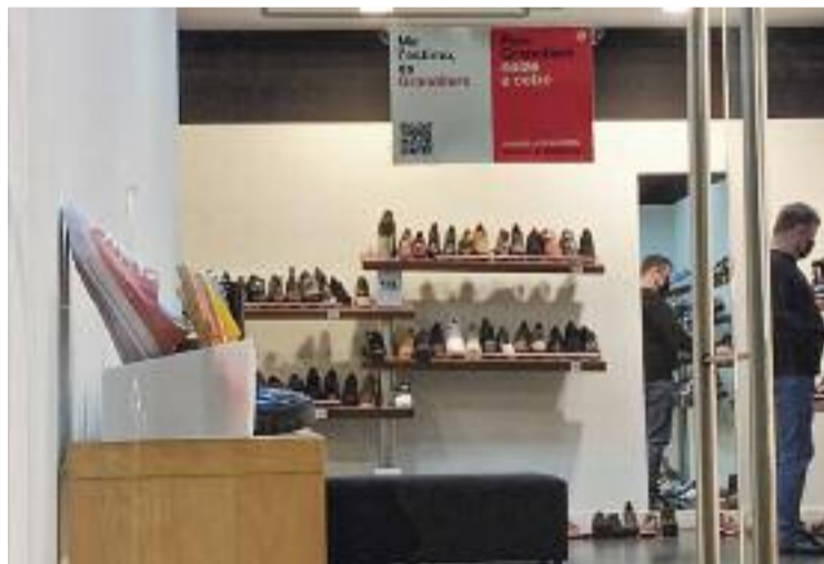
La botiga va obrir el 1971.