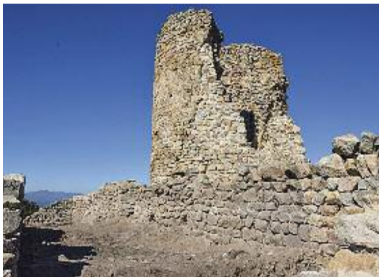
Torre de l'Homenatge del Castell de Sant Miquel.

El castell, construït el segle XI i abandonat el XV, va ser el centre de l'autoritat política no només de Montornès i Vallromanes, sinó també del Maresme. El motiu, la seva ubicació. I és que des de la construcció es podia tenir el control visual de les serralades Prelitoral i Litoral, el Montseny, Montserrat i els dos vallesos, entre altres. Un espai on es creu que vivia la gent més poderosa de la zona i que es va convertir en un punt clau per a la defensa del ter-