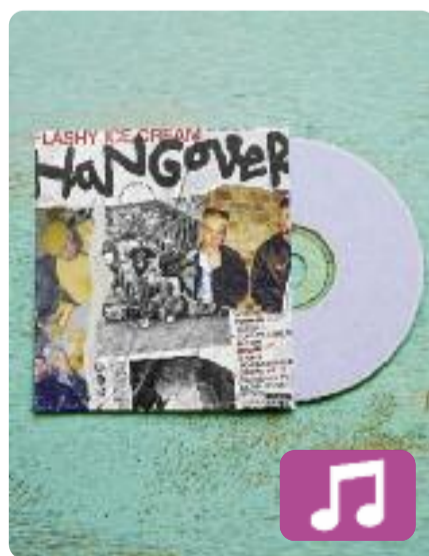
Hangover Flashy Ice Cream

Flashy Ice Cream va ser un dels primers grups de trap en català a agafar notorietat. Aquest mes de febrer, els de Sabadell publiquen el seu tercer disc, Hangover (Delirics), que vol dir "ressaca" en anglès. L'àlbum, en el qual han estat un any treballant, presenta quinze cançons i ja s'ha convertit en el treball discogràfic més ambiciós de la banda.