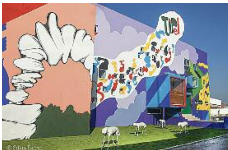
La Tipel fa 50 anys.

Segons explica, la Tipel és una de les poques mostres de pop-art, no només de Catalunya sinó d'Espanya. "I més tenint en compte que es va fer en plena dictadura franquista", diu el paretà. Un fet que ha portat a la fàbrica a ser un objecte d'estudi internacional, "malgrat que aquí, potser,