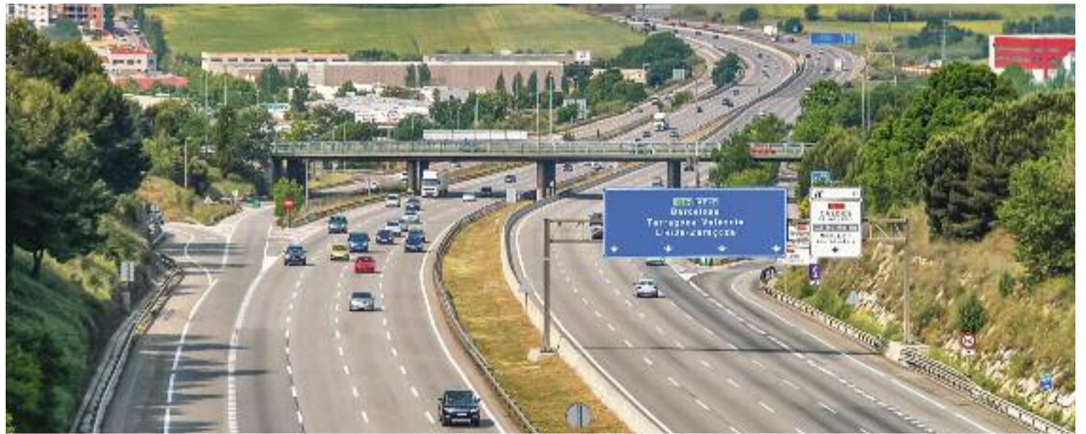
L'AP-7 passa a escassos metres del nucli urbà de Mollet, concretament pels barris de Can Pantiquet i Can Borrell.

Tot i que fa temps que es van instal·lar pantalles en aquesta zona per crear una barrera entre l'autopista i la ciutat i reduir així el soroll, segons Rodríguez hi ha punts on no hi ha res. "Concreta-