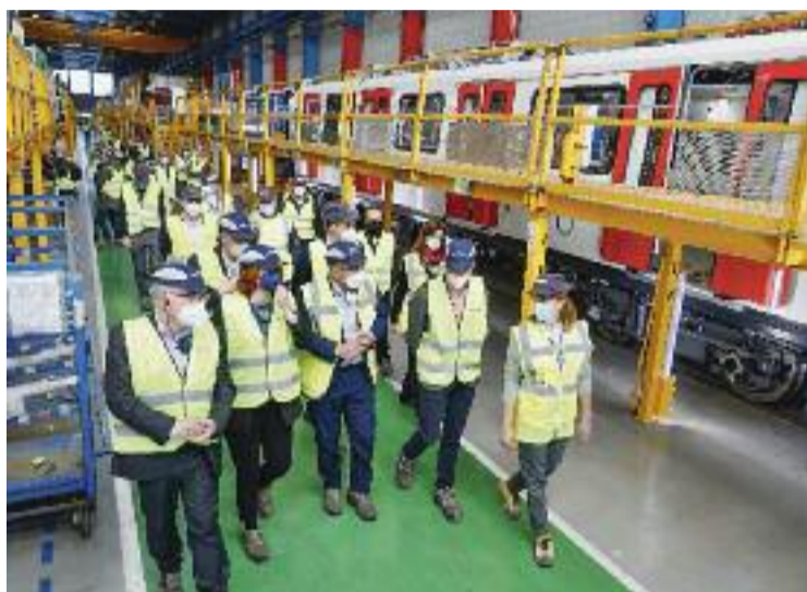
Un moment de la visita de dilluns de representants de TMB.

SANTA PERPÈTUA ▶ La planta d'Alstom de Santa Perpètua es troba a ple rendiment gràcies a la fabricació de nous vagons del metro. Així, la primera remesa dels dos nous models de trens de les línies L1 i L3, que substituiran els que tenen amiant, sortiran aviat de la planta i serà a finals de maig quan els combois comencin a prestar servei. El contracte contempla el manteniment dels combois durant els primers quinze anys.