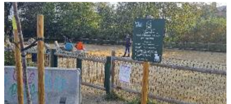
L'Ajuntament s'ha compromès a millorar els correcans.