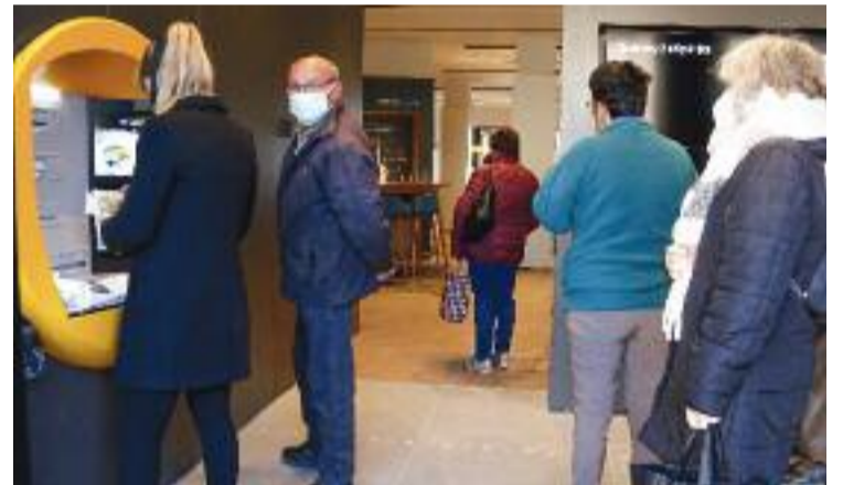
La gent gran necessita l'atenció del personal del banc.