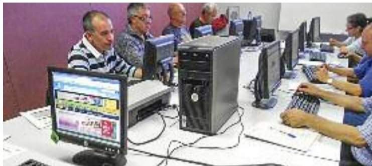
Imatge d'arxiu d'un curs de formació digital.

Per això, les diferents biblioteques de Granollers ofereixen una vintena de cursos gratuïts amb l'objectiu de reduir la bretxa digital. Unes activitats adreçades a la gent gran que s'estructuren en diversos nivells i que giren al voltant de diferents eines. Aquest mes de febrer, per exemple, el curs s'ha centrat a aprendre a navegar i crear arxius amb l'ordinador. Unes sessions que seguiran al març amb tallers on