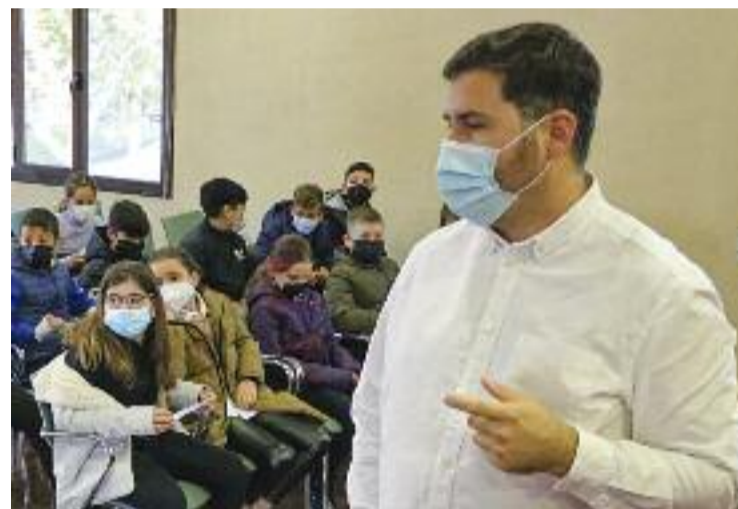
Sierra, en una imatge d'arxiu.

"Tothom sap que els bancs s'han convertit en un servei necessari i essencial per al nostre dia a dia. La seva atenció al client, per tant, hauria de correspondre a aquesta necessitat, però la realitat és que el servei ha empitjorat", conclou Sierra.