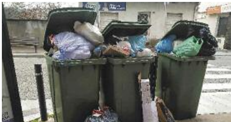
L'Ajuntament serà més estricte amb les escombraries.

La campanya, que té com a nom A Martorelles ho fem bé! , vol conscienciar els veïns sobre la importància de fer una bona