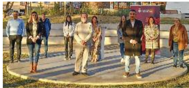
Equip de govern, format pel PSC i Sumem Esquerres.

Amb tot, però, Juzgado es va comprometre a seguir treballant en els projectes inacabats al llarg d'aquest 2022, mostrant-se "satisfet de la feina feta en tan poc temps" i agraït amb l'equip de govern i amb tots els paretans.