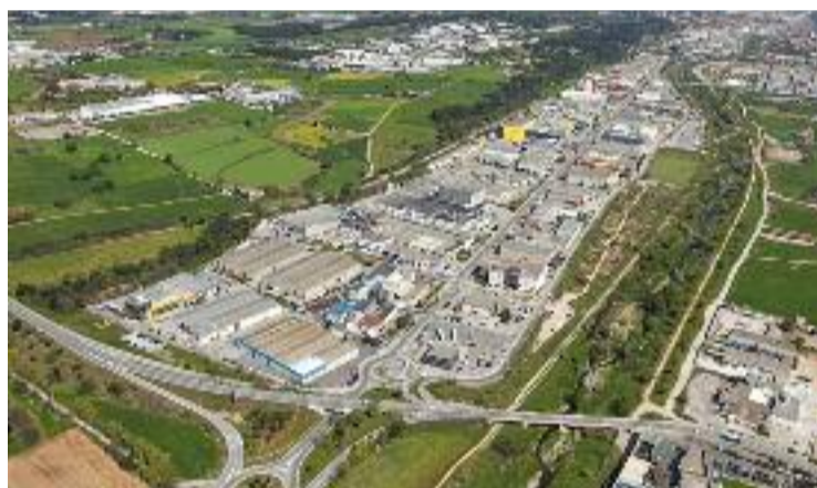
Polígon del Congost.

Una informació que des de l'Ajuntament no han confirmat encara que també hi ha "altres orígens que se situen fora del terme municipal i cal afinar la procedència per poder exigir a l'administració competent la seva actuació", diuen. Per això estan demanant la col·laboració ciutadana, per descobrir tots els focus existents.