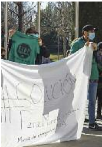
Protesta de la PAH.