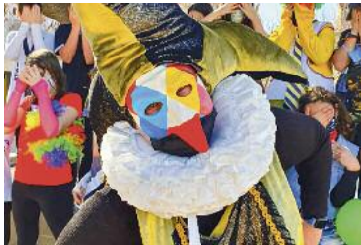
La imaginació és infinita en el concurs de disfresses.

El passat dimarts Activijoc va organitzar un taller infantil adreçat a infants a partir de 3 anys per crear "una divertida màscara" de diferents personatges (pirata, princesa, superheroi...). La imaginació és un gran poder.