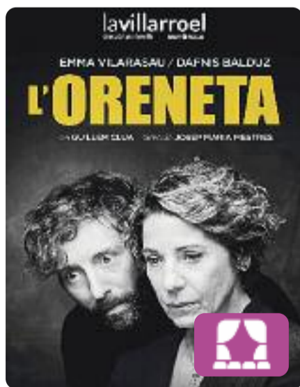
L'Oreneta Guillem Clua

Una professora de cant rep a casa un jove que vol millorar la seva tècnica vocal per cantar al memorial de la seva mare morta recentment. Ben aviat descobrim que la cançó triada, L'Oreneta , té un significat especial per als dos. Aniran desgranant detalls del seu passat, marcat per un atemptat terrorista de signe islamista. A la sala Villarroel de Barcelona.