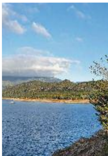
La sequera es fa notar.

LA ROCA ▶ L'Ajuntament de la Roca ha tancat l'accés a la Miranda d'en Puntetes, coneguda popularment com 'La Cúpula', situada a tocar de la ronda Nord de Granollers. Una acció que es fa amb l'objectiu d'evitar actes incívics en aquest entorn, com els abocaments de deixalles i els botellots, que s'havien convertit en una pràctica habitual en aquest entorn tan emblemàtic del municipi.