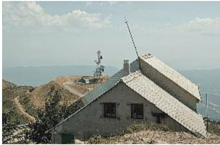
Observatori del Turó de l'Home.

Aquesta acció, però, ha tardat a fer-se efectiva. Ni més ni menys que 12 anys. Un traspàs amb el qual el SMC recupera totes les competències que tenia abans