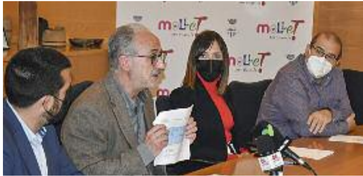
La presentació de la memòria feta dimarts.

Però, segons la Memòria 2021 de la Qualitat de l'Aire a Mollet, presentada dimarts, l'any passat "no es va sobrepassar cap dels límits legals anuals que estableix la Unió Europea en matèria de contaminació atmosfèrica", diuen des de l'Ajuntament. "A més, des de 2007, la tendència és notablement descendent", afegeixen.