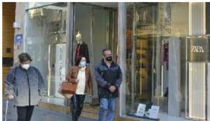
Zara tancarà el pròxim dimarts 25 de gener.

Aquesta pregunta aixeca neguit entre els granollerins. "És una putada que Zara tanqui, però encara més que Inditex estigui marxant a poc a poc de la ciutat, perquè les marques del grup atrauen