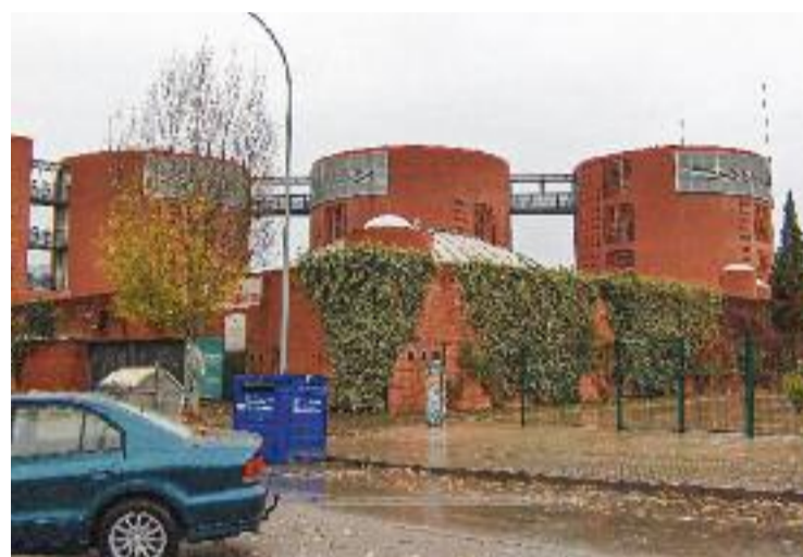
L'Institut Marina, de La Llagosta.

Són el fruit de la reunió entre diferents professionals, el maig de 2021, per abordar el contingut dels tallers per a l'alumnat de Secundària. Es va concloure que havien d'estar centrats en "les necessitats i interessos dels joves de la Llagosta".