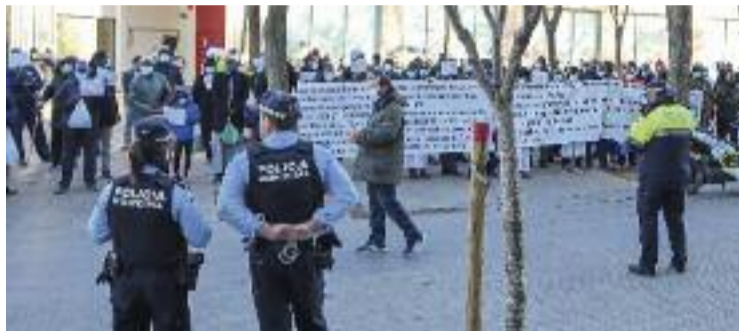
Protesta del 7 de gener, davant la casa de l'alcalde.