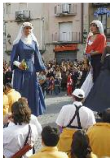
Ball de gegants.

Una nova etapa per al partit en què Vilaret buscarà "un lideratge col·laboratiu, proper i coral" i en què continuarà el tàndem amb López, "però amb un canvi de rols", conclouia.