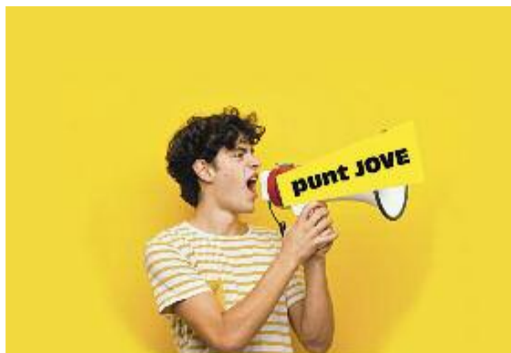
El nou logo del Punt Jove.