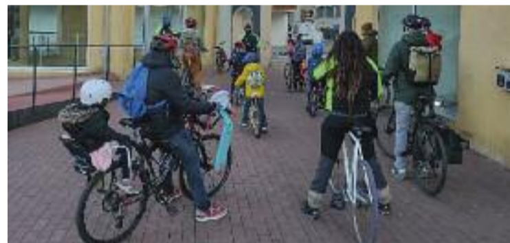
Bicibús, dilluns al matí.

MOBILITAT ▶ Cada vegada són més les famílies que se sumen a la mobilitat sostenible i que opten pel bicibús com a mitjà per portar els seus fills a l'escola. Un projecte que va començar a finals del curs passat i que ja està més a prop de consolidar-se perquè, segons explica el secretari de Granollers Pedala, Benjamí Aguilar, "la valoració fins ara és molt positiva i la gent que ve està molt contenta".