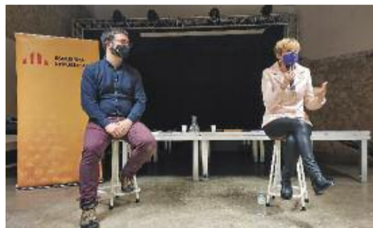
Carme Forcadell, durant la presentació.

«És importantíssim que es canviï la monstruositat de la presó preventiva. Mai no es recupera el temps perdut», va afegir Forcadell, per a qui «la veritable revolució del segle XXI serà la revolució feminista». «Una part d'aquest llibre tracta del que hem anat aconseguint a la presó, i l'origen d'algun d'aquests canvis prové d'aquest bolígraf i del motiu pel qual el faig servir», va detallar Forcadell.