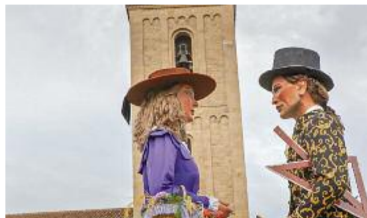
Imatge d'arxiu dels gegants a la Festa Major.

Amb tot, però, els paretans podran gaudir de la tradicional cercavila i del correfoc, de la 8a Fira Medieval, d'espectacles, d'una xocolatada i també de competicions esportives. Activitats que, com l'any passat, s'hauran de fer adaptades a la pandèmia, amb aforament, mascareta i distància, però que permetran al poble gaudir d'uns dies d'oci i cultura popular en el que tothom espera que sigui la darrera Festa Major amb presència de la covid-19.