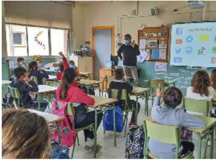
Imatge d'arxiu d'una classe de primària.

Segons la docent, només dos mestres de cada centre poden fer aquests viatges d'una setmana que, per ara, estan programats a Finlàndia, Itàlia o Portugal. “Però després, en arribar de nou a l'escola, s'ha de fer una gran tasca per posar-ho tot en comú