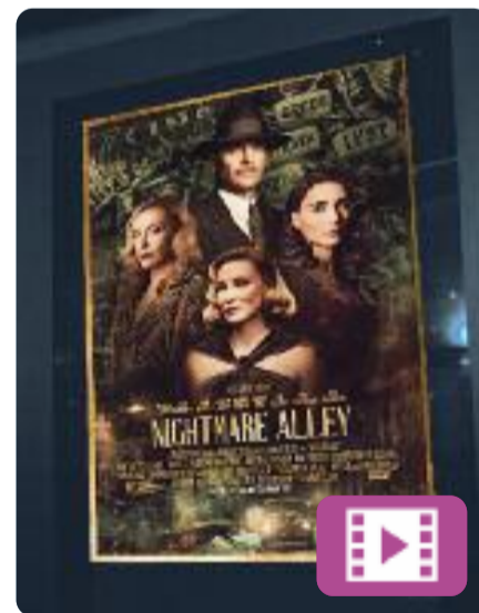
El callejón de las almas perdidas Guillermo del Toro

Guillermo del Toro presenta aquest re-make de la pel·lícula de 1947 El callejón de las almas perdidas , en què Bradley Cooper es posa a la pell d'un home ambició, amb talent per a la manipulació i l'engany. El protagonista coneix una pitonissa tan perillosa com ell, interpretada per Cate Blanchett, que es convertirà en la seva aliada per estafar milionaris.