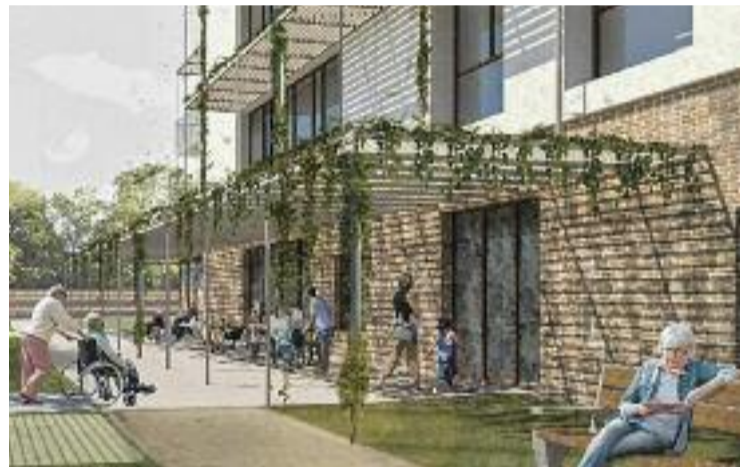
El projecte de la nova residència de gent gran.

Una vegada han finalitzat els tràmits administratius previs necessaris, les obres han començat amb l'adequació dels terrenys, que són necessaris per a l'edificació de la nova residència d'avis, que estarà ubicada al costat de La Fireta.