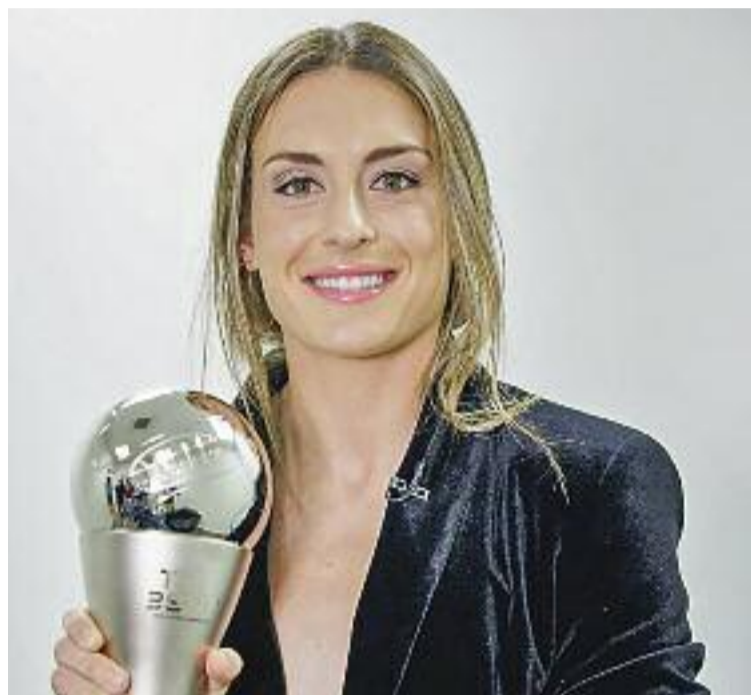
Alèxia Putellas amb el trofeu The Best 2021 i celebrant el gol de la victòria en les semifinals de la Supercopa.

La capitana del Barça ha trobat l'equilibri: domina la tècnica i la tàctica, té talent i una gran visió de joc, i mai es conforma. "És la jugadora perfecta", aporta Chantal Reyes ( Mundo Deportivo ),