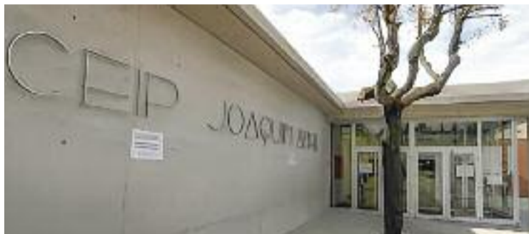
Imatge d'arxiu de l'Escola Joaquim Abril.

Segons un comunicat que ha publicat la nova associació de mares i pares del col·legi, el 12 de gener haurien enviat un burofax a l'escola demanant que se'ls informés sobre el compliment de la sentència i avançant que, si no es rebia una resposta en el termini de cinc dies, es denunciaria el cas al Tribunal Superior de Justícia de Catalunya. Un fet que des del centre no han pogut confirmar, perquè