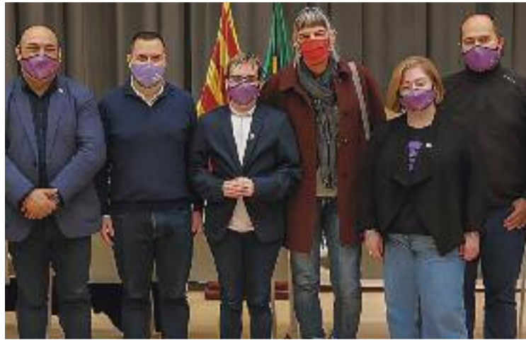
El 25 de novembre el van nomenar regidor.

Mayolas, però, ja era conegut al poble pel seu activisme amb TLGB Bigues i Riells, una associació que lluita pels drets del col·lectiu LGTBI+ a la comarca i per donar-li visibilitat. Precisament per això li van oferir el càrrec. “Feia temps que des de l'Ajuntament volien crear aquesta re-