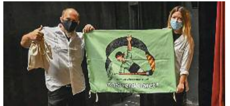
La colla ja fa tres dècades que existeix.

CULTURA ▶ El 2022 els Castellers de Mollet compleixen, ni més ni menys, que 30 anys. Un aniversari especial que la colla ja està començant a preparar amb l'elecció d'una nova junta i equip tècnic, però també amb una primera proposta: un concurs per dissenyar el logotip que lluiran als actes relacionats amb la celebració.