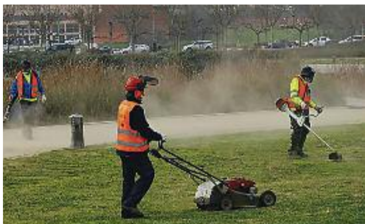
El Consistori rep aquesta subvenció des de 2008.

"Les actuacions estan orientades a la millora de la formació i ocupació de les persones del barri de Can Folguera, a qui s'adreça especialment la convocatòria", expliquen des de la Regidoria de Desenvolupament Local. Com a novetat, en els programes d'experimentació laboral s'ofereix l'acció Agents de digitalització , en què dues persones són contractades sis mesos per a donar suport en les gestions i tràmits digitals per garantir l'accés a l'administració i serveis digitals a la ciutadania. A més, oferirà eines per a reduir la bretxa digital i garantir la connexió social (xats,