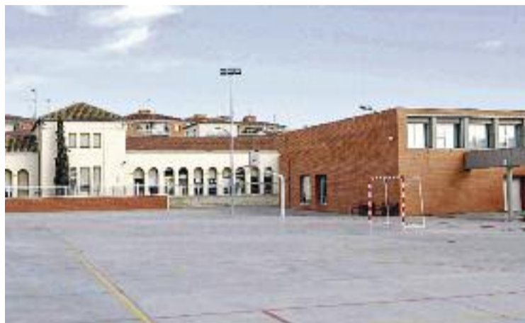
El pati de l'escola Lluís Piquer.

"No tenim cap problema amb aquest canvi perquè hi ha una diferència de 30 o 40 metres i, al cap i a la fi, la ubicació serà molt similar", diu Sònia Lloret, secretària de direcció del centre. "L'únic inconvenient que hi pot haver és que el nou edifici estarà més a prop de la carretera i, per tant, tindrà més soroll, i que hauran de treure una part de pàrquing per construir-lo", afegeix. Tot i que