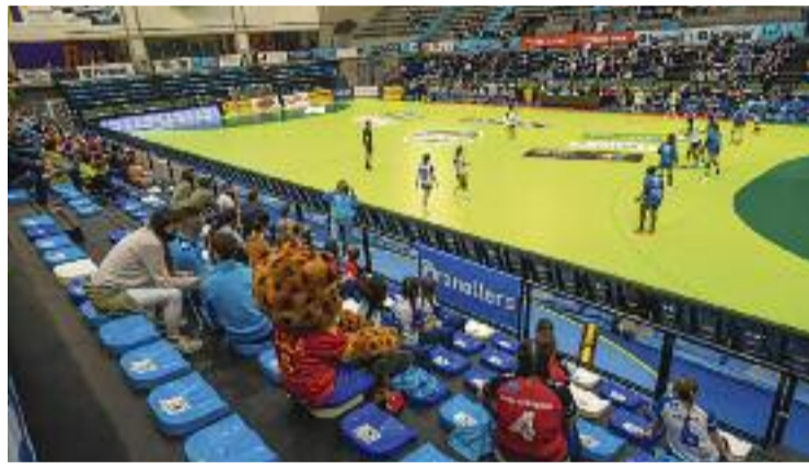
El Mundial acabarà diumenge amb la final del campionat.