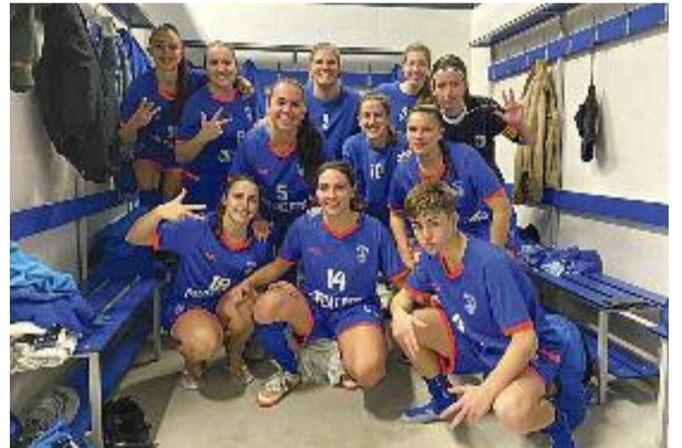
El CN Caldes, després del triomf contra el FS Sabadell.

També està perdent punts últimament el CFS Castellón, que ha cedit dos dels seus tres empats en els últimes dues jornades, contra l'AE Peña Esplugues i el FSF César Augusta pel mateix resultat. Precisament el FSF César és el tercer amb tres punts menys que el líder i a qui li interessa un empat en el gran duel de la jornada.