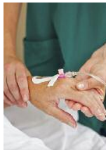
Pacient i cuidadora.

velló”, explica. Però l'equipament està situat en una zona residencial, lluny del centre, amb pocs bars i sense gairebé cap botiga. “Per això se'ns fa difícil valorar si els guanys que hem tingut han estat gràcies al mundial”, diu el comerciant. “Tot i que sí que és cert que, entre setmana, al centre s'ha notat una mica més d'ambient de l'habitual”, conclou.