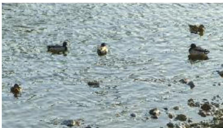
El Besòs s'ha anat recuperant de l'incendi de Ditecsa.

Entre el desembre del 2019 i el juliol del 2020 es va activar el pla de xoc per començar a mitigar l'impacte de l'incendi en el medi natural. Sis mesos després els mostrejos van assenyalar que la contaminació i la toxicitat quasi havien desaparegut. Hi quedava un plomall d'aigua subterrània contaminada en un radi