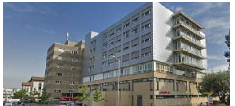
L'Hospital de Granollers.

COVID-19 ▶ La sisena onada de la pandèmia ja és aquí. Així ho confirmen els experts després que, en els darrers dies, s'hagin tornat a disparar els principals indicadors de covid-19. Un fet que torna a posar a Granollers en una situació d'alerta, en situar-se en 1.202 punts el risc de rebrot a la ciutat. Una xifra que, segons l'OMS, no és recomanable que passi de 200.