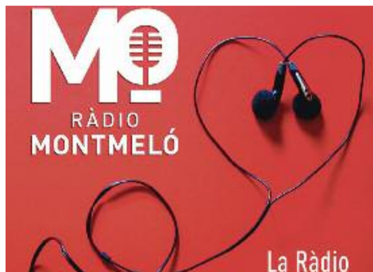
L'anunci del retorn de la ràdio municipal.

Ràdio Montmeló es podrà escoltar a radiomontmelo.cat i els oients també podran aprofitar els perfils a Facebook, Instagram i Twitter (@radiomontmelo). Qui vulgui formar part del nou projecte pot enviar un correu electrònic a radiomontmelo@montmelo.cat .