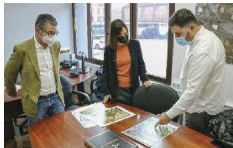
La masia Can Baqué tindrà nous usos.

Els diputats del PSC van explicar les esmenes que han presentat als pressupostos de la Generalitat i que afecten la Llagosta. Reclamen la rehabilitació del Centre de Formació de Persones Adultes, la reforma integral de l'Escola Sagrada Família i l'eliminació de barreres arquitectòniques a l'Institut Marina. A més, volen la creació d'un accés nord entre la C-17 i la C-33, que beneficiaria també a la ciutadania de la Llagosta.