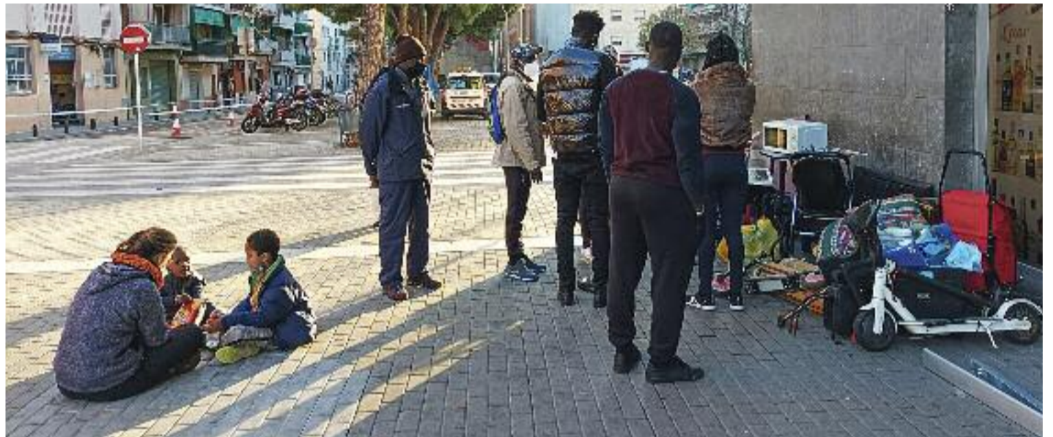
Hi ha famílies migrants que acaben patint un desnonament per les dificultats econòmiques que pateixen.