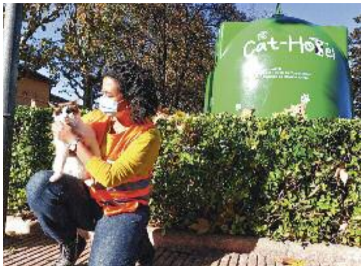
Una voluntària amb un gat i un dels contenidors refugi.

El Consorci de Residus del Vallès Oriental ha facilitat a l'Ajuntament una dotzena de contenidors, que ja han estat pintats