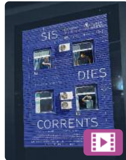
Sis dies corrents Neus Ballús

Sis dies corrents narra una setmana a la vida d'en Moha, en Valero i en Pep, tres treballadors d'una petita empresa de fontaneria dels afores de Barcelona. En Moha, el més jove, està en període de prova i després haurà de substituir en Pep, a punt de jubilar-se. En Valero no ho veu clar: en Moha no està a l'altura i creu que els clients no acceptaran un marroquí.