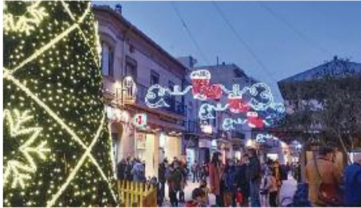
Imatge d'un dels eixos comercials el dia de l'encesa de llums.

"Abans de la pandèmia la majoria d'entitats es van ensorrar per raons polítiques i econòmiques i perquè cada vegada era més comú el passotisme", diu Vendrell. Una manera de referir-se a aquella actitud basada, diu, en el fet que "si el teu negoci et va més o menys bé i amb prou forces el sustentas, passes de fer l'esforç extra que suposa tirar endavant una associació i ajudar als altres", afegeix. De fet, quan es truca a totes les associacions de comerciants que recull la pàgina web de l'Ajuntament, la resposta és sempre similar: "Fa temps que no funcionem com a associació" o "T'has equivocat de número perquè des de fa almenys dos anys aquesta