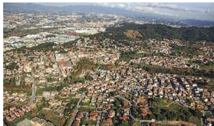
Pla d'Urbanització Urbanística Municipal (POUM).