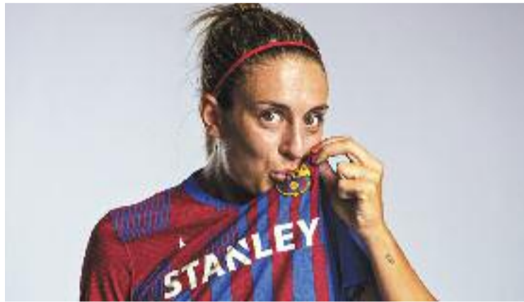
Alèxia Putellas és una gran estrella del futbol.