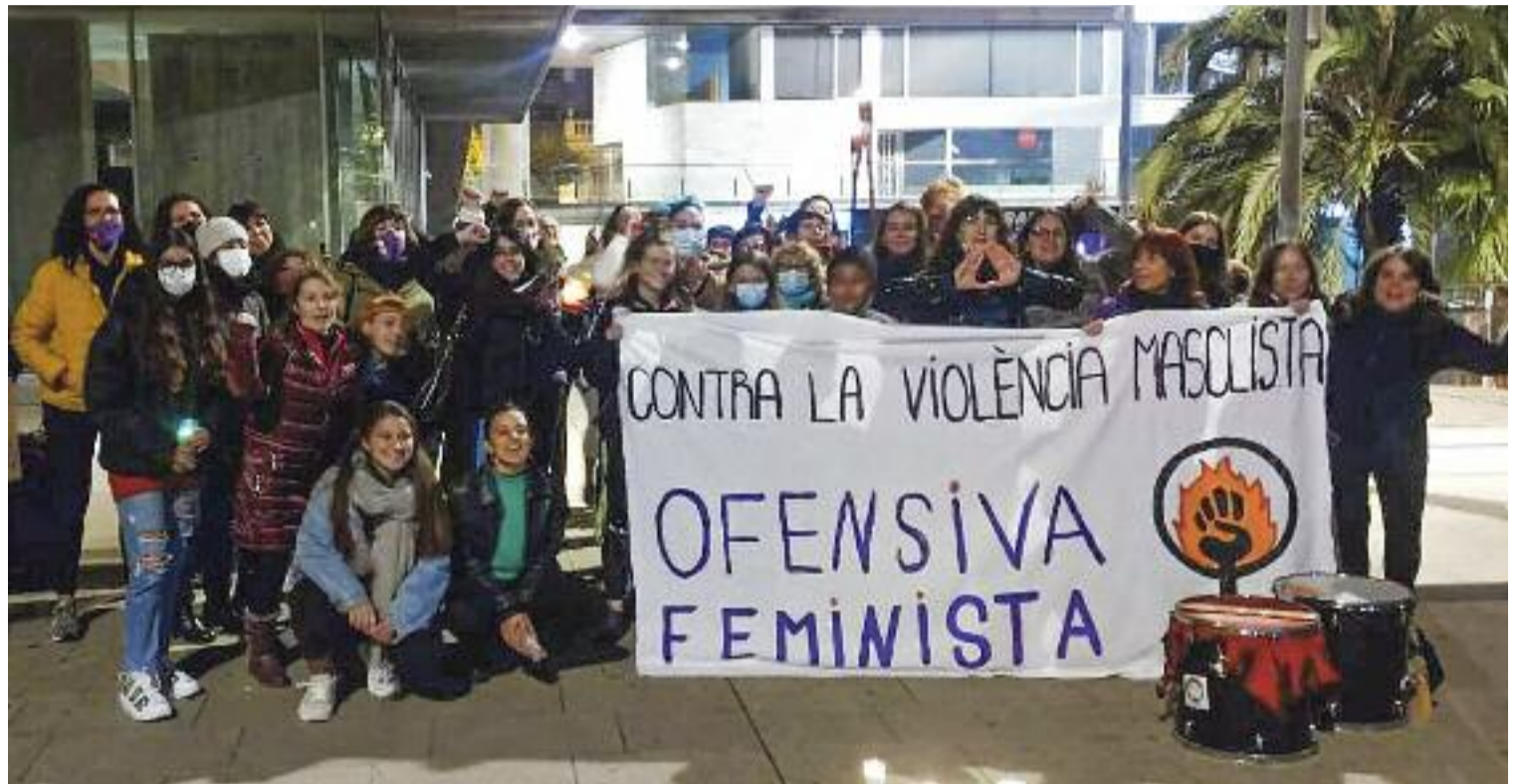
El col·lectiu feminista de Mollet va fer una marxa de les torxes per denunciar la violència masclista.