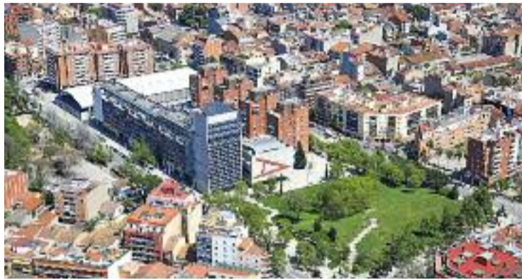
L'antic Pla Urbanístic és del 2003.

Però aquests dos partits polítics no només han mostrat el seu rebuig a urbanitzar el Calderí. Com també l'Associació de Veïns de Santa Rosa, que ha presentat al·legacions al POUM perquè no vol que als Pinetons es construïxin els 133