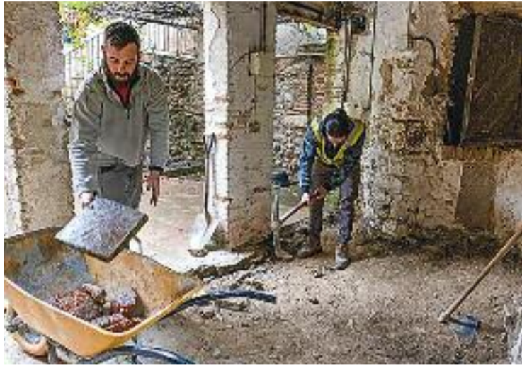
Una imatge de les excavacions.

SANTA PERPÈTUA ▶ Ja han començat les obres d'excavació arqueològica del pati interior del conjunt monumental de Santiga. Són treballs previs a la segona fase de la rehabilitació del conjunt arquitectònic de l'església de Santiga, catalogada com Àrea d'Expectativa Arqueològica. L'objectiu de l'actuació és ampliar la documentació arqueològica i obtenir resultats concloents sobre l'existència a la zona d'una vila romana rellevant.