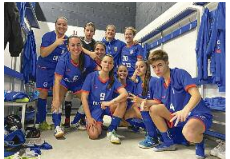
El CN Caldes, després d'una victòria aquest curs.

Per la seva part, la Concòrdia, animat pel seu gran triomf per 8-2 contra el CE Futsal Grup Mataró, s'enfrontarà, també demà, al FS Ripollet a domicili amb la intenció de sumar la seva quarta victòria.