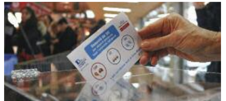
Cada tiquet són 3 euros de menjar fresc.

SOCIETAT ▶ Ja s'apropa Nadal i, com cada any, el Gran Recapte ha tornat per ajudar els més necessitats. Una edició que, als establiments, conclou justament avui després d'una setmana en què, de nou, s'ha optat pel format virtual, canviant la tradicional recollida d'aliments per les aportacions econòmiques.