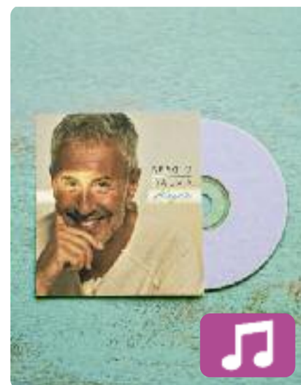
Alegria Sergio Dalma

Sergio Dalma torna a la càrrega amb la publicació d'un nou disc, el 21è de la seva carrera. Alegria és el títol d'aquest àlbum que va crear durant l'aturada (forçada per la pandèmia) de la gira del seu disc anterior, Treinta... y tanto . De fet, enllaçarà el final d'aquella gira amb l'inici de la del nou disc. Amb 57 anys, el músic sabadellenc demostra que no té aturador.