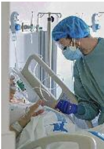
Més casos de Covid-19.

SALUT ▶ Els indicadors de Covid-19 han tornat a augmentar a Granollers. I és que, segons les dades publicades ahir per l'Ajuntament, en tan sols set dies s'han doblat els casos de coronavirus, en augmentar de 43 a 90. Un increment que ha anat acompanyat d'un augment del risc de rebrot, que s'ha disparat del 175 al 574, xifra que l'OMS considera "molt alta" un cop supera els 200 punts.