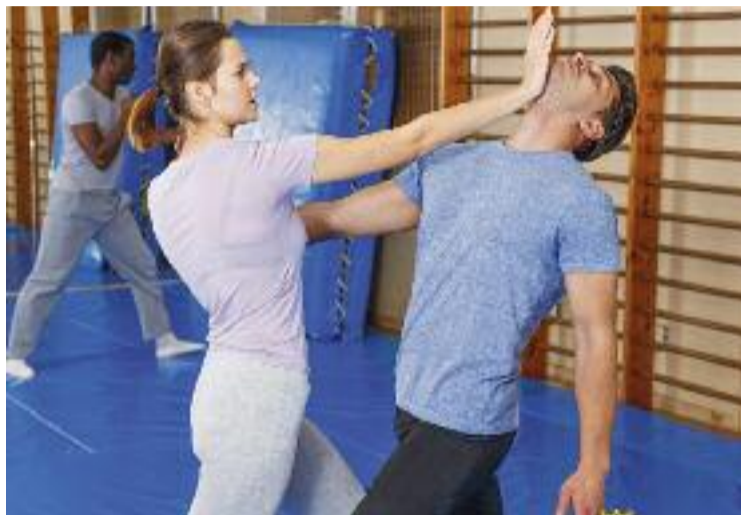
Sant Fost va celebrar activitats amb motiu del 25N.

Adreçades a tots els públics i pensades per prevenir les diferents violències contra les do-