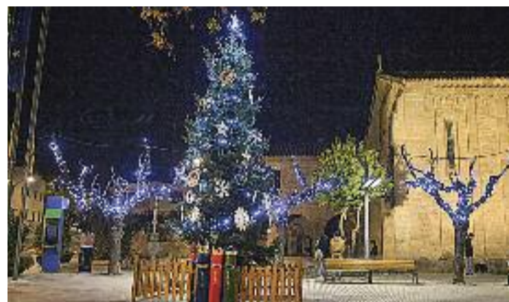
La plaça de la Vila ja està a punt pel Nadal.

"Tot i que nosaltres no comencem la campanya de Nadal fins al dia de la loteria, que és quan la gent ve molt més a comprar, està bé que encenguin ja els llums a veure si així s'engega abans l'esperit nadalenc i les ganes de comprar", diuen des de la Joieria Mirall. Una opinió compartida per la botiga Espai Llar Angelina, des d'on pensen que "tot i que la necessitat de comprar és la mateixa, com més ambient nadalenc més surt la gent a passejar i veure els llums, i més acaba comprant".