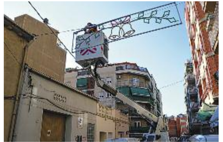
Col·locació de les llums de Nadal.

Per altra banda, l'Ajuntament de la Llagosta ha començat recentment a fer les obres per tal de condicionar un aparcament gratuït a la zona de les Planes. Els terrenys estan ubicats al costat del recinte firal.