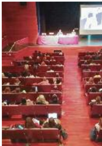
Taula de Salut Jove.

De fet, la salut mental i la gestió emocional van ser els temes centrals de la jornada. Dos aspectes que es van tractar a través de diferents xerrades en què els professionals van conèixer les millors eines per fer un acompanyament emocional de qualitat. Una manera de fer que els joves resolguin les seves angoixes i necessitats emocionals amb èxit, traient-los la por de parlar dels seus sentiments.