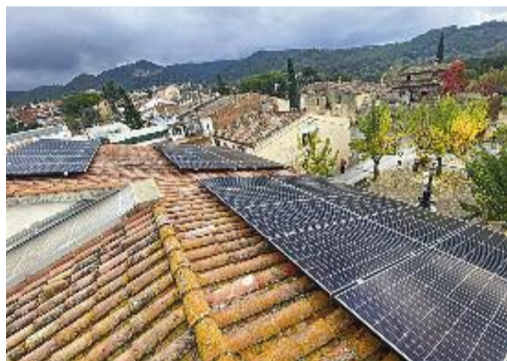
Plaques fotovoltaïques a la teulada de l'Ajuntament.

Amb un cost de 13.800 euros, l'actuació està totalment subvencionada per la Diputació de Barcelona i s'emmarca en la línia d'ajuts a projectes d'Economia Baixa en Carboni, que estan promoguts per Entitats Locals. Està gestionada per l'IDAE i cofinançada pel Fons Europeu de Desenvolupament Regional (FEDER). El propòsit és l'aposta per una economia més sostenible i neta.