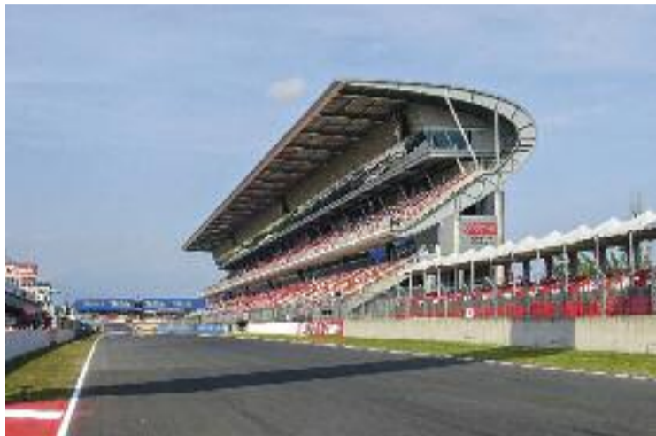
El Circuit ja ha arribat a les tres dècades.

MONTMELÓ ▶ La Festa 30 és el nom oficial de la celebració del 30è aniversari del Circuit de Barcelona-Catalunya, que demà obre les portes, de 9 a 17 hores, amb propostes per a tots els públics. Al pàdoc es col·locarà un escenari per on aniran passant artistes com Dàmaris Gelabert (11.30 h), Superherois (13 h), Beatles for Kids (14.30 h) o Lali BeGood (16 h). Hi haurà moltes propostes per a la mainada (inflables, llits elàstics, cotxes de pedals, mini autos de xoc...).