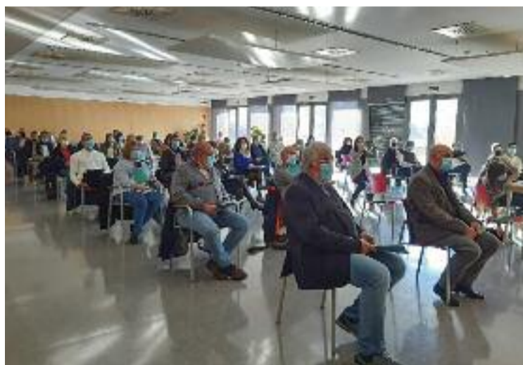
Novena Assemblea del Consell de la Gent Gran.

De fet, el benestar i la dignitat de la gent gran van ser dos dels temes centrals a debatre, juntament amb la necessitat de fer un Consell de Gen Gran més actiu i participatiu, en ser l'òrgan de consulta, participació i implicació de totes aquelles qüestions que afecten el col·lectiu, més important de la comarca. Per això, es va triar una nova Comissió permanent, que fa una funció similar a la d'una junta directiva, i es van definir noves funcions que afavoreixin, d'una banda, l'envelliment actiu de la gent gran vallesana i, de l'altra, la dotació de recursos i polítiques per al col·lectiu.