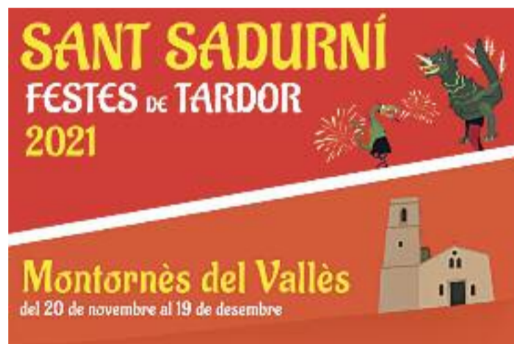
Cartell de les Festes de Tardor.

Diumenge al matí serà el moment d'un nou ral·li fotogràfic de Sant Sadurní. Aquest cap de setmana el Club Tennis Montornès celebrarà el seu Open de Sant Sadurní. Dissabte al matí es podrà participar en la iniciativa de l'AE Lleure Montornès, que inclou una cursa d'orientació i una sardinada solidària amb La Marató de TV3 amb la solidaritat.