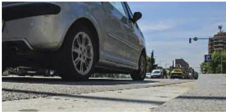
Carrers com l'Avinguda del Parc podrien entrar a la ZBE.

Des de l'Ajuntament, però, sembla que encara no han començat a plantejar-se quin d'a-