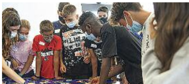
Activitat per a joves a Cal Jadiner.

Tal com està plantejat, el pla s'estructura en quatre eixos principals: salut, lleure, igualtat de gènere i ocupació. De fet, dona importància a la salut mental i a la prevenció del bullying o de la drogodependència, a fer del Casal de Joves un espai referent per al jovent, al col·lectiu LGTBI i a fer més fàcil l'accés al món laboral. Measures concretes que, segons l'Ajuntament, sorgeixen d'una anàlisi prèvia de les necessitats dels joves. Tot i que part del jovent