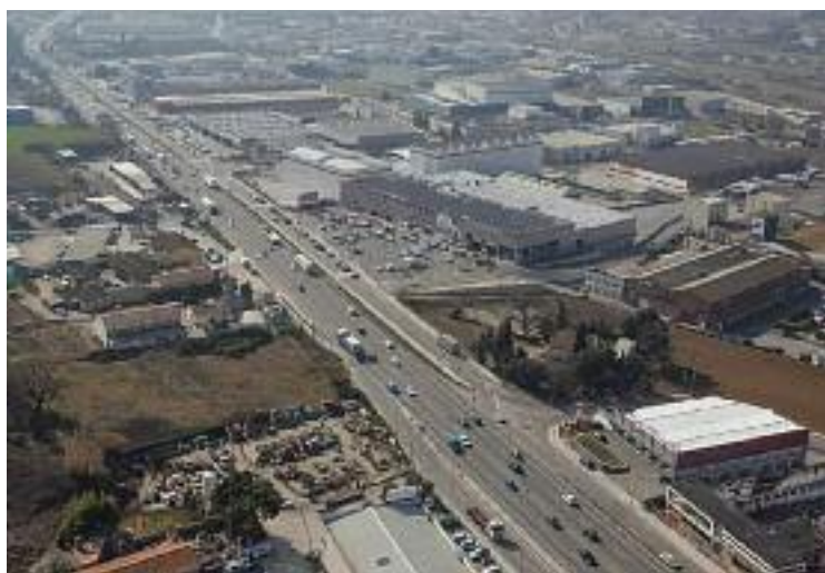
La C-17 al seu pas per Parets.