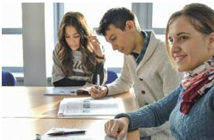
El programa contra l'abandonament escolar és un dels projectes.

Les tres iniciatives amb més suports van ser les màquines de retorn d'envasos amb incentius (326 vots), el programa contra l'abandonament escolar (280