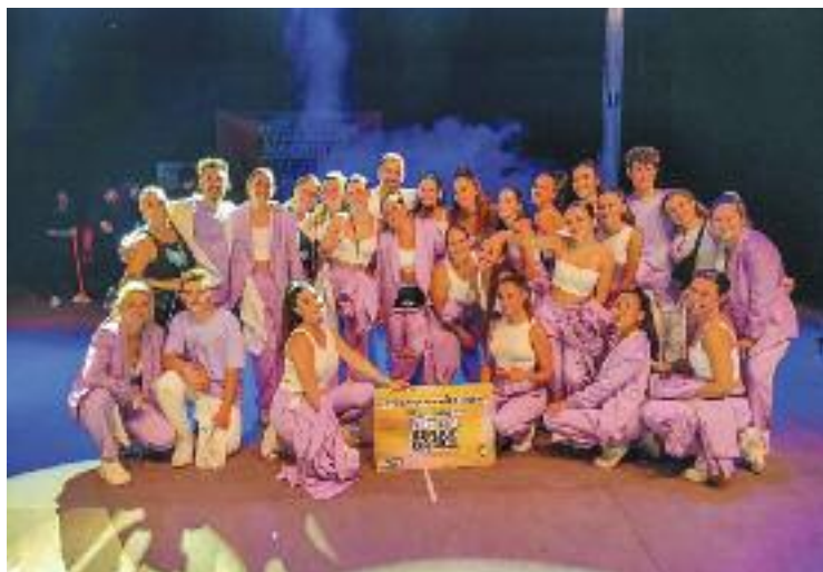
Megacrew recollint el primer premi a Múrcia.