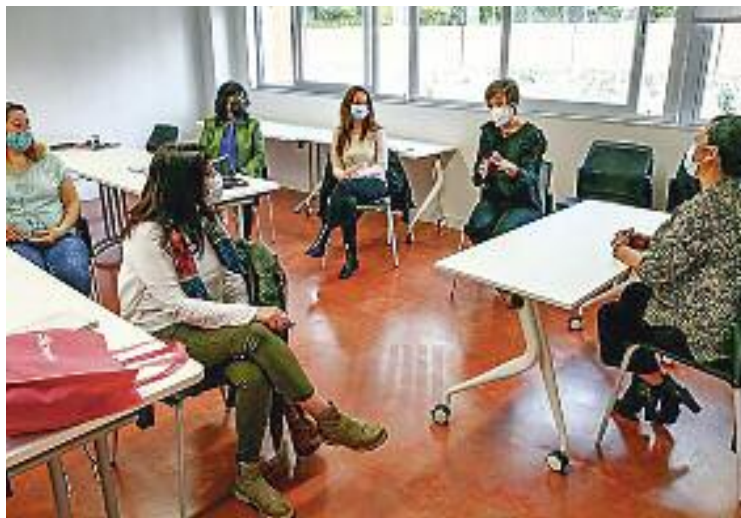
Una sessió de Dones Competents.

Des del gener, quan va començar la novena edició del programa, Dones Competents