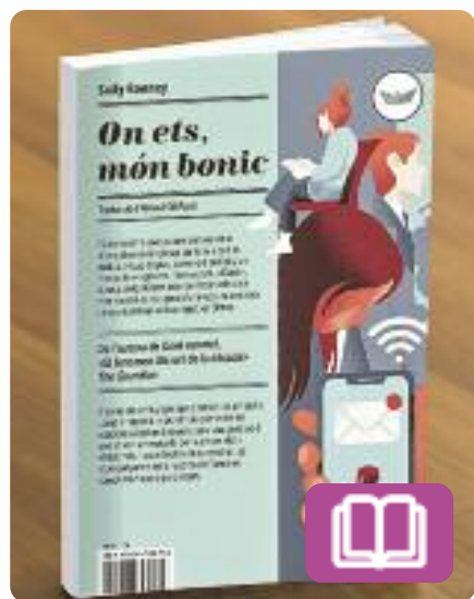
On ets, món bonic Sally Rooney

L'Alice se n'ha anat a viure a un poble on ningú sap qui és. Allà coneixerà un noi. Mentrestant, a Dublín, la seva amiga intenta arribar a final de mes mentre es recupera d'una ruptura amorosa flirtejant amb un vell conegut. Un reflex de la importància que tenen les relacions afectives i sexuals per a una generació amenaçada per la precarietat i el desencís.