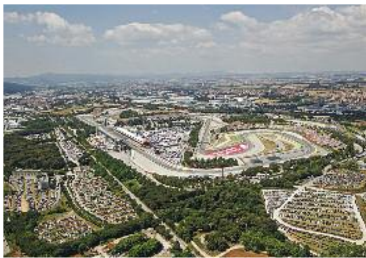
El Circuit Barcelona-Catalunya.

"La renovació suposaria, com a mínim, una inversió de 125 milions d'euros per any del Govern català per una activitat que no és d'interès públic ni repercuteix