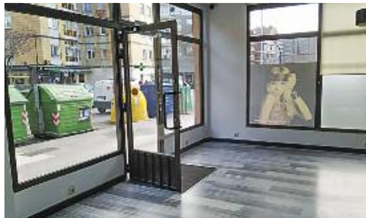
Una planta baixa buida d'un local comercial.

També s'aixeca la suspensió de les llicències de canvi d'ús de les plantes baixes de local a habitatge que es van suspendre durant la tramitació del Pla. Així, seran aprovades només les que s'ajustin a la nova normativa.