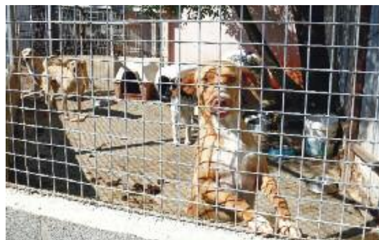
Adyla treballa pel benestar dels animals.

Però les tasques que realitzen són molt diverses. Des de l'esterilització de gats fins a la creació de campanyes sobre el respecte animal. Tot i això, una de les seves feines més vistoses és la de participar en fires animalistes o la d'instal·lar paradetes benèfiques, com la que van muntar a Sant Fost fa uns quants dies.