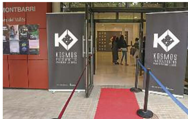
Entrada a la gala de la Mostra Crispeta d'Or del 2019.

Les bases han estat consensuades entre el departament municipal de Joventut i l'equip de joves que impulsa l'activitat a través dels pressupostos participatius Kosmos 2021.