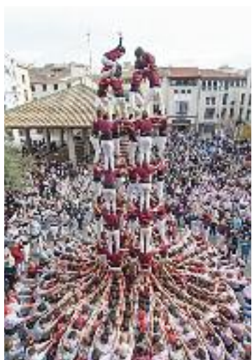
Actuació dels Xics.