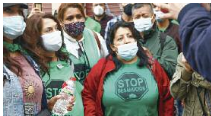
La PAH es mostra crítica amb el consistori paretà.

“Però la solució no és deixarlos al carrer”, diu Ramón. Per això, la PAH ha reclamat que l'Ajuntament paretà faci alguna cosa al respecte. “De moment hem aconseguit que paguin una pensió per als nens durant 15 dies. Però després seguiran en la mateixa situació”, lamenta Ramón.