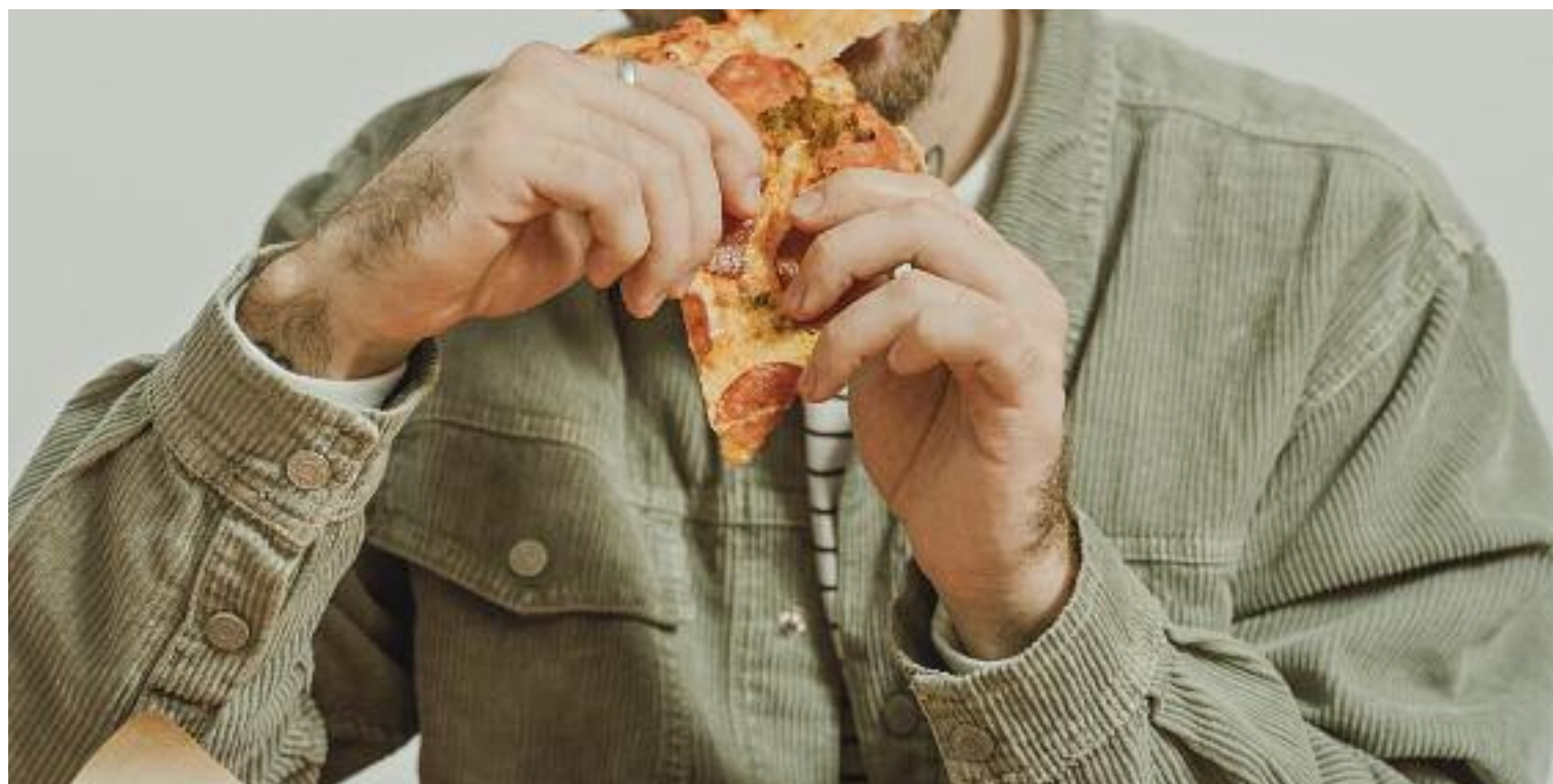
Els menjadors compulsius no poden controlar les seves ganes de menjar: una malaltia poc reconeguda i difícil de tractar.

"Em veia grassa i, com que no m'agradava a mi mateixa, no em socialitzava ni sortia de casa", diu. Una percepció influenciada