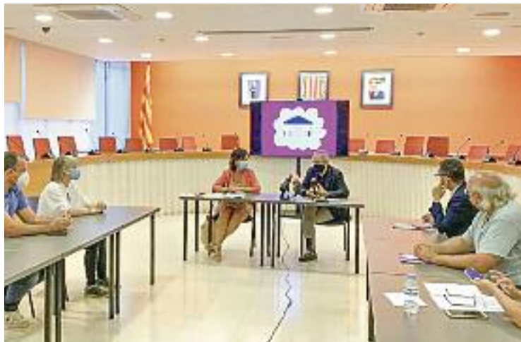
Presentació dels nous Pressupostos Participatius, dilluns.

Tot i això, no serà fins al 15 d'octubre quan la ciutadania podrà començar a presentar les seves propostes. Un procés que