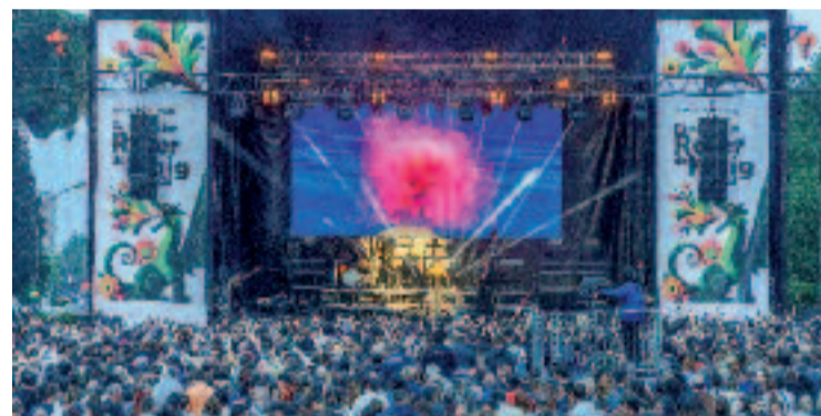
Un concert del Roser de Maig de l'any passat.

Més enllà dels concerts, no faltaran els habituals actes de cultura popular i el tradicional piromusical, així com els espectacles infantils, els actes per a la gent gran i l'esport, entre altres. El pregué que donarà el tret de sortida enguany anirà a càrrec de l'Agrupació Sardanista pels seus 50 anys.