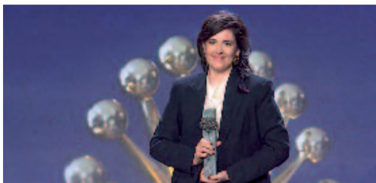
Funes amb un dels guardons que es va endur.

El film està rodat entre els camps de Jaén i els carrers de Barcelona i narra una història marcada pel dol, les desigualtats so-