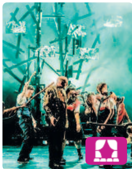
Un monstruo viene a verme

Arriba al Teatre Apolo de Barcelona l'adaptació teatral de la novel·la de Patrick Ness que Juan Antonio Bayona va portar a la gran pantalla. Explica la història d'en Conor, un nen de 13 anys que cada nit té el mateix malson des que la seva mare va caure malalta. Amb un monstre que se li apareix al jardí, viu diferents aventures, fins que decideix fer front a les seves pors.