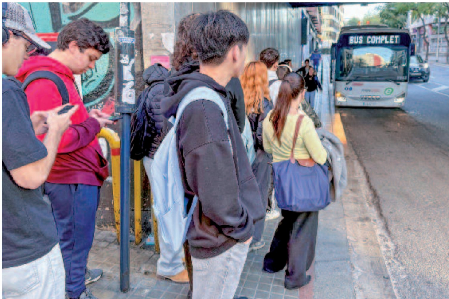
Un dels busos que va de Cerdanyola a la UAB, complet durant un dels darrers dies de vaga de Rodalies.

Tot i que ara és més a prop de la universitat en viure a Cerdanyola, l'Aina no ha evitat les darreres afectacions a Rodalies. "Amb la vaga hi ha hagut dies que els trens de l'R7 no han passat i els busos anaven tan plens que ni tan sols s'aturaven a les parades", apunta. Precisament, a causa de la desconfiança que transmet el servei de Rodalies, "el bus s'ha convertit en l'elecció de la majoria dels estudiants que van de Cerdanyola a la UAB perquè mai falla, però des de fa mesos costa trobar-hi lloc en hora punta", explica la jove.