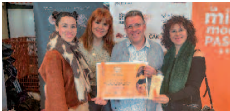
Equip de la Palma amb el premi.

Arran de rebre el guardó, des de l'establiment han notat un augment dels encàrrecs. "Nor-