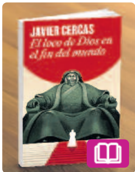
El loco de Dios en el fin del mundo Javier Cercas

Es tracta d'una novel·la que aborda una de les preocupacions fonamentals de la societat actual: el paper de la religió i de l'espiritualitat avui dia i la recerca de la immortalitat. Ho fa partint d'una proposta que li va fer el Vaticà, que, de forma insòlita, li va oferir fer un viatge a Mongòlia juntament amb el papa Francesc.