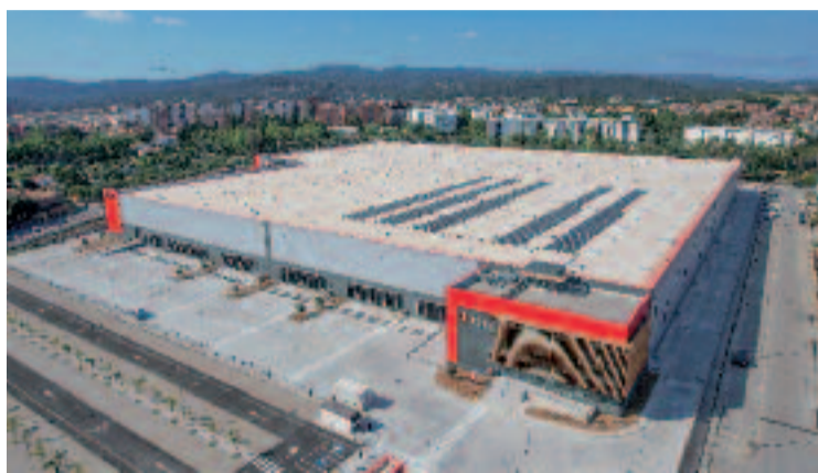
Nau on s'ubica el nou centre logístic de Penguin.

EMPRESA ▶ El grup editorial Penguin Random House ha inaugurat recentment el seu nou centre logístic de Cerdanyola, que converteix la ciutat en tot un referent del món del llibre. La nau on s'ubica, de 42.000 metres quadrats i on antigament hi havia la coneguda fàbrica Aiscondel, té capacitat per gestionar i distribuir uns 340.000 llibres diaris, que anualment es tradueixen en més de 40 milions de llibres.