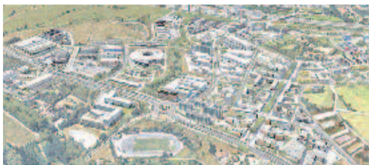
Així serà el futur Centre Direccional.

En paral·lel, en els pròxims mesos també començaran les obres de ressegellat de l'abocador de