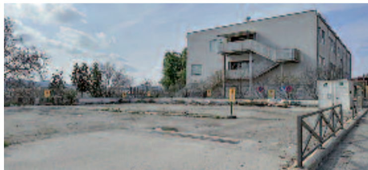
En aquest espai es construirà el nou edifici.

D'altra banda, per a poder mantenir un espai d'aparcament similar al que es perdrà, des de l'Ajuntament avancen que estan “treballant per a poder adequar un terreny, situat a l'altra cantonada”. L'actuació es farà per no perjudicar el veïnat.