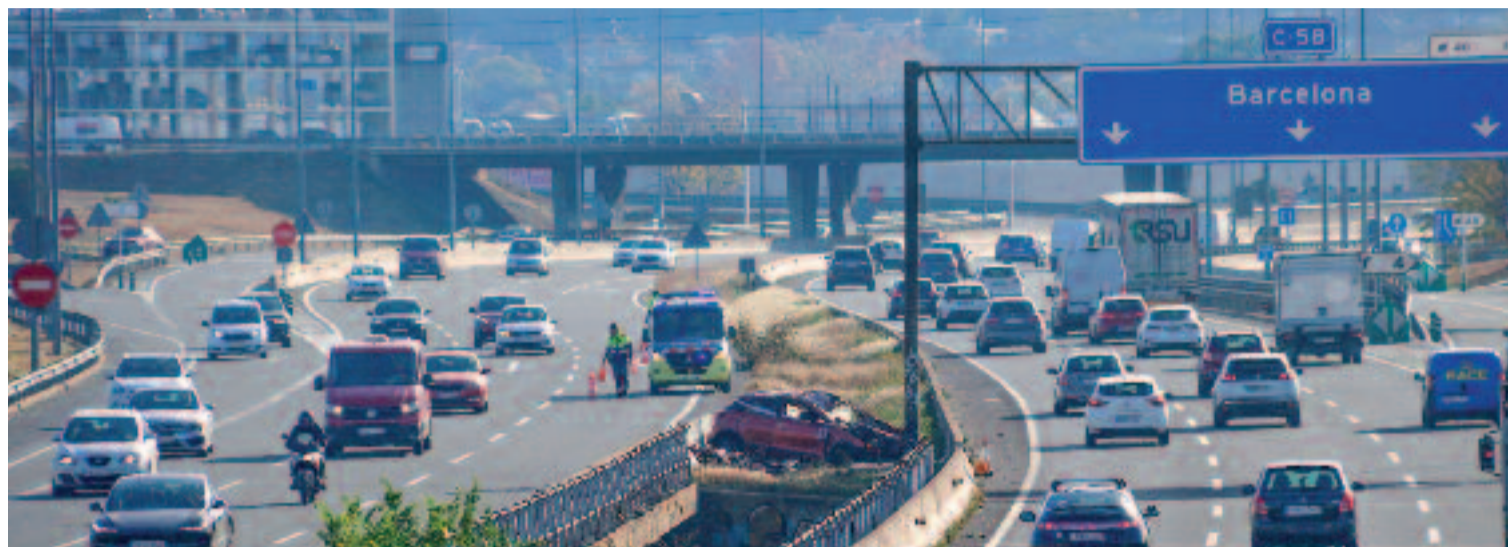
Imatge d'arxiu d'un cotxe accidentat entre calçades a la C-58 a l'altura de Ripollet, el conductor del qual va morir.

Per conèixer els motius d'aquesta elevada sinistralitat cal saber, primer, les especificitats de la citada carretera, que té dos trams diferenciats: un d'autopista, d'uns 22 quilòmetres, que uneix Barcelona amb Terrassa travessant el Vallès Occidental, i un altre que passa a ser una carretera convencional d'una sola calçada, que continua des de Terrassa fins a la C-55, just abans del túnel de Bogunyà, al terme de Castellbell i el Vilar (el Bages), amb uns 15 quilòmetres més. El