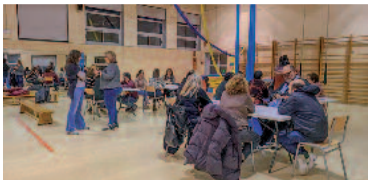
Moment de la sessió de treball de Populus Labora.

Segons detallen des de Populus Labora, una de les principals necessitats del barri és, precisament, “l'autoorganització dels veïns en una associació des d'on coordinar accions veïnals i fomentar la comunicació entre residents”. Aquesta és la raó de ser del nou col·lectiu, que neix centrat, sobretot, en dues línies d'actuació: d'una banda, “impulsar el comerç al barri” i, de l'altra, “recuperar espais en desús per aprofitar-los com a espais