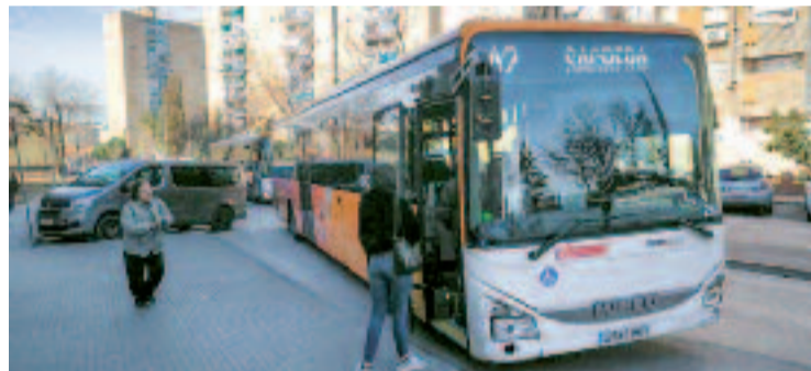
La línia A2 arribarà fins a la Sagrera de Barcelona.

De la mateixa manera, l'Ajuntament i l'Àrea Metropolitana de Barcelona (AMB) han formalitzat un conveni segons el qual l'ens supramunicipal mantindrà un total de 20 marquesines a la ciutat. Aquestes s'aniran renovant progressivament per oferir protecció contra la pluja i el sol, garantir una millor il·luminació i facilitar informació actualitzada sobre horaris i recorreguts.