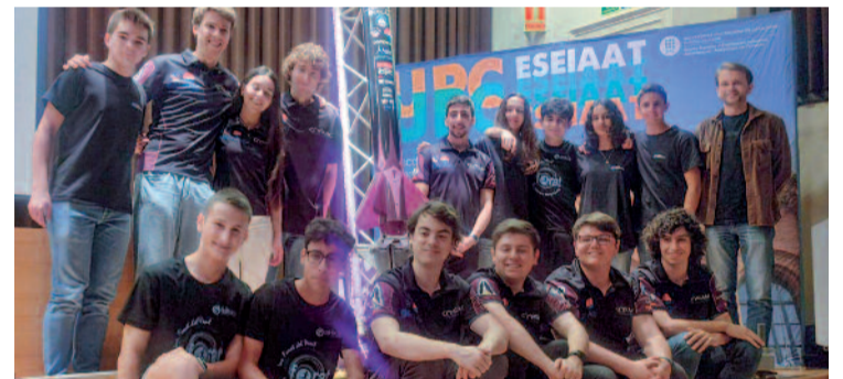
Equip del LUCID, amb alumnes de la ciutat i de la UPC.

La competició se celebrarà del 17 al 22 de juny a Nou Mèxic, on l'equip presentarà aquest coet de 40 kg de massa i més de 3 metres de longitud, que pot volar a 2.000 quilòmetres per hora. Des del centre cerdanyolenc desitgen “molta sort” al LUCID i assequen estar orgullosos dels seus alumnes.