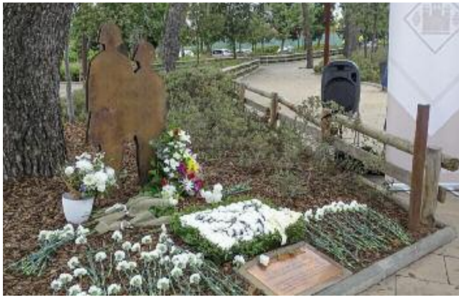
A l'esquerra, monument a les germanes Masachs ple de flors després de l'acte del dia 10 i a la dreta imatge d'arxiu de les nenes.

Justament aquest 10 de juny s'han complert 80 anys des d'aquells fatídics fets i Barberà ha volgut recordar la història de les dues germanes amb un acte de record que servia per posar el punt final al cicle d'activitats 'Primavera amb memòria'. Es tracta d'un conjunt de propostes culturals que començaven a l'abril impulsades per la recentment estrenada regidoria de Memòria Històrica i Democràtica, que han servit per aprofundir en la reparació de la me-