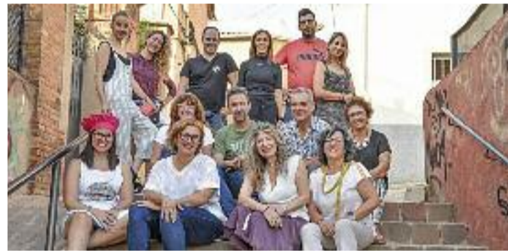
Una de les imatges de l'exposició.

L'entitat també explica que amb aquesta exposició busquen “conscienciar la població de la importància de comprar en els comerços de proximitat i contribuir així al benestar de la ciutat, promovent l'economia circular i de proximitat”. En aquest sentit, des de l'Ajuntament destaquen que “el comerç local juga un paper crucial a Ripollet” i animen a comprar en aquests establiments.