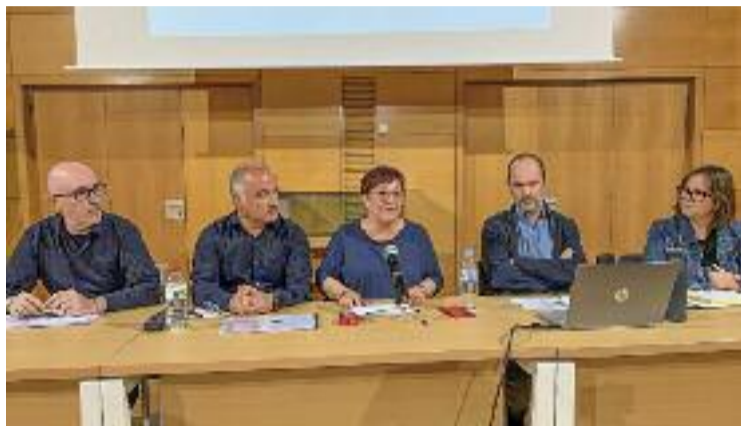
Moment de la presentació del Pla d'usos.