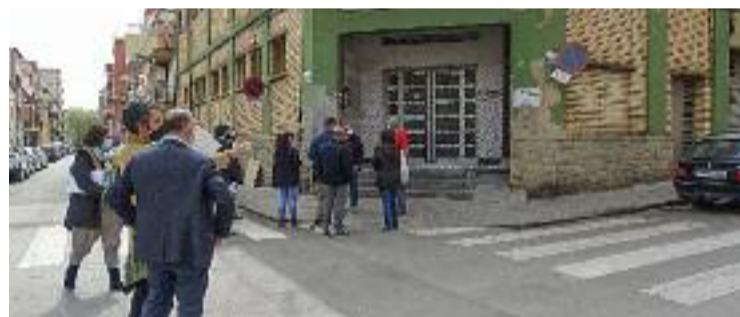
Imatge d'arxiu de l'antic mercat en funcionament.

La reconversió de l'equipament forma part de la reurbanització dels carrers de l'entorn més proper del mercat i, segons detallen des de l'Ajuntament, es farà mantenint els seus elements característics, interior i exterior, ja que "arquitectònicament, l'edifici representa un estil propi dels mercats dels anys 60 i, històricament parlant, forma part del patrimoni de la ciutat". D'aquí la necessitat de conservar-lo, tot i que sigui amb un altre ús.