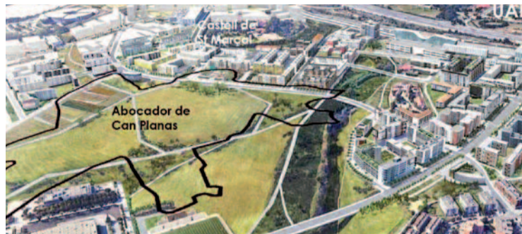
Situació de l'abocador i imatge virtual del futur Centre Direccional.

Mentrestant, a l'espera del ressegellat, l'Incasòl continua fent petits passos per al desenvolupament del Direccional, ja que el maig venia dues parcel·les del Parc de l'Alba, que quedarà inclòs dins del nou barri. Una serà per a construir-hi 283 habitatges de protecció oficial i l'altra per aixecar les instal·lacions de la multinacional CAME.