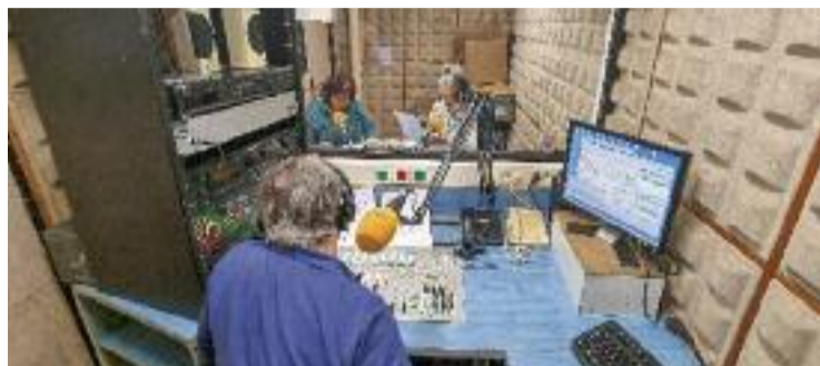
Els participants han pogut posar-se en la pell dels locutors.

Es tracta d'una iniciativa que començava al febrer i que s'acabava aquest passat mes de maig, en el marc del programa 'Activat+60' de l'àrea municipal de Gent Gran. En concret, ha consistit a obrir la porta de la ràdio municipal als participants "oferint-los l'oportunitat d'aprendre a fer ràdio sense requisits previs, d'una manera ben professional i alhora