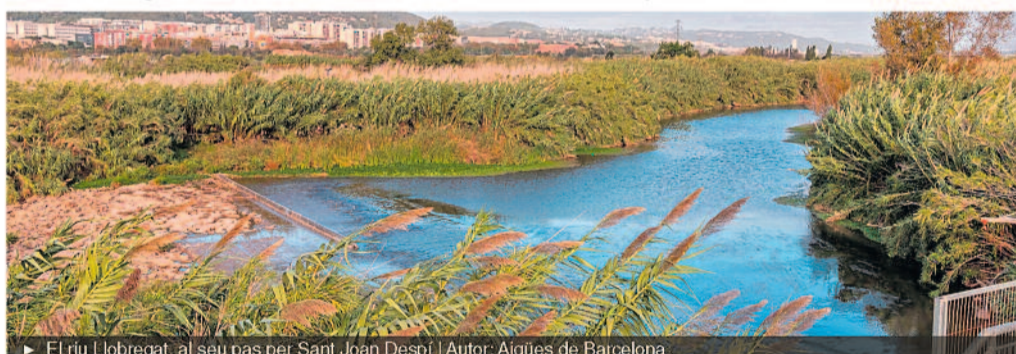
▶ El riu Llobregat, al seu pas per Sant Joan Despí

Aigua regenerada, solució circular sostenible En aquest escenari, i per assegurar l'abastament al conjunt de la pobla-