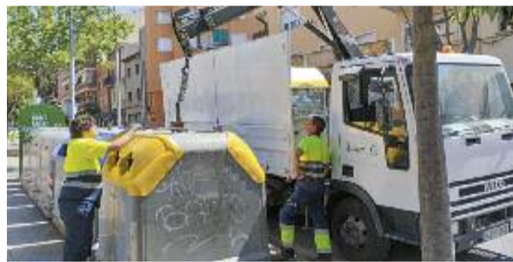
El Ripollet Aporta funciona des del juny del 2022.

Davant d'aquestes dades, des del consistori es mostren satisfets, però recorden que l'objectiu és continuar millorant, ja que la UE marca que el 2035 la recollida selectiva ha de ser del 65%.