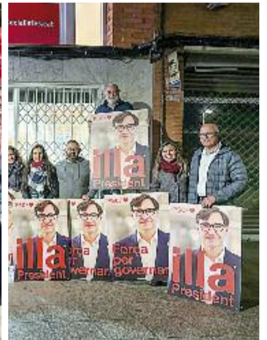
D'esquerra a dreta, moments de la campanya del PSC Cerdanyola, Ripollet i Barberà, amb els batlles al centre.

punts el resultat del 2021, però seguit de ben a prop dels republicans, amb un 13% dels vots. Malgrat la poca diferència entre ambdós partits, ERC se situava com la força que més suports perdia a la ciutat, empitjorant els resultats sis punts.