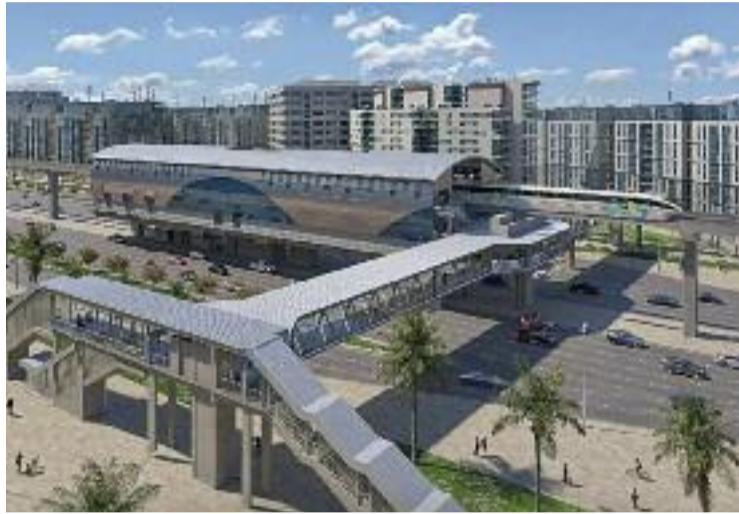
Imatge virtual del futur monorail del Caire.

Segons apunten des de la companyia, dedicada a impulsar la transició verda arreu del món a través de l'ús de la tecnologia, "la iniciativa suposa un salt tecnològic en el transport ferroviari per tracció elèctrica" i oferirà "una alternativa segura, ràpida i no contaminant per connectar l'àrea metropolitana del Caire transversalment d'est a oest". "Facilitarà la mobilitat dels habitants i visitants de la ciutat, descongestionant el trànsit en oferir una alternativa eficient i sos-