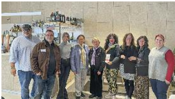
Participants en la primera sessió del projecte.