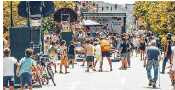
Imatge d'arxiu de la festa de l'avinguda del Vallès.

Davant d'aquesta implicació local, des de l'Ajuntament agraeixen el premi i aprofiten per recordar que, prèviament, el projecte havia rebut bones crítiques d'Europa, quan al novembre representants de diversos països s'interessaven per la iniciativa.