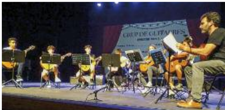
Imatge d'arxiu d'un acte amb alumnes de l'escola.

Davant d'aquest canvi, alguns partits de l'oposició criticaven que