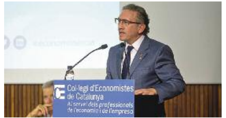
El conseller Giró presentant el pla d'ajudes.

Per això, els beneficiaris seran de tots els perfils. Principalment, persones desocupades, però també joves, adolescents, infants i famílies, i empreses, pimes i autònoms. En aquest darrer cas, per ajudar-los a adaptar-se "als nous reptes globals", diuen des de la Generalitat. Diferents col·lectius que ara ho tindran una mica més fàcil per cobrir les seves necessitats i que podran començar a demanar aquestes ajudes, sempre que compleixin els requisits, a partir de l'any que ve.