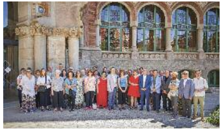
Una cinquantena de professionals han creat aquest pla.

L'objectiu final de tot això, però, és redactar un document que marqui quines han de ser les prioritats del sector públic i privat per fomentar la lectura, especialment en català. Un full de ruta que reculli les necessitats i les propostes de millora, a curt i a mitjà termini, per aconseguir capgirar la situació, fer de la lectura un hàbit atractiu per a tothom i posar el sector del llibre a l'alçada del de l'audiovisual. Tot plegat, per començar a veure els resultats de tot això entre l'any 2025 i el 2030.