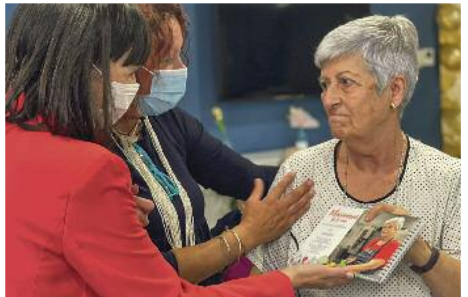
S'han recopilat receptes de tota la vida de les persones usuàries del centre per tal d'agrupar-les en un llibre.

► El simple record que va evocar una magdalena sucada en un te al protagonista de Por el camino de Swann va permetre a Marcel Proust escriure prop de 3.000 pàgines. I és que el gust, l'olfacte i també el tacte esperonen la memòria i, fins i tot, poden ajudar a alliberar records que pràcticament havíem enviat a l'oblit. En certa manera, aquest és l'esperit de Assaborint Records , una iniciativa que va posar en marxa la residència de gent gran CleceVitam Ceritania, a Cerdanyola del Vallès, amb motiu del Dia Internacional de les Persones Grans.