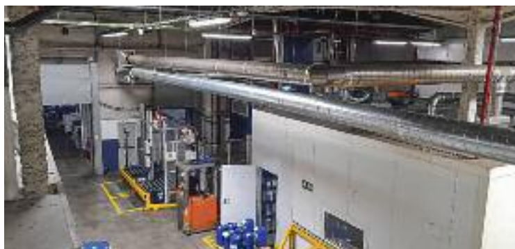
La fàbrica de Ventós fa 22 anys que és a Sant Just.

Tot i que l'empresa va implementar mesures durant els mesos de calor per reduir l'impacte de les olors, no ha estat suficient per eliminar les molèsties. "Les condicions meteorològiques dels darrers dos mesos han estat especialment adverses i complicades", va respondre la companyia en un correu electrònic, en el qual destacava que algunes de les coses que havien