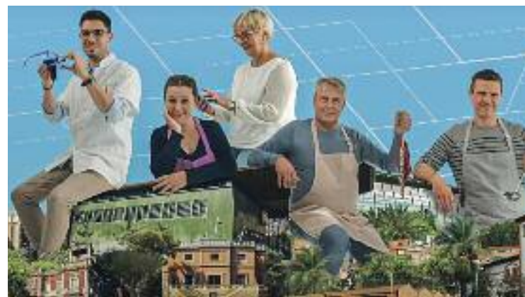
La fira comercial s'allargarà fins al 13 de novembre.

Per altra banda, també està previst que de l'11 al 13 de novembre hi hagi una ruta de tapes de tardor, els bars i restaurants de la qual també participaran en la fira virtual. Tot plegat forma part de la campanya Esplugues Comerç 4.0, que va rebre el suport dels fons europeus Next Generation i que també preveu promocionar el teixit comercial local als tramvies.