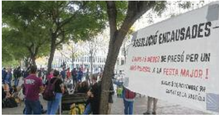
El judici s'havia de celebrar el dia 3.

Segons expliquen a aquesta publicació des del grup de suport als encausats, abans del brindis final del sopar una patrulla de la policia hauria fet acte de presència per urgir-los a finalitzar l'àpat, ja que estaven ocupant la via pública. Sempre segons aquesta versió, els agents haurien mostrat una actitud "agressiva" durant la intervenció. En un moment donat, haurien començat a empènyer i agafar gent del sopar. "Va ser una actitud desproporcionada", lamenten des del grup de su-