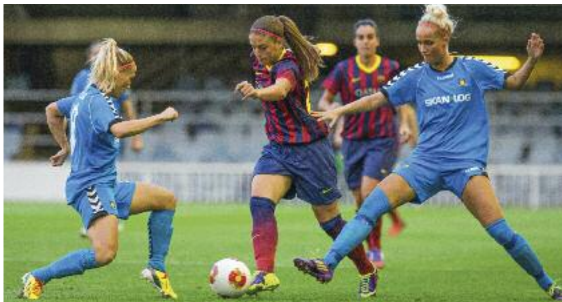
Els salaris que es paguen a l'esport femení són molt més baixos que al masculí.

Podem afegir-hi, veient el cas del primer equip femení de futbol del Barça, que un altre element que convida les noies a abandonar l'esport és la manca de referents d'esportistes d'èxit