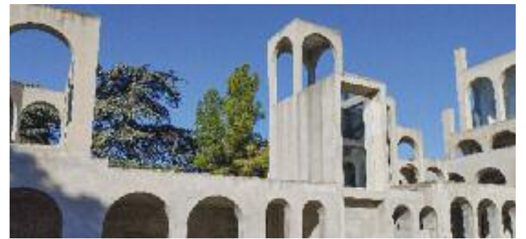
L'edifici va ser creat per l'artista local Xavier Corberó.

PATRIMONI ▶ Hi havia 750 entrades per visitar l'Espai Corberó el 12 i 13 de novembre i es van exhaurir en pocs minuts. Davant d'aquest èxit d'inscripcions, l'Ajuntament ha hagut d'obrir nous torns per permetre més persones visitar aquest conjunt patrimonial tan singular d'Esplugues i que acaba de ser comprat per l'Ajuntament per fer-hi un equipament cultural.