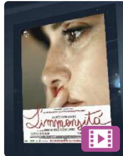
L'immensità Emanuele Criales

Roma, anys 70. La Clara i en Felice s'han mudat a un pis nou. El seu matrimoni està acabat: ja no s'estimen, però són incapços de separar-se. Els mantenen units els seus fills, en els quals la Clara bolca el seu desig de llibertat. L'Adriana, la gran, té 12 anys i s'adona de la situació. Rebutja el seu nom i defensa que és un noi. Això acaba de fer trontollar l'equilibri familiar.