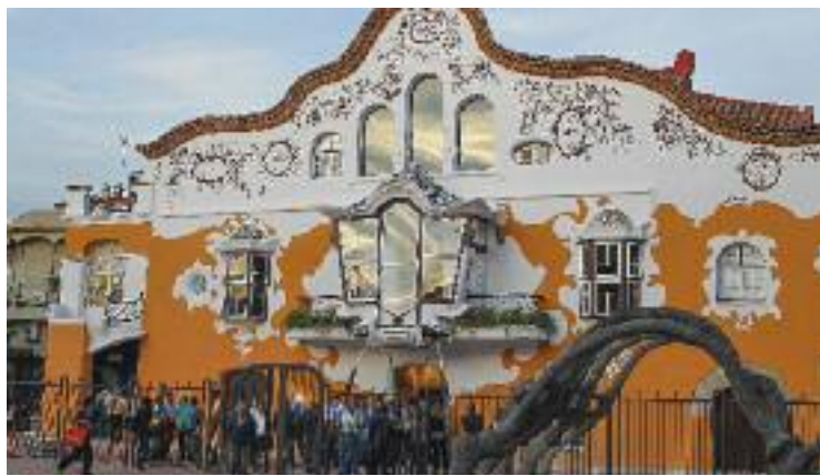
Els visitants de l'Open House van poder entrar a Can Negre.

Estret col·laborador d'Antoni Gaudí, Jujol va ser un geni a l'ombra d'un altre gegant de l'arquitectura modernista. Poca gent sap, però, que les baranes de la Pedrera i altres elements de la Casa Batlló són obra seva. Qui es va encarregar de treure