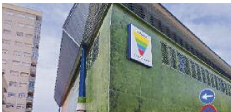
Imatge exterior del Mercat de la Plana.

No és la primera vegada que es presenten renúncies de paradistes dels dos mercats, els quals han estat remodelats recentment. Tanmateix, els botiguers continuen a les carpes provisio-