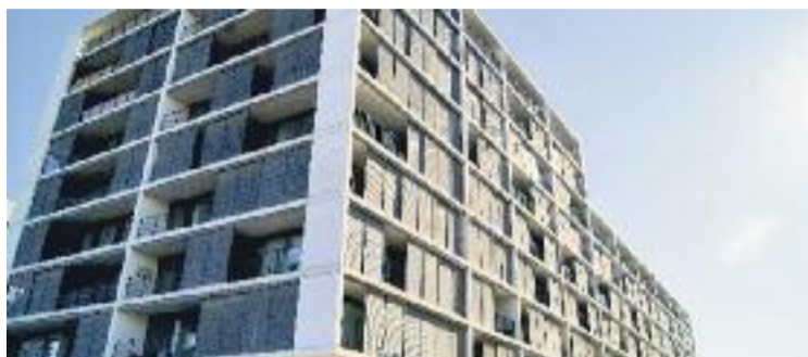
Els veïns del bloc van aconseguir una important victòria el 2018.

Aquests contractes es van acabar, i l'empresa va plantejar la possibilitat de vendre els pisos. Alguns veïns els van comprar, mentre que uns altres van marxar. Ara bé, hi ha actualment una trentena de llogaters que no volen comprar els pisos ni marxar, i reclamen a l'empresa continuar amb el lloguer. Aquesta, per la