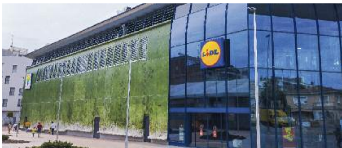
El Lidl del Mercat de la Plana ja funciona, a l'espera que s'obri la part de les parades, encara en obres.

Un ritme, tanmateix, que no és suficient per a uns paradistes que fa 15 anys que són a la carpa provisional del carrer del Carme