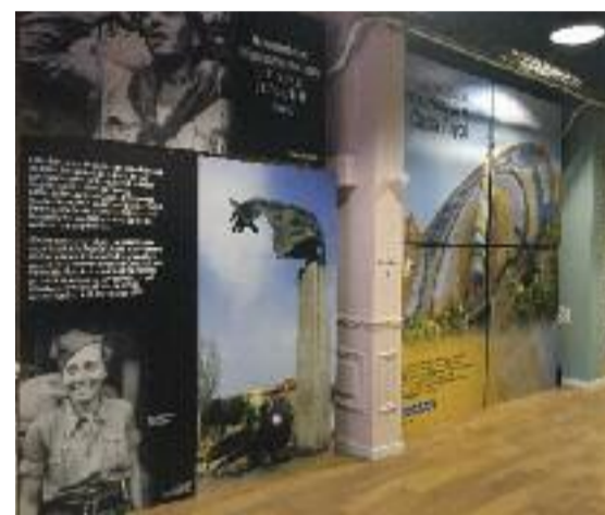
L'exposició, molt visual i en gran format, és al nou Espai Línia del carrer Girona, 52 de Barcelona.