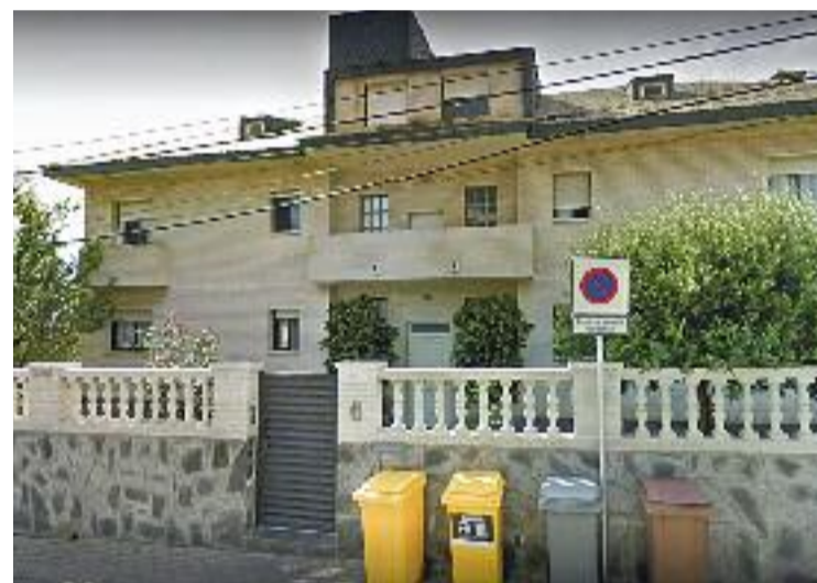
El centre continuarà funcionant com fins ara.

La companyia, a més, té l'objectiu d'ampliar la seva oferta a l'àrea metropolitana els pròxims anys i expandir-se a unes altres zones del país, amb un total de sis residències, que suposaran 787 places de residència i 185 de centre de dia, informen.