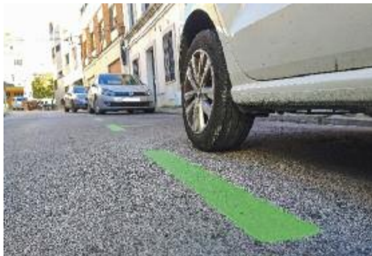
Una zona d'estacionament a Sant Just Desvern.