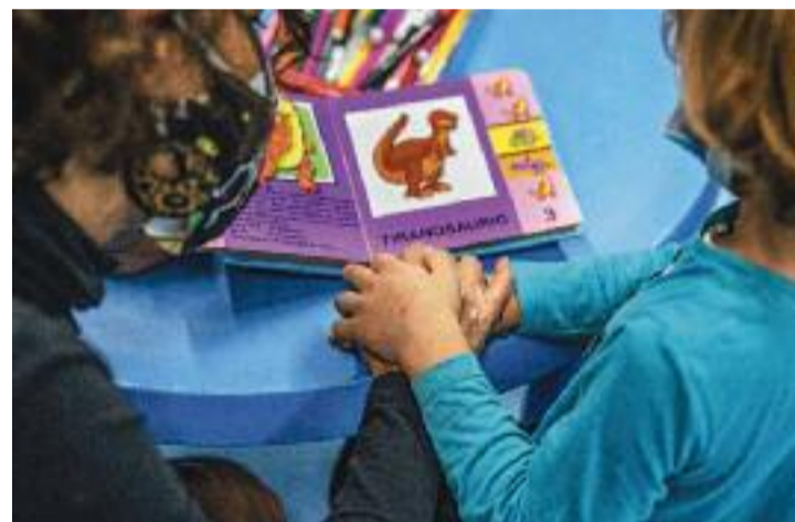
Les famílies interessades ja poden demanar el servei.

Aquesta és una acció que s'emmarca en el programa Sant Joan Despí Concilia i que vol facilitar la conciliació i la cura de la família i dels fills, una càrrega que molt sovint recau en les dones. D'aquesta manera, els interessats es poden registrar al web municipal per gaudir-ne.