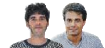
Un reportatge d'Albert Alexandre i Francisco J. Rodríguez

Tanmateix, Oliván hi posa un bri d'esperança i apunta que els joves d'avui han nascut en la "multiculturalitat", fet que juga a favor a l'hora d'evitar l'expansió de l'extrema dreta. En aquesta línia, des del col·lectiu Versemblant, que treballa per combatre els discursos ultres a través de la música rap, no consideren que els joves siguin més racistes o masclistes "ara que fa cinc anys", tot i que alerten d'un cert decaïment entre el jovent. La pandèmia, la guerra, l'escalfament global i la crisi empenyen la por, un sentiment que, citant un savi cinematogràfic, porta a la ira, a l'odi, al patiment i, finalment, al costat tenebrós.