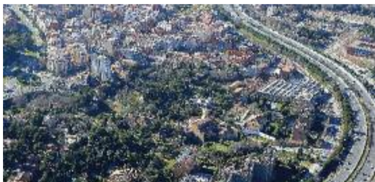
Pla general d'Esplugues.

Segui com sigui, el valor mitjà d'aquests habitatges a Esplugues està per molt per sobre de ciutats com Sant Cugat –amb 533.250 euros– o l'Hospitalet –amb 355.900 euros–. Per contra, els municipis més barats són Sant Adrià de Besòs –276.100 euros– i Cornellà –326.400–. De fet, si Esplugues fos un districte de Barcelona, seria el cinquè més car, per sota de Sarrià-Sant Gervasi –que lidera el rànquing amb 1,2 milions d'euros–, l'Eixam-