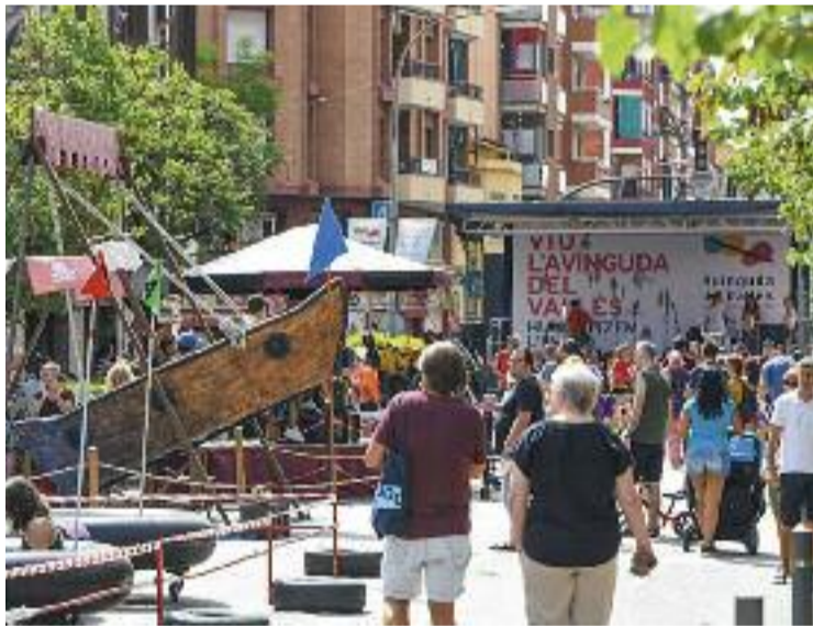
La ciutadania ocupa l'N-150 en defensa de la pacificació.