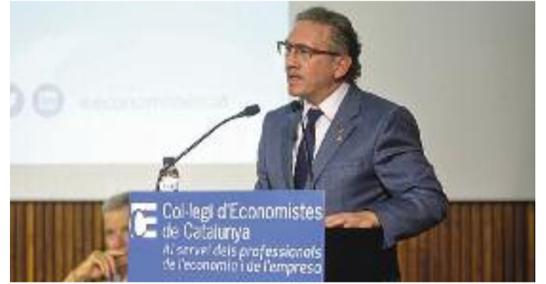
El conseller Giró presentant el pla d'ajudes.

Per això, els beneficiaris seran de tots els perfils. Principalment, persones desocupades, però també joves, adolescents, infants i famílies, i empreses, pimes i autònoms. En aquest darrer cas, per ajudar-los a adaptar-se "als nous reptes globals", diuen des de la Generalitat. Diferents col·lectius que ara ho tindran una mica més fàcil per cobrir les seves necessitats i que podran començar a demanar aquestes ajudes, sempre que compleixin els requisits, a partir de l'any que ve.