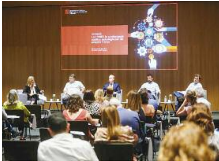
Jornada de les PIME i la contractació pública.

En aquest sentit, tot i que la covid-19 ha fet estralls en l'economia, no ha afectat especialment l'adjudicació de contractes a les PIME. I és que, tot i que se'n van adjudicar menys que el 2020, la mitjana de contractes adjudicats s'ha mantingut respecte els darrers cinc anys. Una xifra que cada vegada se situa més lluny de la dels contractes que s'adjudiquen a les grans empreses, que l'any passat només s'emportaven el 26% del total d'adjudicacions. Ara bé, per un import de més d'un bilió d'euros,