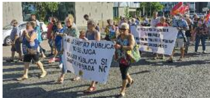
La manifestació va començar al Broggi.

PROTESTA ▶ Desenes de veïns es van manifestar el 29 de juny a Sant Joan Despí per reclamar més recursos per a la sanitat pública. Havien estat convocats pel Fòrum Social del Baix Llobregat, que està format pels sindicats CCOO i UGT, la Federació d'Associacions de Veïns i Veïnes, l'Associació de Federacions de Famílies d'Alumnes (aFFac), el PSC, ERC i Comuns.