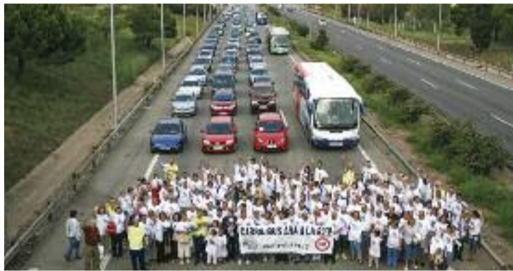
El 2007 la PTP va fer una prova de com funcionaria el carril bus.

Amb aquesta actuació està previst que el temps de trajecte dels busos que transiten per aquesta carretera -com ara l'E30 o l'L61 i l'L64- es redueixi 15 minuts en hora punta. A més, la voluntat del Govern és limitar l'ús del vehicle privat. De fet, el concurs públic per a les obres s'emmarca en l'estratègia de la Ge-