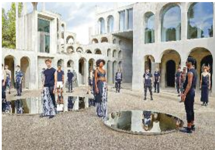
La 080 va omplir l'espai amb les últimes tendències de moda.

L'anunci de compra de l'Espai Corberó va ser molt ben acollit per l'oposició, que va felicitar el govern municipal per l'operació. "Aquesta casa és en un lloc immillorable i forma part d'una zona privilegiada de la qual estem orgullosos", va expressar la regidora dels comuns, Dolores Castro. Per la seva banda, el por-