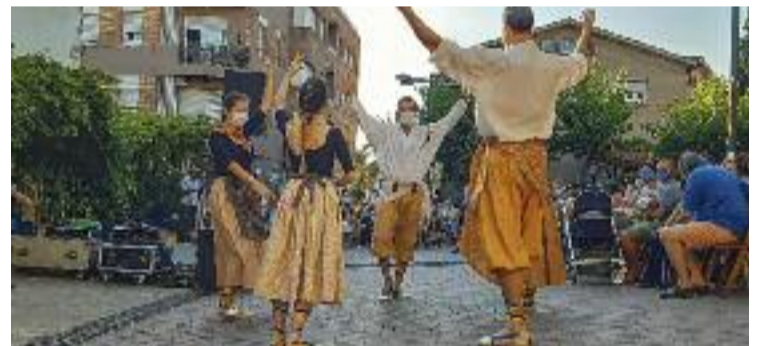
La cultura popular tindrà un paper especial a la celebració.

TRADICIÓ ▶ Han estat dos anys de pandèmia i restriccions, i des de fa uns mesos tot sembla que torna a poc a poc a la normalitat. Hi ha ganes de recuperar la vida d'abans, i en aquest sentit Sant Just està enllestint els últims detalls per viure la seva Festa Major, que entre el 3 i el 7 d'agost omplirà la ciutat d'alegria i activitats per a tothom.