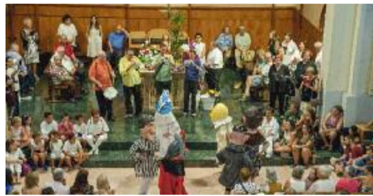
La cultura popular tindrà un pes especial a les festes.

TRADICIÓ ▶ La Festa Major de Santa Magdalena escalfa motors per omplir la ciutat d'activitats per a tots els públics. Del 21 al 24 de juliol la ciutat viurà un espàrring de les vacances d'estiu amb un programa que posa molt èmfasi en la cultura popular.