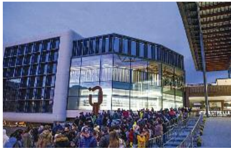
El centre comercial va obrir el 2018.

Darrere de l'operació hi ha Cushman & Wakefield, que és qui ha assessorat el fons Equilis. També és la immobiliària que s'encarregaria de la venda d'un altre centre comercial de la comarca, l'Splau, a Cornellà, que segons diverses fonts del sector estaria en venda per 350 milions d'euros.