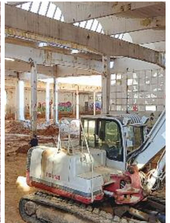
Una imatge del projectil (esquerra) i de l'indret on s'ha trobat, a l'antiga fàbrica Braun d'Esplugues.