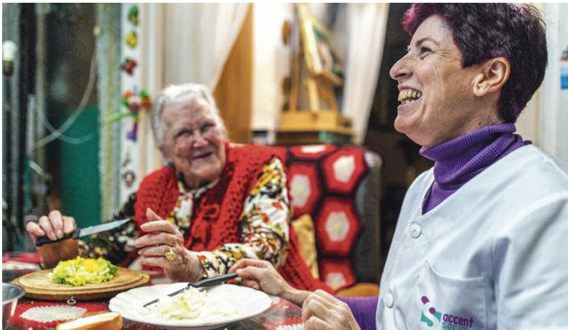
Els SAD proporcionen cuidadors i cuidadores professionals que atenen les necessitats de les persones amb dependència.

► Qui cuida la persona cuidadora? Aquesta pregunta, que ens remet a la famosa paradoxa del barber que no es podia afeitar, és la que es plantegen centenars de persones que tenen cura dels seus familiars dependents arreu del país. Es tracta de gent que dedica bona part del seu temps a cuidar els pares o parents que necessiten la seva assistència. Sovint, a costa de reduir la jornada de treball o, fins i tot, renunciant-hi, per no parlar de la manca total de temps per fer encàrrecs del dia a dia o gaudir d'un moment de lleure i desconnexió.