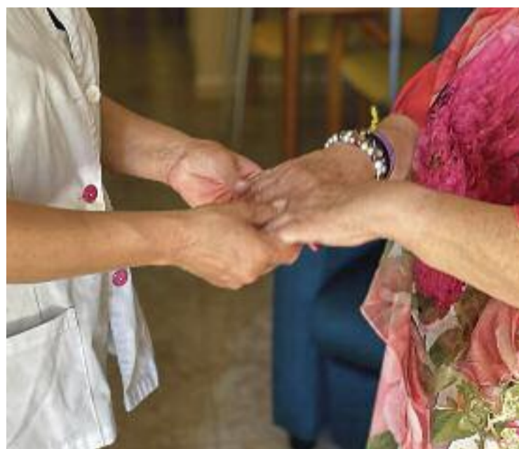
L'atenció és personalitzada, propera i empàtica.

Per tant, aquests serveis s'erigeixen en un ajut indispensable no només per a les persones usuàries, sinó també per als cuidadors no professionals, que solen ser els familiars més pro-