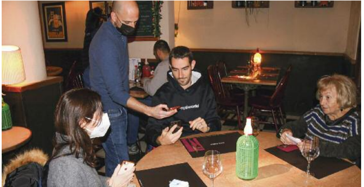
Els bars i els restaurants han patit restriccions durant tota la pandèmia per frenar l'augment de casos.

Tal com recalca, de vegades es pregunta si, per exemple, s'ha tocat sense voler els ulls abans de desinfectar-se les mans. El pitjor de tot és que preocupacions similars a aquesta, afirma, es repeteixen quan veu clients tossir, a la mínima que té mocs o quan, com va passar fa pocs dies, un client marxa del restaurant perquè s'assabenta que ha estat en contacte d'un positiu. Davant d'aquestes situacions, per a Gar-