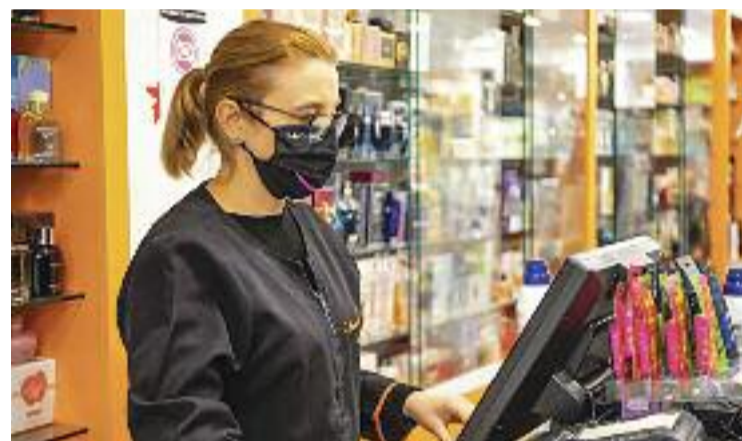
Dependent de botigues, la segona feina més demandada.

Pel que fa a la durada de les vacants gestionades per Barcelona Activa, un 38% van ser places indefinides, un 55% contractes de més de sis mesos i un 7% de menys de sis mesos. Gairebé un 78% de les jornades van ser completes i la resta parcials.