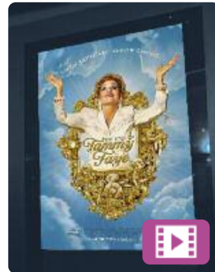
Los ojos de Tammy Faye Michael Showalter

Tammy Faye Bakker (Jessica Chastain) va ser una telepredicadora molt popular als Estats Units dels anys 70 i 80. Ella i el seu marit, Jim Bakker (Andrew Garfield), van crear un imperi del no-res, amb una xarxa de cadenes de televisió religioses i, fins i tot, un parc temàtic. Però les irregularitats financeres, les rivalitats i els escàndols els van fer caure fins a l'infern.