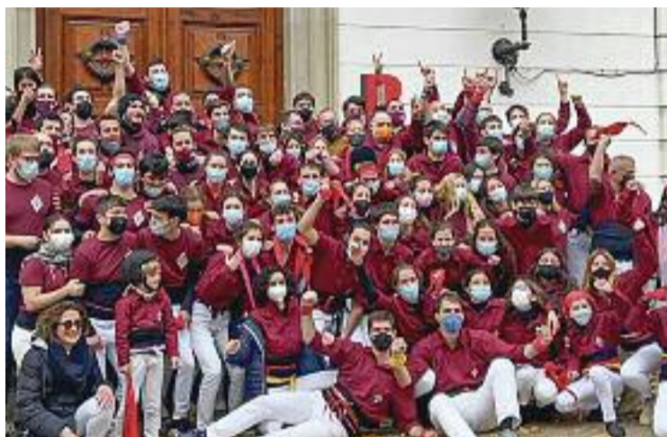
Part de l'equip dels Castellars de Sarrià.