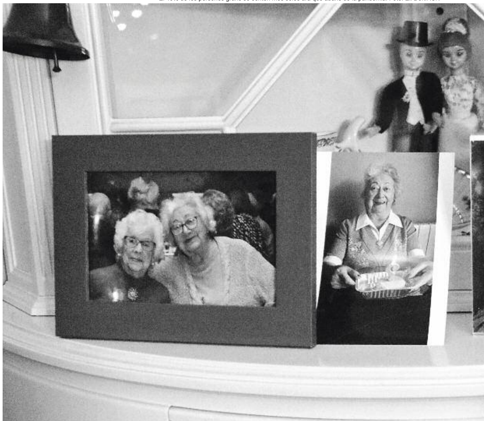
El 40% de les persones grans se senten més soles ara que abans de la pandèmia.

"Tinc dret a saber què estava passant. Ens ho han negat sempre. La meua mare no ens la podran tornar, però una cosa que es podria haver evitat no volem que torni a passar mai més", diu l'Ana María, filla d'una dona que vivia a la residència Federica Montseny de Barcelona. En el seu cas,