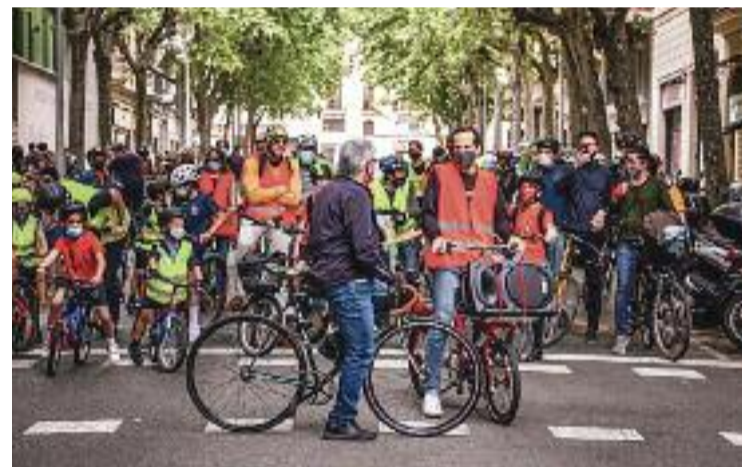
Una sortida de Bicibús Barcelona.