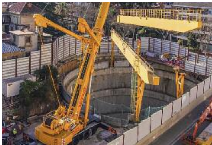
La grua de les obres al carrer Mandri.