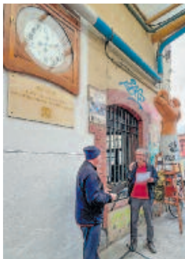
La inauguració i la restauració del rellotge.