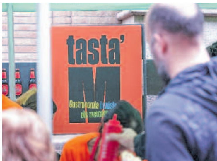
El cicle vol fomentar el comerç local.

En aquest sentit, cicles com Tasta'm fan valdre el paper fonamental d'entitats que "sempre han sigut un punt de trobada pel