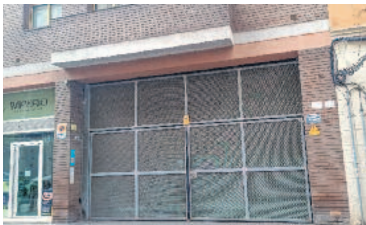
L'entrada de l'aparcament després del desallotjament.

La situació no era nova. Tal com va avançar La Vanguardia , els veïns portaven més d'un any i mig alertant les autoritats. L'aparcament es trobava en un estat decadent, amb deixalles, excrements i restes de menjar. El