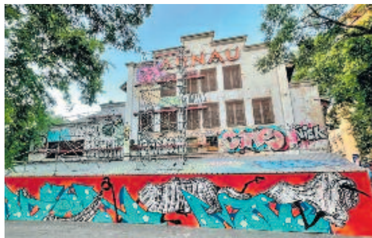
L'exterior del Teatre Arnau.

El Teatre Arnau, que va tancar el 2004 i que l'Ajuntament va comprar el 2011, és l'últim teatre de baraca conservat a Catalunya. Tot i el seu tancament, l'activitat cultural ha continuat de manera itinerant. La reobertura coincidirà amb l'estrena dels primers trams de la nova Rambla remodelada.