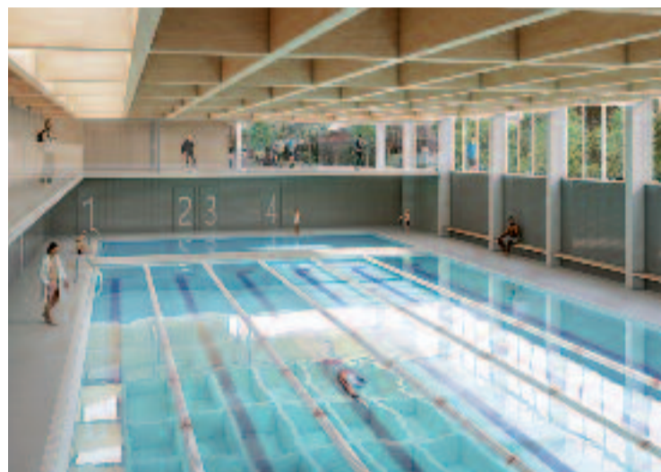
Imatge virtual d'una de les futures piscines.

El projecte també preveu la urbanització del tram final del carrer del Coure. Aquest nou CEM respon a una reivindicació històrica del veïnat i busca millorar l'oferta esportiva d'aquesta zona del barri.