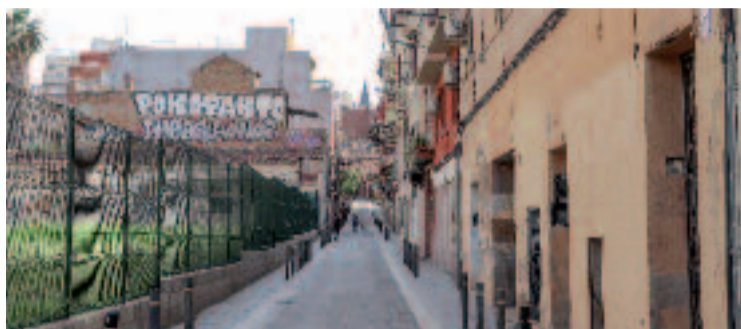
L'entorn del calaix de Sants està pendent d'una transformació.

La decisió va arribar després que el govern constatés que segurament no tindria els suports necessaris per a la Comissió d'Urbanisme d'aquell dia. De fet, el dia anterior Barcelona En Comú va anunciar que no votaria a favor de la modificació urbanística si el govern municipal no aprovava la qualificació d'habitatge protegit per aquests 700 pisos, que ara se salvaran, dels carrers de Burgos, Jocs Florals i Bonaventura Pollés. Fonts municipals van assegurar a betevé que la previsió és portar a votació la qüestió durant les pròximes setmanes, quan s'hagi fet les reunions amb els afectats.