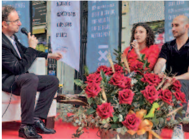
La fira va incloure entrevistes i diàlegs amb autors.