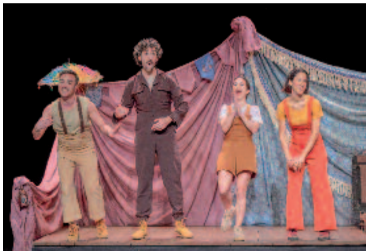
La Trobada de teatre argentí a Barcelona arrenca el 30 d'abril.