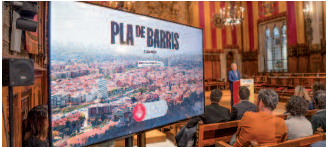
L'Ajuntament va presentar fa pocs dies el nou Pla de Barris.

A banda, també cal recordar que el Poble-sec ha estat l'altre