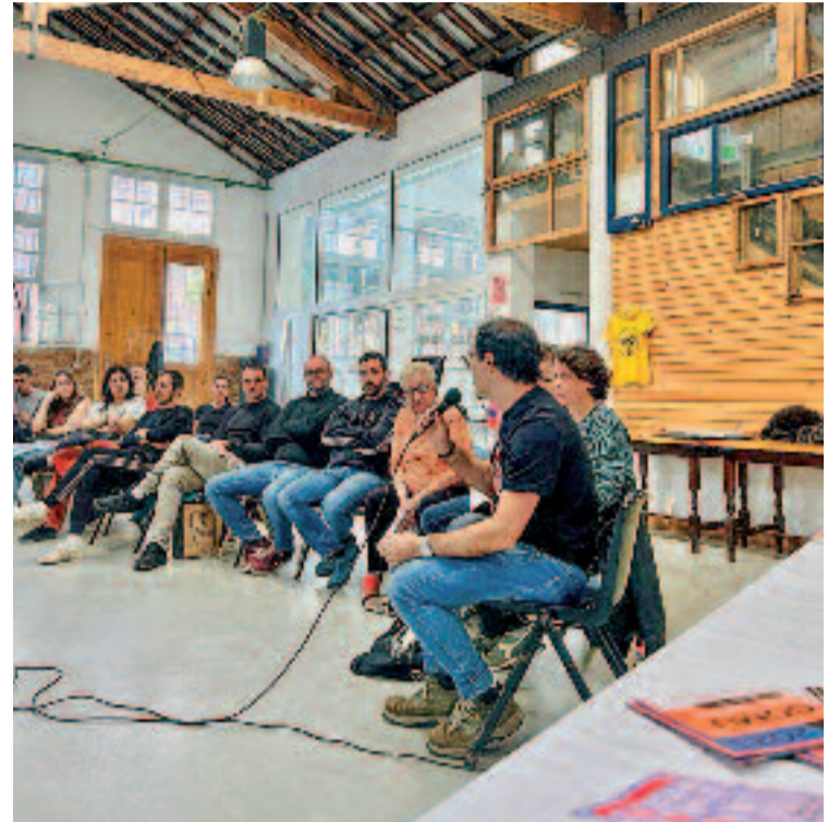
Una protesta a Can Batlló durant l'any 2011 i la presentació del llibre 'Disputar i crear el barri'.

munitaris, o la promoció d'habitatge cooperatiu com a resposta a l'especulació sistèmica.