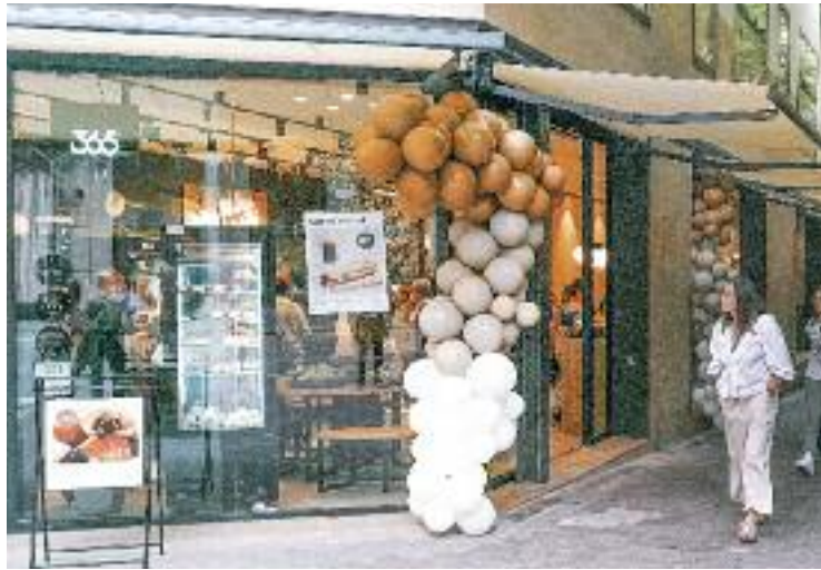
Una fleca amb servei de degustació de la cadena 365.

“No és un fenomen aïllat, no és puntual. És tot un sector que ha fet de l'incompliment normatiu la seva manera de ser competitiu i la seva proliferació només s'explica davant de la impunitat i la manca de zel inspector que sí que pateix el sector de la restauració”, subratlla el director general del gremi, Roger