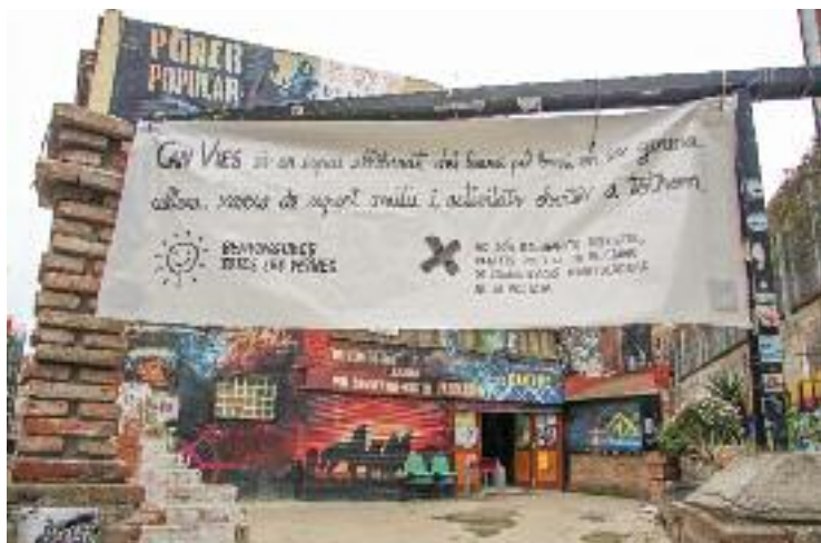
El futur de Can Vies, més a prop.

L'objectiu de l'Ajuntament amb aquesta convocatòria és posar fi a la situació de provisionalitat que té l'espai autogestionat des de fa molt temps. Així, una de les possibles opcions que hi haurà sobre la taula és que Can Vies es converteixi en un equipament, segons va explicar Barcelona en Comú al plenari, ja