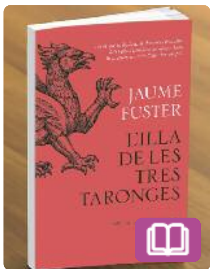
L'illa de les Tres Taronges Jaume Fuster

Aquesta obra explica la història d'en Roger, un soldat que rep la visita d'un emissari del rei de l'illa de les Tres Taronges que li reclama que els ajudi a vèncer la guerra. Així és com el protagonista s'endinsarà en una perillosa aventura en la qual haurà de lluitar contra una profecia, amb la missió de retornar la pau. És el primer llibre d'una trilogia.