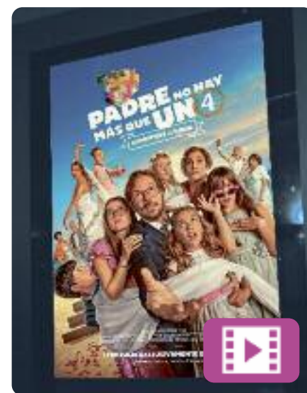
Padre no hay más que uno 4 Santiago Segura

La còmica producció de Santiago Segura arriba a la seva quarta pel·lícula amb un argument centrat en la proposta de casament que li fan a la filla gran de la família, coincidint amb el dia del seu 18è aniversari. Aquest succés despertarà un conjunt d'embolics i peripècies que no deixaran indiferent cap membre de la família.