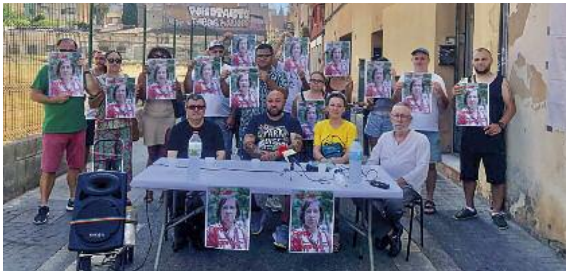
Els afectats van fer una roda de premsa denunciant la situació.

Alhora, el consistori apunta que els cossos de seguretat han