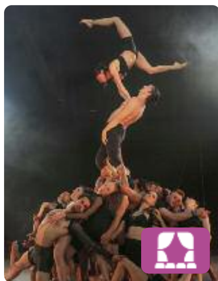
The Genesis Copenhagen Collective

Es tracta d'un espectacle que parla de com ens relacionem entre nosaltres i de com depenem intrínsecament els uns dels altres. Ho fa a través del pas per l'escenari de 20 individus de diferents nacionalitats i cultures, en un espectacle familiar que barreja el teatre, el circ i la dansa. Es pot veure al Teatre Coliseum de Barcelona fins al 24 de juliol.