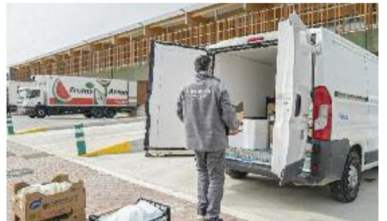
L'Ajuntament aposta pels vehicles sostenibles al comerç.

D'entrada, la prova pilot es farà al Mercat de Provençals i el consumidor, després de comprar els productes, podrà escollir si els vol rebre al seu domicili a través de mitjans de repartiment convencionals o bé a través d'un sistema de lliurament de logística verda, com s'ha anomenat als vehicles sostenibles per al comerç. Això inclourà bicis elèctriques i furgonetes elèctriques.