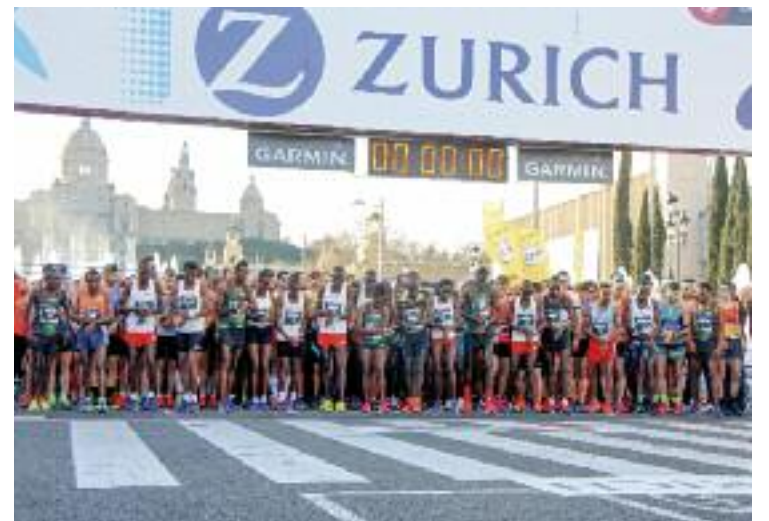
La Marató de Barcelona, als peus de Montjuïc.

Les associacions veïnals han valorat positivament aquestes mesures, i han assegurat que suposarà una millora en la qualitat de vida del barri. L'objectiu de l'acord és equilibrar l'activitat econòmica i el descans dels veïns, tot i mantenir alguns esdeveniments emblemàtics.