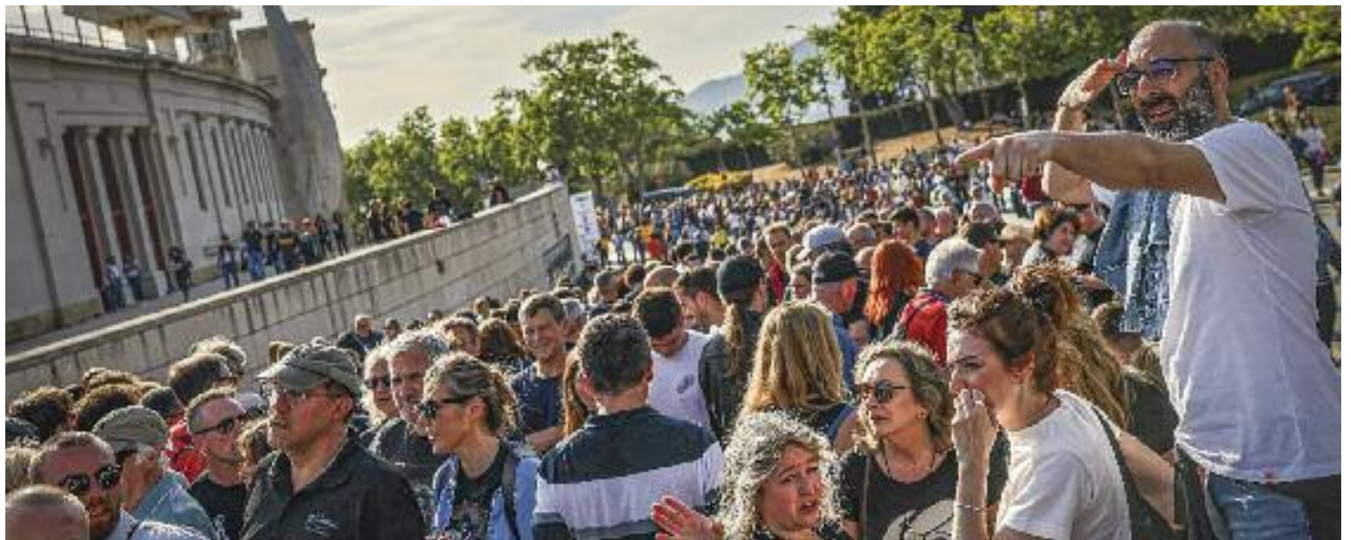
L'Estadi Olímpic és un dels punts de la ciutat que acull grans concerts.

Així mateix, TMB va posar en marxa un dispositiu especial a la línia groga de metro amb "més trens i més personal d'atenció, seguretat i neteja a les estacions del centre i a les més properes a l'esdeveniment musical", és a dir el Maresme | Fòrum, Selva de Mar i Besòs Mar. A més, es van habilitar dos serveis especials de bus que enllaçaven el Parc del Fòrum amb la plaça de Catalunya.