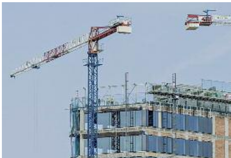
Un bloc de pisos en construcció a Barcelona.

Per la seva banda, el Consorci de la Zona Franca es farà càrrec de la rehabilitació de diverses naus industrials antigues a La Escocesa, al Poblenou, per crear un pol d'indústries creatives i innovació en gastronomia i alimentació. En paral·lel, el Consorci s'encarregarà de la rehabilitació i explotació de les naus Birkhead, Paul i Steegman.