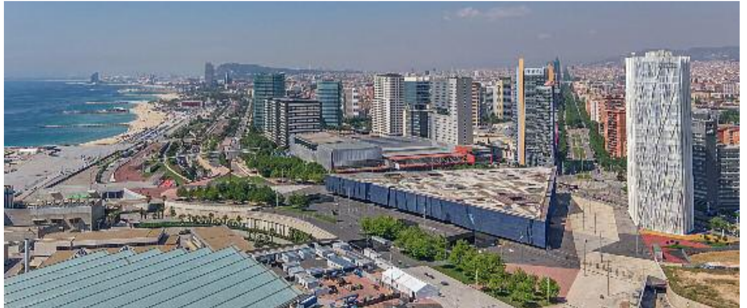
Una vista aèria de Barcelona des de la zona del Fòrum.

Les dades de l'Idescat apunten que el 2021 hi havia 103.020 estudiants al Barcelonès, dels quals 48.980 eren alumnes de fora de la comarca. En el cas del Vallès Occidental, on hi ha la Universitat Autònoma de Barcelona i altres centres d'educació superior, com per exemple l'Escola Tècnica Superior d'Engi-