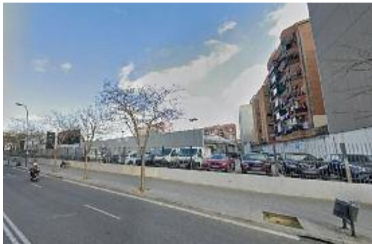
La zona coneguda com l'Illa Citroën es transformarà.

Així doncs, aquest ambiciós projecte preveu la construcció d'un parc de més de 21.000 metres quadrats, 210 pisos -100 públics de lloguer i 110 de privats- i nous equipaments. La regidora del Districte, Raquel Gil, va explicar el passat 6 de juny que el conveni estableix que l'empresa cedeix a l'Ajuntament el 80% del sòl per poder fer a l'espai privat els 110 pisos de mercat lliure. La previsió és que el nou pla urbanístic s'aprovi inicialment la pròxima tardor i després s'aniran tra-