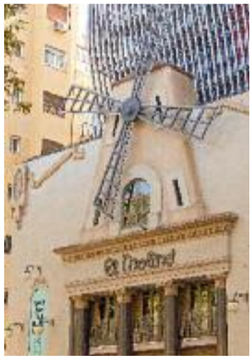
El Molino.

passeig enjardinat i on també es millorarà la connectivitat i accessibilitat des del nou parc i els Jardins de la rambla de Sants, el calaix que cobreix de les vies. També es millorarà l'accés a l'estació del metro de Santa Eulàlia i s'ampliaran les instal·lacions de l'escola Cavall Bernat.