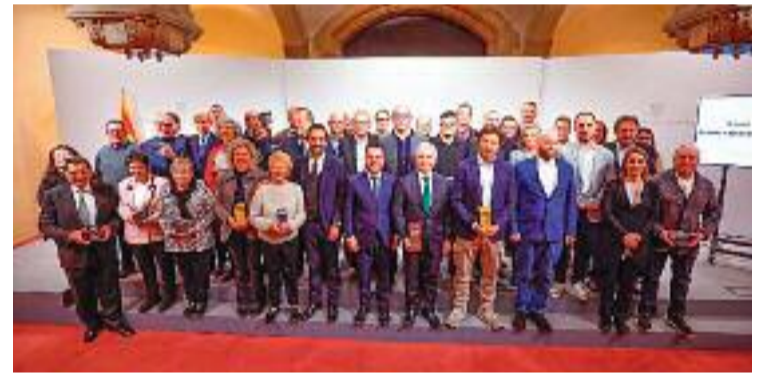
Els premiats de l'anterior edició dels guardons.

El termini per presentar candidatures finalitza el 4 de juliol a les 14:00 h. Els interessats en participar poden obtenir més informació i presentar les seves candidatures a través del web oficial dels premis.