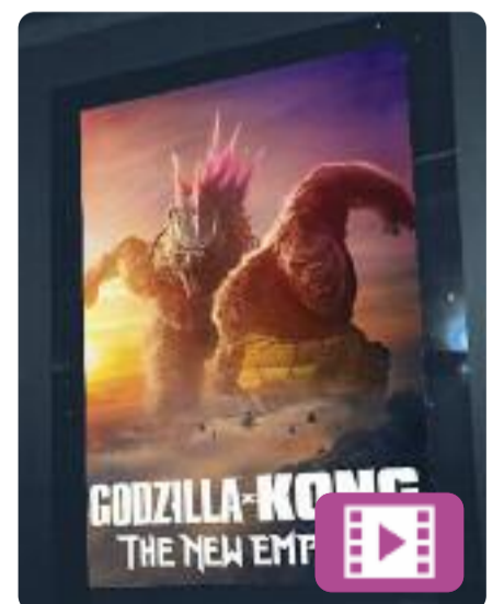
Godzilla i Kong: el nou imperi Adam Wingard

El film narra la batalla de Kong i Godzilla contra una amenaça desconeguda que vol acabar amb el planeta. Les seves mateixes històries personals i orígens seran la clau per vèncer l'enemic a l'èpica Illa Calavera, escenari de les darreres pel·lícules de King Kong. Rebecca Hall, Brian Tyree Henry i Dan Stevens en són els protagonistes principals.