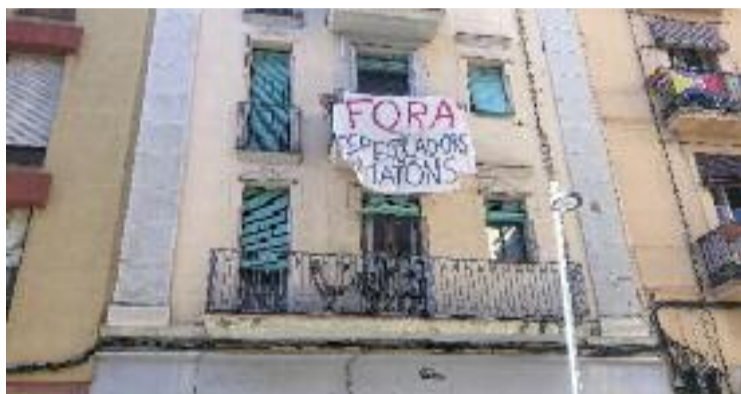
Els afectats viuen al número 33 del carrer Magalhães.

El propietari de l'immoble, un fons d'inversió rus, fa temps