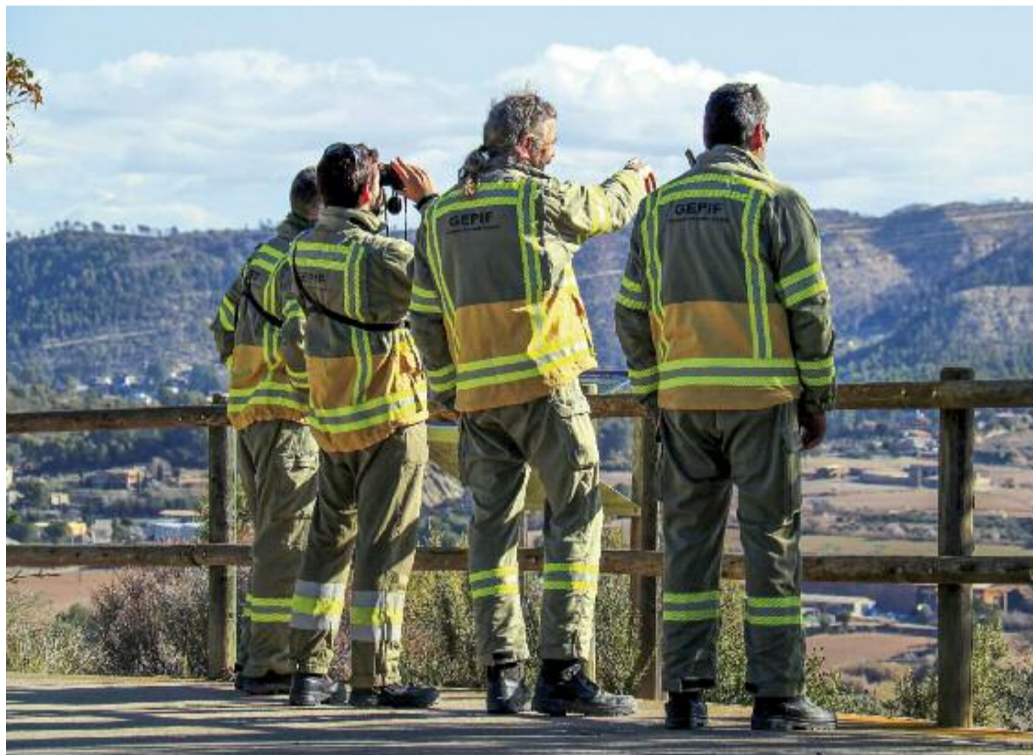
El Grup de Prevenció del Departament d'Acció Climàtica durant les tasques de vigilància.

Més enllà de la mortalitat de la vegetació, els experts adverteixen que moltes masses afec-