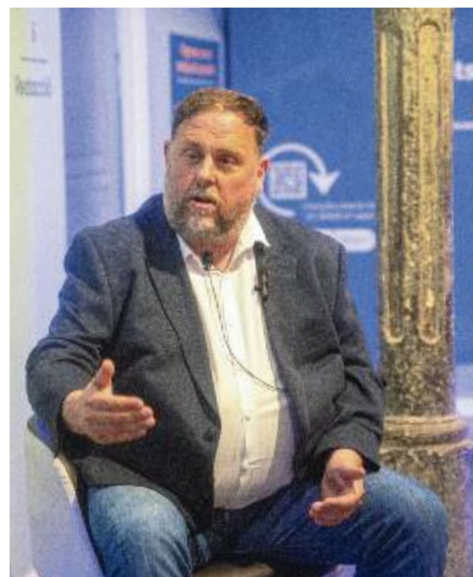
La sala de conferències de l'Espai Línia es va omplir per seguir la conversa amb Oriol Junqueras.