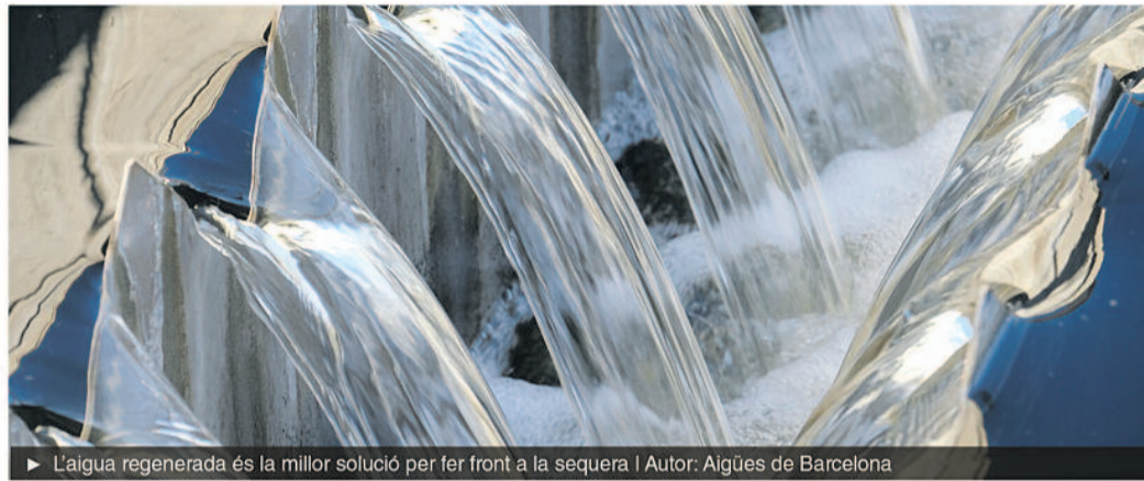
► L'aigua regenerada és la millor solució per fer front a la sequera

S'estima que el dèficit hídric actual a la regió metropolitana de Barcelona és de 60 hectòmetres cúbics (hm 3 ) a l'any, i que el 2050 arribarà a 130 hm 3 . Aigües de Barcelona, referent mundial en matèria d'innovació en el sector de l'aigua, aposta per l'ús d'aigua regenerada. Regenerar l'aigua significa sotmetre l'aigua depurada a un tractament addicional perquè es pugui reutilitzar per a diferents usos seguint un model circular. La manera més sostenible de preservar els recursos hídrics i els ecosistemes aquàtics i evitar l'impacte