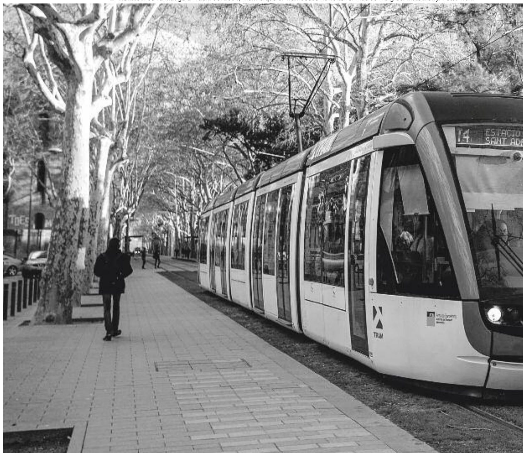
El Trambaix es va inaugurar l'abril del 2004, mentre que el Trambesòs ho va fer el mes de maig del mateix any.

Què és primer, l'ou o la gallina? L'expansió de Barcelona a finals del segle XIX i principis del XX, que va suposar l'annexió de pobles com Gràcia o Sants a la ciutat, va coincidir amb la posada en marxa de la xarxa de tramvies. Què va ser primer, el tramvia o la construcció de la capital catalana tal com la coneixem? Més enllà de la pregunta, no és forassenyat dir que, sense un sistema de comunicació eficient, l'annexió dels pobles del pla de Barcelona no hauria estat possible.