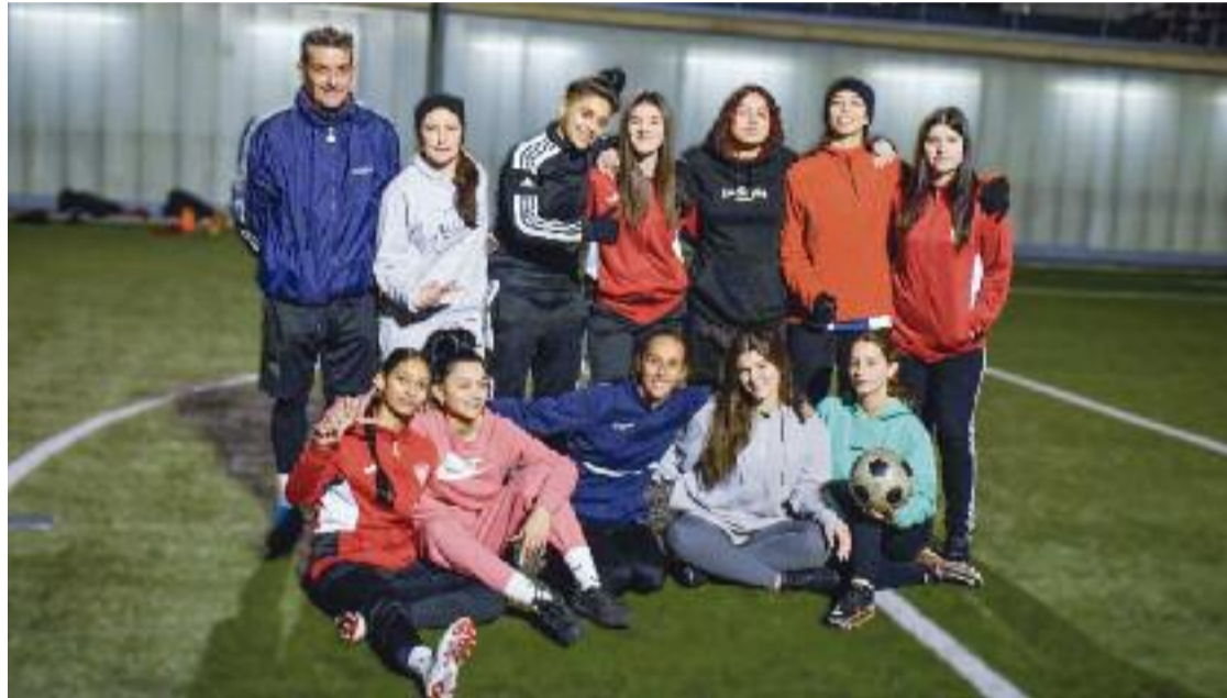
El cos tècnic i algunes jugadores del CF Tramontana, a la Mina (Sant Adrià de Besòs).