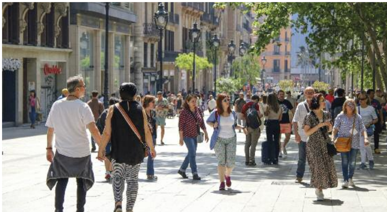
La valoració de la satisfacció de viure a Barcelona es troba en mínims històrics, segons dades de l'Ajuntament.

Viure en un barri o en un altre altera notablement la percepció que els habitants tenen de la seva ciutat. D'aquesta manera, la població que més valora viure a la capital catalana és la de Nou Barris (7,4), Sant Martí i Ciutat