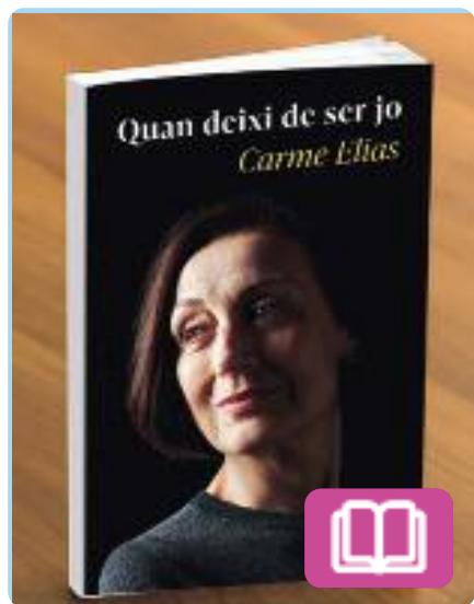
Quan deixi de ser jo Carme Elias

Aquest és un testimoni lúcid i vital sobre l'Alzheimer viscut per una de les grans actrius del nostre país, Carme Elias, que va anunciar que patia aquesta malaltia l'any 2020. Una mirada emotiva i descarnada sobre la trajectòria i la vida d'una actriu brillant, la memòria de la qual, tan entrenada com ha estat al llarg de la seva trajectòria, camina inevitablement cap a l'oblit.