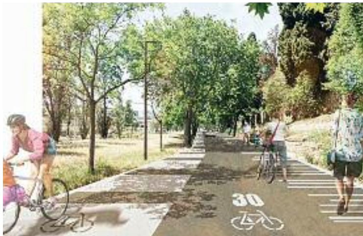
Una imatge virtual d'un tram del futur passeig.

Segons informen des del consistori, ja s'ha posat en marxa la redacció del projecte executiu, que preveu un corredor urbà de tres quilòmetres que costarà 9 milions d'euros. Les obres les finançarà l'Ajuntament i el Port de Barcelona, i es començaran a tirar endavant a finals de l'any que ve, amb la previsió de ser una realitat el 2026. A partir de llavors, la Marina estarà a només 10 minuts en bus de les Drassanes.