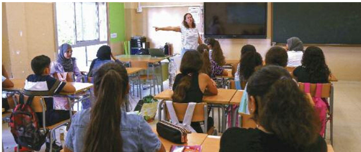
La realitat de les aules catalanes és intercultural.

Aquest programa municipal fomenta la interculturalitat i la participació de les comunitats estrangeres en la societat local, facilitant l'entesa a través de mediadors, traductors i intèrprets. De la mà dels tècnics del projecte Xeix, el Consorci d'Educació de Barcelona (format per l'Ajuntament i la Generalitat) ofereix xerrades, orien-