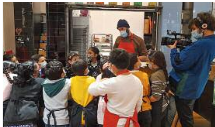
El programa està pensat per als més petits.

Pel que fa als tallers de consum responsable, dirigits específicament a l'alumnat de 6è d'educació primària, aquest curs se n'han fet 86 a 18 centres educatius diferents. Les sessions s'han impartit a més de 2.000 participants i han permès a l'alumnat descobrir la importància de practicar un consum solidari, sostenible i de proximitat.