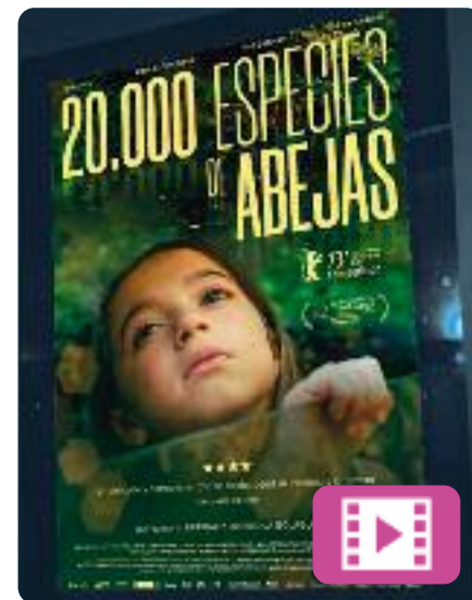
20.000 especies de abejas Estibaliz Urresola Solaguren

Cocó, de vuit anys, no encaixa en les expectatives de la resta i no entén per què. Tothom al seu voltant insisteix a dir-li Aitor, però no s'identifica amb aquest nom ni amb la mirada dels altres. La mare, en crisi professional i sentimental, decideix passar les vacances a la casa materna, on la seva mare i la seva tieta es dediquen a la cria d'abelles i la producció de mel.