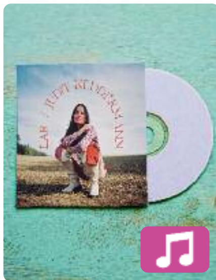
Lar Judit Neddermann

Ja és aquí el nou àlbum de Judit Neddermann, Lar (Universal Music/Música Global). Es tracta del cinquè disc de la cantant, en el qual "torna a casa, honra les arrels, s'envolta de músics estimats i crea cançons que busquen l'amor, la pau, la celebració i la llum", segons es pot llegir al web oficial de l'artista. El disc va acompanyat d'una peça audiovisual.