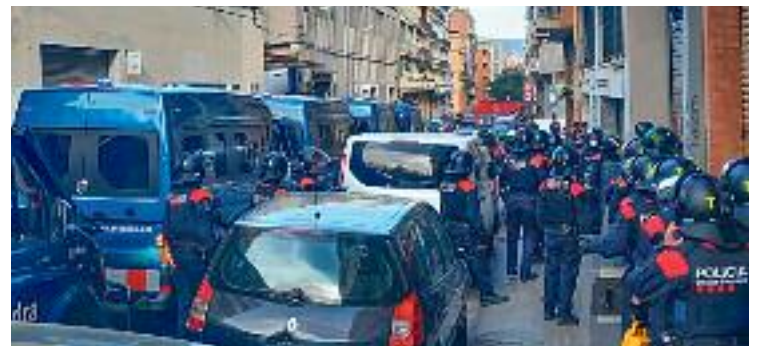
Moment de l'operatiu policial al carrer de Blesa.

EL POBLE-SEC ▶ Els Mossos d'Esquadra van desallotjar el 31 de març un local al carrer de Blesa número 10, al Poble-sec, que feia dos anys que estava ocupat per lladres multireincidents. Així ho va explicar el cos policial a través d'un comunicat a les xarxes.