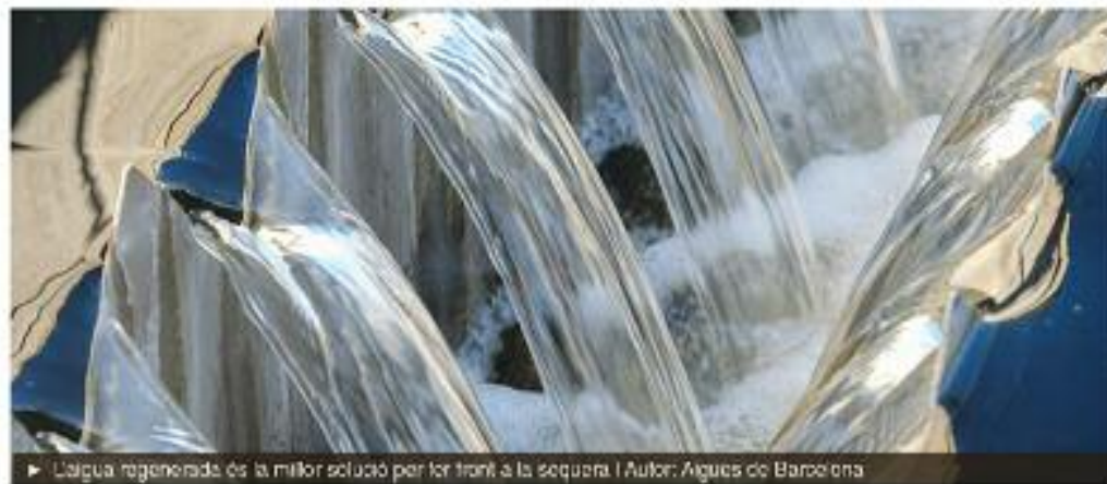
► L'aigua regenerada és la millor solució per fer front a la sequera. | Autor: Aigües de Barcelona

S'estima que el dèficit hídric actual a la regió metropolitana de Barcelona és de 60 hectòmetres cúbics (hm 3 ) a l'any, i que el 2050 arribarà a 130 hm 3 . Aigües de Barcelona, referent mundial en matèria d'innovació en el sector de l'aigua, aposta per l'ús d'aigua regenerada. Regenerar l'aigua significa sotmetre l'aigua depurada a un tractament addicional perquè es pugui reutilitzar per a diferents usos seguint un model circular. La manera més sostenible de preservar els recursos hídrics i els ecosistemes aquàtics i evitar l'impacte