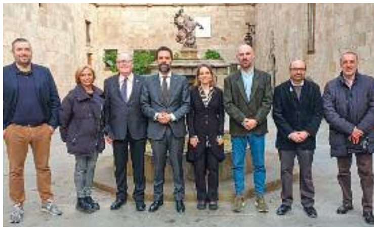
La declaració es va aprovar a finals de març.

En aquest sentit, la declaració aprovada pel Govern recorda que el comerç és una peça clau per a l'economia catalana, que representa al voltant de l'11% del PIB del conjunt de la ciutat i que genera més del 13% dels llocs de feina totals. També