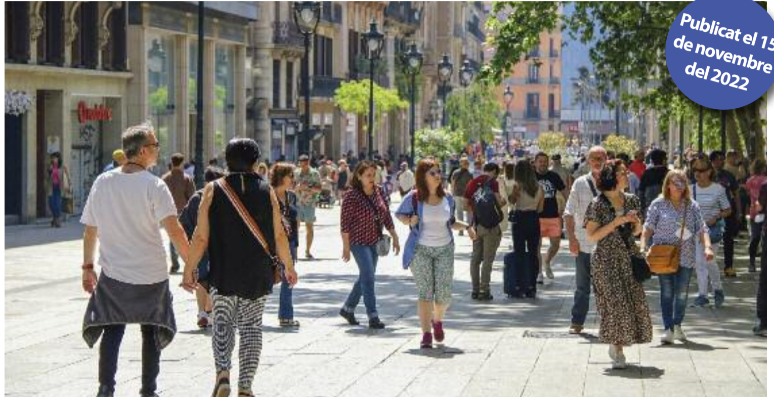
El català és la llengua minoritària entre els joves als deu districtes de Barcelona.