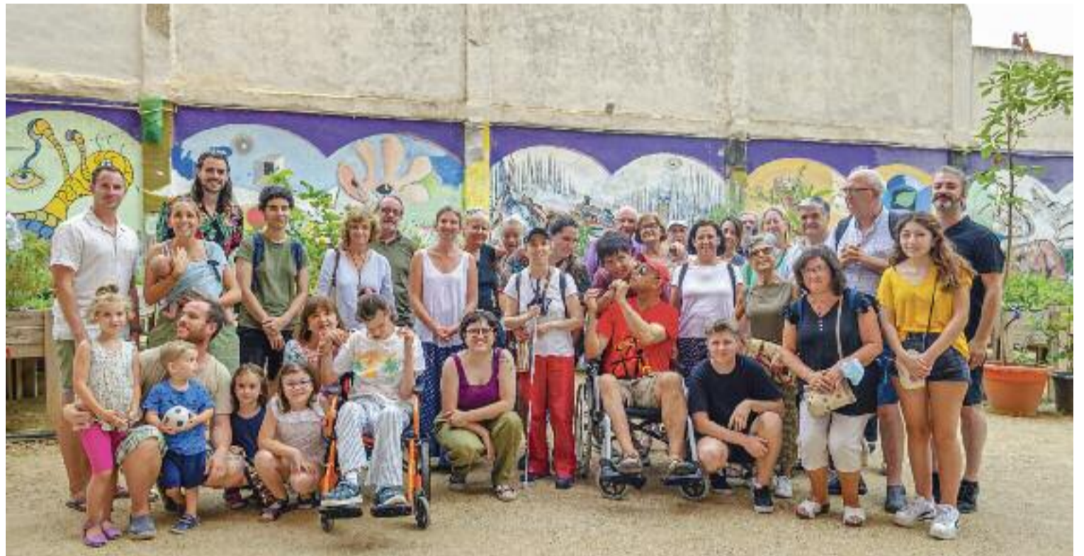
L'APSOCECAT celebrant el Dia Internacional de la Sordceguesa el passat juliol.

Per posar tota aquesta realitat al mapa, el 8 d'octubre es farà al districte de Sants-Montjuïc la quarta edició de la Caminada Solidària per la Sordceguesa que organitza l'Associació Catalana pro Persones amb Sordceguesa (APSOCECAT). Aquesta associació s'encarrega d'atendre i acompanyar a persones que pateixen la discapacitat, així com a les seves famílies, i organitza la caminada per donar-los suport i alhora col·laborar i visibilitzar que aquest problema existeix, tot i no ser gaire conegut. El president