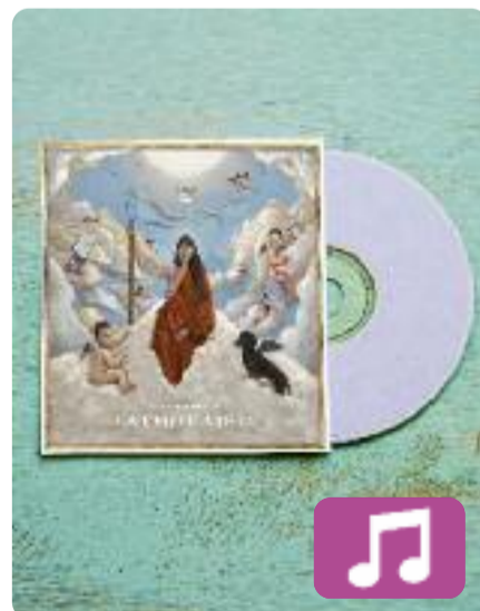
La emperatriz Rigoberta Bandini

Rigoberta Bandini (el nom artístic de Paula Ribó) ja és tot un fenomen. Després de publicar molts hits , d'actuar en grans festivals, de quedar-se a les portes d'Eurovisió i d'anunciar que es retirarà temporalment quan acabi la gira, només li faltava una cosa: estrenar el seu primer disc. La emperatriz inclou dotze cançons, de les quals quatre són inèdites.