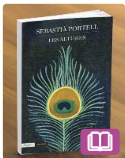
Les altures Sebastià Portell

Promesa fulgurant de l'art català de principis del segle XX i creador bandejat poc temps després per la burgesia que l'havia enaltit, el pintor, escultor i gravador Ismael Smith és una de les figures més queer, genuïnes i excepcionals del nostre patrimoni artístic. Les altures interpreta la seva trajectòria, de la Barcelona de 1886 a la Nova York de 1972.