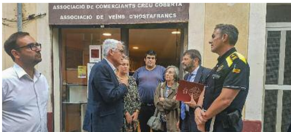
L'Associació de Comerciants Creu Coberta rep visites institucionals.

En un nou comunicat i en la línia de les declaracions del president, l'entitat dona la xifra dels 95.000 euros en destrosses i afegeixen que el total no inclou el mobiliari urbà afectat, així com tampoc els danys en motocicletes i desperfectes privats.