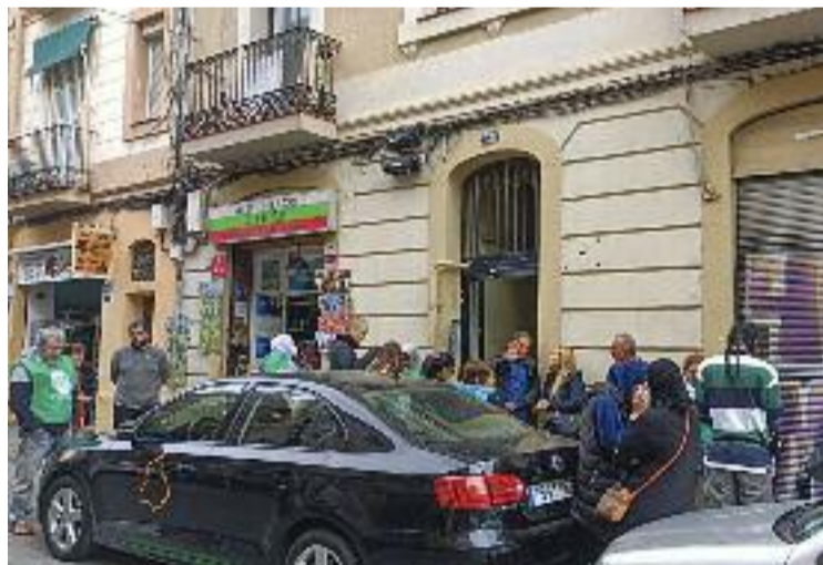
Un moment del desnonament del 29 de setembre.