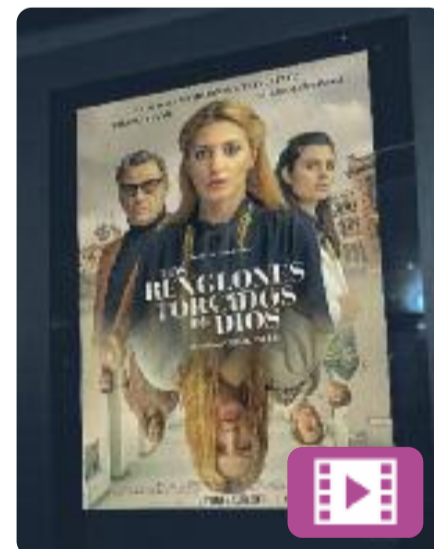
Los renglones torcidos de Dios Oriol Paulo

En aquesta adaptació de la novel·la homònima de Torcuato Luca de Tena, l'Alice, una investigadora privada, ingressa a un psiquiàtric simulant una paranoia. El seu objectiu és trobar proves del cas que l'ocupa: la mort d'un intern en circumstàncies poc clares. Però la realitat que descobrirà superarà les seves expectatives i posarà en dubte el seu seny.