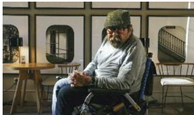
Àngel Casas, en una fotografia de principis d'any.

celona i Ràdio 4 . L'any 1977 va debutar a Televisió Espanyola i va començar a treballar a TV3 poc després del naixement del canal. Va ser allà on es va revelar com a showman en un format que li anava com anell al dit, el talk show. Molts dels millors moments de la televisió catalana dels anys 80 evocuen les seves entrevistes a estrelles de Hollywood, o moments picants com els primers striptease que es van emetre a la cadena pública. L'Àngel Casas Show va rebre els premis Antena de Oro (1984) i Ondas (1986).