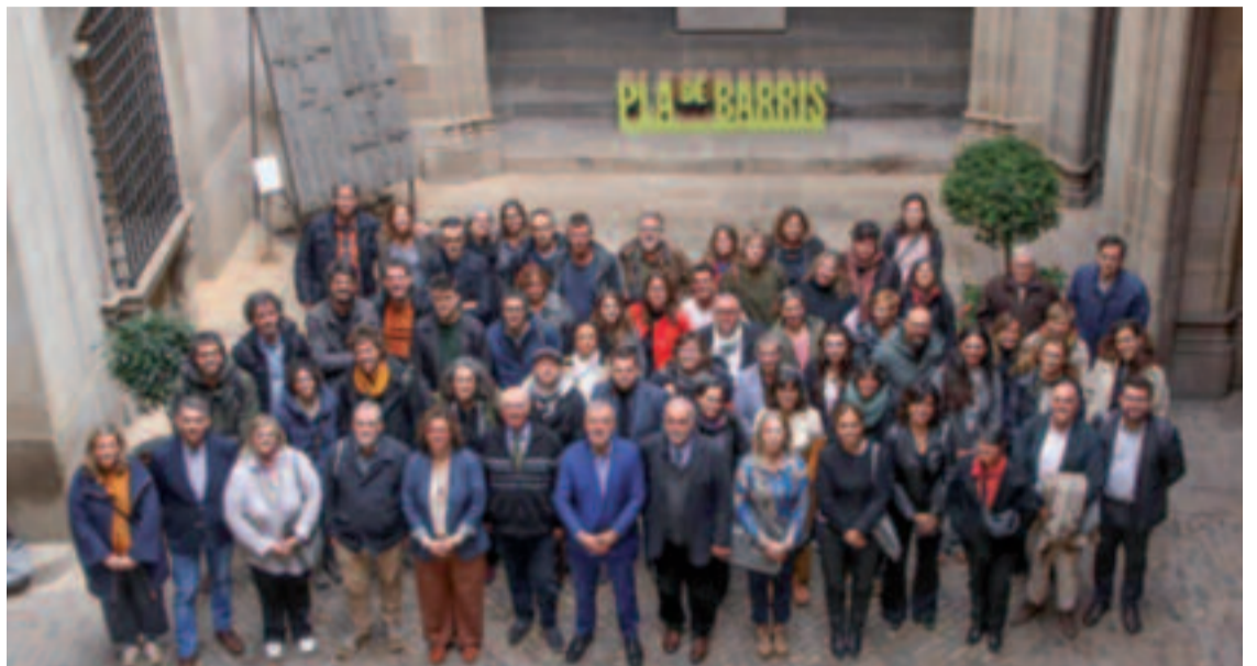
Imatge grupal de la presentació del Pla de Barris.

També destaca la incorporació del menjador solidari Gregal al programa Alimenta de l'Ajuntament. Es promourà l'autonomia i sostenibilitat del menjador social, i es destinaran nous espais de la cooperativa que el gestiona per a impulsar iniciati-