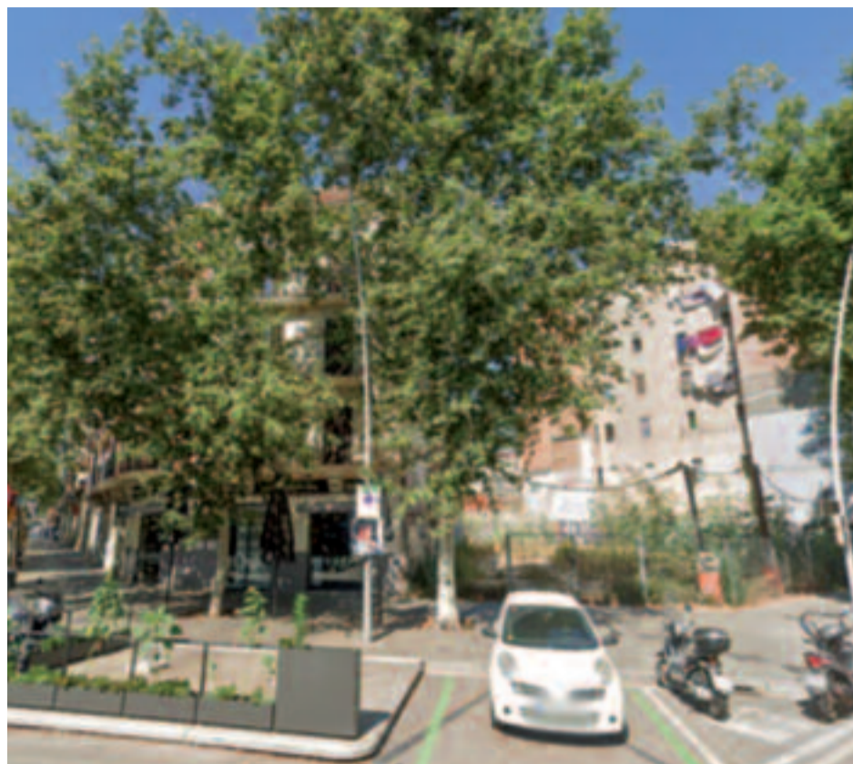
A l'esquerra, una imatge virtual de la futura promoció. A la dreta, el solar on es farà el bloc.