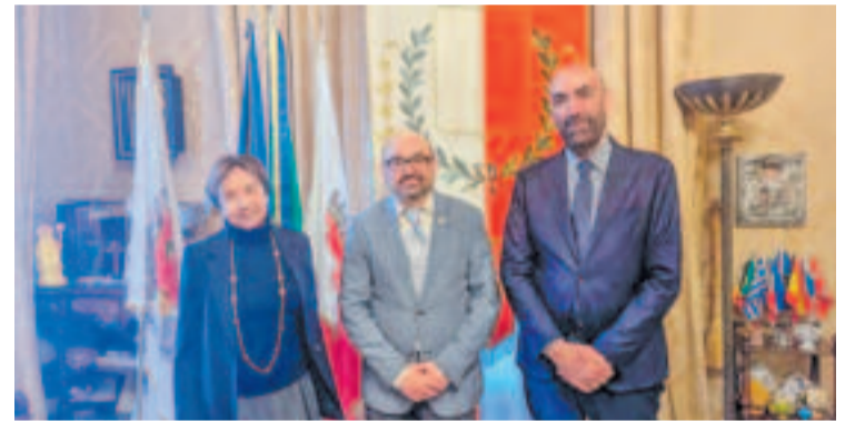
Barcelona Comerç ha visitat Bari per la capitalitat.

Durant la visita, Barcelona Comerç va mantenir trobades amb l'Ajuntament de Bari i entitats comercials per compartir experiències sobre la CECP, que té previst iniciar la seva primera edició el 2026. Amb aquesta participació, l'entitat reforça el seu lideratge en la promoció del comerç local i obre vies de col·laboració amb altres ciutats europees.