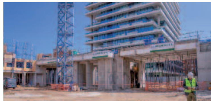
Imatge del solar on hi havia La Sibèria.

HABITATGE ▶ Sant Martí acollirà més de 460 nous habitatges protegits gràcies a tres iniciatives impulsades per l'Ajuntament i la Generalitat.