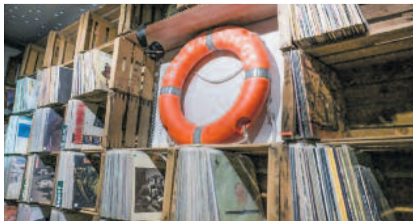
Salvadiscos és al barri barceloní del Poble-sec.

Salvadiscos, amb més d'11.000 socis, és, per tot plegat, un punt de trobada per a amants de la música.