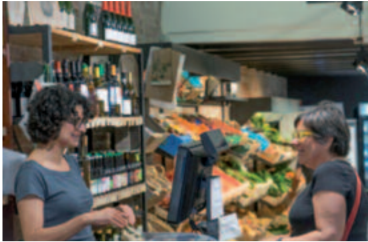
El Poblenou és un barri una xarxa gran de petit comerç.

Més enllà del reconeixement dels guardons, els guanyadors rebran vals de compra de fins a 50 euros per fer servir al barri. "Hi pot participar tothom, amb una càmera o un telèfon mòbil. La idea és que la gent entri a les botigues i que se les mirin amb