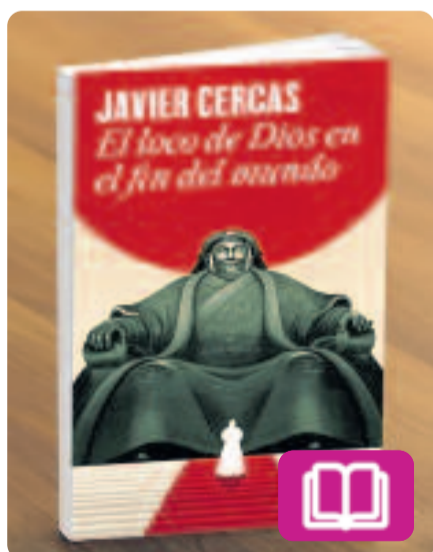
El loco de Dios en el fin del mundo Javier Cercas

Es tracta d'una novel·la que aborda una de les preocupacions fonamentals de la societat actual: el paper de la religió i de l'espiritualitat avui dia i la recerca de la immortalitat. Ho fa partint d'una proposta que li va fer el Vaticà, que, de forma insòlita, li va oferir fer un viatge a Mongòlia juntament amb el papa Francesc.