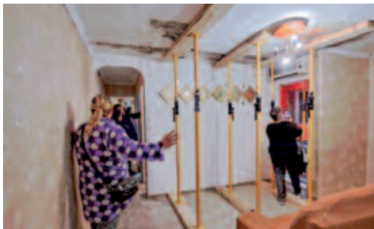
Un pis del Besòs i el Maresme apuntalat.

Els primers passos del pla es remunten al març del 2021, quan el