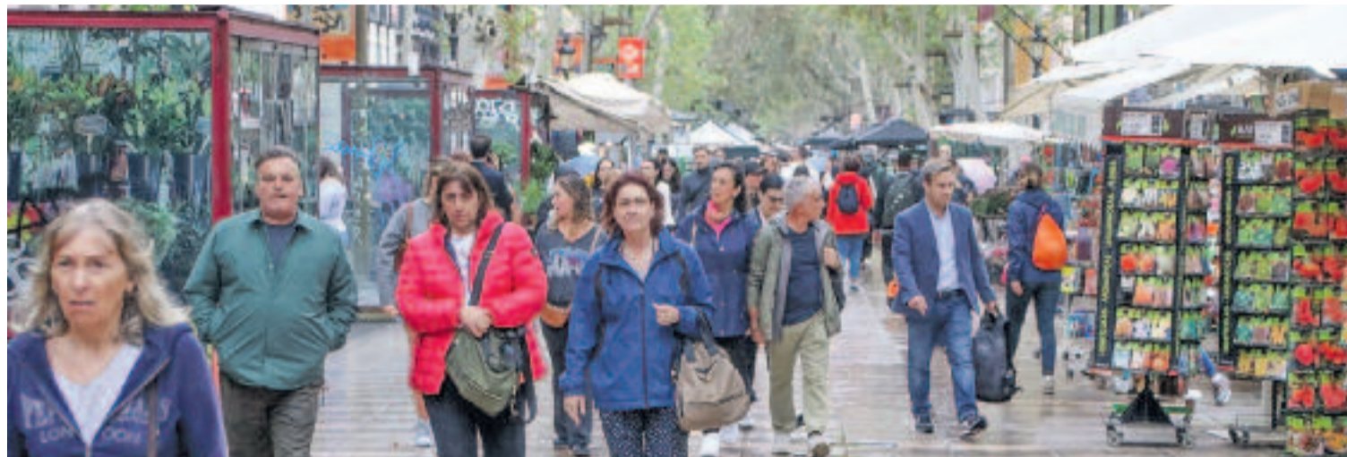
Barcelona destaca per ser una ciutat multicultural i en districtes com el de Ciutat Vella es fa molt evident.

COM S'AGRUPA LA POBLACIÓ? Ciutat Vella és el districte on hi ha més veïns nascuts fora de Barcelona, ja que només un de cada quatre és autòcton. Segons mostren les xifres, hi ha un 24% de població autòctona davant d'un 76% de població no autòctona, mentre que el