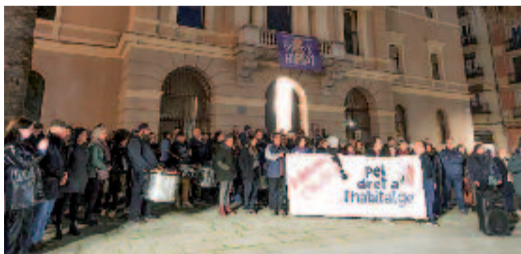
La protesta veïnal va tenir lloc l'11 de març.

El manifest SOS habitatge Poblenou , signat per una seixantena d'entitats, reivindica, entre altres, la tramitació "immediata" de 1.578 habitatges de promoció pública al 22@ i el compromís d'establir un calendari per fer els 980 pisos d'iniciativa pública previstos a la zona de les Glòries. A més, el text reclama a l'Ajuntament que compri solars, blocs i habitatges