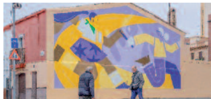
El mural està situat al número 14 del carrer Trinxant.

ART ▶ En el marc del Dia Internacional de la Dona, el projecte Dones en moviment: la lluita no s'atura ha omplert de color i reivindicació el número 14 del carrer Trinxant. L'artista Núria Toll va acabar fa pocs dies un mural que simbolitza el relleu generacional en la lluita feminista.