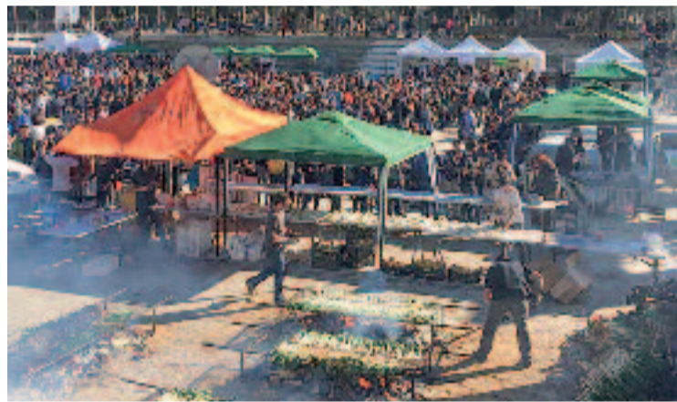
La calçotada de l'Eix Clot aplega molts veïns del barri.

Amb més de 3.000 persones en les darreres edicions, el festival vol continuar sent una festa de proximitat, potenciant el comerç del barri i mantenint l'essència de les primeres calçotades impulsades per l'Eix Clot. Els tiquets per la jornada només es poden comprar a les botigues del barri.