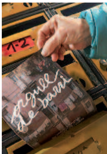
Fulletó de la campanya.

A finals de febrer, el col·lectiu Rebobinart, que ha impulsat el mural, va haver d'esborrar-ne un d'anterior per complir amb la normativa municipal.