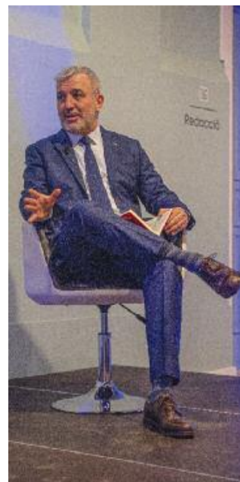
La sala de conferències de l'Espai Línia es va omplir per escoltar Jaume Collboni.