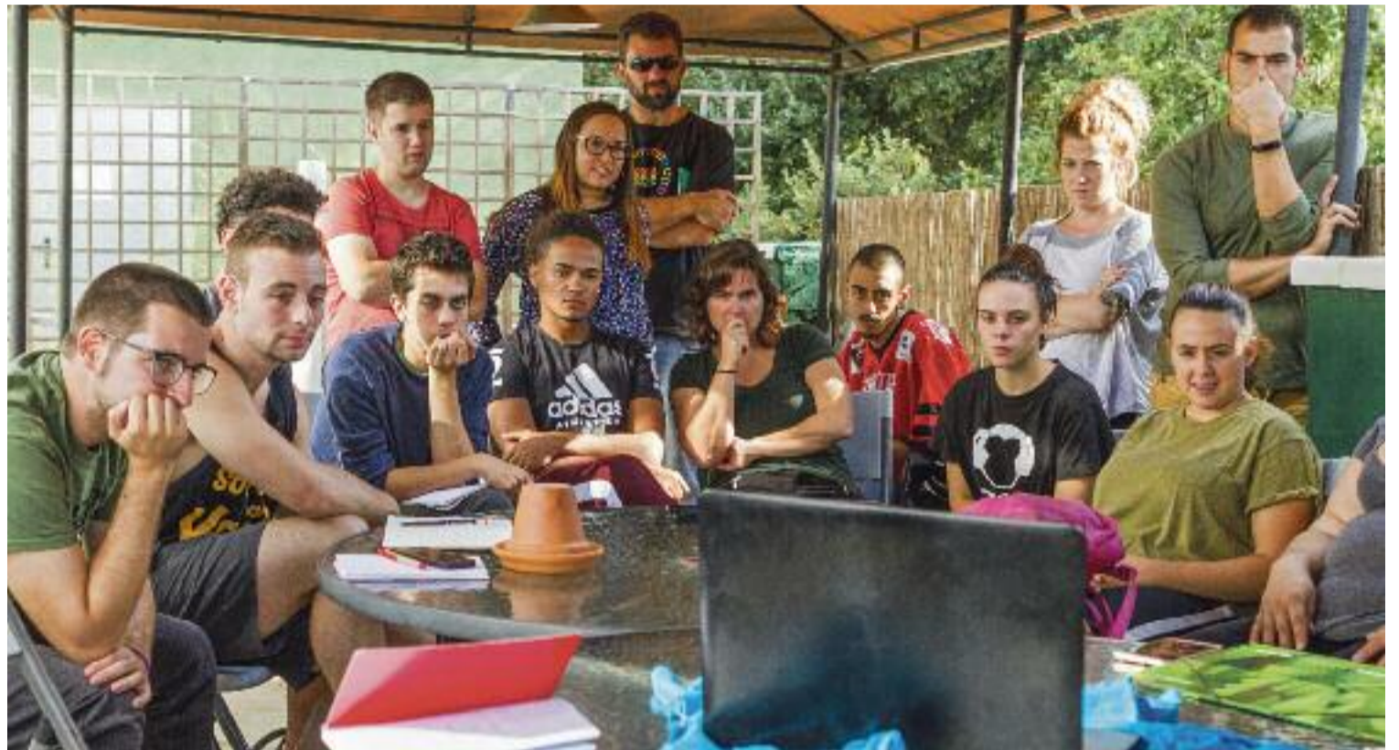
Un dels grups de joves que va participar en una de les trobades del projecte 'Lideratge per a joves'.

Per tant, el curs busca que els joves que ja formen part del teixit social de la seva zona es rela-