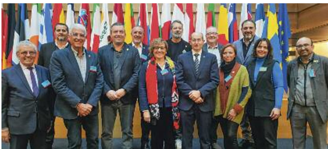
Foto de família de la comitiva barcelonina a Estrasburg.

Per la seva banda, el text aprovat pels eurodiputats recorda que el comerç minorista representa un 11,5% del valor afegit de la Unió Europea, i que dona feina a gairebé trenta milions de persones. També subratlla que el petit comerç evita la "degradació" dels centres de les ciutats. És per aquests i altres motius que la majoria dels eurodiputats consideren necessari crear "consciència col·lectiva de la importància econòmica i social" que té aquest sector.