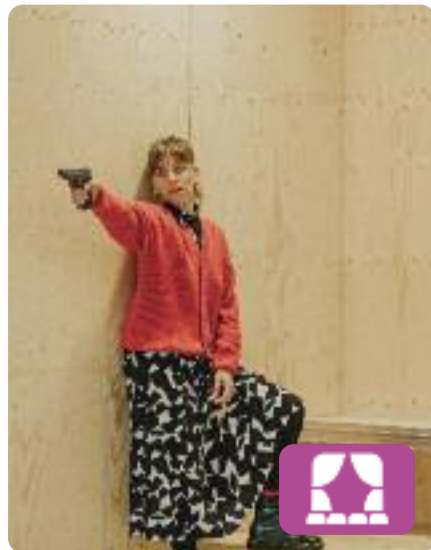
Hedda Gabler Hedda Gabler