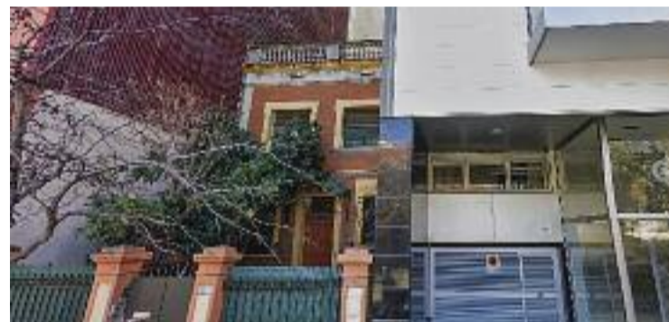
La casa, de l'any 1914, es trobava al 111 del carrer Xifré.