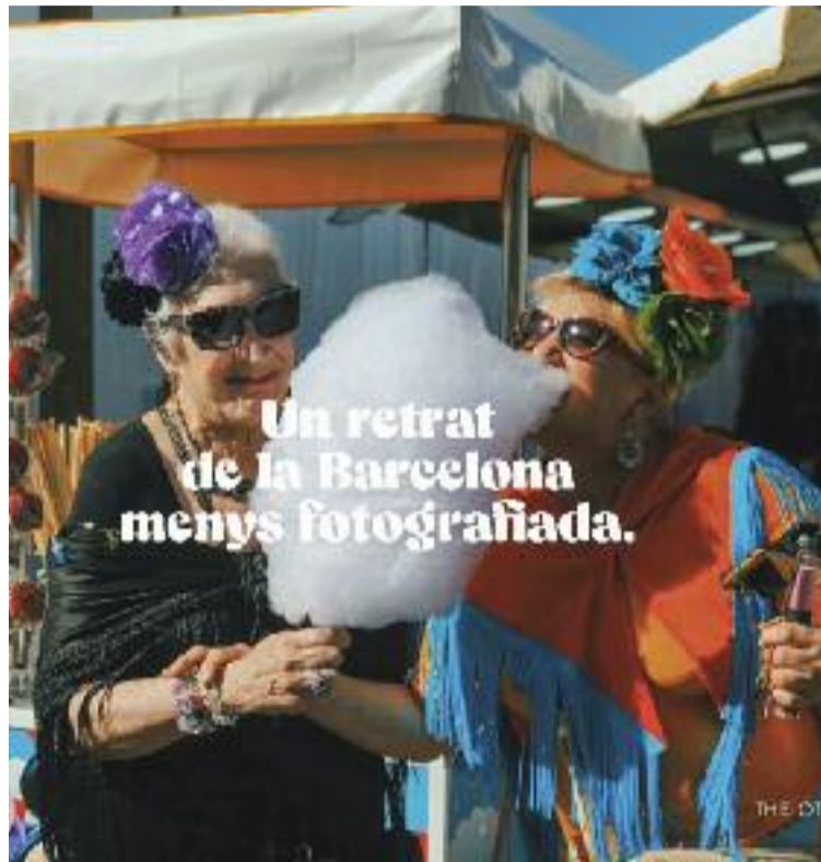
Un cartell promocional de l'exposició 'L'altra ciutat' i una de les fotografies que en forma part.

Després d'un primer intent frustrat amb molts centres cívics de barris cèntrics o benestants, el fotògraf va crear postals de les zones protagonistes de l'exposició, hi va escriure "Greetings