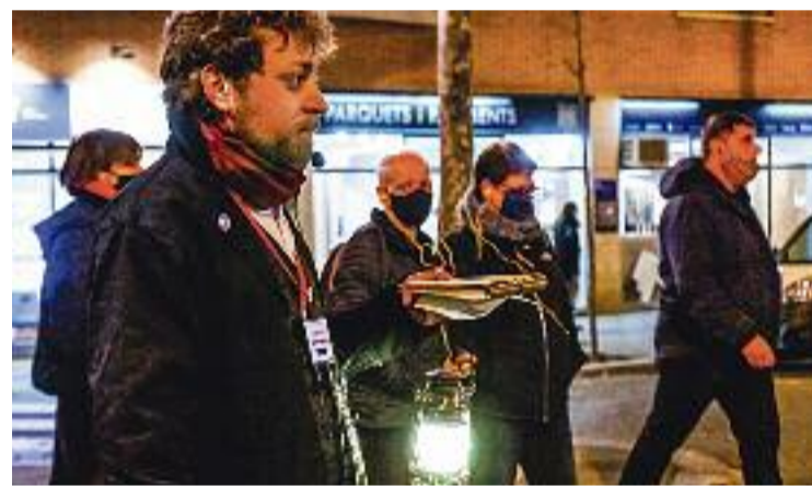
Un moment d'una de les rutes.

Després de tres dies de rutes, afirma Romerp, el balanç que fa l'associació de comerciants de la iniciativa és "molt positiva". De les 60 places que hi havia disponibles, totes 60 es van omplir i, a més, més gent s'hi va anar afegint durant el transcurs d'aquesta activitat plena de misteri.