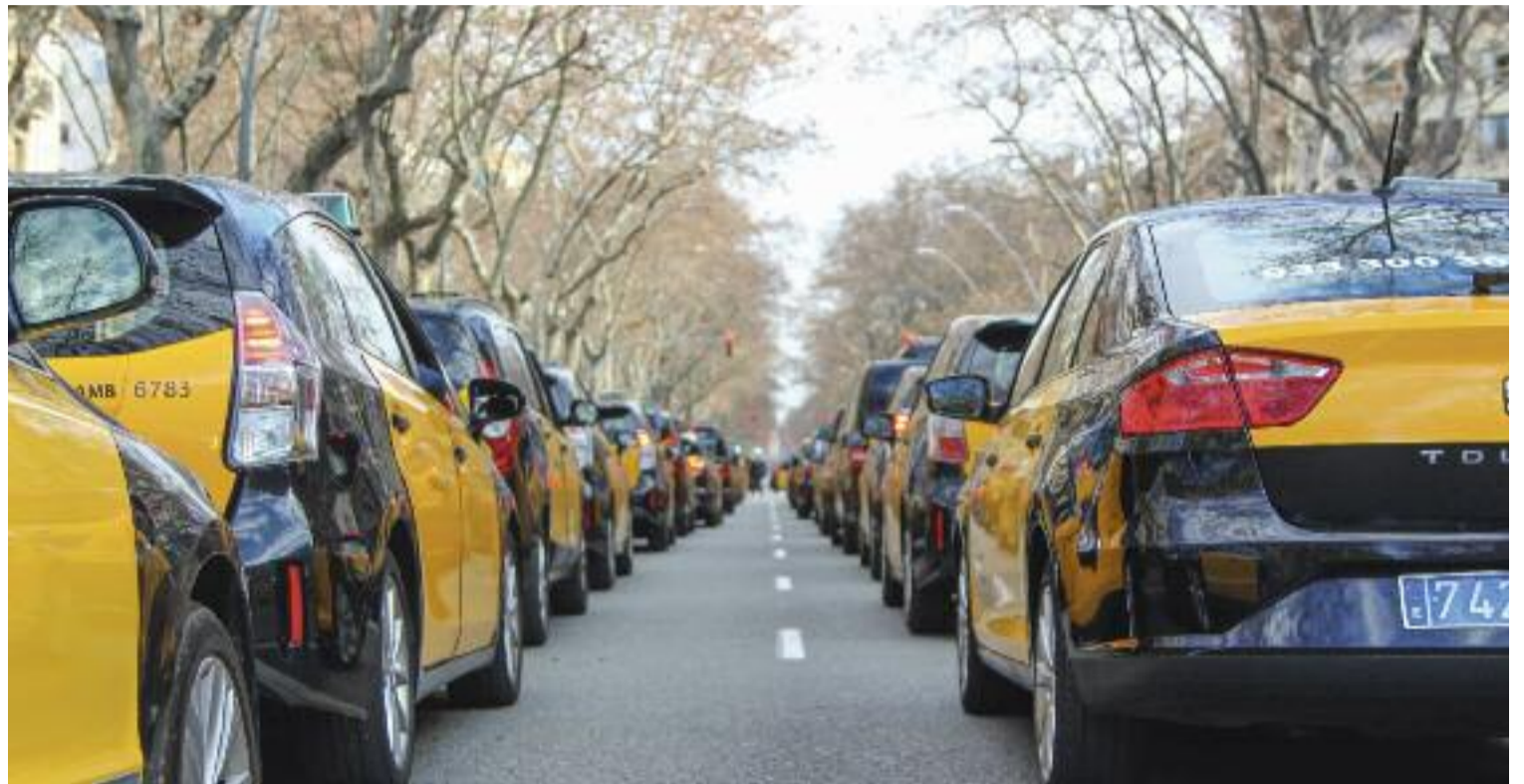
Un moment de la manifestació on van participar 600 taxis, segons la Guàrdia Urbana, i entre 2.000 i 3.000, segons Élite Taxi.