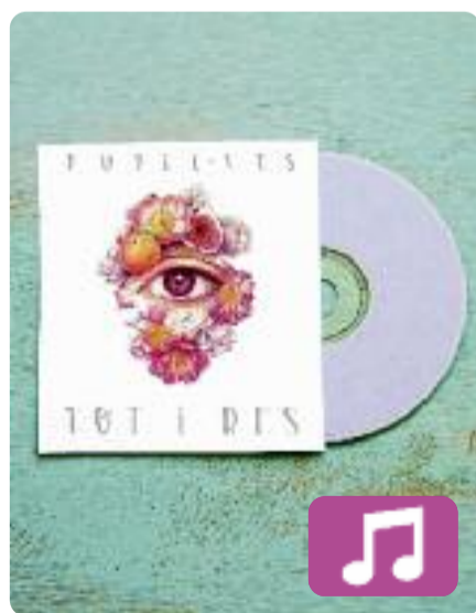
Tot i res Pupil·les

Amor, optimisme i alegria són tres ingredients molt presents al nou àlbum de Pupil·les, Tot i res (Halley Records). El segon disc d'aquestes dues valencianes homenatja el poeta Joan Vinyoli amb el títol i aplega una desena de cançons que s'allunyen una mica del rap més dur que feien abans, i s'inclinen per melodies i ritmes més festius.