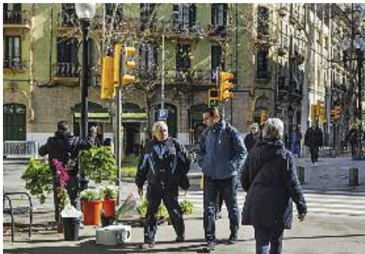
Els carrers més comercials no acaben de revifar.