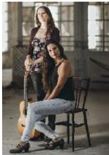
Las Isabeles.

Aquest anunci, però, ha avivat crítiques entre part del veïnat. Des de l'Observatori de Barris del Poblenou van dir a beteve que s'hauria de prioritzar la construcció d'habitatge assequible i no les empreses. "Molta gent acabarà sent expulsada del barri", van alertar.