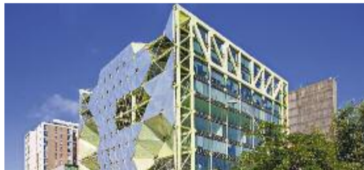
La reforma del 22@ ha fet un pas endavant.

EL POBLENOU ▶ El pla definitiu sobre el futur del 22@ va veure la llum el passat 9 de febrer. Tal com va presentar l'Ajuntament, el projecte, que s'haurà de votar al Ple del pròxim 25 de febrer, es caracteritza per l'increment de l'habitatge i per reforçar l'activitat econòmica i tecnològica de la ciutat.