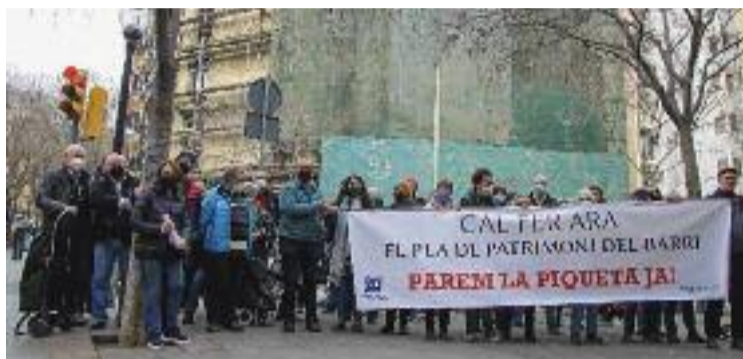
La demanda ve de fa temps.

Catasús recalca que la idea inicial de la propietat, una de les empreses de Núñez i Navarro, era enderrocar l'edifici sense conservar el seu patrimoni i fer-ne un de nou que no tenia res a veu-