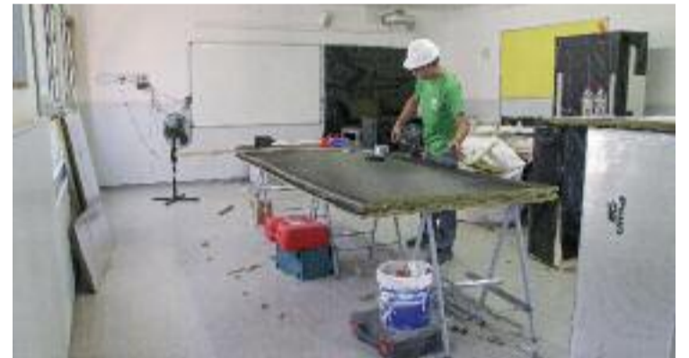
Obres de climatització a l'escola Els Llorers de Barcelona.

En relació amb els terminis de les obres, l'objectiu és que les escoles puguin obrir el 9 de setembre, encara que no totes tindran els treballs enllestits. Segons Collboni, en alguns casos les obres s'allargaran durant tot el darrer trimestre d'aquest any i després es plantejarà el pròxim paquet d'escoles a millorar.