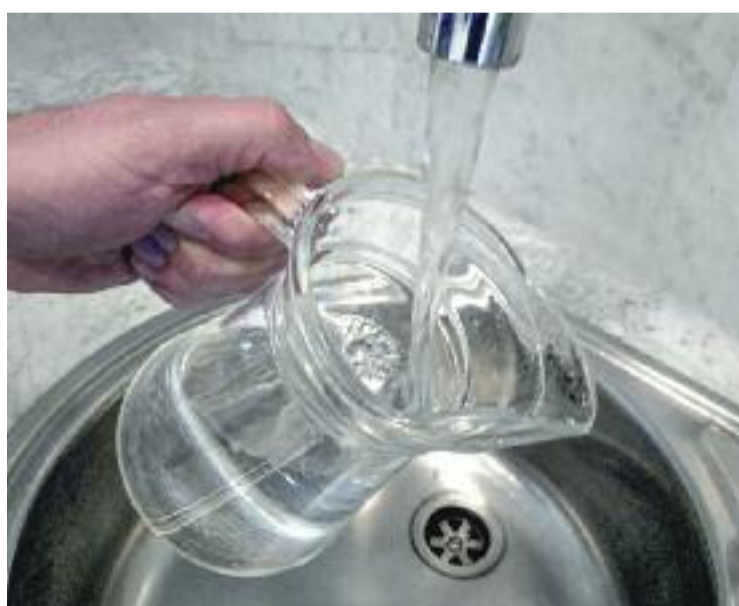
El Govern aconsella aprofitar tota l'aigua possible.