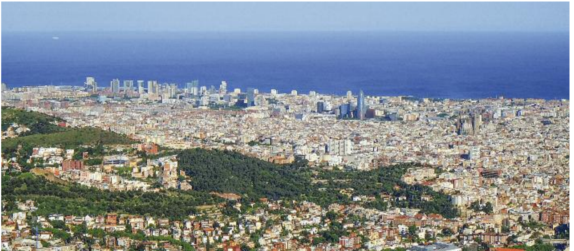
Barcelona i la seva àrea metropolitana continuen fent passos endavant a favor de la sostenibilitat.