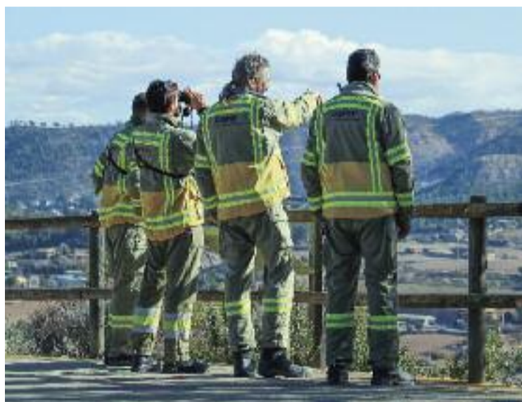
Grup de Prevenció del Departament d'Acció Climàtica.