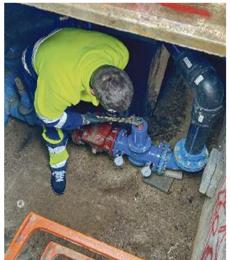
Imatge d'arxiu d'un operari en una canonada.

Pel que fa a la distribució dels 100 milions, la Diputació ha adjudicat d'entrada 100.000 euros a cada ajuntament, partida que suma 31 milions d'euros, mentre que els 69 milions restants els distribuirà entre els municipis "en funció d'un conjunt de variables i sota criteris objectius d'equitat".