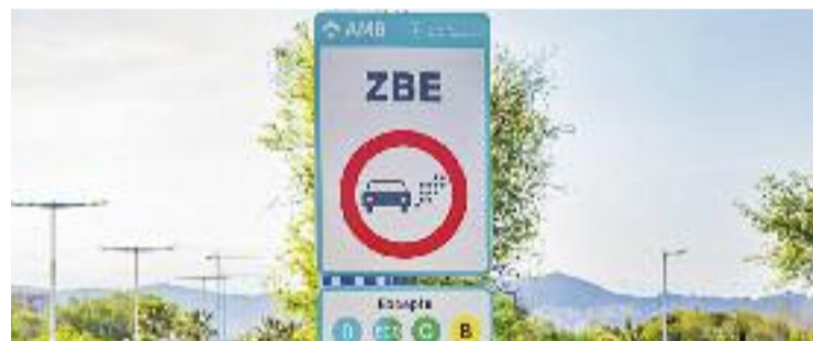
La ZBE a l'àrea metropolitana de Barcelona.

Tot plegat es tracta d'una actuació en la línia del pla que la Generalitat està impulsant per millorar la qualitat de l'aire. En aquest sentit, es preveu que l'aplicació de les ZBE als municipis de més de 20.000 habitants permeti acabar el 2025 amb un 15% menys d'emissions d'òxid de nitrogen i partícules en suspensió.