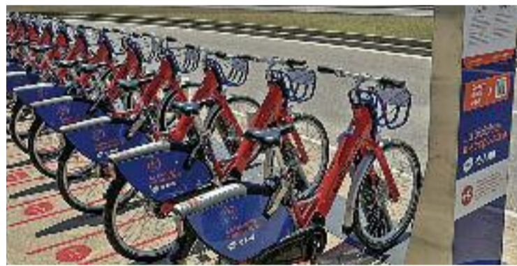
Nou aparcament +P a Castelldefels.

BICICLETA ▶ Alguns usuaris del servei AMBici, titularitat de l'Àrea Metropolitana de Barcelona (AMB), es troben que, en algunes de les estacions amb més demanda, i sobretot en les que estan situades a la platja ara que és estiu, no hi ha lloc per aparcar la bicicleta quan acaben el seu trajecte, fet que els obliga a esperar un lloc o a continuar pedalejant fins a una altra estació. Amb l'objectiu de solucionar aquest problema i facilitar la mobilitat en aquest mitjà de transport, l'AMBici ha estrenat 280 aparcaments nous.