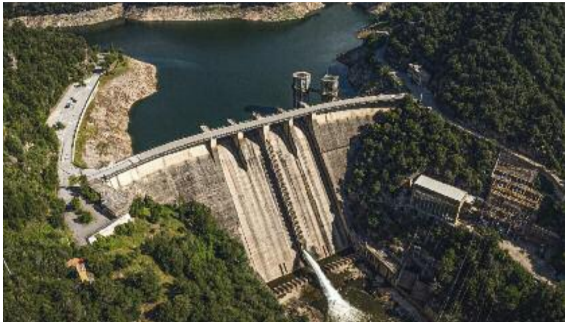
Imatge d'arxiu de la presa del pantà de Sau.

» Les mesures adoptades han permès que la població tingui aigua » L'ACA fa un balanç positiu de la tasca feta en els darrers tres anys