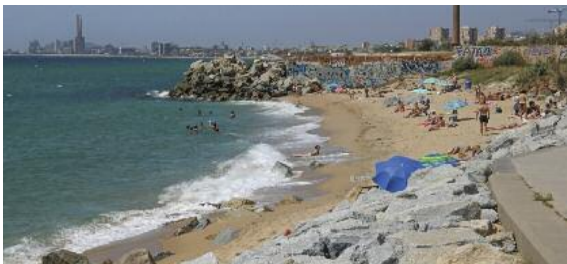
Imatge d'arxiu d'una platja de Montgat aquest estiu.

Al mateix temps, Torra assegura que el litoral de l'àrea me-