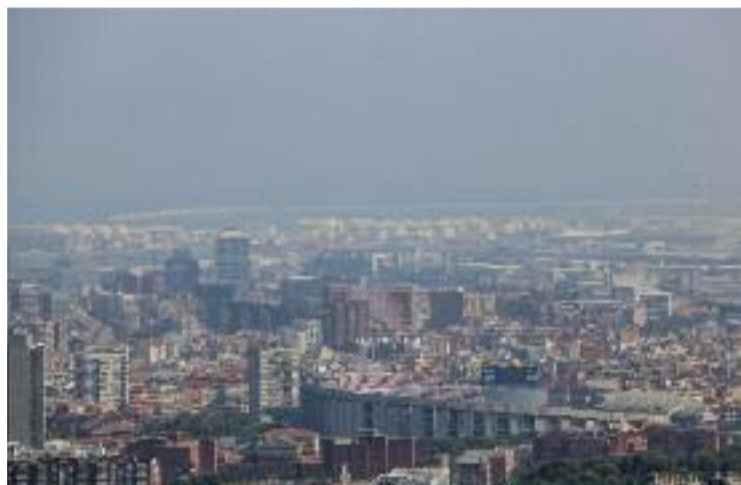
Imatge d'arxiu de boira per pol·lució a Barcelona.

Malgrat que es tracta de xifres alarmants, el document també destaca que hi ha hagut una significativa millora de la qualitat de