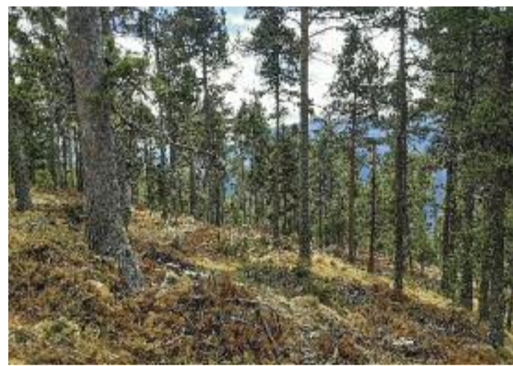
Fins al 15 d'octubre no es pot fer foc al bosc.

La norma també estableix que en la franja de 500 metres que envolta qualsevol zona boscosa o altres àrees naturals tampoc es pot encendre cap foc, sigui quina sigui la finalitat.