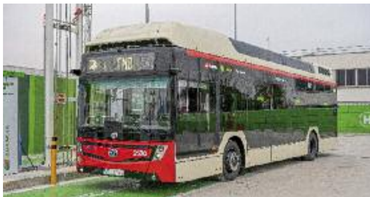
Imatge d'arxiu d'un bus d'hidrogen de TMB.

Aquest vehicle és el primer que arriba del segon paquet d'autobusos d'hidrogen adquirit per TMB. La compra, feta a Solaris Bus Ibérica per gairebé 24 milions d'euros, inclou 38 vehicles d'aquest tipus. Dos d'ells seran articulats pel mateix fabricant i es convertiran en els primers busos articulats d'hidrogen