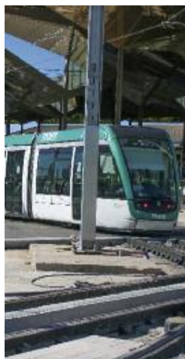
El Tram.

2024, TMB comptarà amb 46 vehicles d'hidrogen que, sumats als 196 elèctrics, "permetran tancar l'any amb un 25% de la flota de bus de vehicles zero emissions". En aquest sentit, ha recordat que "TMB va ser pionera fent circular el primer bus d'hidrogen a Espanya" i que la primera planta d'hidrogen d'ús públic a l'Estat va ser la de TMB i Iberdrola.