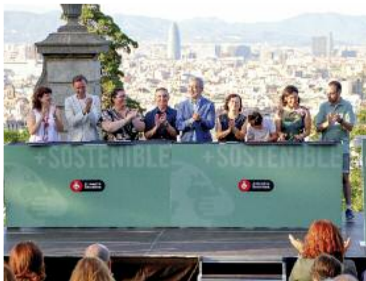
El moment de la firma del compromís.