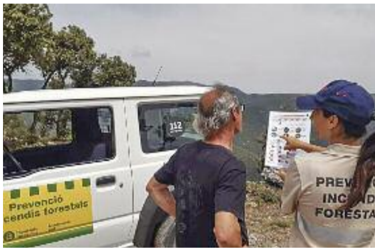
La feina dels informadors per la prevenció d'incendis és clau.

D'una banda, el Govern ha reforçat el cos de Bombers amb 290 nous bombers i 471 efectius extra, mentre que el cos d'Agents Rurals comptarà amb un reforç de 124 persones, arribant fins als 620 efectius. A més, als mitjans aeris s'han afegit 22 màquines entre els helicòpters de comandament, de rescats, els bombarders i els avions de vigilància i atac del foc, que se sumen als 821 vehicles terrestres disponibles. Mentrestant, el Pla Alfa, dedicat a la prevenció i control d'activitats de risc davant del perill d'incendi forestal, s'ha adap-