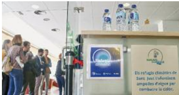
Refugi climàtic a Sant Just Desvern.