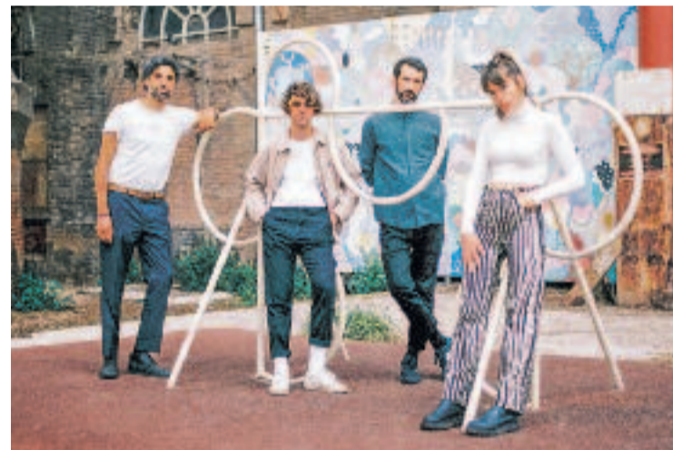
La banda de metal Heal és resident de Fabra i Coats.

Les bandes protagonistes del cicle musical han estat Azulcelestes, Balkan Paradise Orchestra, Senyor Oca, Heal, Mark Cunningham, La Tia Borracha i Omnira. Alguns concerts han tingut la col·laboració de segells com Foehn Records o Radi Solar.