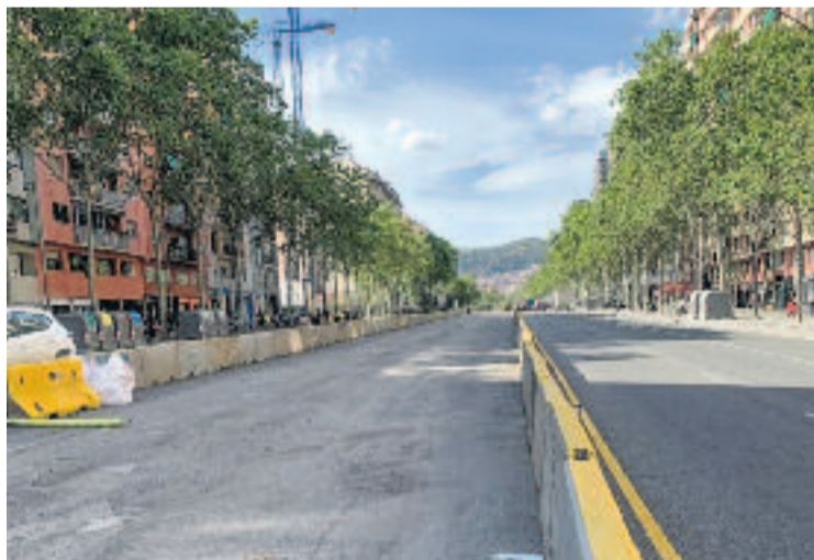
Les obres van començar el passat 28 d'abril.