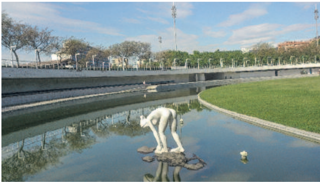
La reforma del Parc de la Trinitat forma part del Pla de Barris.

El nou Pla de Barris es vertebrarà entorn de tres eixos clau —educació i cultura; espai públic i accessibilitat; i habitatge i rehabilitació— i es completa amb estratègies transversals com la salut, el desenvolupament socioe-