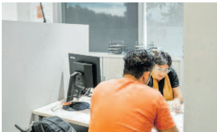
Una sessió d'assessorament en els serveis municipals.

LABase s'impulsa en el marc del programa municipal Làbora i té la col·laboració de l'Ins-