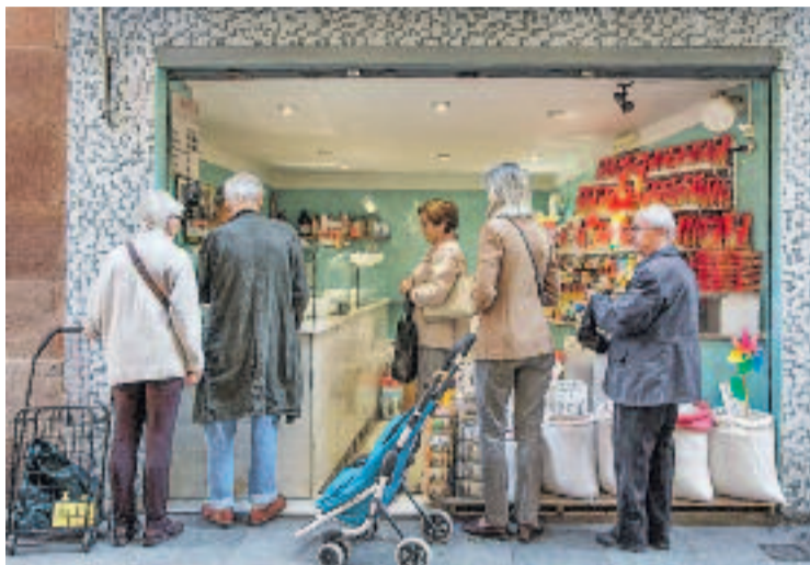
El comerç local és un pilar dels barris.

Un dels trets distintius de la campanya és l'ús d'una combinació de tipografies inspirades