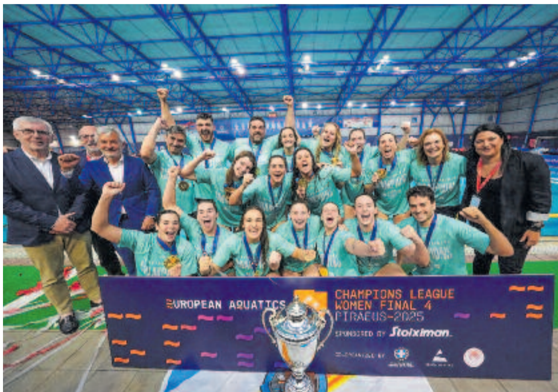
Les jugadores i el cos tècnic del CN Sant Andreu celebren la Champions.

La jugadora sabellenca del CN Sant Andreu ha estat l'MVP, la peça més valuosa de la primera final de Champions de l'equip andreuenc, que guanya el títol en el seu enèsim exercici de resistència, fe i resiliència contra el totpoderós CN Sabadell. El conjunt de David Palma havia alçat les dues últimes copes de la màxima competició continental i al Pireu aspirava a igualar la collita de qui en té més,