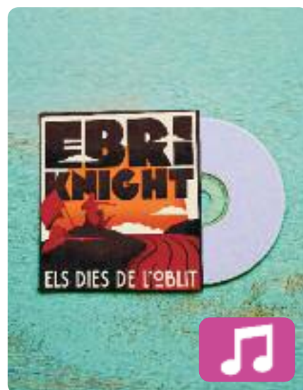
Els dies de l'oblit Ebri Knight