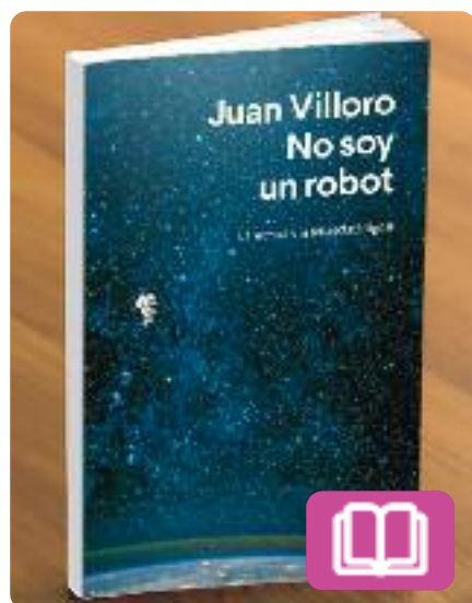
No soc un robot Juan Villoro

Aquesta obra reflexiona sobre com el món digital transforma les nostres vides i la nostra relació amb la lectura. En forma d'assaig, intenta respondre diverses preguntes que tenen a veure amb com influeix la tecnologia en la percepció de la realitat o quin és el lloc en el qual deixa un format d'entreteniment tan important com la literatura.