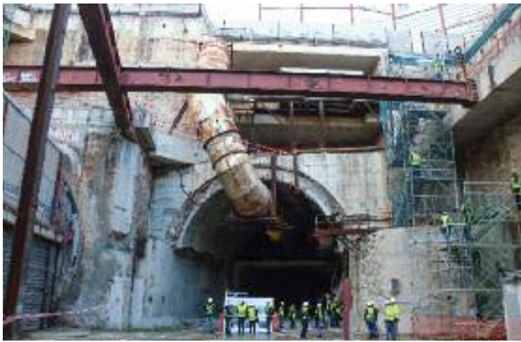
Imatge de les obres del macropou de la Sagrera.

D'altra banda, les galeries de serveis que ja hi ha a la zona