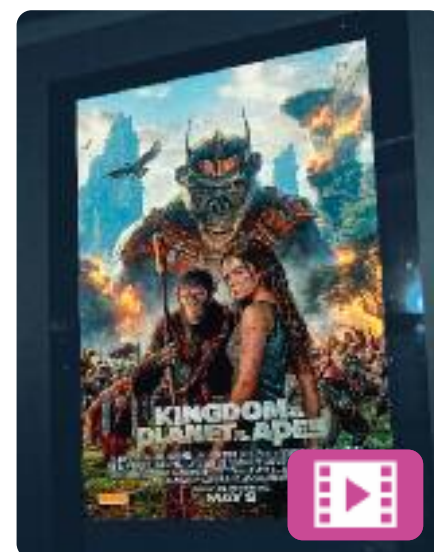
El regne del planeta dels simis Wes Ball

Ambientada en el futur, els simis són l'espècie dominant i els humans s'han vist reduïts a viure a l'ombra. En aquest escenari, un nou líder simi convertit en tirà construeix el seu imperi, però un simi jove el posarà contra les cordes en qüestionar-se tot el que sap sobre el passat. Defensarà els simis i els humans per igual i es crearà un gran conflicte.