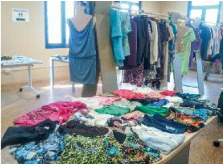
Una botiga de roba de Barcelona.

Segons el Mapa comercial de capitals europees , elaborat per Eixos.cat, que analitza la morfologia comercial de set grans ciutats del continent que sumen prop de 20 milions d'habitants, Barcelona té més de 62.000 es-