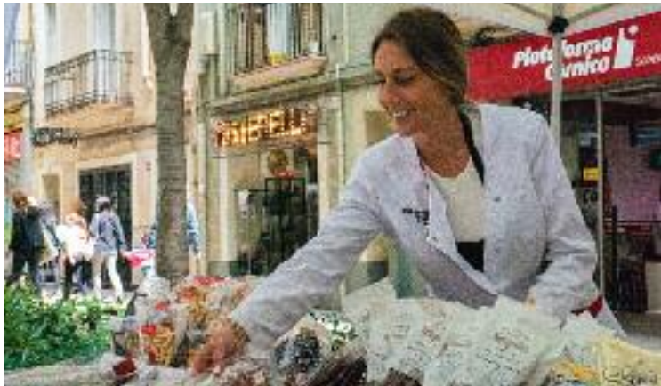
Tot a punt per a una nova festa del comerç al carrer.

Finalment, la festa del comerç de l'Eix Maragall serà a la rambla Onze de Setembre durant tot el dia. Una jornada que també ompliran amb un programa ple d'activitats on destaquen la presència de diferents balls com el Country o els tradicionals xinesos.