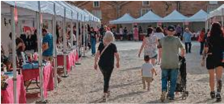
Paradetes de llibres en una edició anterior.

CULTURA ▶ Les idees i llibres radicals de la Fira Litoral, celebren la seva desena edició. Entre els dies 24 i 26 de maig la Fàbrica i Coats tornarà a acollir l'esdeveniment literari més destacat del districte. A més, durant els dos primers dies tindrà lloc el Litoral PRO , les jornades reservades als professionals del sector cultural i literari.