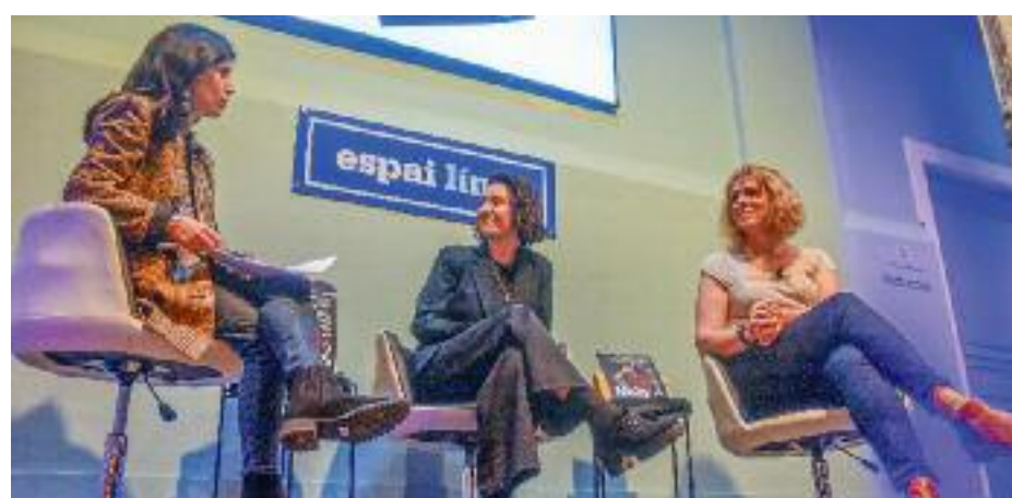
La sala de conferències de l'Espai Línia es va omplir de gom a gom per a la presentació d'Orgull.