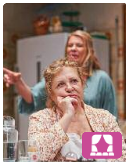
Amnèsia Nelson Valente

Es tracta d'una comèdia sobre les dificultats d'entendre's entre els diferents membres d'una família a l'hora d'enfrontar-se al fet que la mare, puntal de la família, necessita ajuda a partir d'ara perquè ja no pot viure sola. Amb un humor irònic, es planteja aquest tema tan delicat i, a la vegada, tan comú. Es pot veure al TNC (Barcelona) fins al 2 de juny.