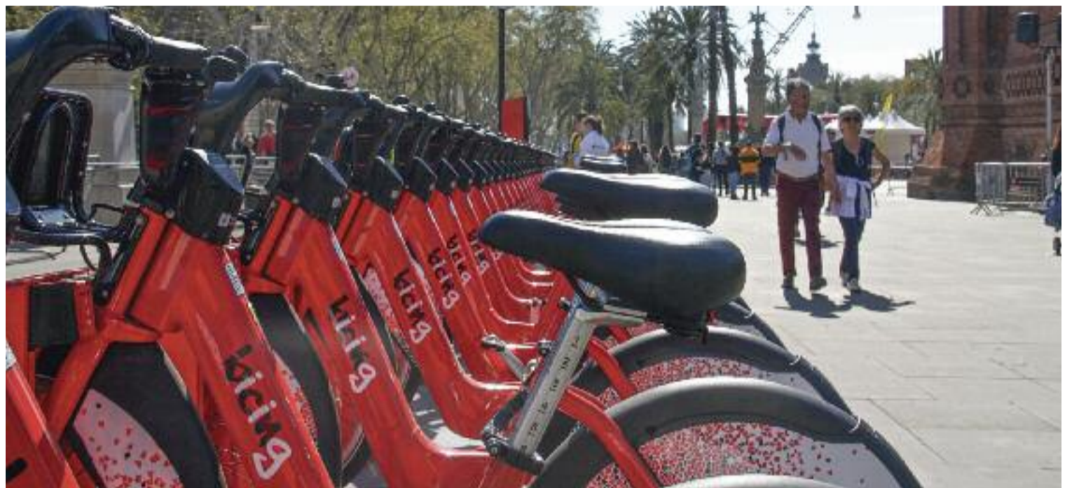
Imatge d'arxiu d'una parada del Bicing, a Barcelona.

D'altra banda, els que vulguin fer servir aquest mitjà de transport fora de Barcelona disposen del servei de bicicleta pública metropolitana AMBici, que funciona en onze municipis metropolitans i que, pròximament, arribarà fins a un total de quinze localitats. Des que al gener es va posar en marxa, s'han