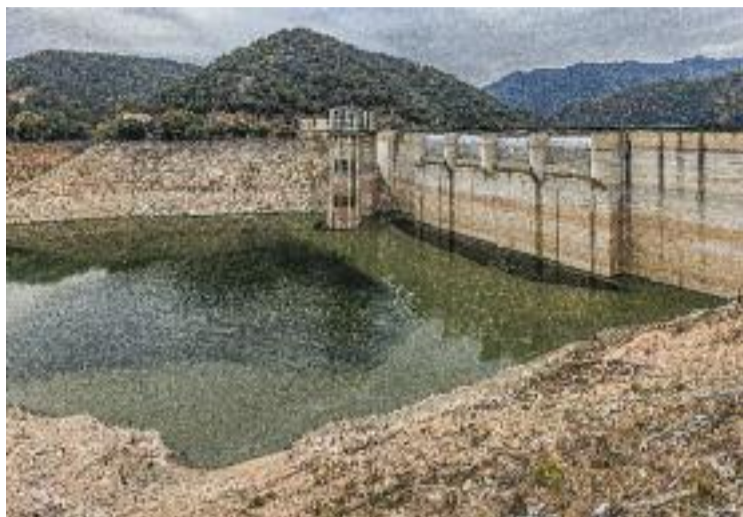
El Pantà de Sau, amb el nivell d'aigua molt baix.

El conseller d'Acció Climàtica de la Generalitat, David Mascort, va indicar a finals de novembre que l'entrada en aquesta fase és una crida a incrementar l'estalvi d'aigua abans d'arribar al llindar d'emergència, quan els embassaments estiguin per sota del 16%. “Fem una crida a tot el país perquè ens posem tots en mode emergència”, va subratllar. Sense anar més lluny, Mascort va definir l'actual avinentesa com “d'emergència nacional”.