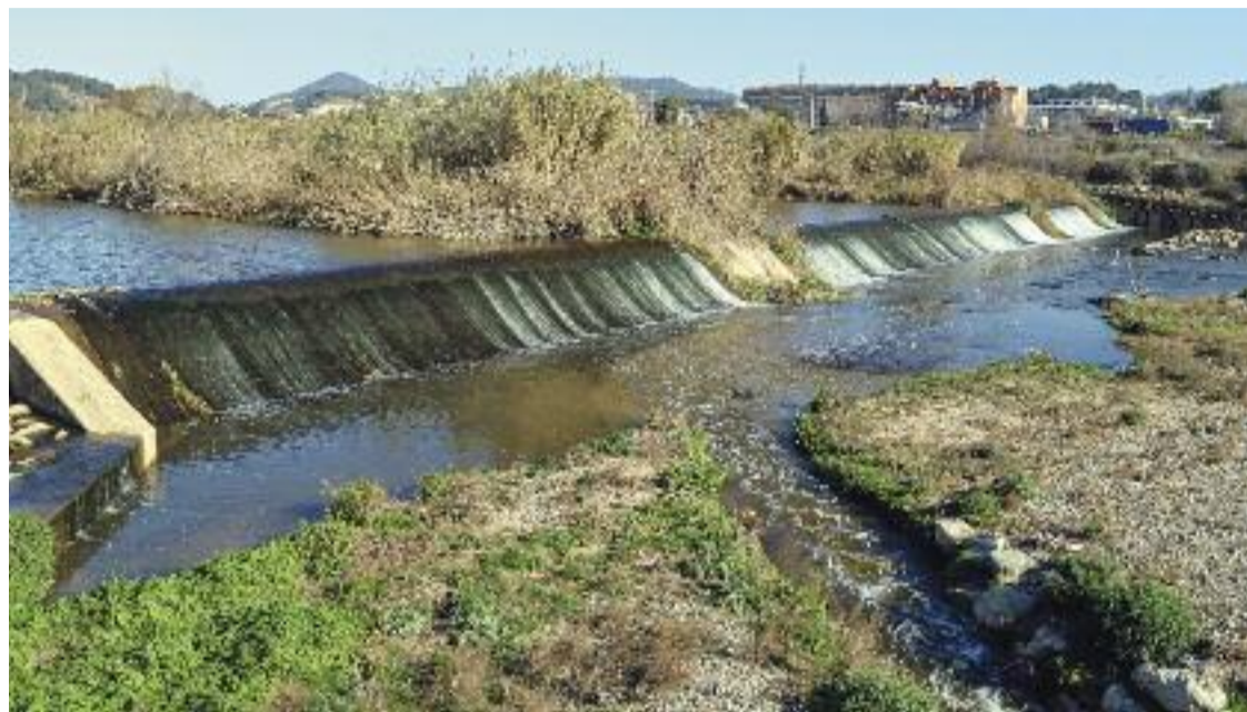
Un canal d'aigua regenerada desembocant al Llobregat.

» Un 25% de l'aigua de l'àrea metropolitana ja és aigua regenerada » L'AMB vol evitar la falta d'aigua que preveu que hi haurà el 2050