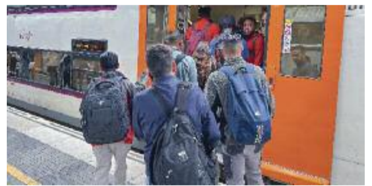
Passatgers puguen a un tren de Gavà.

REPTES ▶ "No podem demanar consciència ecològica si no oferim unes connexions que puguin competir amb la mobilitat privada". Són paraules de l'alcalde de Gavà, Gemma Badia, durant una entrevista a l' Espai Línia de finals de març, en clara referència a la millora de la connectivitat en tren a la metròpoli. En aquest sentit, el servei de Rodalies és un element clau per avançar cap a un horitzó de reducció de l'ús del vehicle privat.