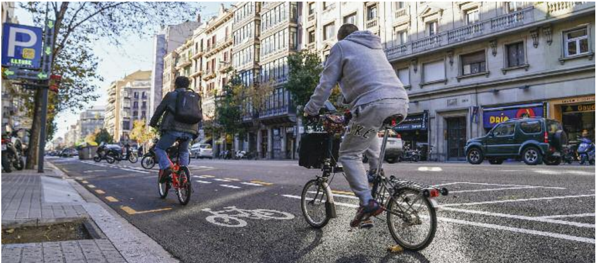
Fomentar la mobilitat sostenible, com la que es fa en bicicleta, és un dels objectius compartits per les diverses administracions.