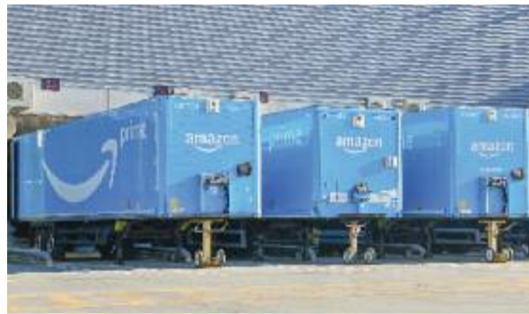
La taxa Amazon ja ha entrat en vigor.

L'objectiu de la taxa és gravar les distribucions de paquets a domicili només als operadors postals que fan un ús “molt intensiu” de l'espai públic pel volum de negoci. Així, afectarà els operadors postals que facturin més d'un milió d'euros per les entregues fetes a Barcelona. D'acord amb això, i segons estima l'Ajuntament, l'hauran de pagar 26 plataformes. D'aquestes, només cinc concentren el 62% del volum de negoci a la ciutat, amb Amazon al capdavant.