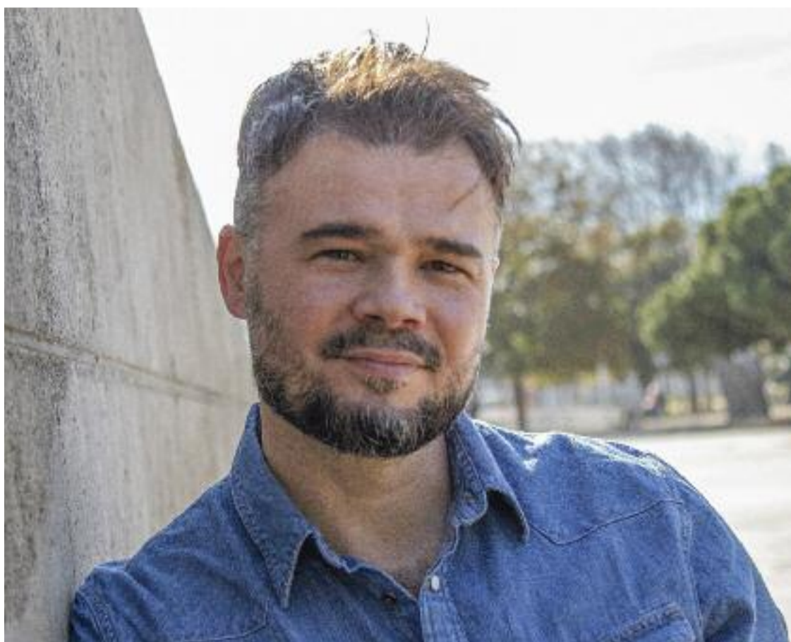
Gabriel Rufián, en una imatge d'arxiu.