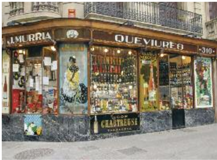
Queviures Múrria, un comerç emblemàtic de la ciutat.

La jornada començarà amb una intervenció dels represen-