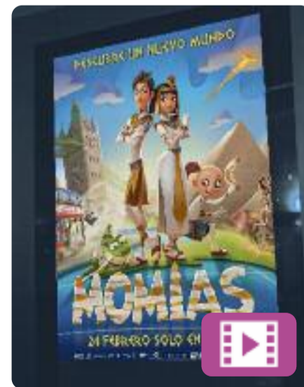
Momias Juan Jesús García Galocha

A la ciutat de les mòries, la princesa Nefer i en Thut es veuen obligats a casar-se contra la seva voluntat. Si en Thut perd l'anell reial, rebrà un fort càstig. Mentrestant, al nostre món, Lord Carnaby fa una excavació arqueològica i troba... l'anell reial. Així, en Thut i la Nefer, juntament amb altres companys, visitaran el món actual per recuperar-lo.