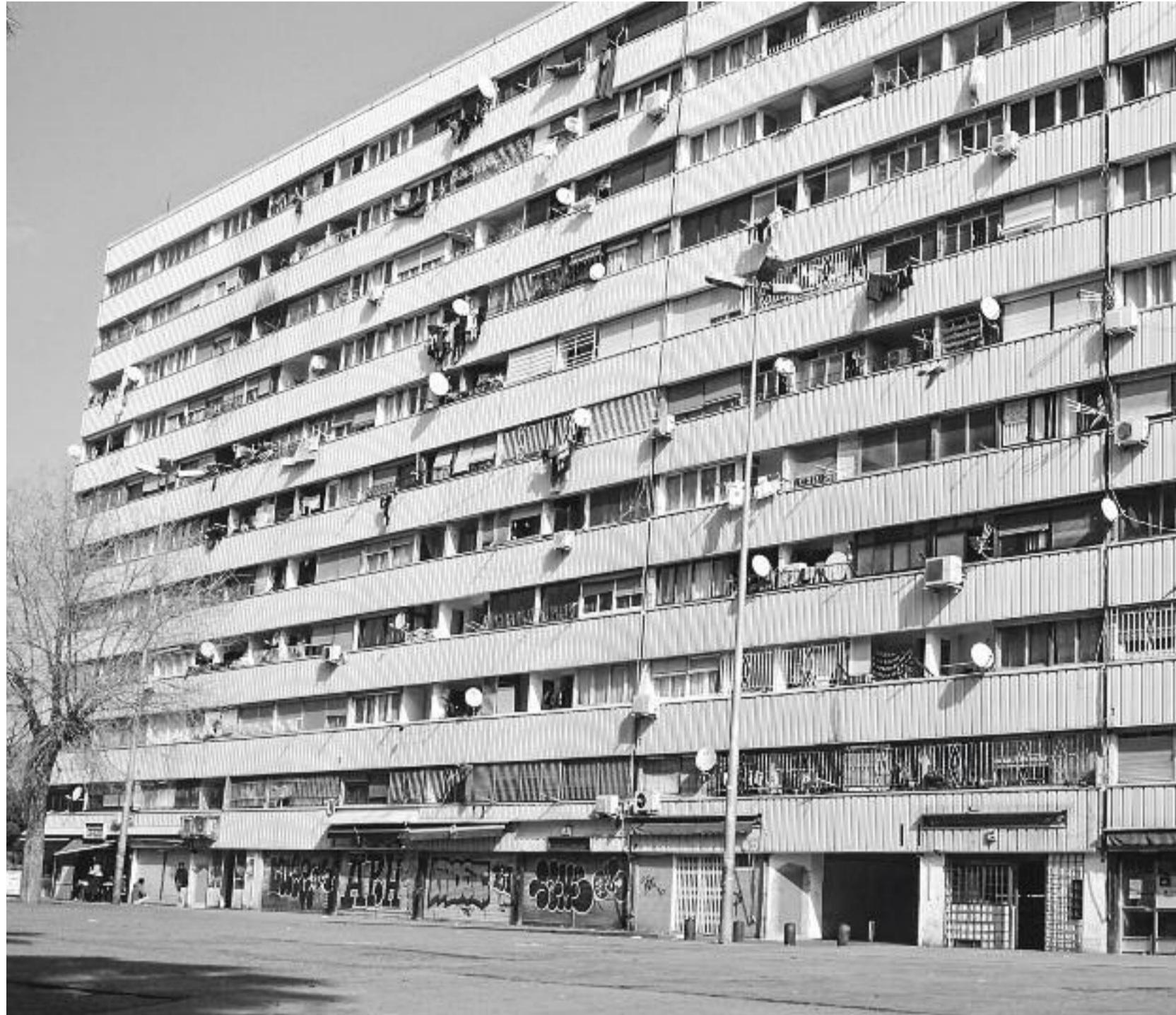
El bloc Venus, situat a la Mina de Sant Adrià de Besòs, és l'exemple més clar d'edifici en estat de degradació a la metròpoli.

No hi ha un únic motiu que expliqui la situació de degradació dels pisos a la metròpoli. De totes