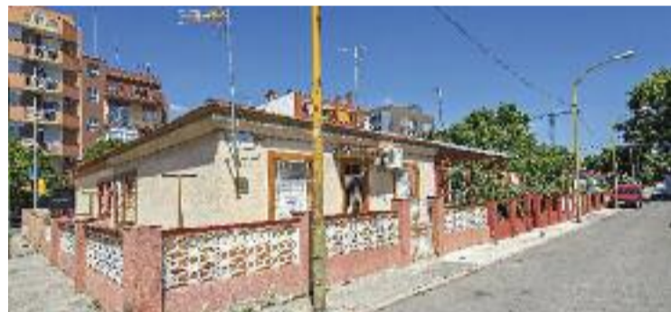
El Bon Pastor és un dels barris on hi ha millores.

SALUT ▶ Un informe elaborat per l'Agència de Salut Pública de Barcelona (ASPB) conclou que el Pla de Barris té un efecte favorable en la salut mental, l'activitat física i la salut percebuda en les dones dels barris on s'ha fet més inversió per habitant.