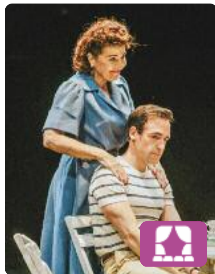
Tots eren fills meus Arthur Miller

Joe Keller i Steve Deever són dos antics socis d'una fàbrica de peces d'avions que, a la Segona Guerra Mundial, va servir peces defectuoses i va provocar la mort de soldats. Deever ho va pagar amb la presó i Keller va quedar lliure i es va enriquir. Els fills respectius desencadenaran les tràgiques conseqüències de la catàstrofe. Al Teatre Lliure de Montjuïc.