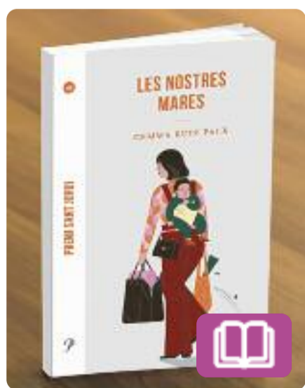
Les nostres mares Gemma Ruiz Palà

A les protagonistes d'aquesta novel·la, nascudes durant la dictadura, no els deixen desplegar el seu talent. Però elles planten cara i no s'acoquinen davant de res ni ningú. I amb sororitat i alegria, defugen la gàbia domèstica, mantenen la pulsio artística, s'atreveixen al més impensable per l'amor d'un fill, lideren les lluites venials i descobreixen el feminisme.