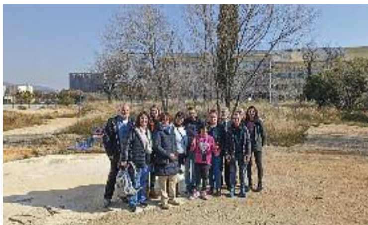
Sostre Cívic, TEB i Ajuntament celebren l'acord.

Així doncs, el projecte el desenvoluparan la mateixa associació Sostre Cívic i la cooperativa TEB, entitat que treballa per una vida inclusiva per a les persones amb discapacitat intel·lectual. Tot plegat forma part de les polítiques municipals de suport a fundacions i cooperatives per augmentar el parc social d'habitatge assequible.