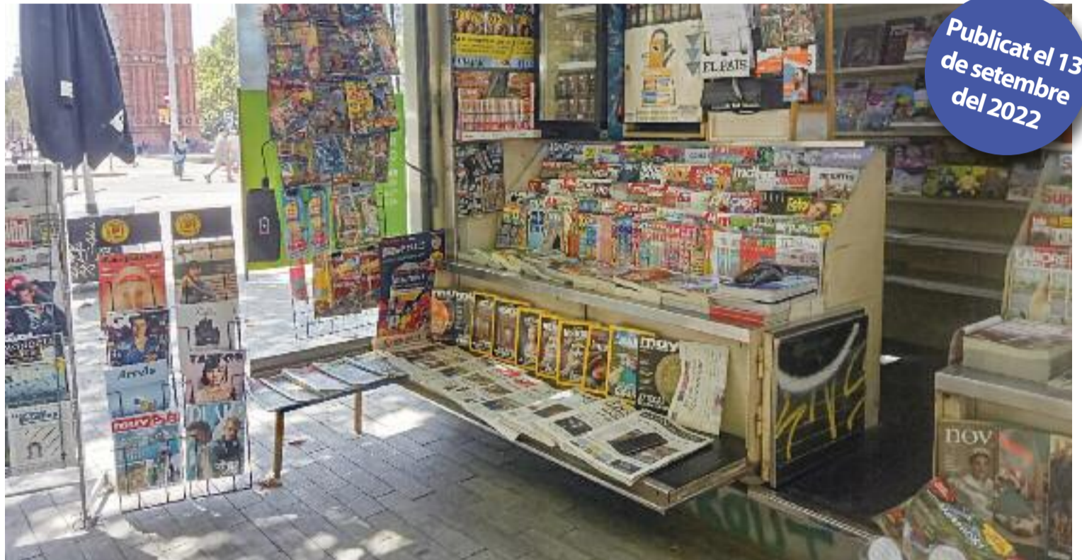
Els quioscos podran vendre cafè, acollir guixetes de distribució de mercaderies i instal·lar caixers automàtics, entre altres.

Aquestes mesures, però, han trigat força a arribar. Segons assenyala Céspedes, l'Associació de Professionals de Venedors de Premsa les demanava des de fa quatre anys amb la finalitat, simplement, de blindar al màxim possible la seva supervivència. "Ens ajudaran molt, ja que sense elles els quioscos hauríem mort en cinc anys", assegura.