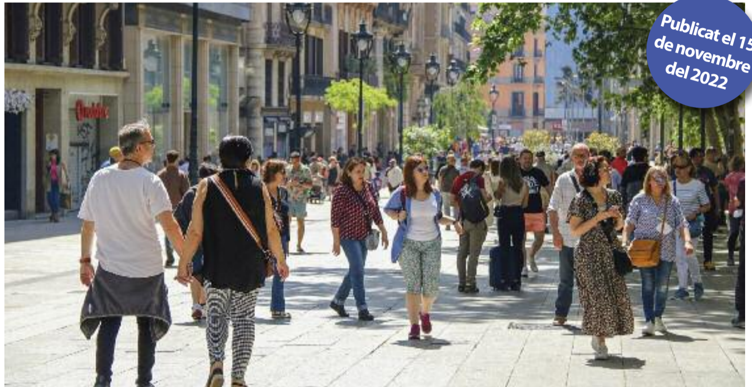
El català és la llengua minoritària entre els joves als deu districtes de Barcelona.