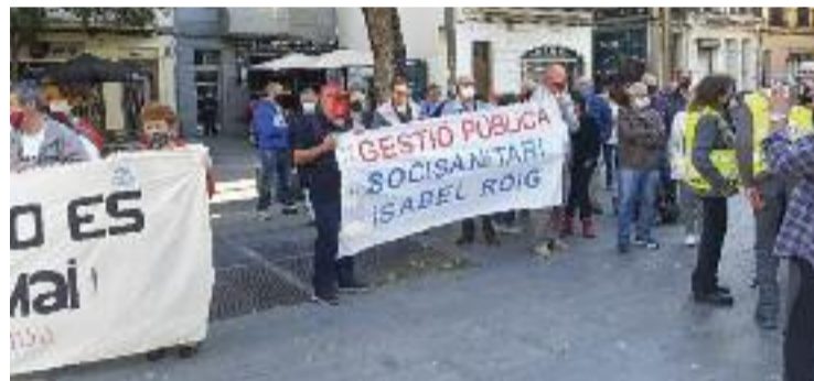
Concentració del passat 28 d'octubre.

SALUT ▶ Un grup de veïns de Sant Andreu, juntament amb altres de Nou Barris, es va mobilitzar el passat 28 d'octubre per demanar que la gestió del centre sociosanitari Isabel Roig, ara en mans de l'empresa privada Blauclínic, passi a ser pública.