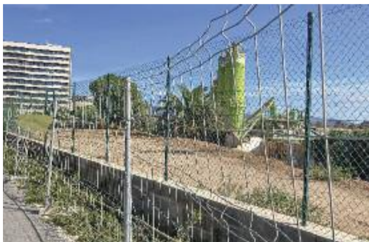
El solar situat al passatge de Bofarull.