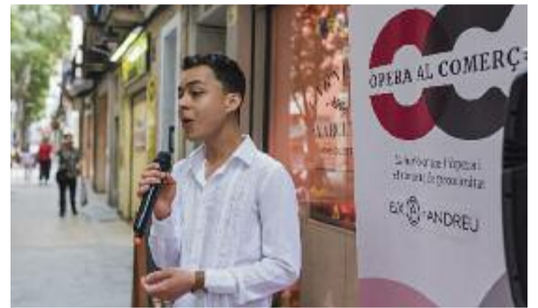
La iniciativa tindrà lloc el pròxim 5 de novembre.