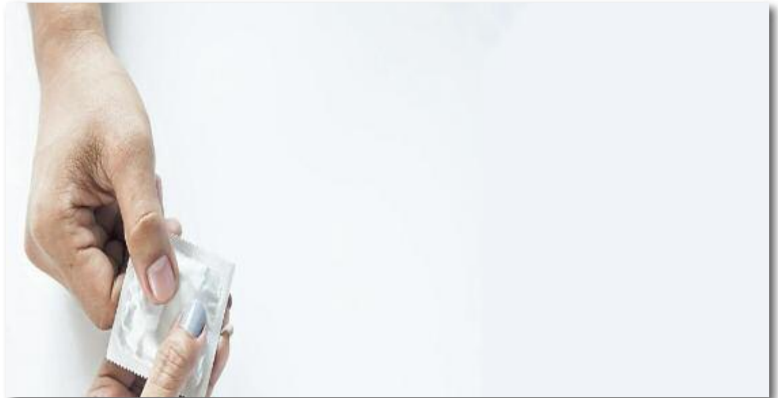
L'educació sexual és un element clau per evitar el creixement d'aquestes malalties.