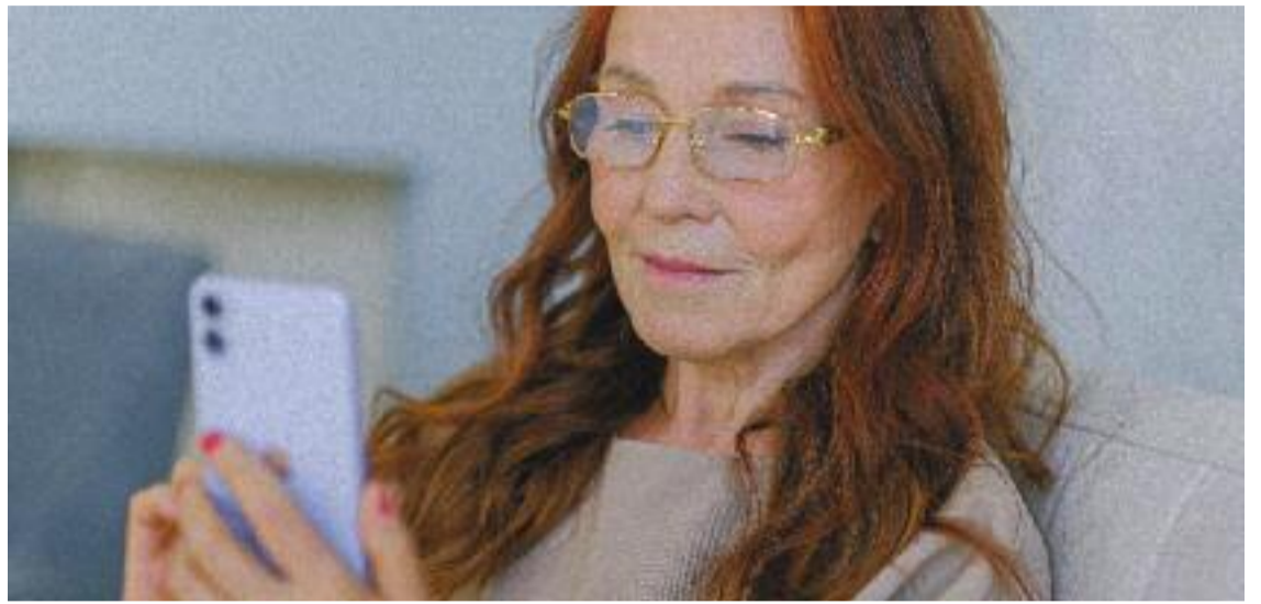
A través d'un simple SMS pots accedir a molts serveis de la Seguretat Social.

El mateix mètode d'identificació via SMS permet fer tràmits com altes, baixes i modificar dades en el Sistema Especial d'Ocupació a la Llar; altes, baixes i canvis de la base de cotització d'autònoms; fer un