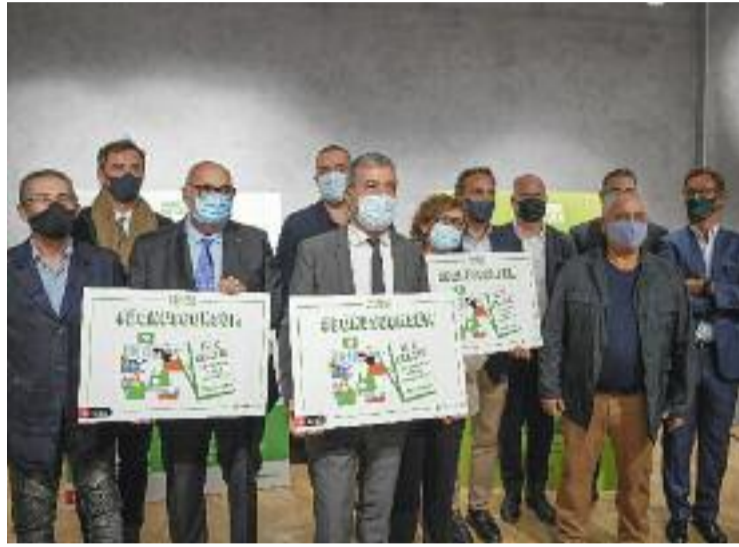
La campanya Bonus Consum es pot fer servir al BCNMarket.

Així doncs, aquesta eina digital permetrà als comerços donar-se a conèixer i vendre online els seus productes i serveis. "BCNmarket és tot allò que el comerç de proximitat havia re-