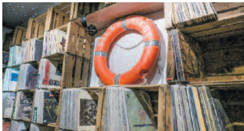
Salvadiscons és al barri barceloní del Poble-sec.

Salvadiscons, amb més d'11.000 socis, és, per tot plegat, un punt de trobada per a amants de la música.