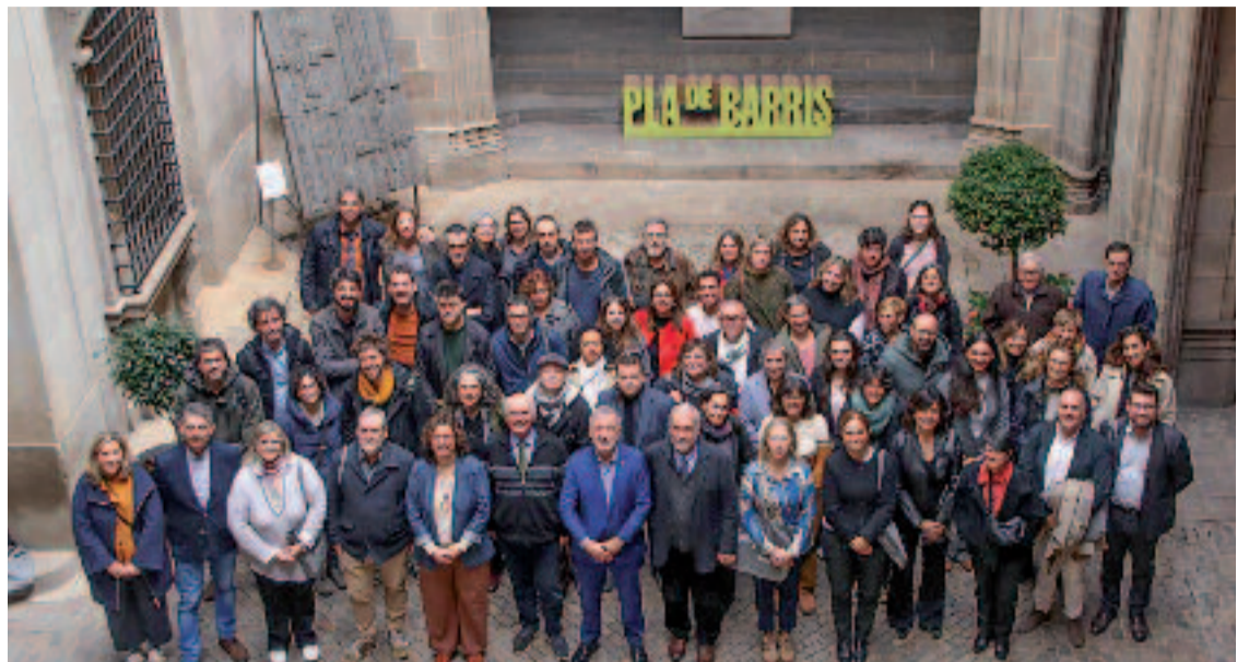
Imatge grupal de la presentació del Pla de Barris.

Pel que fa a jardins i zones verdes, l'Ajuntament també millorarà els jardins de l'Amistat, al