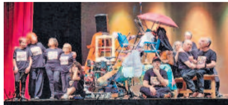
L'obra es va fer el passat 29 de març.

TEATRE ▶ La història dels barris de Torre Baró, Vallbona i Ciutat Meridiana dels anys seixanta als noranta s'ha convertit en una obra de teatre. Es va estrenar el 29 de març al Centre Cívic Zona Nord, amb el nom Bienvenidos a Barcelona a 15 minutos , protagonitzada per veïns del districte amants de les arts escèniques.