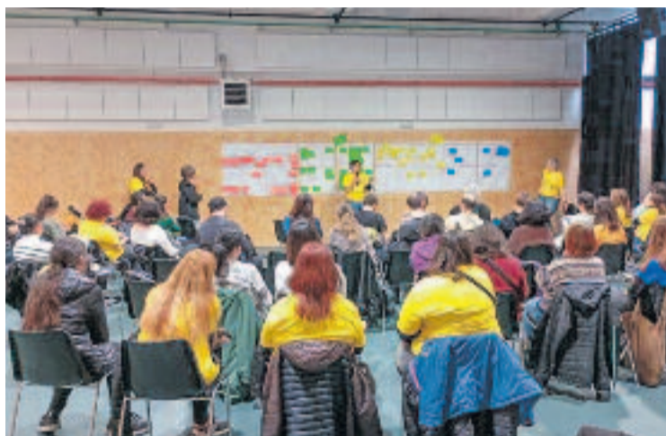
La jornada va aplegar desenes d'AFA del districte.

La plataforma també reclama "més inversió i més especialització" en les seves escoles públiques. "Volem aspirar a un